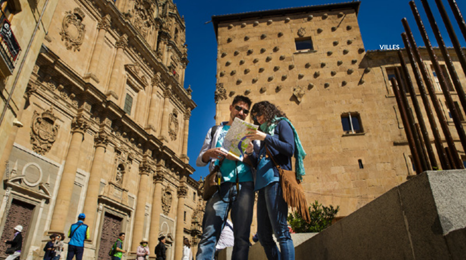
▲ CASA DE LAS CONCHAS