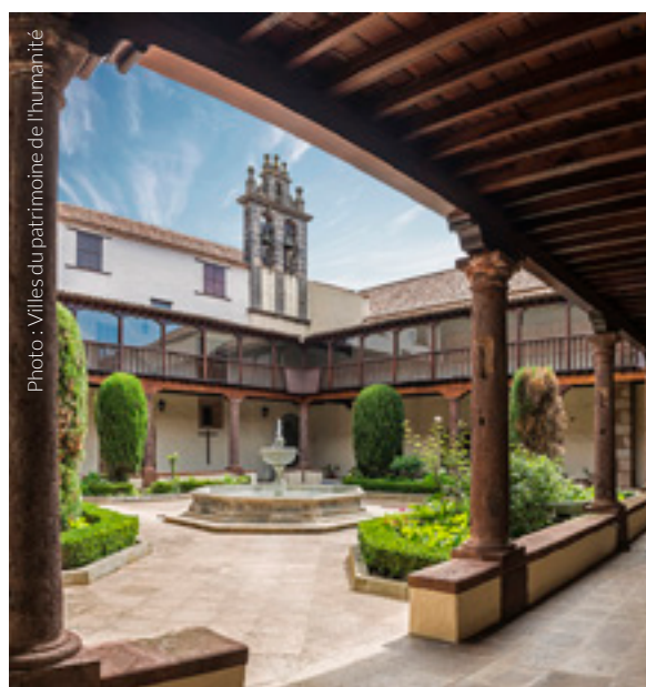
▲ MAISON DE SALAZAR

Votre parcours vous mènera devant de petits palais et des demeures seigneuriales, aux façades ornées de couleurs intenses et aux portiques en pierres.