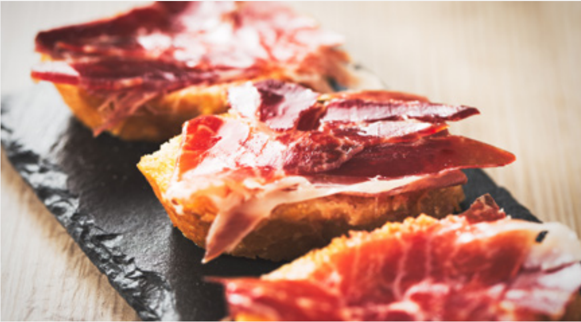
▲ JAMBON IBÉRIQUE

Les légumes font partie intégrante du régime méditerranéen. Les haricots avec appellation contrôlée d'Ávila, les lentilles d'Armuña, à Salamanque, et les pois chiches que l'on prépare différemment à travers toute la péninsule méritent une mention toute particulière. Vous pourrez les goûter dans le célèbre cocido madrileño (pot-au-feu) à Alcalá de Henares ou dans une casserole avec des haricots et des pois chiches cuits de Baeza.