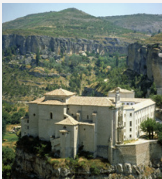
▲ PARADOR DE CUENCA

L'hôtel est un ancien couvent situé sur un site privilégié dans les gorges de la rivière Huécar, avec des vues sur les incroyables maisons suspendues. Vous allez adorer le cloître vitré et l'ancienne chapelle, aujourd'hui transformée en cafétéria accueillante. Il se distingue également par sa piscine et le fabuleux panorama de la ville dont on peut profiter depuis les chambres supérieures.