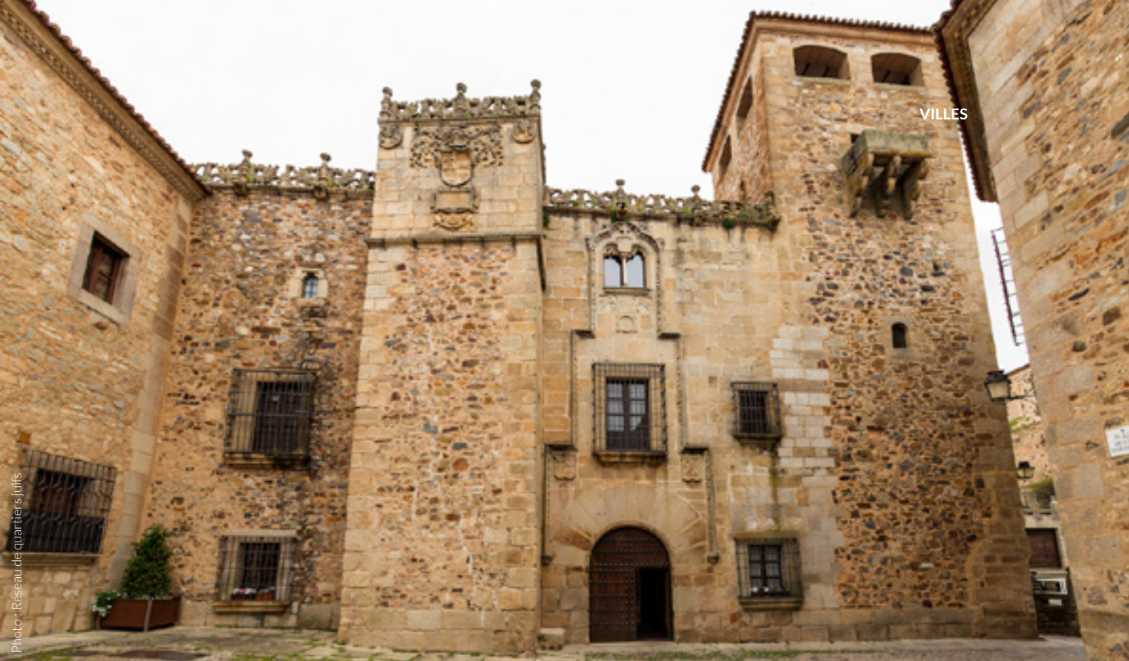
▲ PALAIS DES GOLFINES DE ABAJO

La place Santa María , entourée de palais, est présidée par la cocathédrale Santa María de style gothique, construite au XVe siècle et qui abrite un magnifique retable de style plateresque. Autour de cette place, vous pourrez découvrir notamment le palais de Mayoralgo , l'un des plus grands de la ville, et le palais de Carvajal . Admirez son balcon en angle typique et visitez sa charmante cour où s'élève un vénérable figuier de plus de 400 ans.