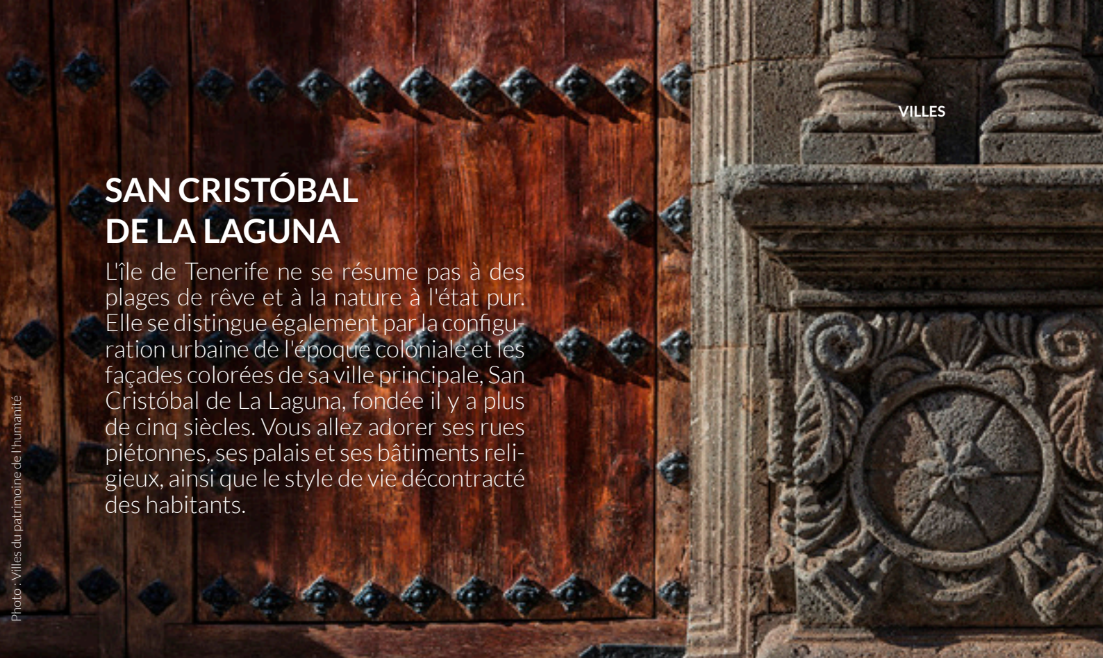
▲ SAN CRISTÓBAL DE LA LAGUNA