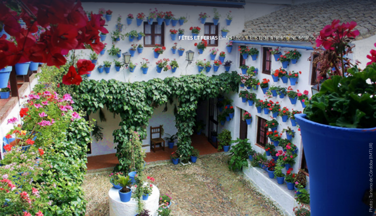
▲ FESTIVAL DES PATIOS DE CORDOUE

se distingue par les Entroidos dos Xenerais , une tradition selon laquelle plusieurs habitants de la ville revêtent leurs plus beaux atours et parcourent les paroisses à cheval, accompagnés d'une armée de porte-étendards, de chœurs et de groupes de musiciens.