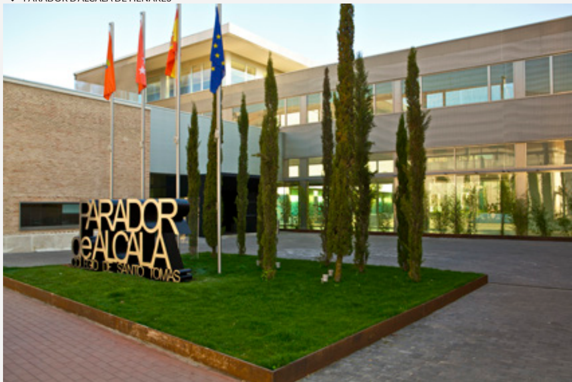
▼ PARADOR D'ALCALÁ DE HENARES

Le palais Piedras Albas, Parador de Ávila, est adossé à l'une des murailles les mieux conservées au monde, à proximité des lieux emblématiques de cette cité médiévale. Les chambres sont spacieuses, parfaites pour se reposer, avec une décoration intimiste et accueillante. La salle à manger offre de magnifiques vues sur le jardin et la muraille à travers une cour vitrée.