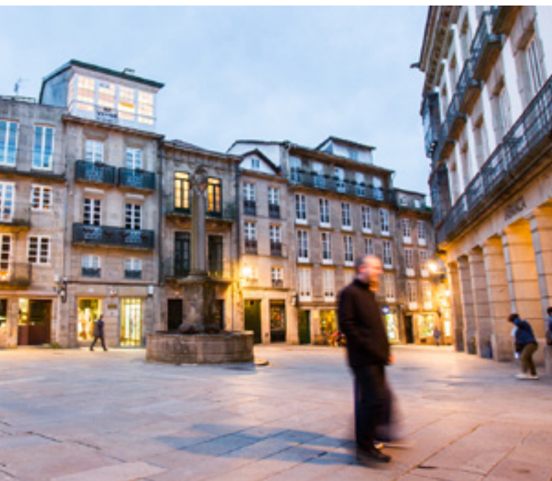
▲ PLACE CERVANTES

Pendant l'après-midi, visitez le musée do Pobo Galego , où se trouve condensée l'ethnographie galicienne, avec une section spécifique consacrée aux découvertes archéologiques de la région. Le Centre galicien d'art contemporain se trouve à deux pas de là. Il se distingue tant par son contenu que par son architecture que l'on doit à l'architecte portugais Álvaro Siza.