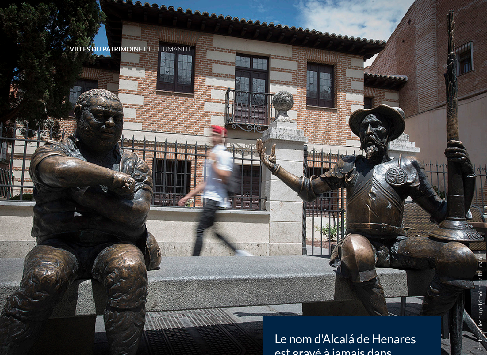
▲ MONUMENT À DON QUICHOTTE ET SANCHO PANZA

Le nom d'Alcalá de Henares est gravé à jamais dans l'histoire de la littérature universelle. C'est ici qu'est né et à passé son enfance Miguel de Cervantès, l'illustre auteur du Quichotte.