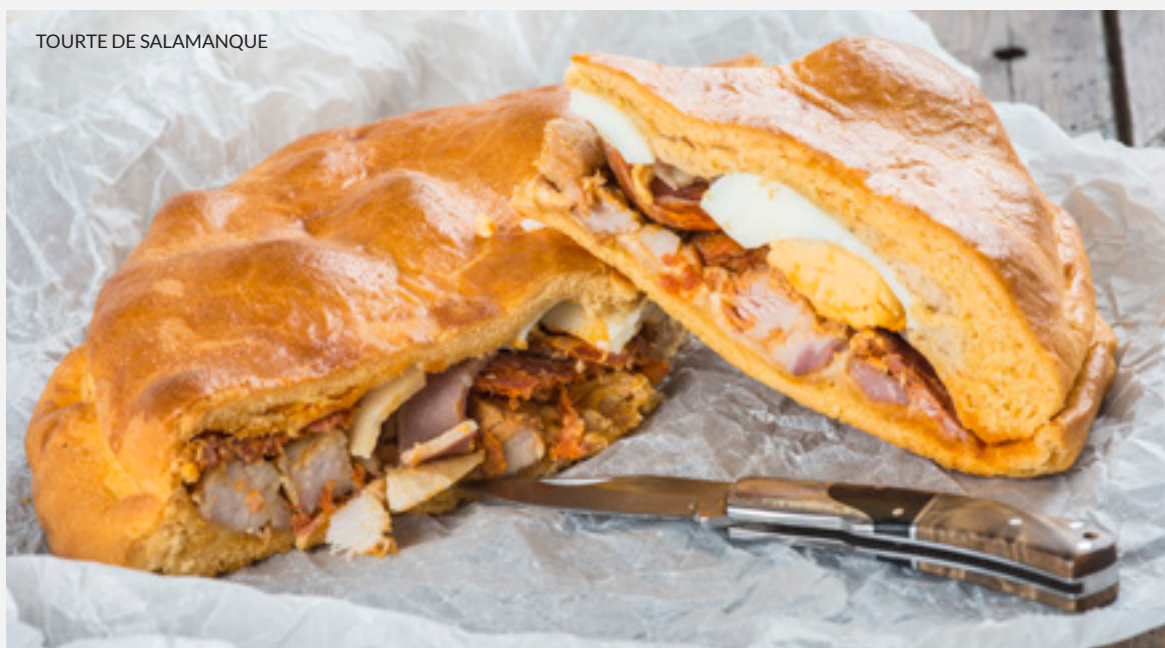
TOURTE DE SALAMANQUE

Ne quittez pas San Cristóbal de la Laguna sans avoir goûté les bananes des Canaries et l'immense variété de fruits tropicaux des îles.