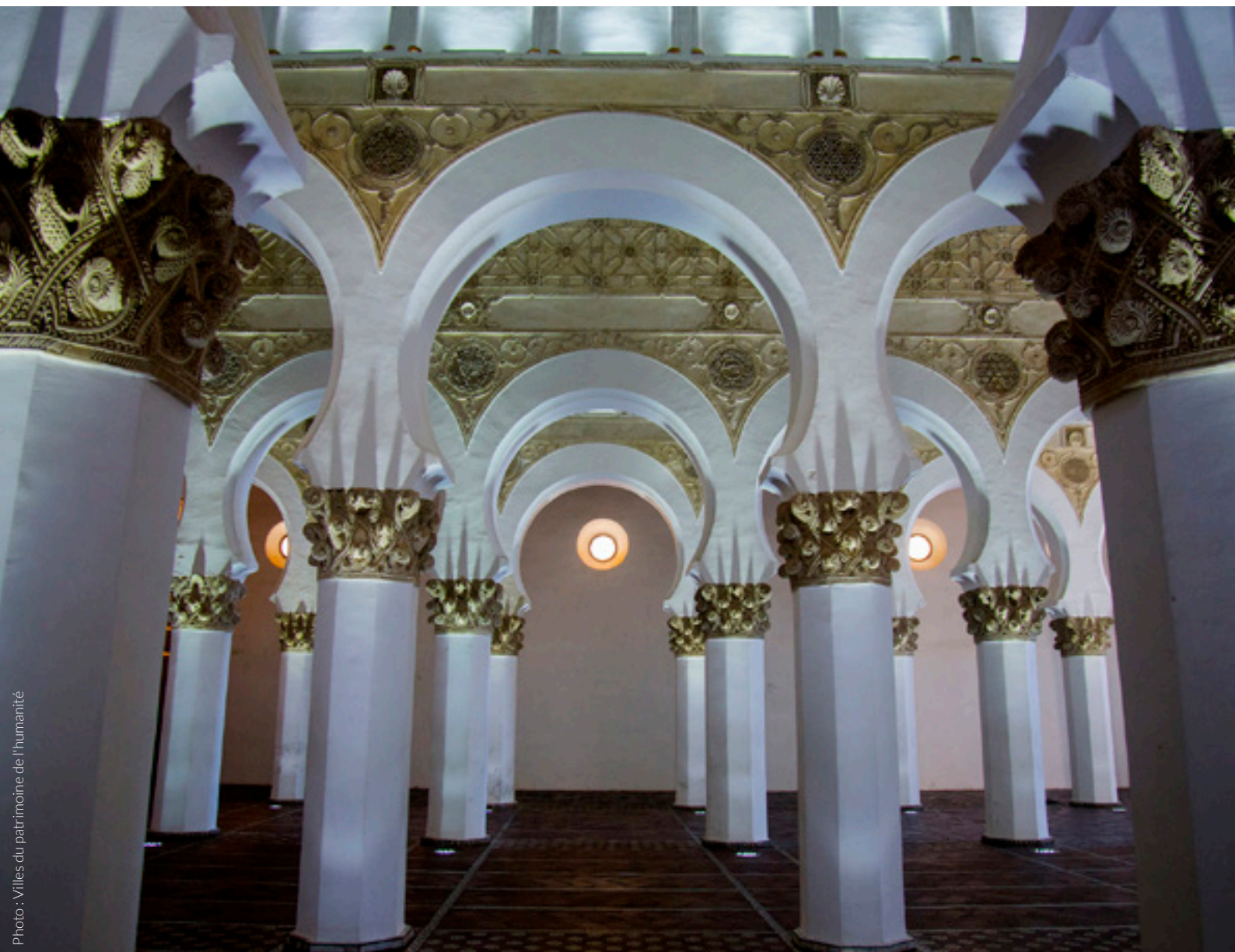
▲ SYNAGOGUE SANTA MARÍA LA BLANCA

Le principal monument de l'héritage catholique est la cathédrale Santa María de Toledo , de style gothique. Examinez bien le portail de sa façade principale qui comprend trois portes : celle de l'Enfer, celle du Pardon et celle du Jugement. La cathédrale abrite un grand trésor : l'ostensoir de procession de Juan de Arfe, l'élément principal de la procession traditionnelle du Corpus Christi.