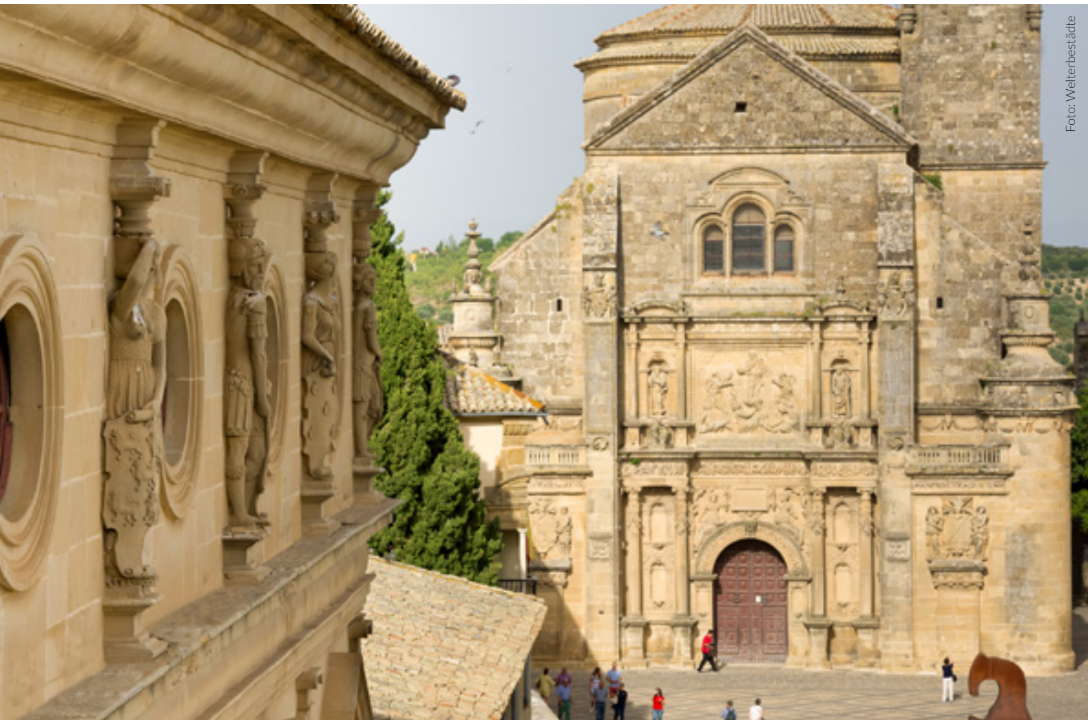
▲ PLAZA VÁZQUEZ DE MOLINA

In der Nähe dieses Platzes haben Sie vom Aussichtspunkt San Lorenzo aus einen spektakulären Blick auf die Olivenhaine und die Sierra Mágina.