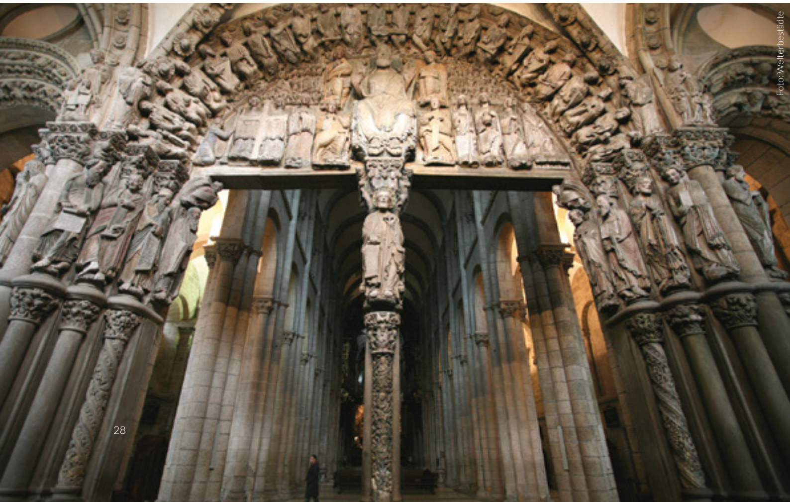
▼ PORTIKUS DER HERRLICHKEIT

① Weitere Informationen auf: www.santiagoturismo.com