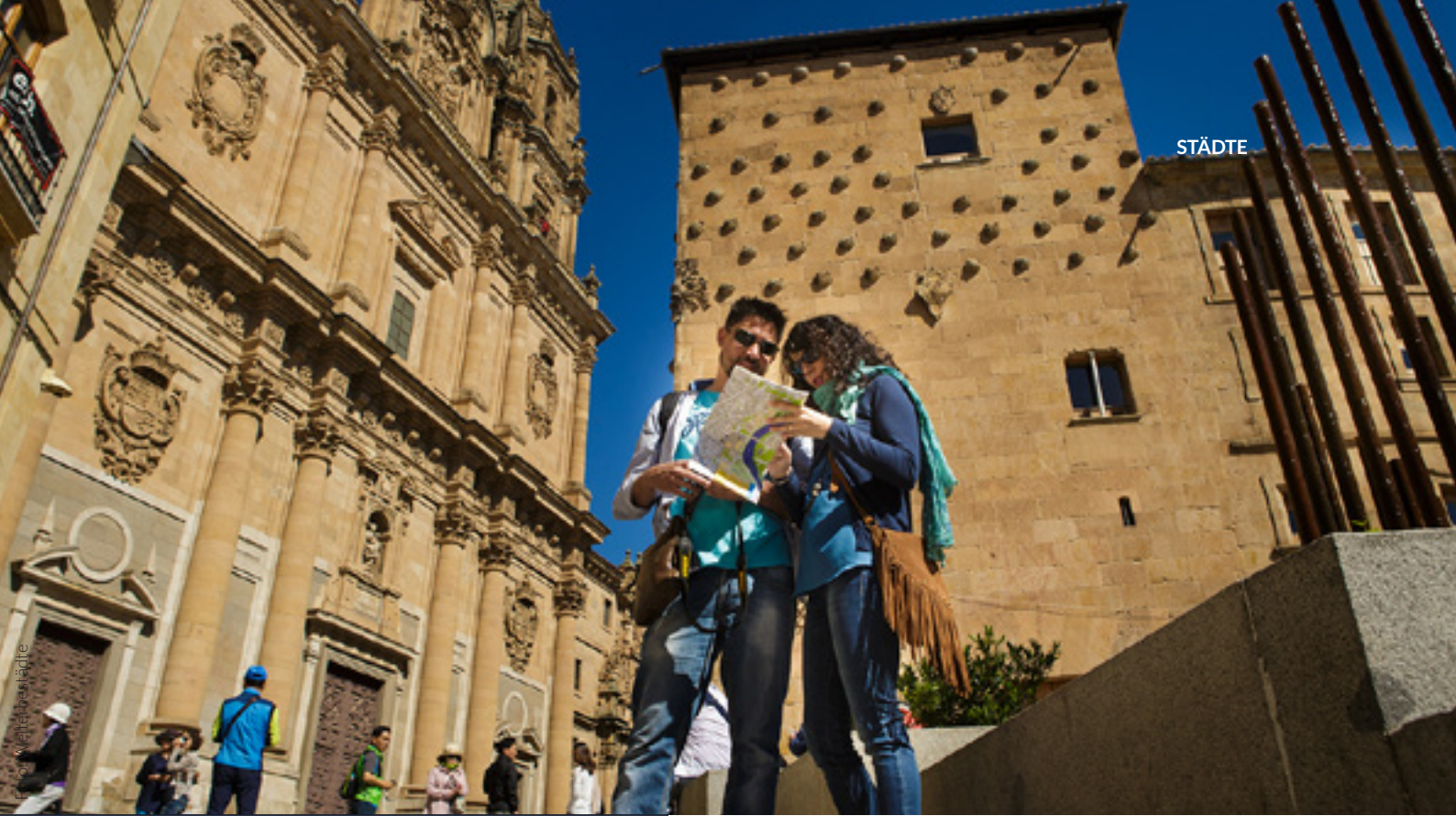
▲ GEBÄUDE „CASA DE LAS CONCHAS“