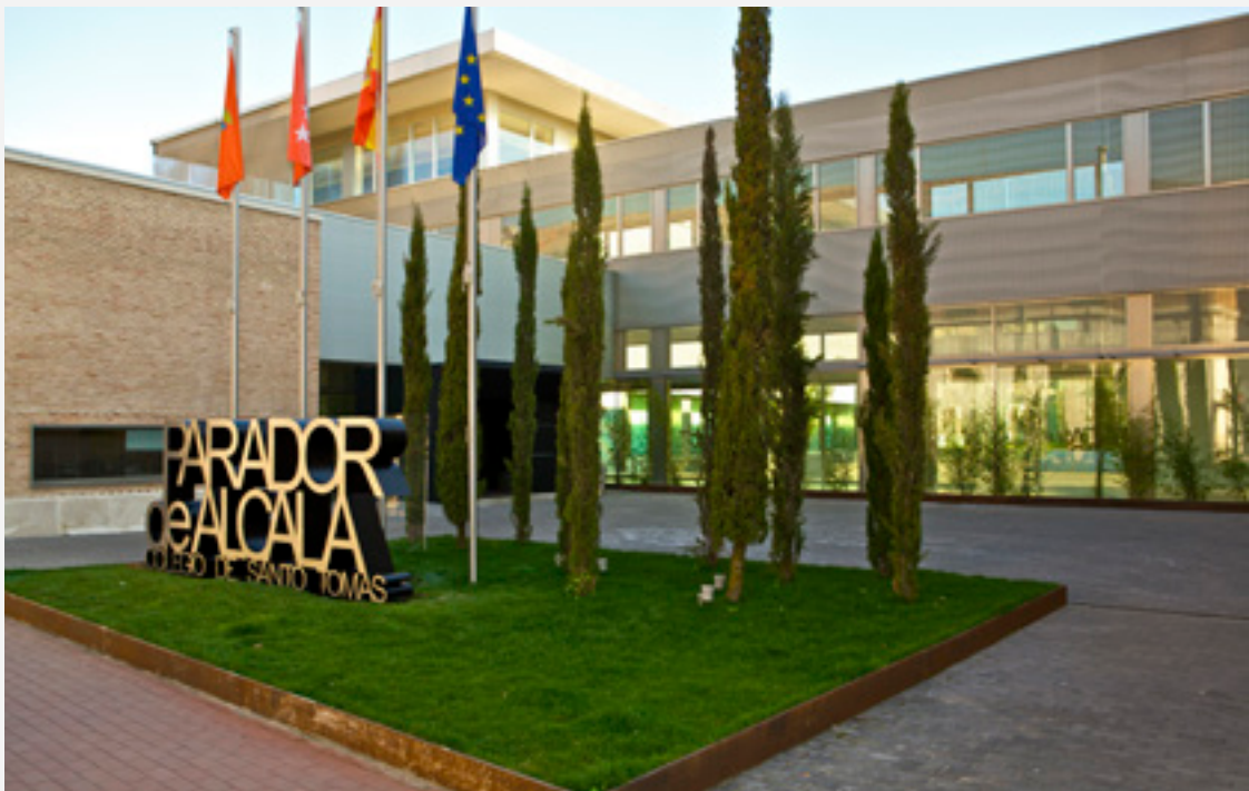
▼ PARADOR-HOTEL VON ALCALÁ DE HENARES

Der Palast Piedras Albas, das Parador-Hotel von Ávila, liegt direkt an einer der am besten erhaltenen Stadtmauern der Welt in der Nähe der repräsentativsten Orte dieser mittelalterlichen Stadt. Die intim und gemütlich dekorierten Zimmer sind geräumig, einfach perfekt zum Entspannen. Der Speisesaal bietet durch einen verglasten Innenhof einen schönen Blick auf den Garten und die Stadtmauer.