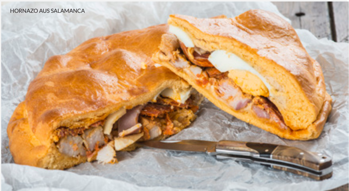
HORNAZO AUS SALAMANCA

Und verlassen Sie San Cristobal de la Laguna nicht, ohne die Bananen der Kanaren und die enorme Vielfalt an tropischen Früchten von den Inseln probiert zu haben.