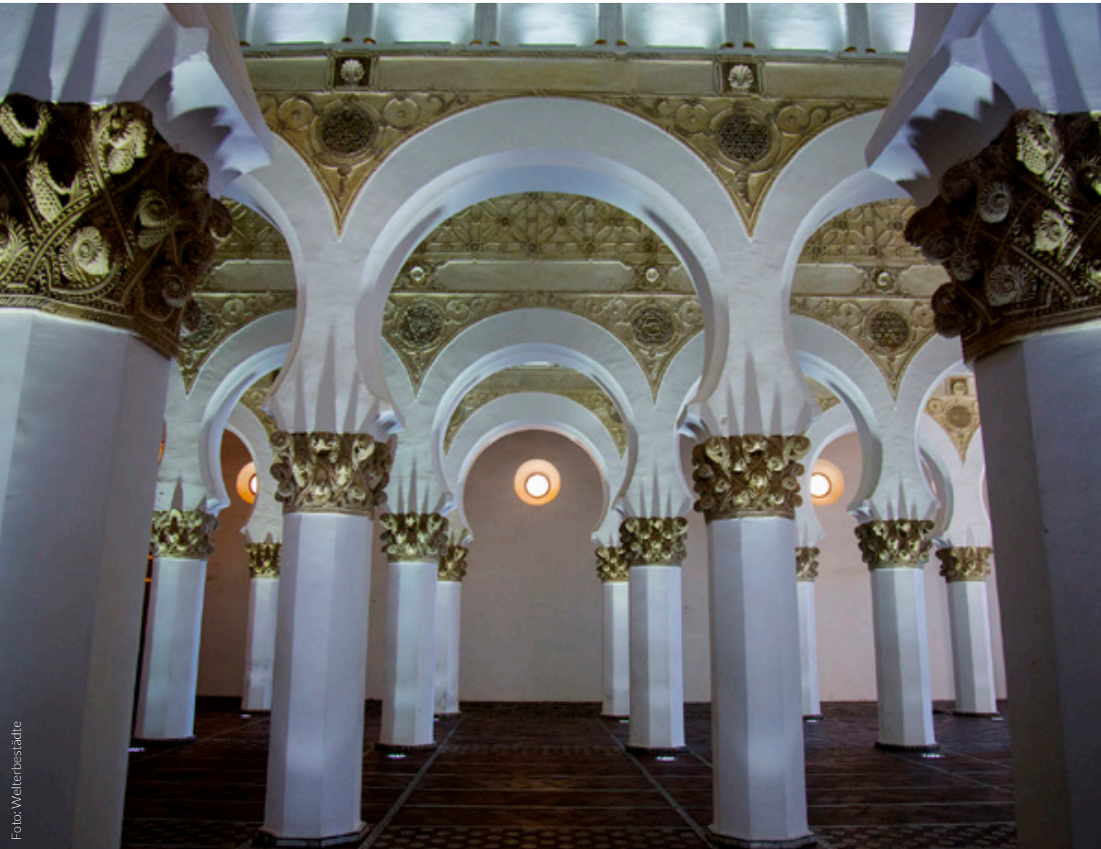
▲ SYNAGOGUE SANTA MARÍA LA BLANCA

Das katholische Erbe hat seinen höchsten Ausdruck in der gotischen Kathedrale Santa María de Toledo . Sehen Sie sich das Portal der Hauptfassade an, das drei Türen hat: das Tor der Hölle, das Tor der Vergebung und das Tor des Gerichts. Das Innere der Kathedrale birgt einen Schatz, die Prozessionskustodie von Arfe, die im Mittelpunkt der traditionellen Fronleichnamsprozessionen steht.