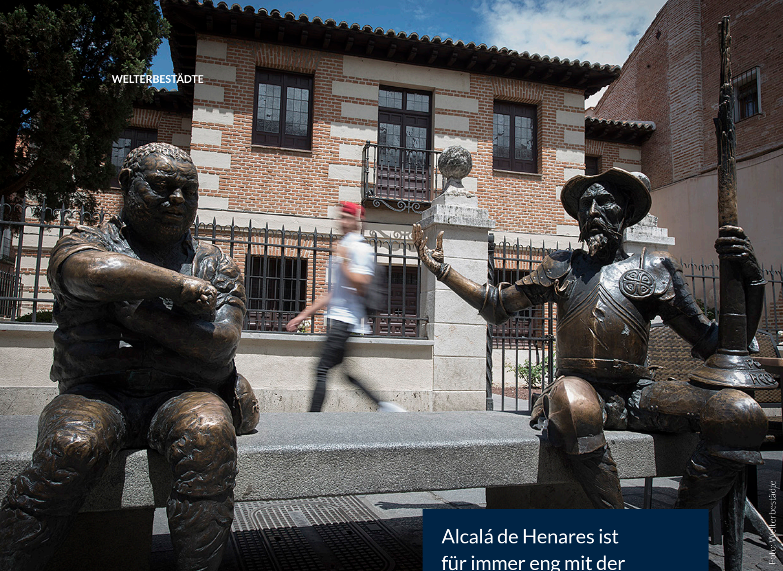
▲ DENKMAL DON QUIJOTE UND SANCHO PANZA

In der Nähe befindet sich das Nebenkolleg San Jerónimo , in dessen sogenanntem „Patio Trilingüe“ Latein, Griechisch und Hebräisch gelehrt wurden. In dem Restaurant Hostería del Estudiante , das der Hotelkette Paradores angegliedert ist, können Sie eine kleine Pause einlegen. Hervorragende kastilische Regionalküche ist dort garantiert.