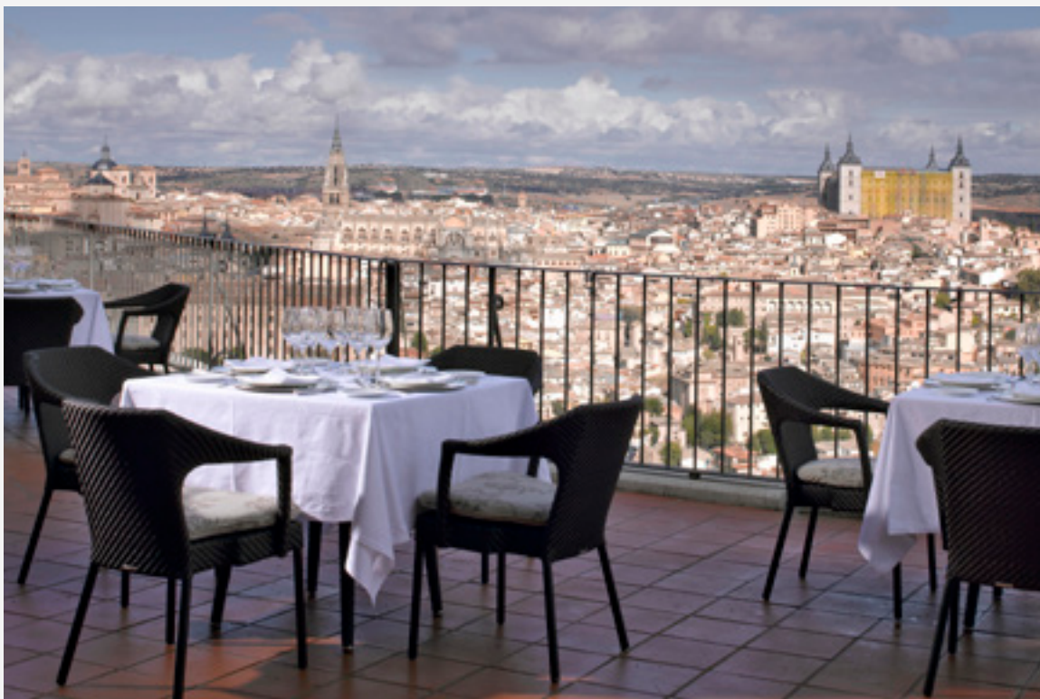
▲ PARADOR-HOTEL VON TOLEDO