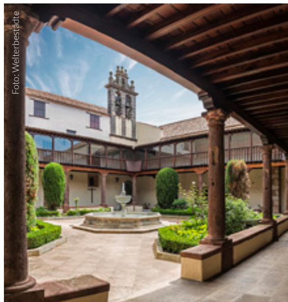
▲ CASA DE SALAZAR

Ihr Rundgang führt entlang an zahlreichen Palais und Herrenhäusern mit Steinportalen und in kräftigen Farben gestrichenen Fassaden. Eines der am