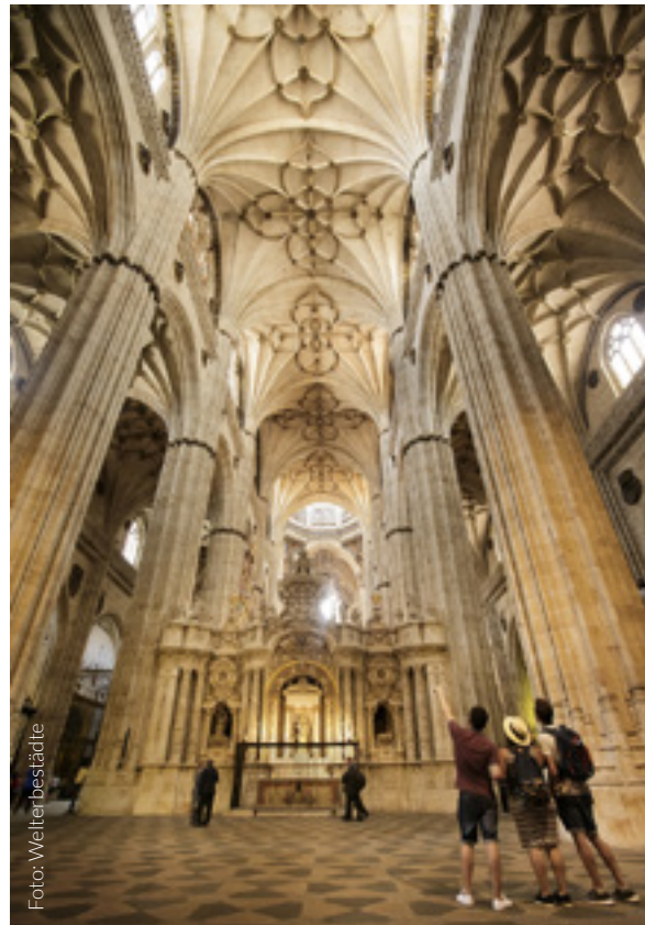
▼ KATHEDRALE VON SALAMANCA

Für einen Besuch in Salamanca gibt es eine Route, die an alle Arten von Einschränkungen angepasst ist. Sie beginnt auf der Plaza Mayor und führt durch den Bogen zur Plaza del Corriollo. Weiter geht es auf der Fußgängerstraße Rúa Mayor bis zur Straße Cardenal Playa Deniel. Linker Hand befindet sich der Eingang zur Kathedrale und rechter Hand der Eingang zur Universität von Salamanca. Folgen Sie der Calle Libreros bis zur Plaza de San Isidro. So gelangen Sie ganz in die Nähe der berühmten Casa