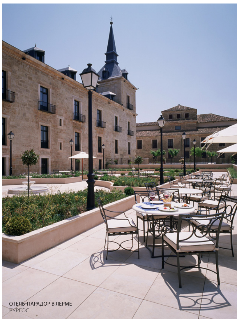
ОТЕЛЬ-ПАРАДОР В ЛЕРМЕ БУРГОС

В Испании можно сочетать отличные вина с работой, удовольствиями и развлечениями в винодельнях с историческими погребами, где вина производятся традиционными способами. А можно использовать оборудованные всем необходимым залы в авангардных зданиях виноделен, спроектированных лучшими архитекторами мира. Эти соблазнительные контрасты позволяют проводить уникальные мероприятия на винодельнях и виноградниках.