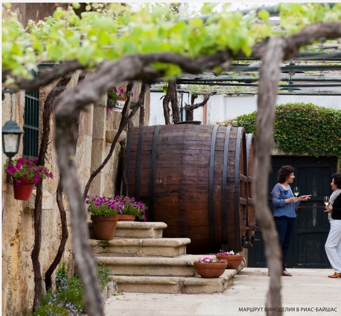
МАРШРУТ ВИНОДЕЛИЯ В РИАС-БАЙШАС