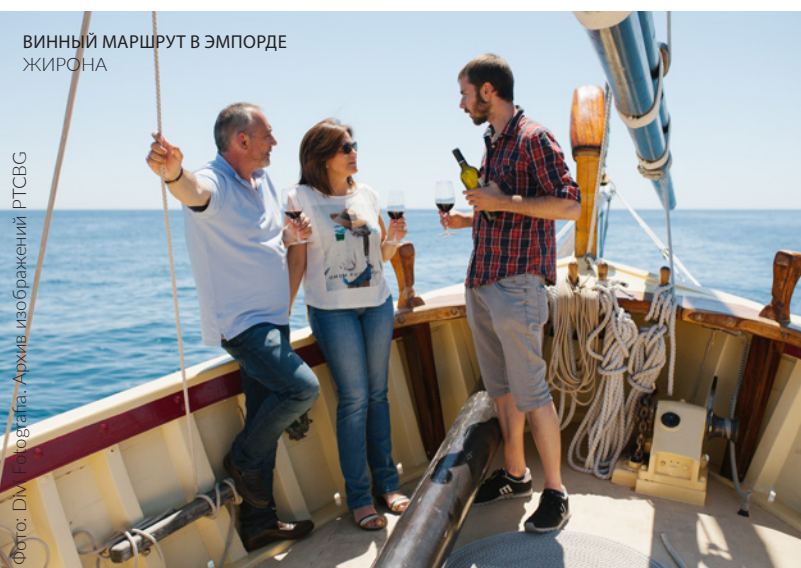
ВИННЫЙ МАРШРУТ В ЭМПОРДЕ ЖИРОНА