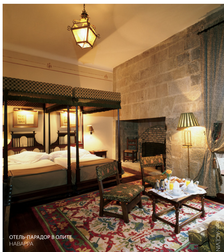
ОТЕЛЬ-ПАРАДОР В ОЛИТЕ НАВАРРА

Проведите незабываемые дни, восстанавливая силы в одном из отелей-парадоров Испании. Превосходное гастрономическое предложение и разнообразие услуг являются залогом качества и комфорта. Некоторые из парадоров находятся на винных маршрутах Иберийского полуострова. В Риохе можно остановиться в парадоре в Олите , который размещается в монументальном средневековом дворце. Если вы отправляетесь в Рибера-дель-Дуэро, воспользуйтесь случаем и проведите пару ночей в парадоре в Лерме . Современный парадор в Кадисе идеален для знакомства с маршрутом бренди и хереса, а его уникальный бассейн и инфраструктура — это настоящий сон наяву.