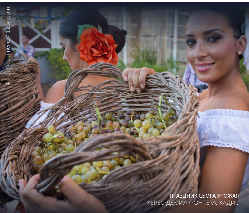
ПРАЗДНИК СБОРА УРОЖАЯ ХЕРЕС-ДЕ-ЛА-ФРОНТЕРА, КАДИС