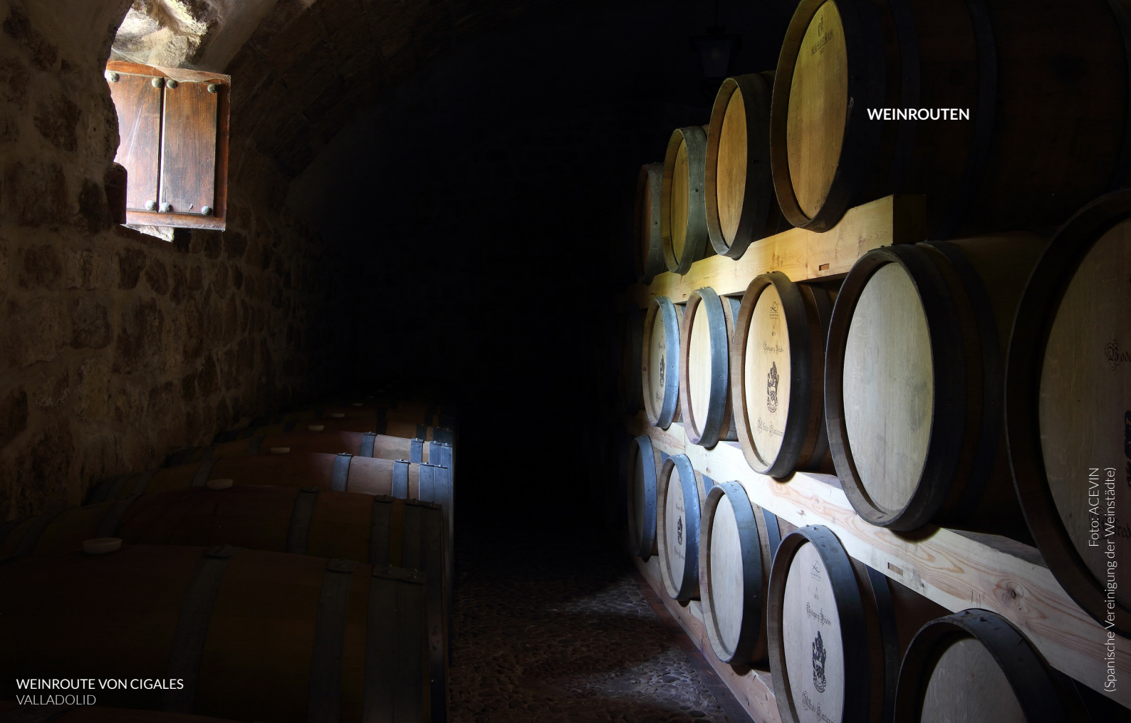
WEINROUTE VON CIGALES VALLADOLID