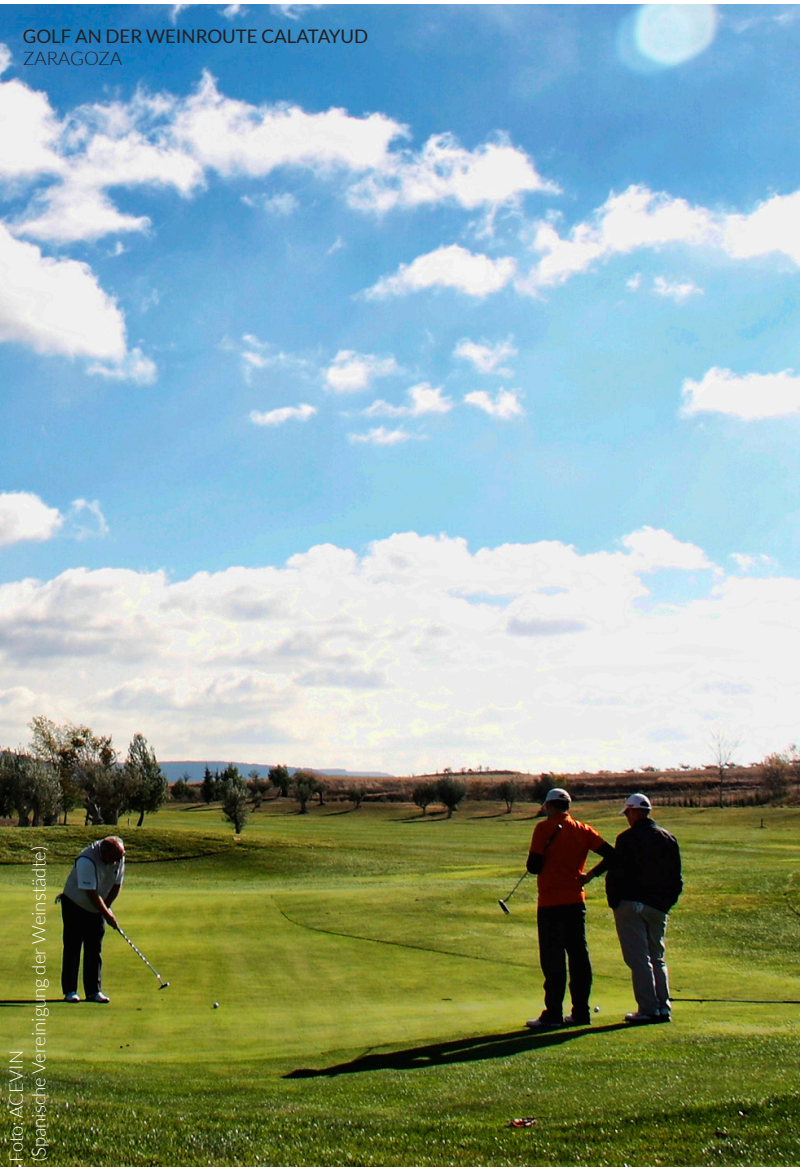
GOLF AN DER WEINROUTE CALATAYUD ZARAGOZA