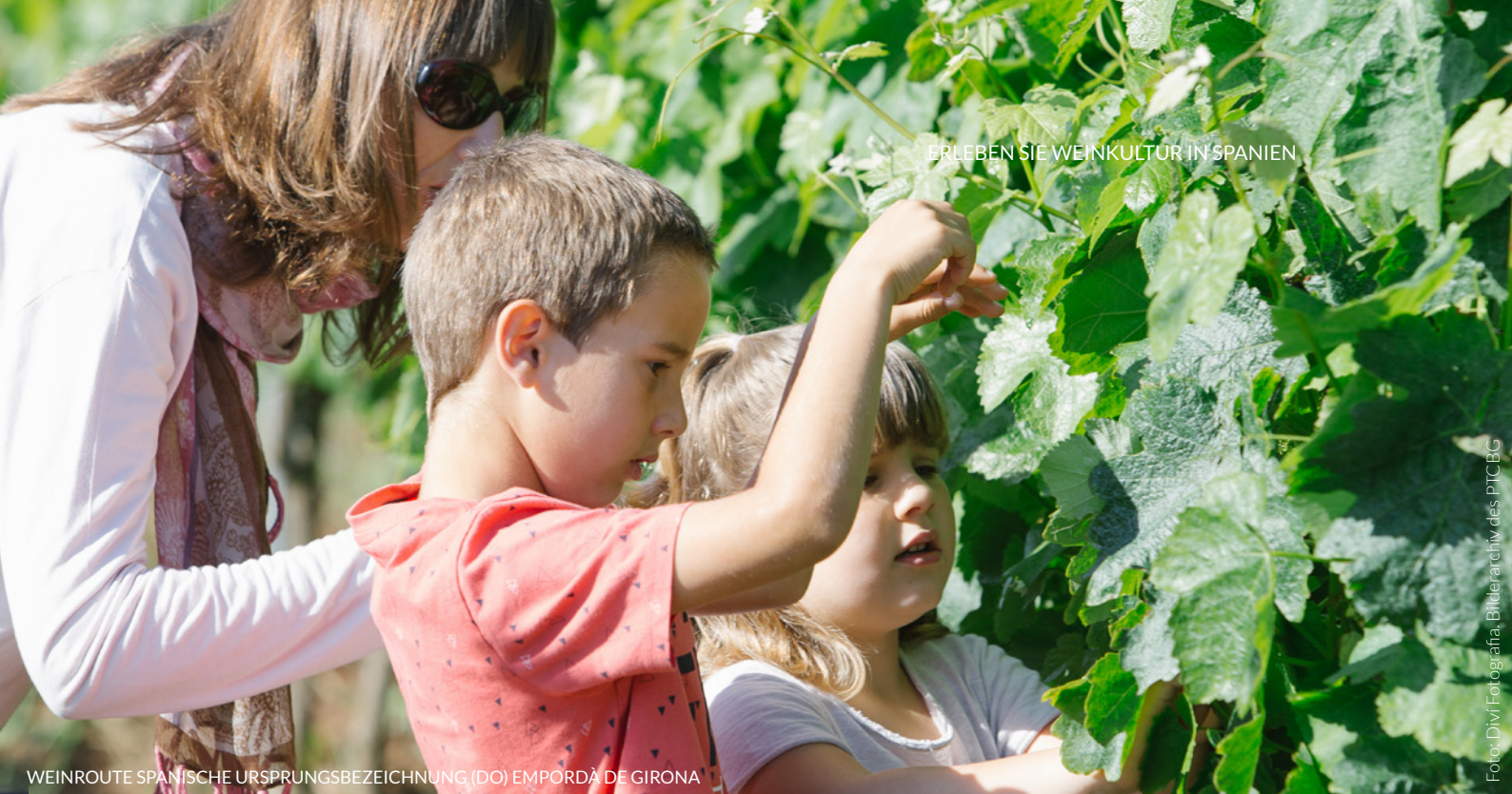
WEINROUTE SPANISCHE URSPRUNGSBEZEICHNUNG (DO) EMPORDÀ DE GIRONA