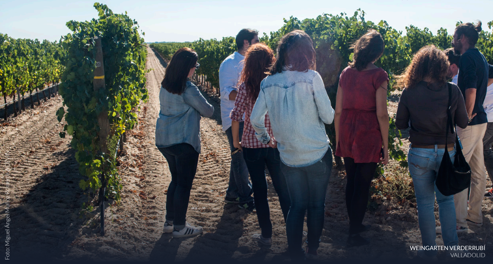
WEINGARTEN VERDERRUBÍ VALLADOLID