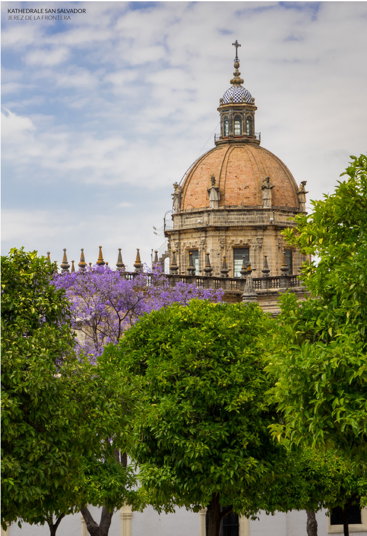
KATHEDRALE SAN SALVADOR JEREZ DE LA FRONTERA