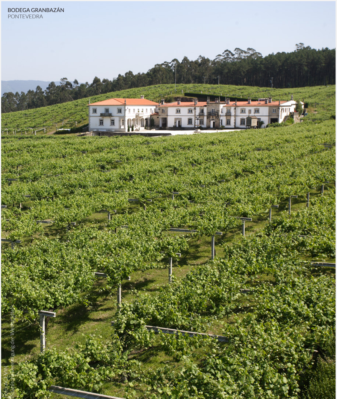
BODEGA GRANBAZÁN PONTEVEDRA