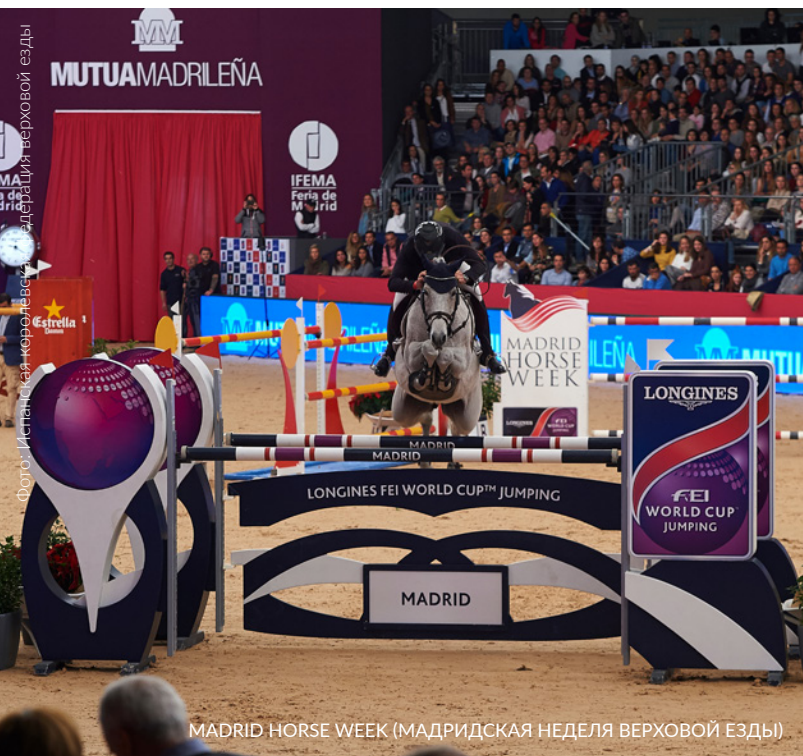
MADRID HORSE WEEK (МАДРИДСКАЯ НЕДЕЛЯ ВЕРХОВОЙ ЕЗДЫ)