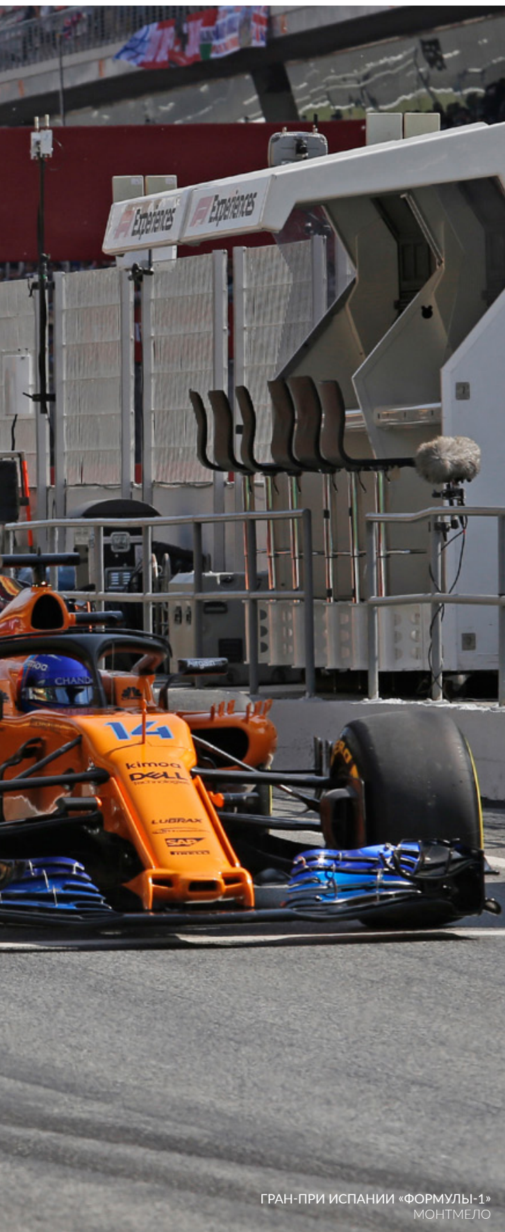
ГРАН-ПРИ ИСПАНИИ «ФОРМУЛА-1» МОНТМЕЛО