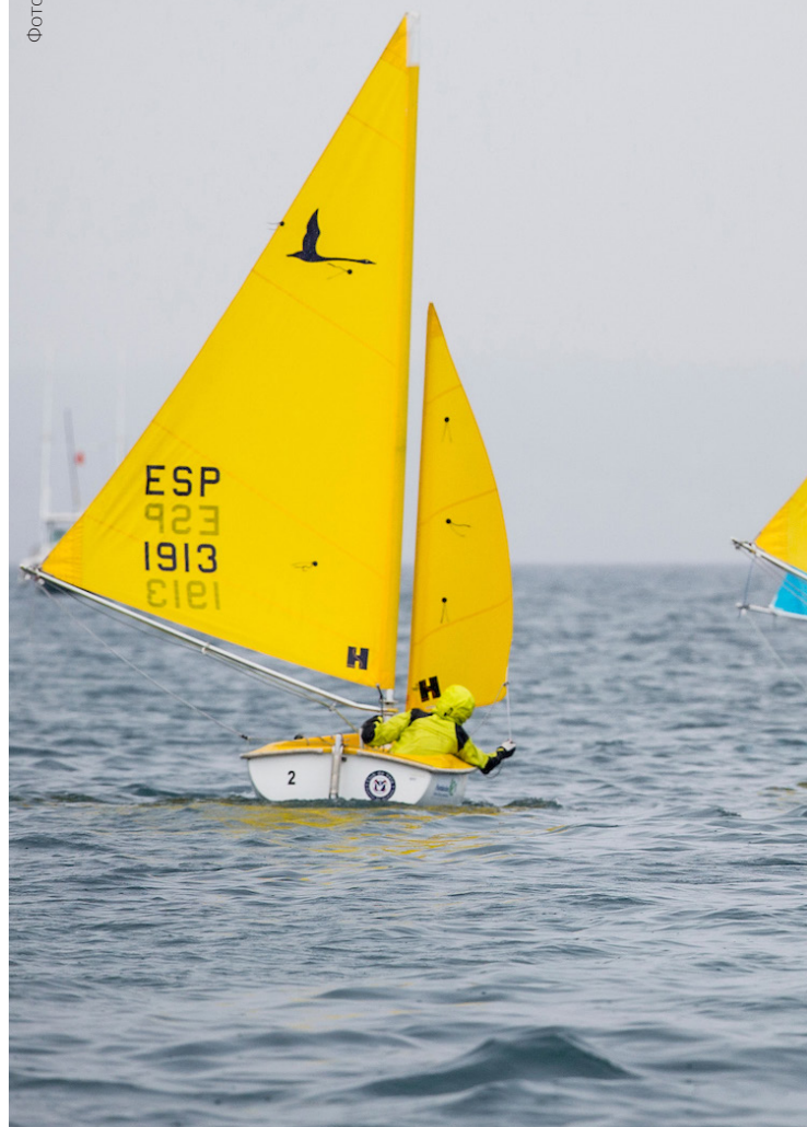
▲ РЕГАТА PALMAVELA БАЛЕАРСКИЕ ОСТРОВА

Королевский клуб парусного спорта Пальма-де-Майорка является главным штабом соревнований, основной притягательной особенностью которых являются крупные яхты. При этом в соревнованиях участвуют и легкие суда из углепластика, впечатляющие классические парусники и маневренные яхты класса «Финн». Также здесь можно увидеть захватывающие гонки в режиме реального времени.