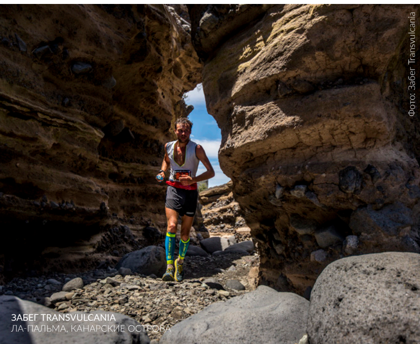
Фото: Забег Transvulcania