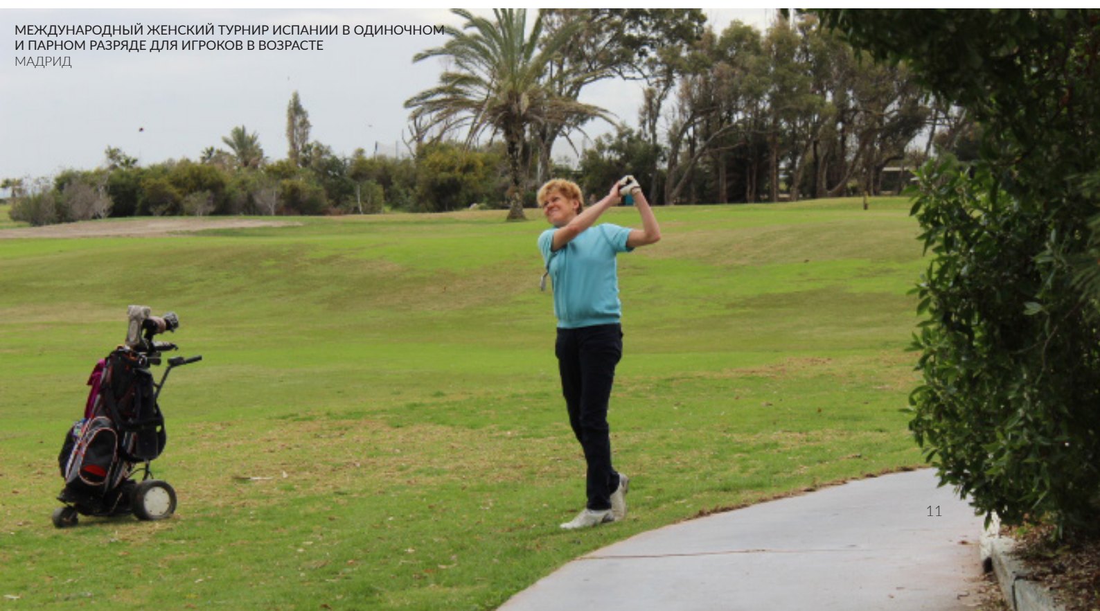
МЕЖДУНАРОДНЫЙ ЖЕНСКИЙ ТУРНИР ИСПАНИИ В ОДИНОЧНОМ И ПАРНОМ РАЗЯДЕ ДЛЯ ИГРОКОВ В ВОЗРАСТЕ МАДРИД