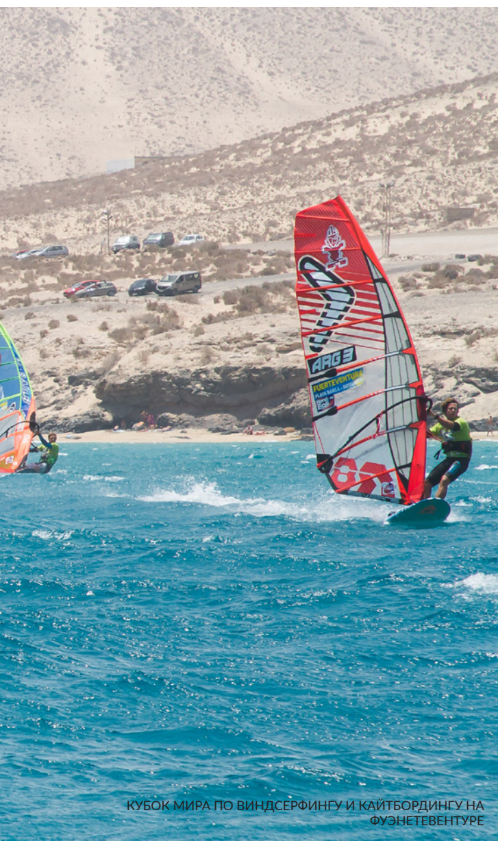
КУБОК МИРА ПО ВИНДСЕРФИНГУ И КАЙТБОРДИНГУ НА ФУЭНТЕВЕНТУРЕ