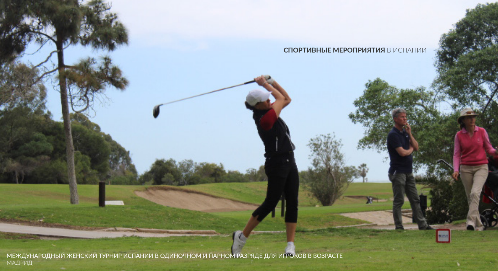
МЕЖДУНАРОДНЫЙ ЖЕНСКИЙ ТУРНИР ИСПАНИИ В ОДИНОЧНОМ И ПАРНОМ РАЗЯДЕ ДЛЯ ИГРОКОВ В ВОЗРАСТЕ МАДРИД