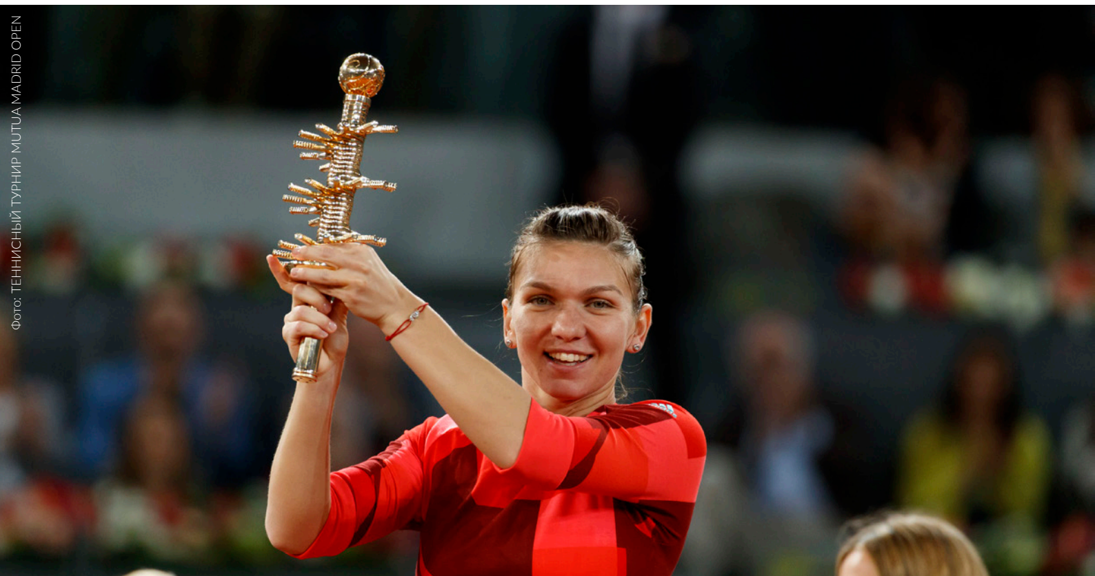
▲ ТЕННИСНЫЙ ТУРНИР MUTUA MADRID OPEN

Если вы хотите посмотреть матч с необычной точки, будто с высоты птичьего полета, отправьте на площадку Tennis Garden, которая возвышается над кортами и позволяет по-новому наблюдать за игроками.