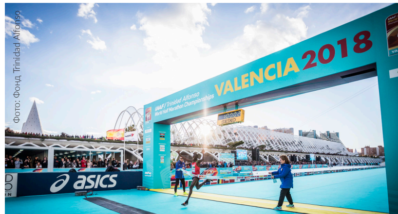
▲ ЧЕМПИОНАТ МИРА ПО ПОЛУМАРАФОНУ IAAF 2018 Г. ВАЛЕНСИЯ

Хотите совершить забег в приятном климате, рядом с морем и под взглядами воодушевленных зрителей? В Валенсии маршрут проходит по абсолютно ровной местности рядом с авангардным Городом искусств и наук при температуре от 16 до 22 градусов, и при этом может похвастаться прекрасной организацией. Поэтому Международная ассоциация легкоатлетических федераций (IAAF) присвоила Валенсийскому марафону знак отличия Gold Label в двух дисциплинах — марафон и полумарафон. Впечатляющая финишная часть находится на площадке над водой рядом с зеленой зоной Umbracle и музеем имени принца Филиппа.