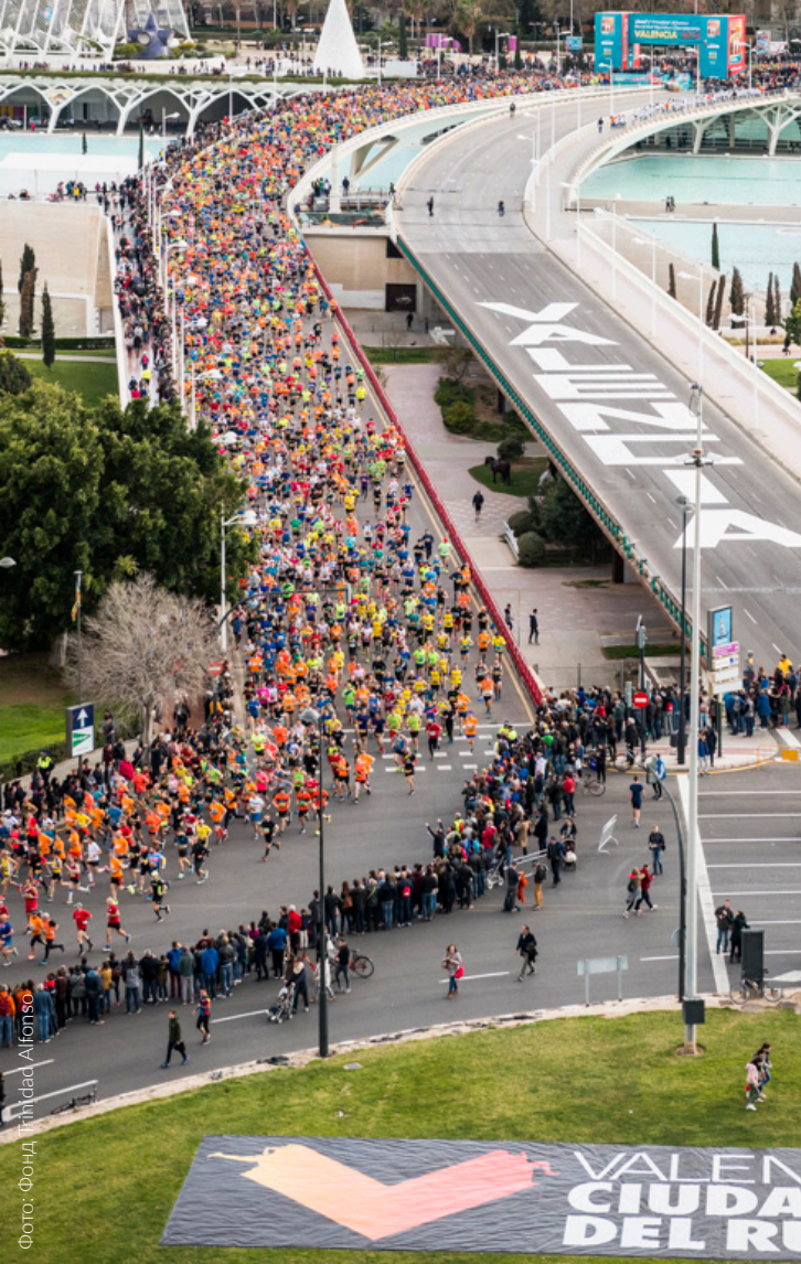
▲ ЧЕМПИОНАТ МИРА ПО ПОЛУМАРАФОНУ IAAF 2018 Г. ВАЛЕНСИЯ