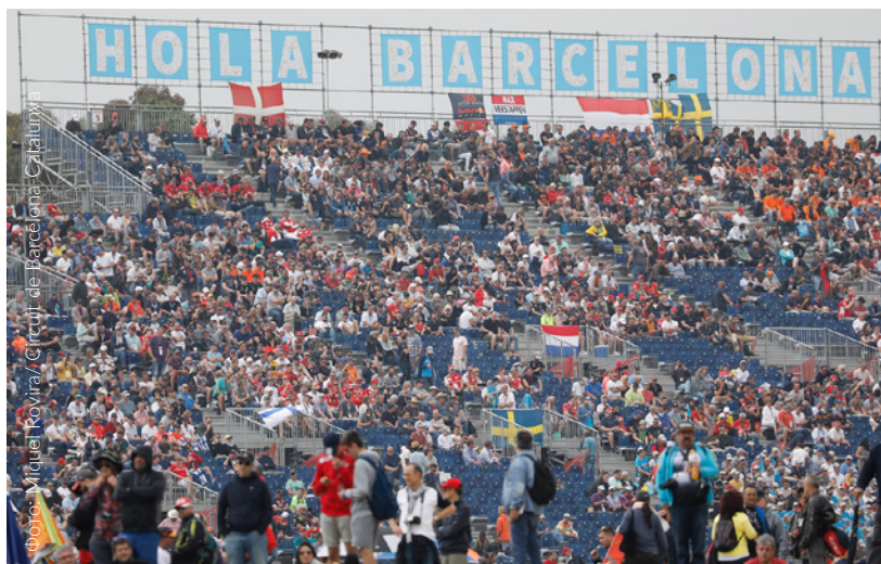
▲ ГРАН-ПРИ ИСПАНИИ «ФОРМУЛА-1» МОНТМЕЛО