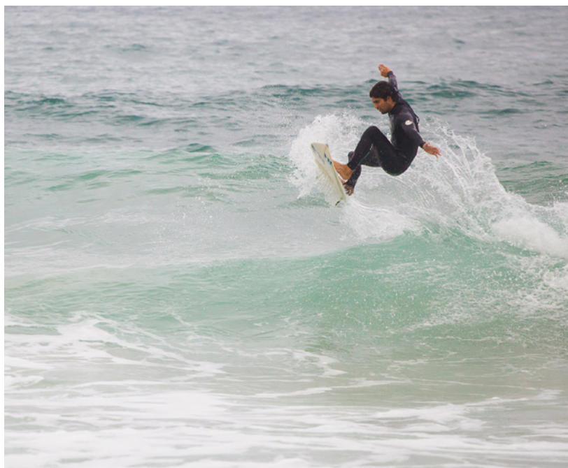
▲ КУБОК МИРА ПО ВИНДСЕРФИНГУ И КАЙТБОРДИНГУ НА ФУЭНТЕВЕНТУРЕ