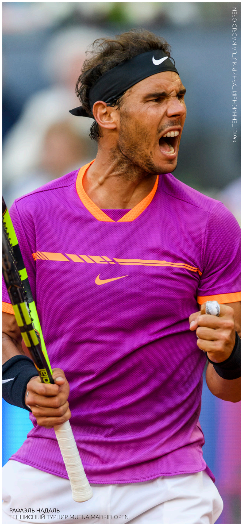
РАФАЭЛЬ НАДАЛЬ ТЕННИСНЫЙ ТУРНИР MUTUA MADRID OPEN

Помимо посещения торговой зоны, где представлены самые заметные испанские и зарубежные бренды, вы можете поучаствовать в турнире по виртуальному теннису, который из года в год привлекает все больше игроков. Одержав победу, вы получите честь лично познакомиться с обладателями кубка Madrid Open.