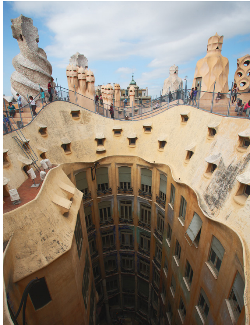
▼ LA PEDRERA-CASA MILÀ BARCELONA

Otros sitios que puedes descubrir siguiendo los pasos de los personajes de esta película son el parque de atracciones del Tibidabo y sus incomparables vistas de la ciudad, el ajetreo y los tradicionales puestos de flores de Las Ramblas o la encantadora plaza de San Felipe Neri . Además de en Barcelona, la película de Woody Allen también transcurre en Oviedo y Avilés (Asturias), dos ciudades de las que el genio neoyorquino se declara admirador.