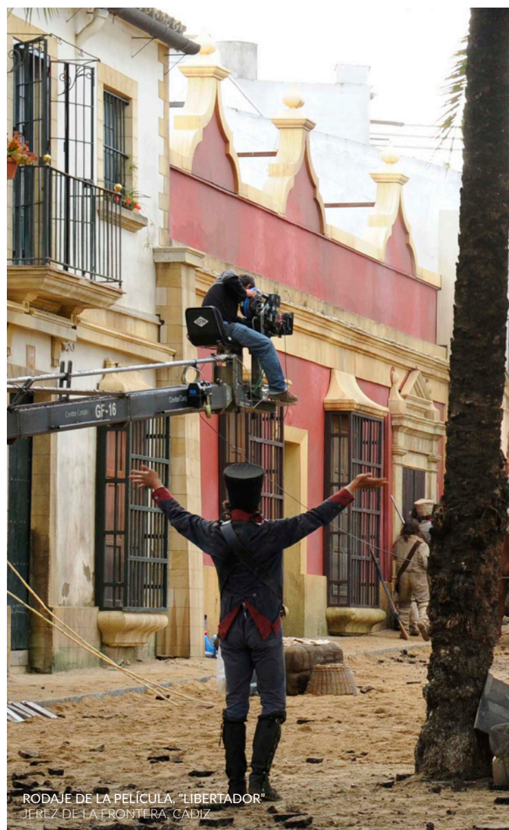
RODAJE DE LA PELÍCULA, “LIBERTADOR” JEREZ DE LA FRONTERA, CÁDIZ

Los intérpretes aparecen en el filme paseando por la calle Ancha , el centro neurálgico de la ciudad. Palacios señoriales como la Casa de los Cinco Gremios , iglesias como la de la Conversión de San Pablo y los balcones de los edificios son sus principales señas de identidad.