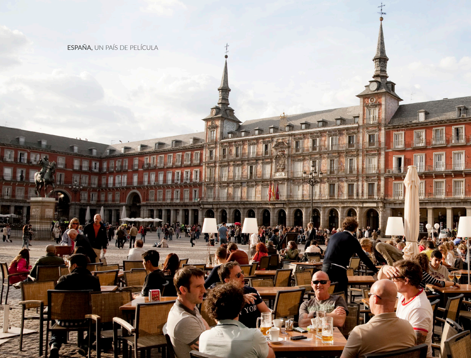
▲ PLAZA MAYOR MADRID

o cenar en locales llenos de originalidad y hacer tus compras más alternativas.