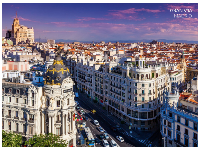
GRAN VÍA MADRID

lar del arquitecto Richard Rogers, y de varias secuencias aéreas en las que se ve el paseo de la Castellana , el eje empresarial de la ciudad, la localización madrileña que más sorprende de las que muestra la cinta protagonizada por Matt Damon es la estación de Atocha y el curioso jardín tropical de su interior.