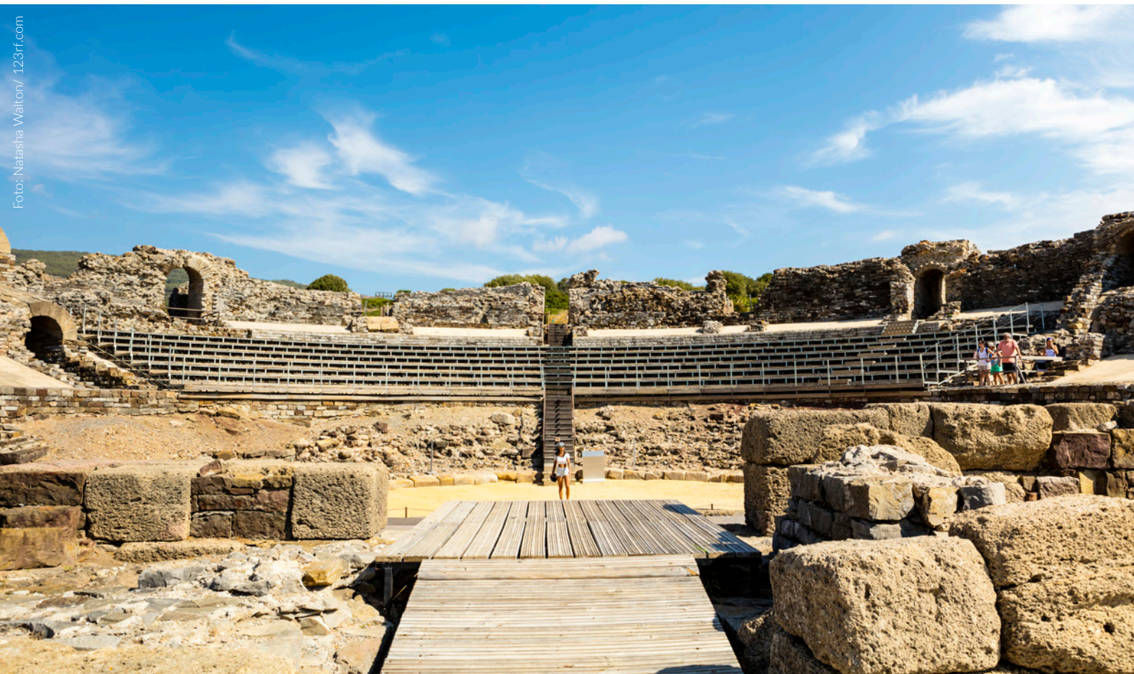
▲ CONJUNTO ARQUEOLÓGICO DE ITÁLICA SANTIPONCE, SEVILLA

Sevilla y su arquitectura morisca han dado vida al reino sureño de Dorne, el hogar de la Casa Martell. En el corazón de esta bella ciudad se alza el Real Alcázar , uno de los palacios más antiguos del mundo declarado Patrimonio de la Humanidad. En este conjunto arquitectónico se recrearon los Jardines del Agua, la residencia privada del Señor de Lanza del Sol. Pasear entre fuentes, naranjos y palmeras es un verdadero espectáculo para los sentidos.