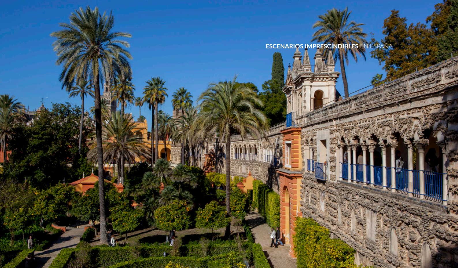
▲ JARDÍN DEL ESTANQUE DE MERCURIO REAL ALCÁZAR, SEVILLA

La Casa de Pilatos es otro de los lugares que cautivaron a Scott, que eligió este palacio de estilo renacentista italiano-mudéjar para escenificar la residencia del pretor romano en Jerusalén. Asómate a su interior y adéntrate en unos jardines interiores de gran belleza, típicos de los palacetes nobles del centro de la ciudad, con hermosos zócalos y rejas de estilo plateresco.