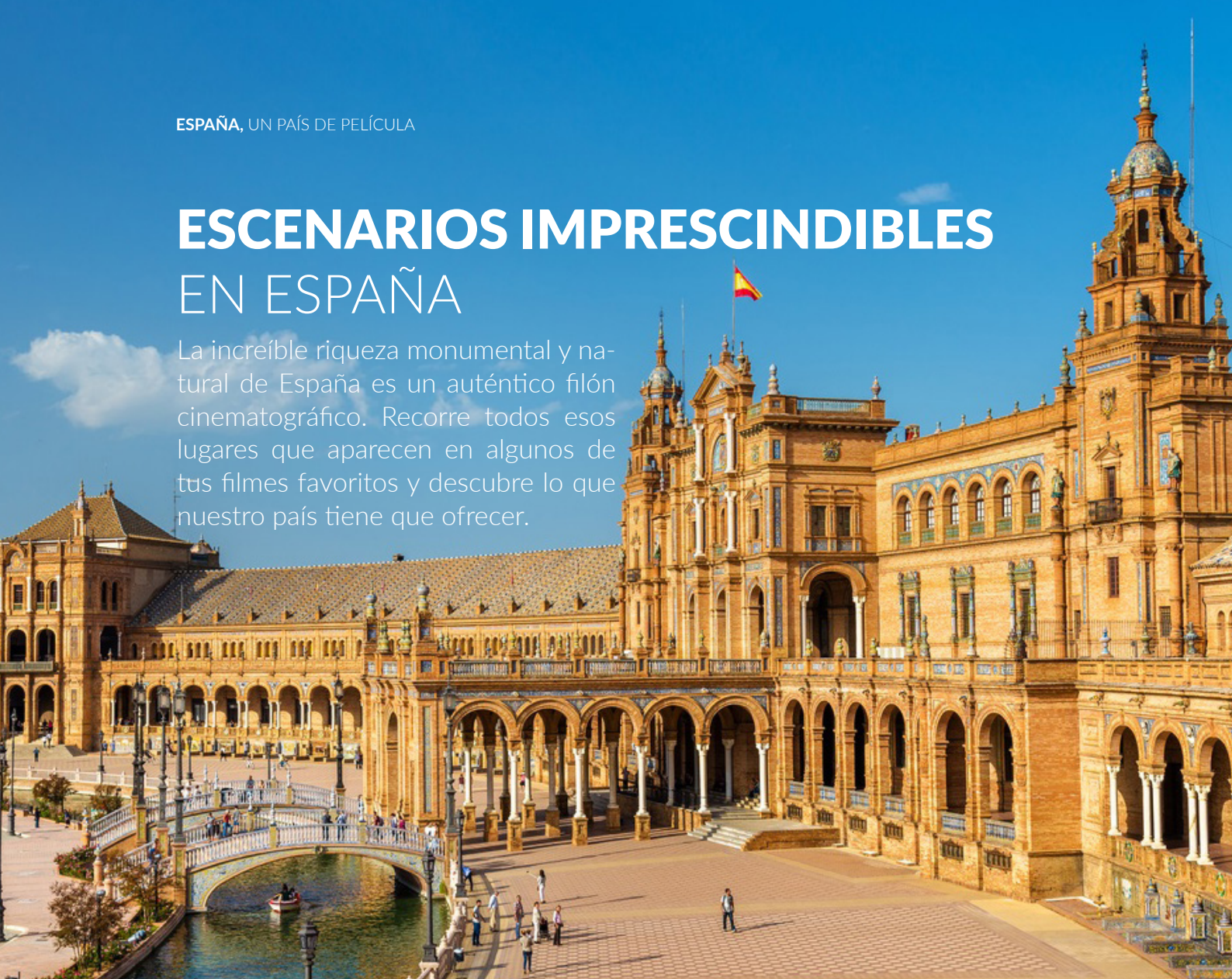
▲ PLAZA DE ESPAÑA SEVILLA

La increíble riqueza monumental y natural de España es un auténtico filón cinematográfico. Recorre todos esos lugares que aparecen en algunos de tus filmes favoritos y descubre lo que nuestro país tiene que ofrecer.