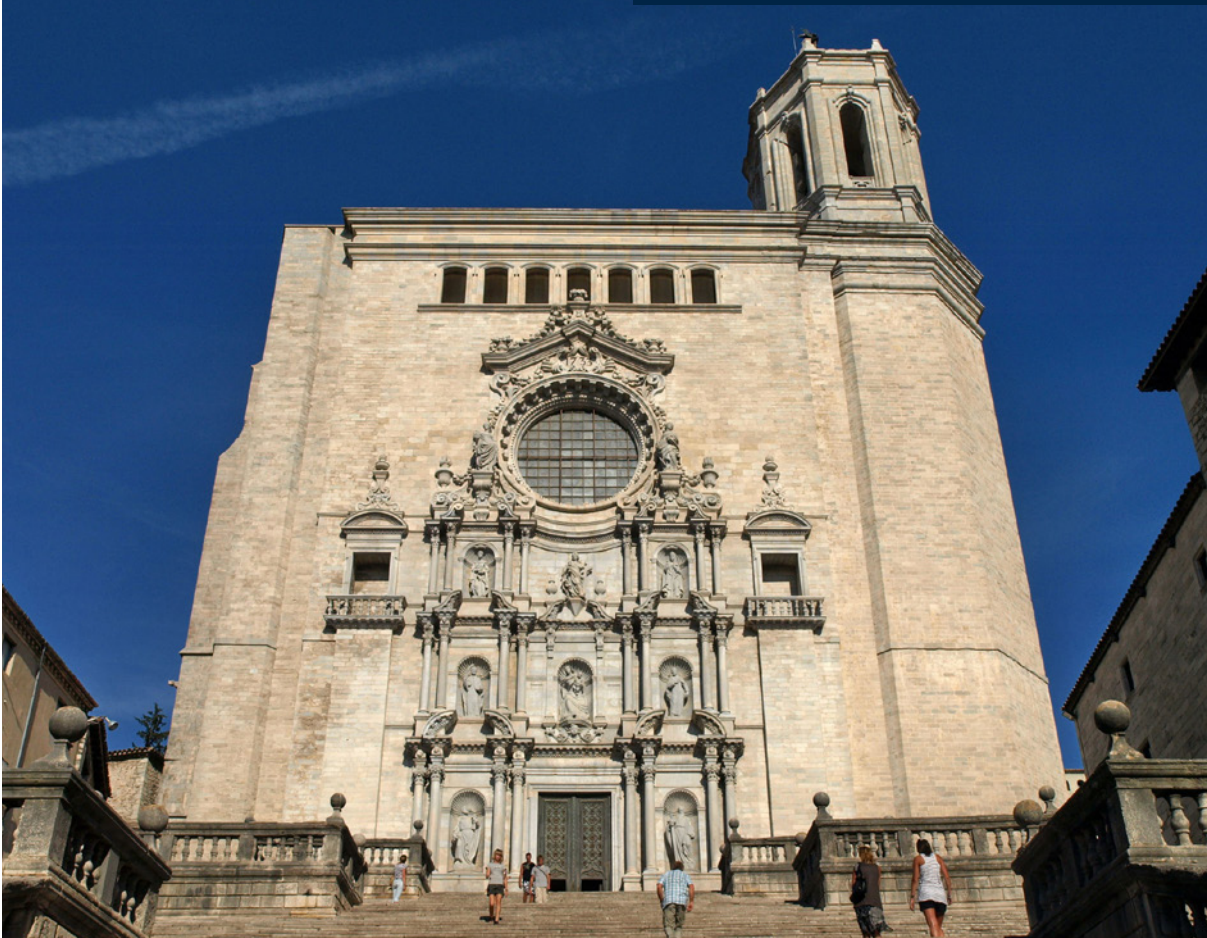
CATEDRAL DE SANTA MARÍA DE GIRONA

Las empedradas calles del casco histórico de Girona acogieron a una Arya perdida en Braavos y en las impresionantes escaleras de su catedral se recreó el Gran Septo de Baelor en Desembarco del Rey. No podrás subirlas a caballo, como Jaime Lannister, pero te quedarás asombrado ante sus imponentes dimensiones.