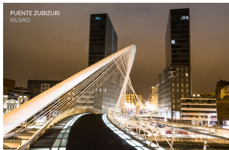
PUENTE ZUBIZURI BILBAO

El otro elemento que destaca en una de las secuencias del título es el punto Zubizuri , obra de Santiago Calatrava, que aporta ese toque futurista tan apreciado por los amantes de la ciencia ficción.