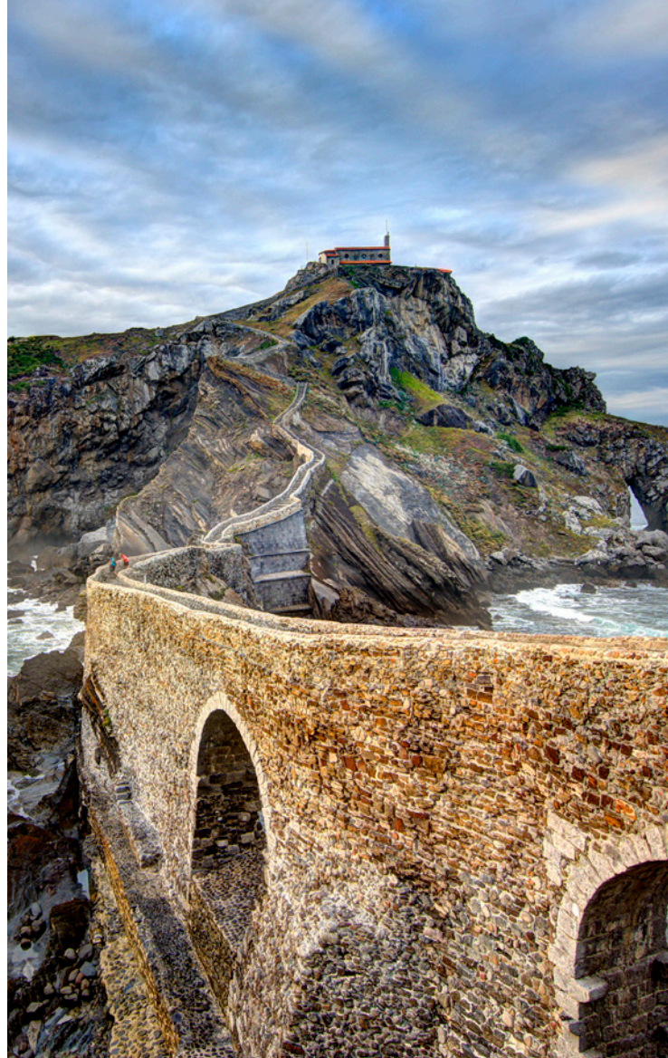
▲ ERMITA DE SAN JUAN GAZTELUGATXE BIZKAIA

Además de servir como escenario de Poniente, la variedad de paisajes y entornos naturales de nuestro país ha permitido