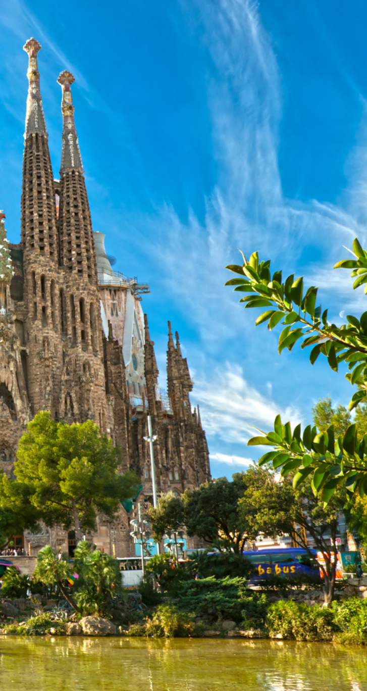
▲ BASÍLICA DE LA SAGRADA FAMILIA BARCELONA

Tampoco falta el parque Güell , en cuya fuente con forma de lagarto rodaron una secuencia Javier Bardem y Rebecca Hall. Las curiosas formas y atrevidas combinaciones de colores del parque, mezcladas con la vegetación, te trasladarán a un mundo mágico.