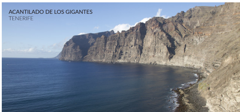
ACANTILADO DE LOS GIGANTES TENERIFE

Por su parte, Furia de Titanes , de Louis Leterrier, permite ver en acción al Teide, volcán inactivo que se alza imponente en el centro de la isla de Tenerife y es el pico más alto de toda España. El parque nacional del Teide sirvió de réplica del inframundo mitológico en el que se desarrolla una parte importante de la película.