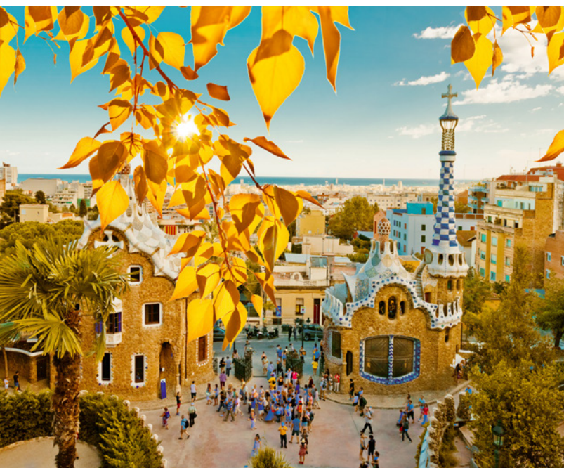
▲ PARQUE GÜELL BARCELONA