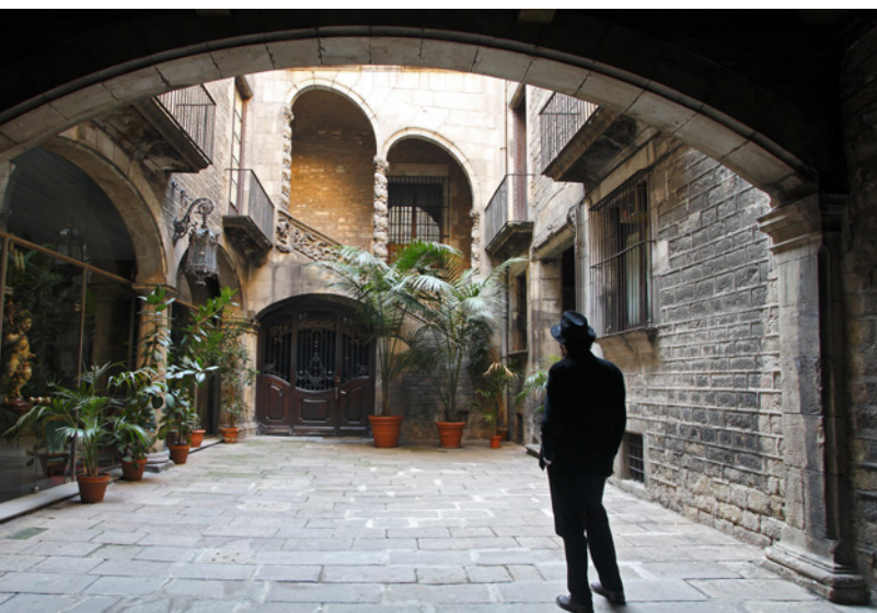
▲ BARRIO GÓTICO BARCELONA

El perfume , basado en el bestseller de Patrick Süskind y dirigida por Tom Tykwer, es otro largometraje idóneo para conocer los encantos de Barcelona, convertida aquí en el París del siglo XVI-II. Las callejuelas del Barrio Gótico sirven de escenario de las andanzas de Grenouille, personaje principal de la cinta. Allí podrás pasear entre restos del pasado romano de la ciudad, ruinas de antiguas murallas, las estrechas calles del barrio judío y descubrir la catedral gótica y los palacios más significativos.