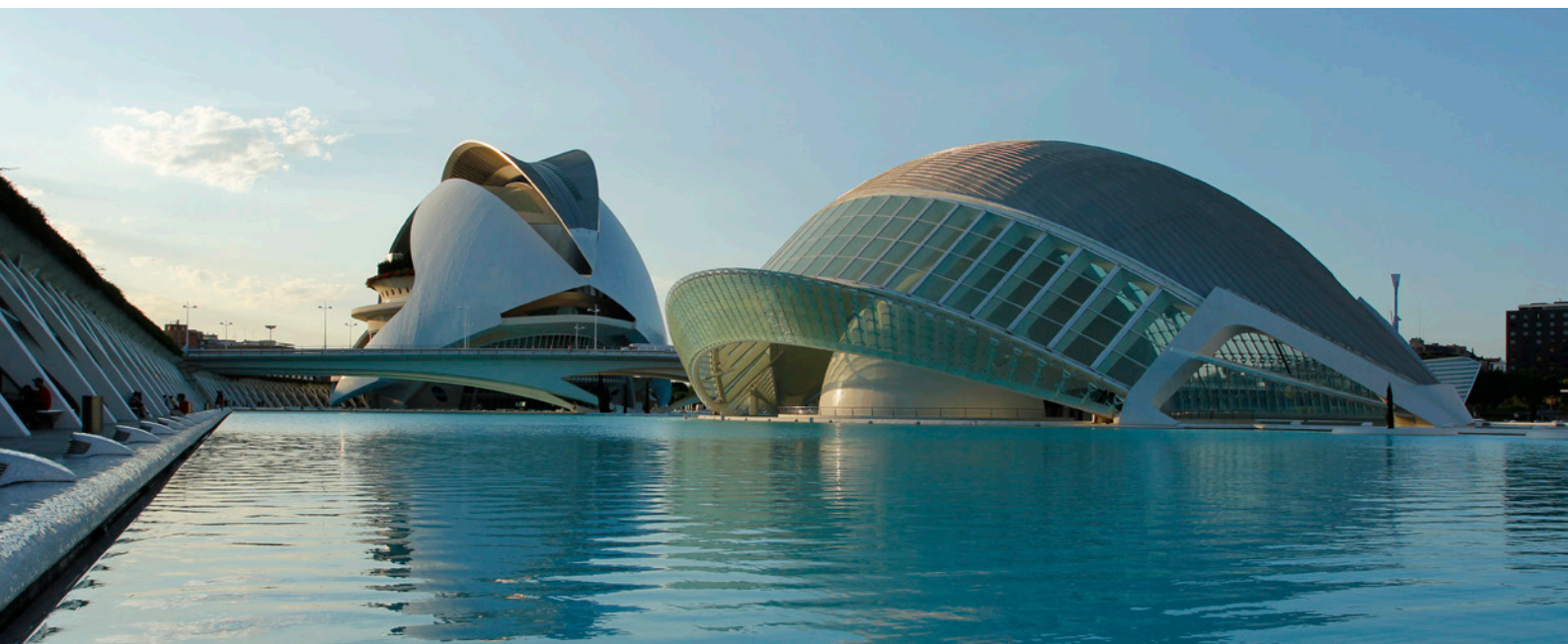
▲ CIUDAD DE LAS ARTES Y LAS CIENCIAS VALENCIA