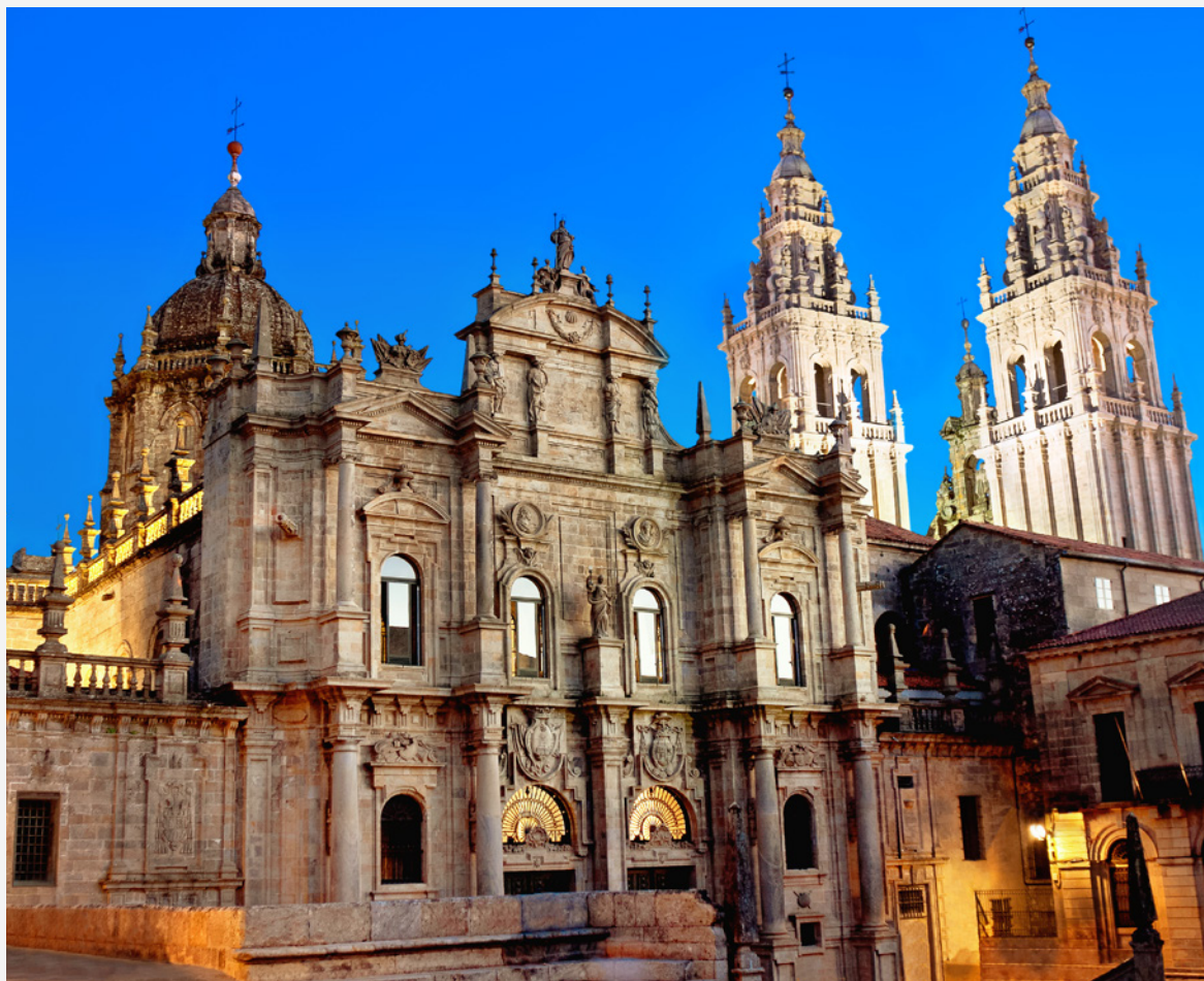
▲ 圣地亚哥大教堂 圣地亚哥-德孔波斯特拉