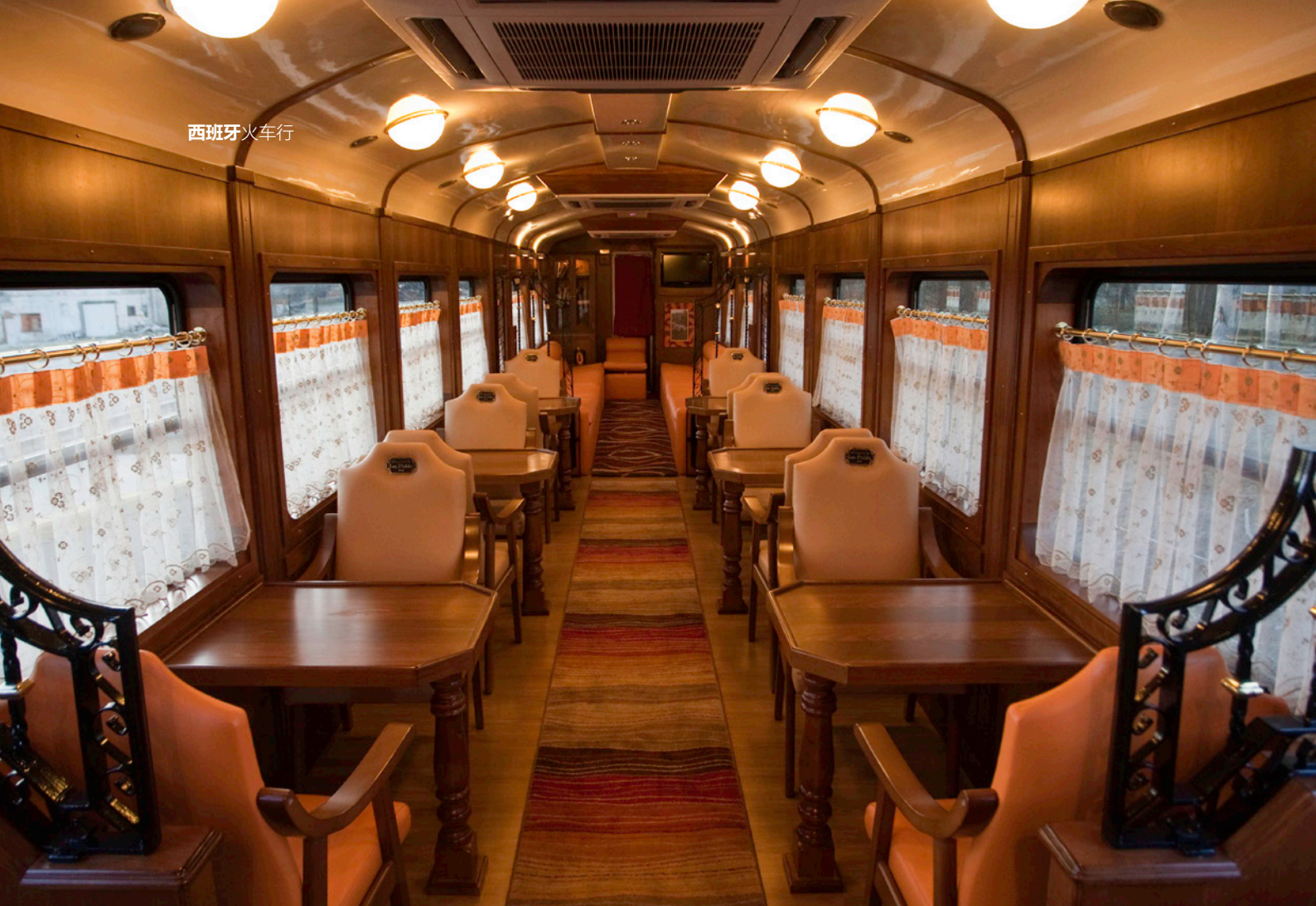
▲ 罗夫拉 (ROBLA) 快车