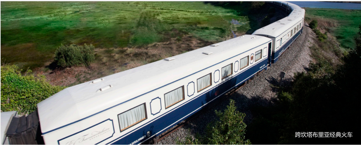
跨坎塔布里亚经典火车

晚饭后回到车厢，你可以加入现场演出派对，或是在沙龙列车中安静地享用一杯酒，或是在你的豪华包厢中休息。为了让你得到更好的休息，列车在夜晚会停下，你也可以下车散散步。