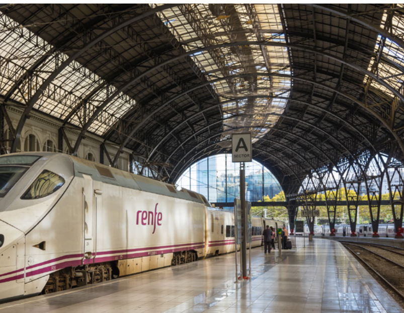
▲ 法国车站 巴塞罗那

西班牙工业、商务和旅游部 出版：© Turespaña 撰写：Lionbridge NIPO: 086-18-013-9