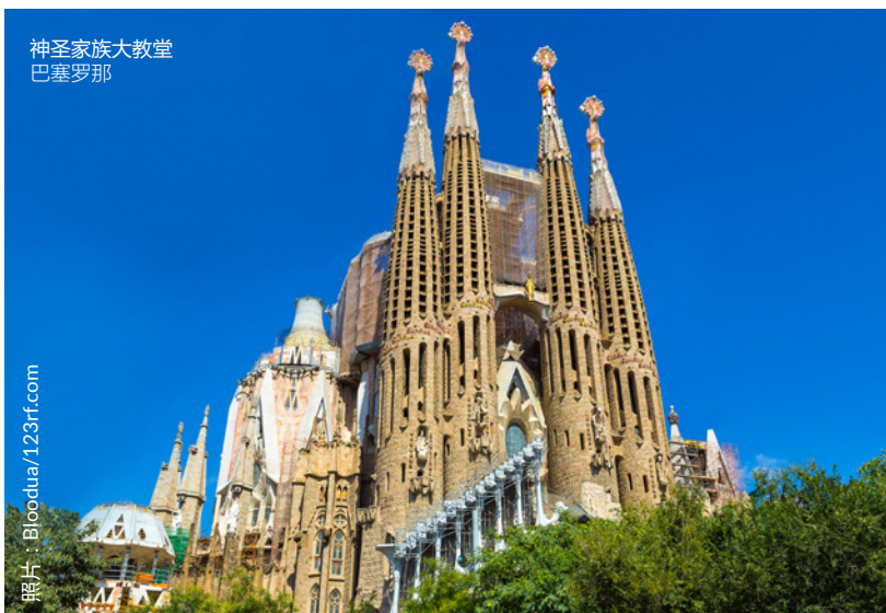
神圣家族大教堂 巴塞罗那