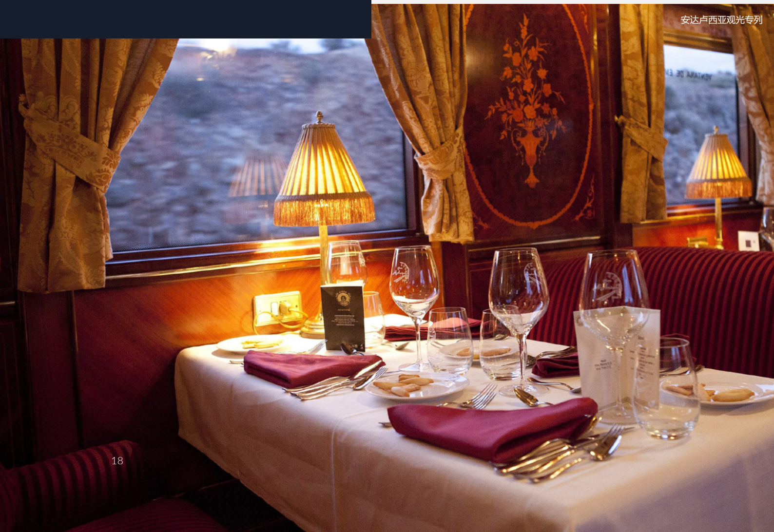
安达卢西亚观光专列