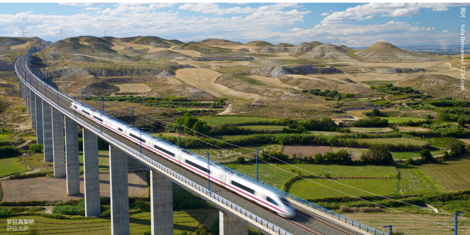
罗旦高架桥 萨拉戈萨