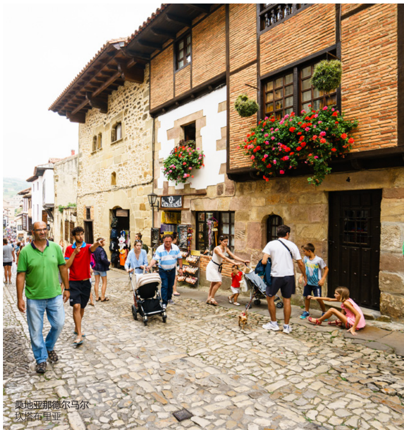
桑地亚那德尔马尔 坎塔布利亚

如果坎塔布里亚海岸山脉和海洋之间的迷人美景更吸引你，则可以选择在毕尔巴鄂 ( 巴斯克地区 ) 和奥维耶多 ( 阿斯图里亚斯 ) 之间的绿色天堂路线。你将参观到中世纪的村庄，如别具风情的桑地亚那德尔马尔 ( Santillana del Mar ) ( 坎塔布里亚 ) 或诸如拉雷多 ( Laredo ) 或亚内斯 ( Llanes ) ( 阿斯图里亚斯 ) 等的小渔村。你可以乘船游览参观桑托尼亚 ( Santoña ) ( 坎塔布利亚 ) 的著名凤尾鱼罐头工厂。你也可以一边品尝传统的阿斯图里亚斯苹果酒，一边欣赏欧洲之峰国家公园宏伟的自然风光。除了现代化的毕尔巴鄂，你还会还有机会了解到两座坎塔布里亚海流经的城市：桑坦德和希洪。