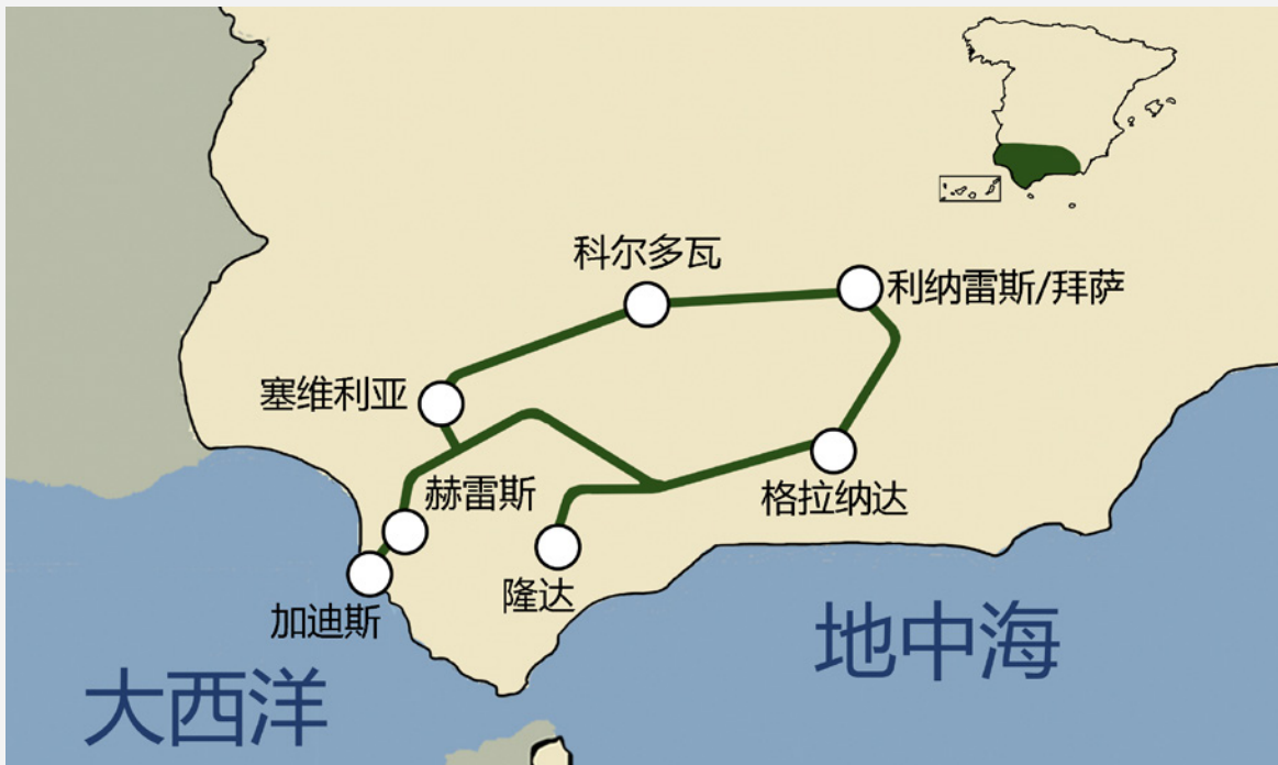
▲ 安达卢西亚观光专列线路