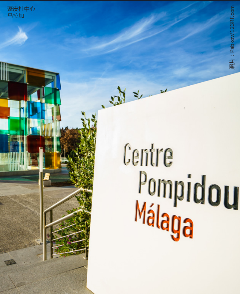
蓬皮杜中心 马拉加