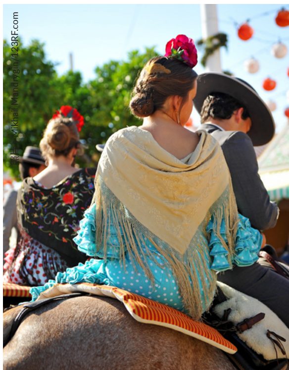
▲ 塞维利亚四月节 塞维利亚