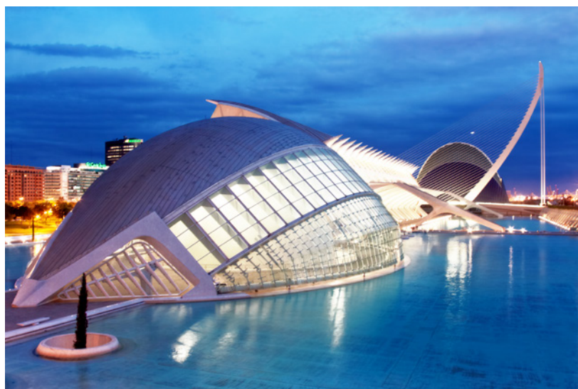
▲ 艺术科学城 瓦伦西亚

① 在此处查看高铁路线和时刻表的所有信息： www.renfe.com/viajeros/larga_distancia/productos/