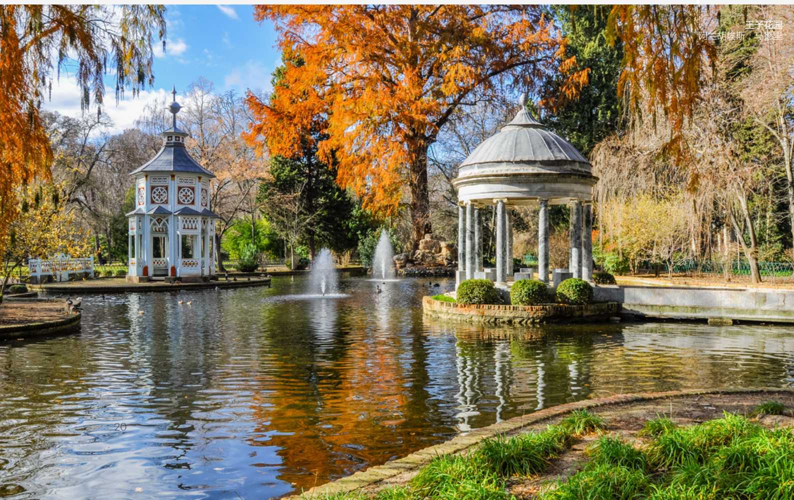
王子花园 阿兰胡埃斯，马德里

在参观完美丽的塞维利亚之后，列车还有其他停靠站等待着你来探索。在梅里达（MÉRIDA）和卡塞雷斯（CÁCERES），你可以观赏罗马时期的建筑。这里是西班牙盛产最上等的火腿的地方，不要错过参观伊比利亚猪饲养场的机会。如果你想投入到大自然中去，我们建议你到孟弗拉圭（MONFRAGÜE）自然公园一游。在到达著名的西班牙首都马德里之前，还有许多惊喜等待着你。参观古城托莱多一定会让你记忆深刻：犹太、穆斯林和基督教文化都在这里留下了痕迹，这里的建筑都是历史瑰宝。你会爱上小镇阿兰胡埃斯（ARANJUEZ），那里的王宫和花园十分迷人，你可以在一个古老的酒庄小酌一杯。