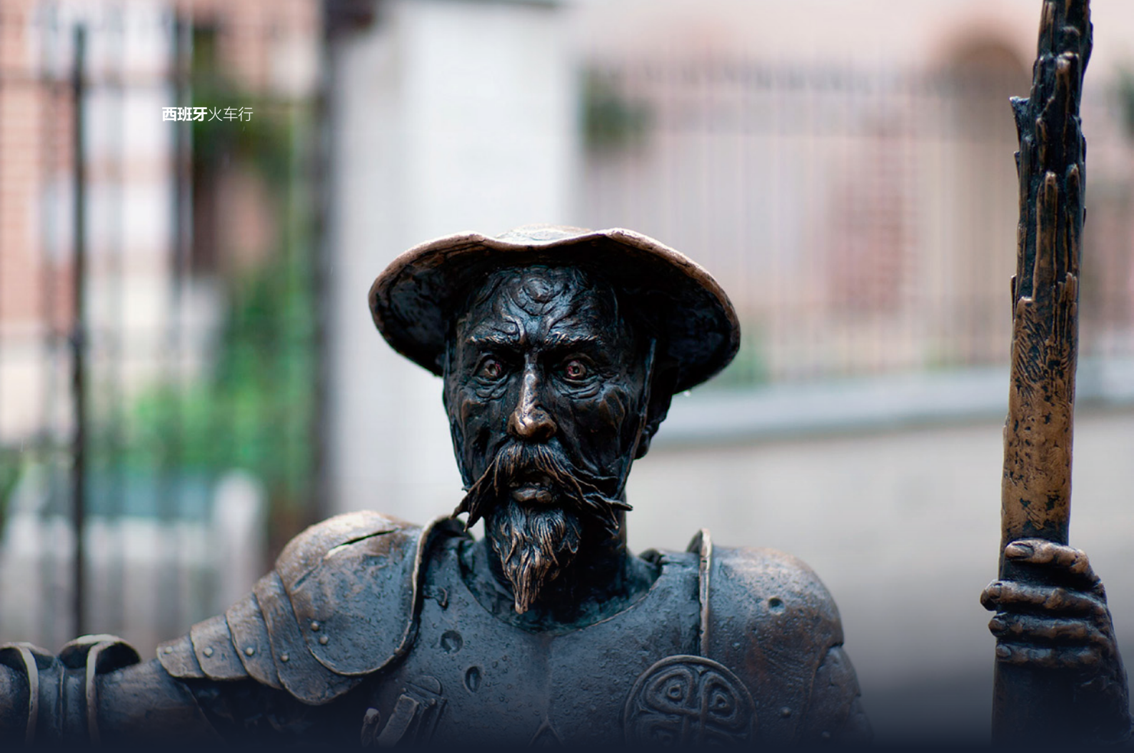
▲ 唐吉珂德的雕塑 阿尔卡拉德埃纳雷斯，马德里