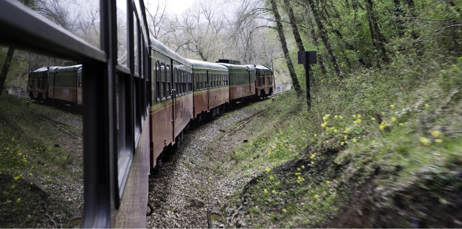
▲ 罗夫拉 (ROBLA) 快车