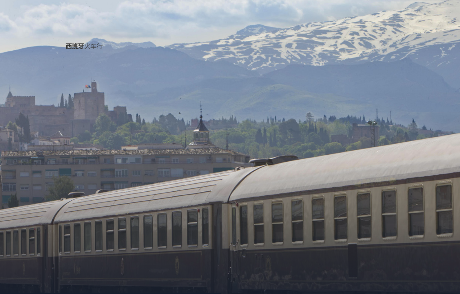
格拉纳达的安达卢西亚观光专列