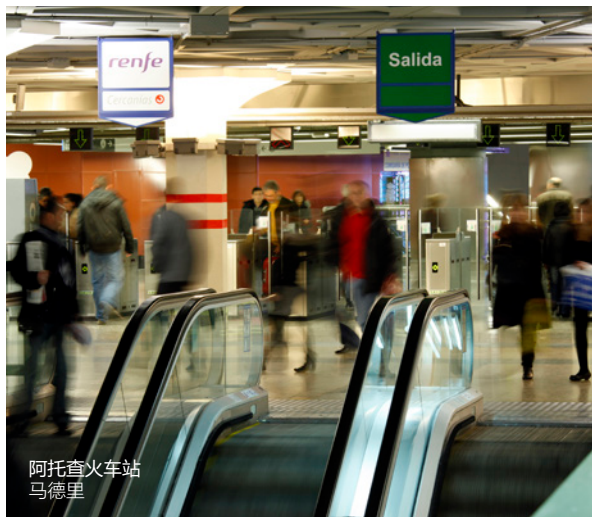
阿托查火车站 马德里