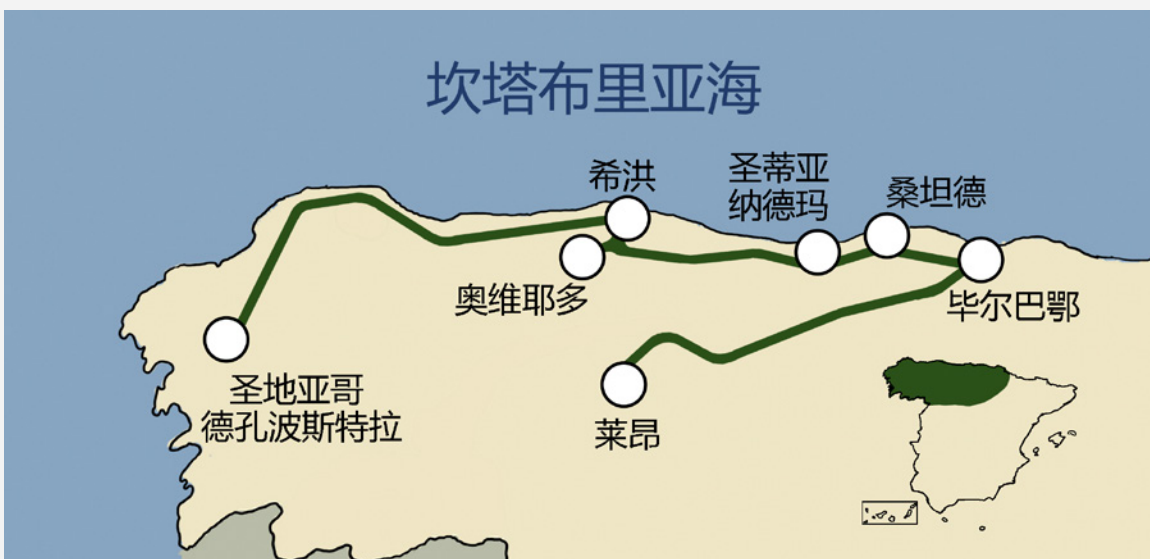
▼ 跨坎塔布里亚经典火车

如果你不想乘坐跨坎塔布里亚豪华列车，另外一个上等选择是跨坎塔布里亚经典列车，游遍坎塔布里亚海岸和内陆的卡斯蒂亚-莱昂地区。你可以选择起点为莱昂市、终点为圣地亚哥-德孔波斯特拉的八天路线，或者更短的路线：圣地亚哥德孔波斯特拉-桑坦德或莱昂-桑坦德。