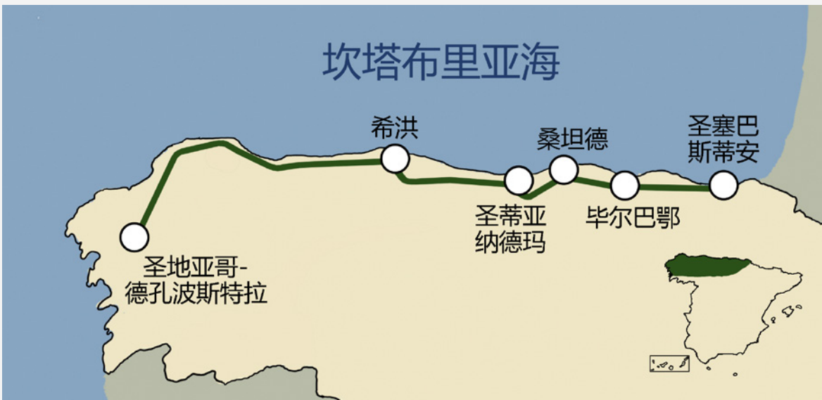
▼ 跨坎塔布里亚豪华火车线路

你可以在14间装饰精美的豪华套房中的一间休息，透过私人套房的车窗或是沙龙车厢的大落地窗，可以欣赏窗外壮丽的景色，沙龙车厢是1923年的原版，是具有历史意义的铁路瑰宝。