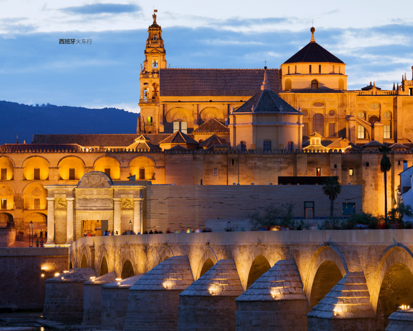
▲ 清真寺-大教堂 科尔多瓦