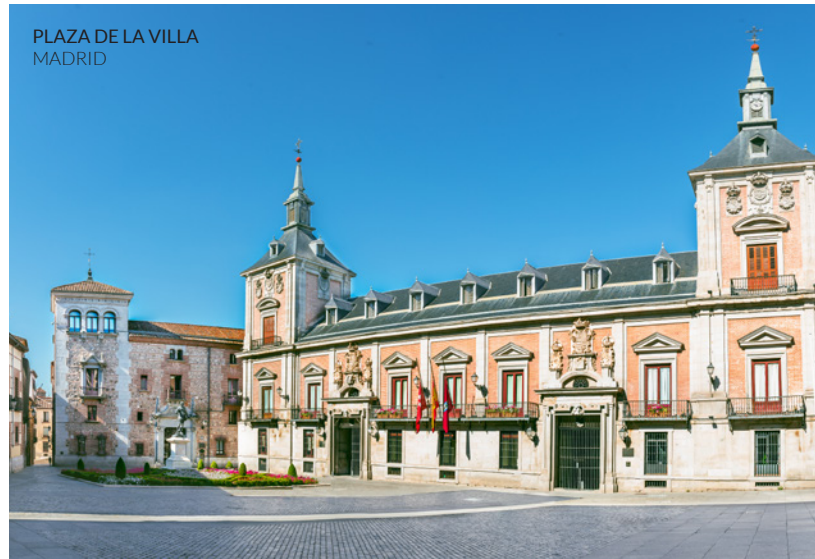
PLAZA DE LA VILLA MADRID

Verlieben Sie sich in diese kosmopolitische, avantgardistische und mediterrane Stadt. Sie werden jeden Moment von ihr begeistert sein. Erkunden Sie sie zu Fuß oder mit dem Fahrrad und entdecken Sie ihre Stadtteile, ihren Prachtboulevard Las Ramblas und Ihre Strandpromenade. Fühlen Sie sich wie ins Mittelalter zurückversetzt, wenn Sie durch die engen Gassen des berühmten Viertels Barri Gòtic schlendern. Springen Sie mit Antonio Gaudí mitten hinein in den katalanischen Jugendstil, den Modernisme: Bewundern Sie sein beeindruckendes Meisterwerk, die Kirche Sagrada Familia , oder den Park Güell . Informieren Sie sich über das reichhaltige Kulturprogramm der Stadt und besuchen Sie die Ausstellungen, Konzerte, Vorführungen usw. Genießen Sie die Gastronomie Barcelonas, die Tradition und Kreativität in der Küche vereint. Gönnen Sie sich etwas Besonderes: Probieren Sie die traditionell hergestellten Konditorwaren und die Schaumweine. Sie können auch von Málaga aus mit dem AVE nach Barcelona fahren.