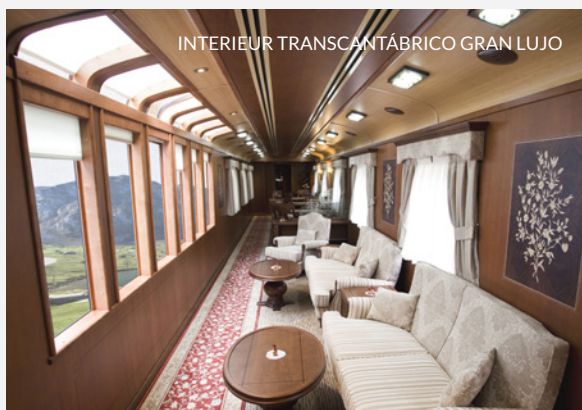
INTERIEUR TRANSCANTÁBRICO GRAN LUJO