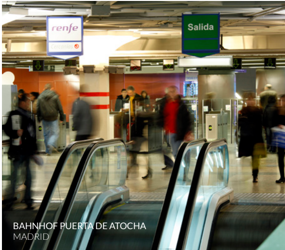
BAHNHOF PUERTA DE ATOCHA MADRID

Es gibt noch weitere Angebote für organisierte Reisen mit dem Zug. Hier nur einige.