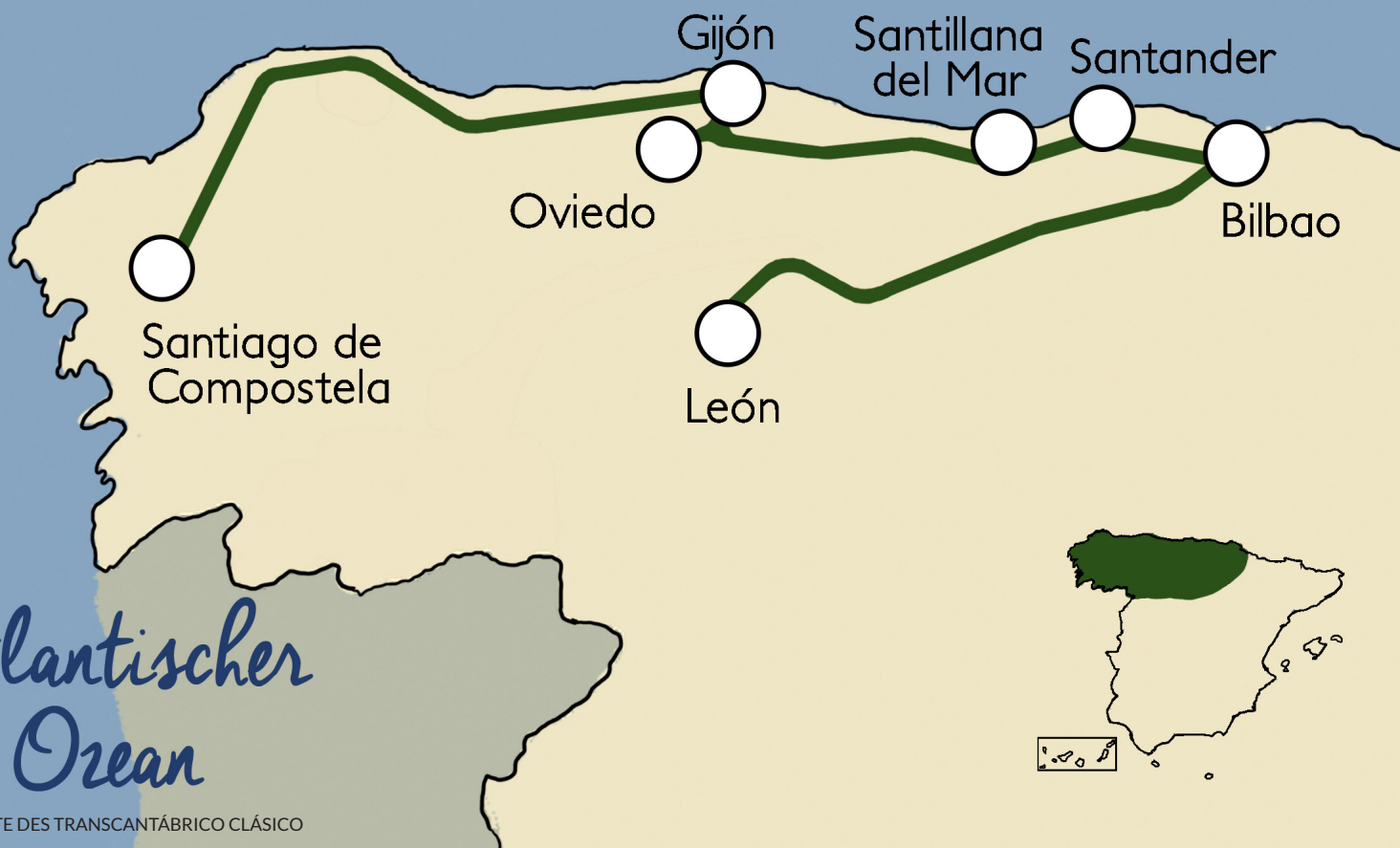
REISEROUTE DES TRANSCANTÁBRICO CLÁSICO

Zurück im Zug können Sie nach dem Abendessen an Partys mit Live-Darbietungen teilnehmen, entspannt etwas in einem Salonwagen trinken oder sich einfach in Ihre luxuriöse Suite zurückziehen. Da der Zug nachts hält, damit Sie sich besser erholen können, haben Sie die Möglichkeit, auf Wunsch auszusteigen und einen Spaziergang zu machen.