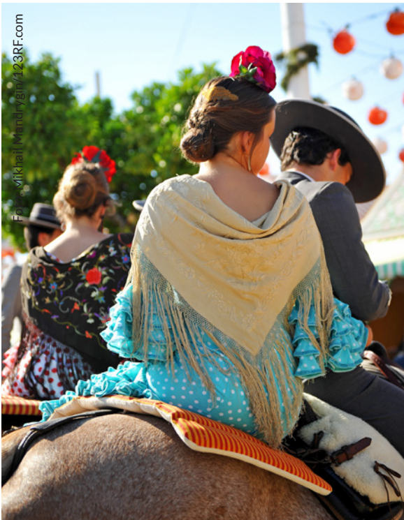
▲ FRÜHLINGSFEST FERIA DE ABRIL SEVILLA