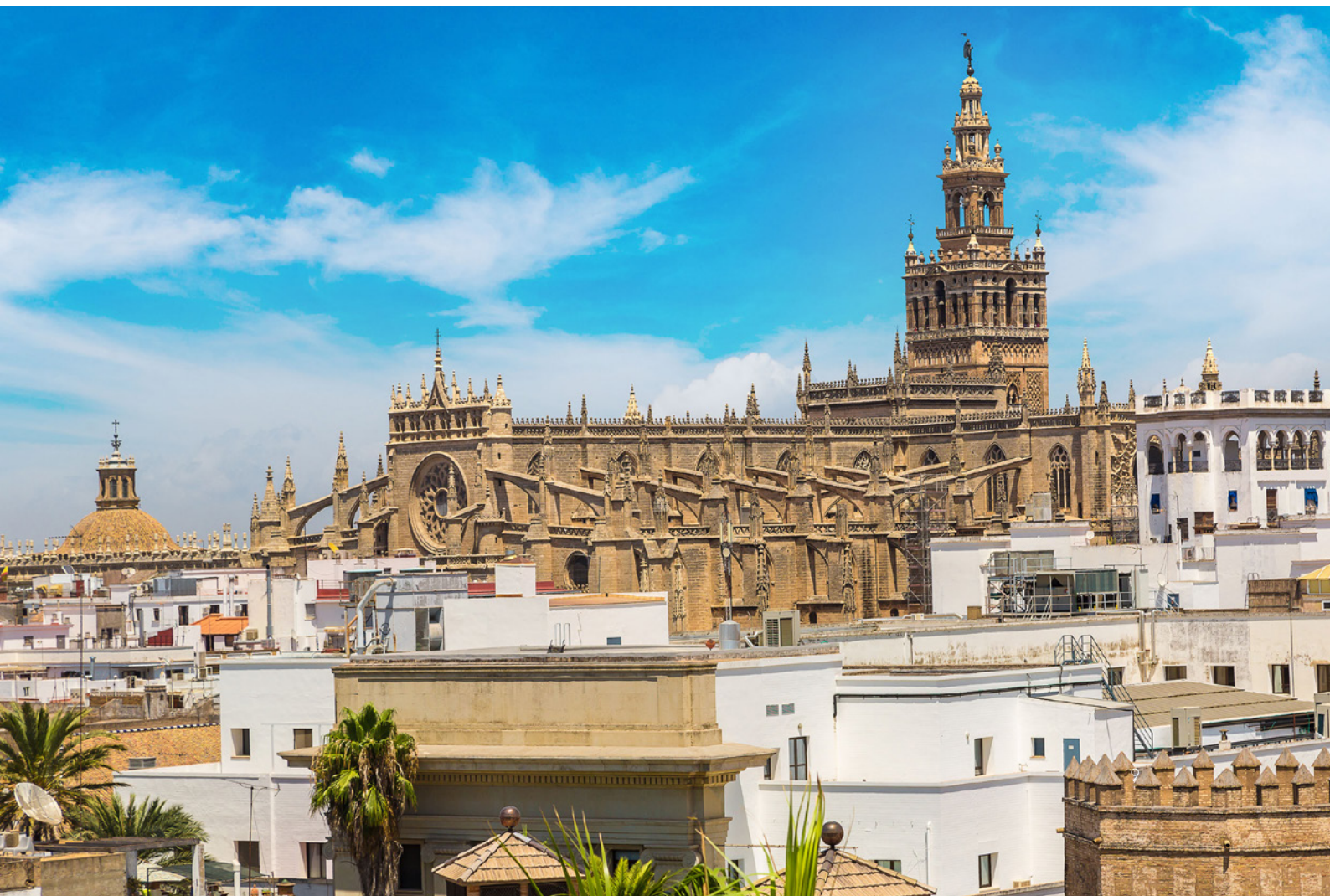
▼ KATHEDRALE SANTA MARÍA DE LA SEDE SEVILLA

Wenn Sie in der Osterwoche oder während des Frühlingsfestes Feria de Abril reisen, können Sie hautnah eines der faszinierendsten Volksfeste des Landes miterleben.