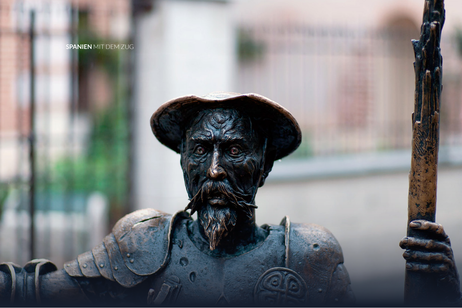
▲ SKULPTUR VON DON QUIJOTE ALCALÁ DE HENARES, MADRID