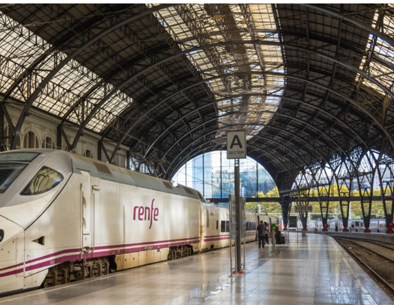
▲ BAHNHOF ESTACIÓN DE FRANCIA BARCELONA

Ministerium für Industrie, Handel und Tourismus Herausgegeben von: © Turespaña Erstellt von: Lionbridge NIPO: 086-18-008-4