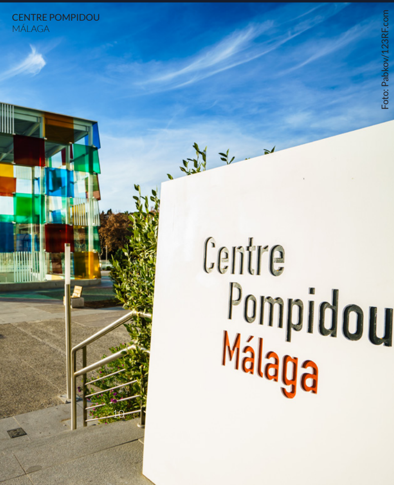
CENTRE POMPIDOU MÁLAGA

Nur zwei Stunden und zwanzig Minuten trennen Madrid von der mediterranen Stadt, in der der geniale Maler Pablo Picasso geboren wurde.