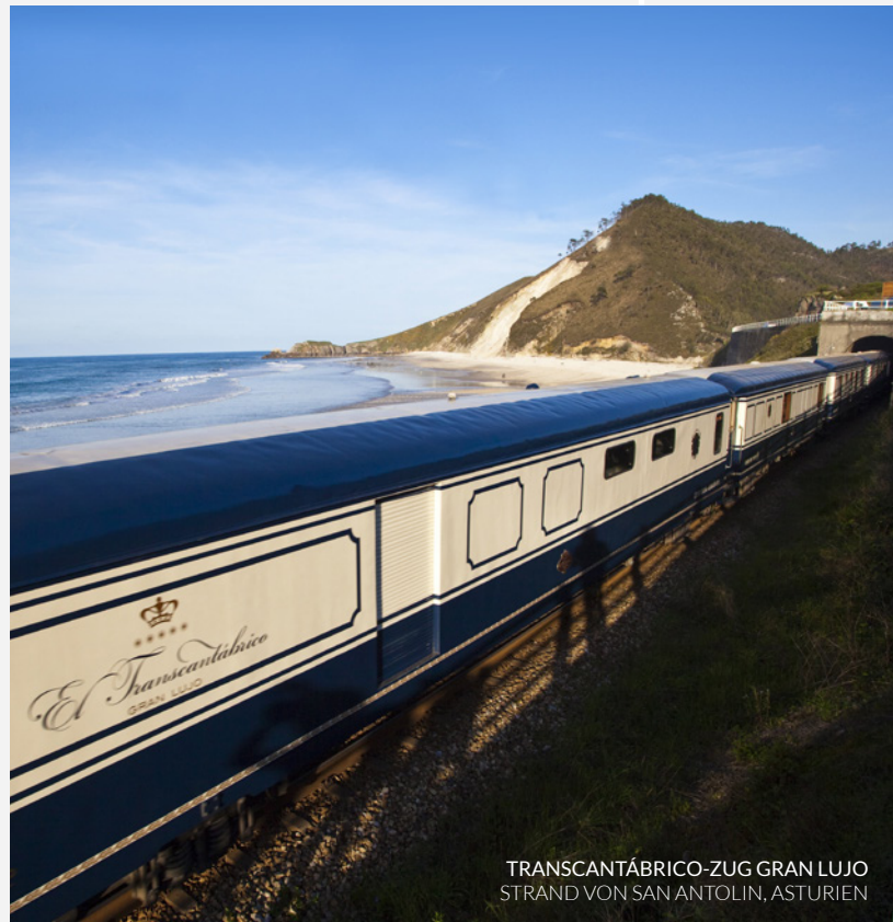
TRANSCANTÁBRICO-ZUG GRAN LUJO STRAND VON SAN ANTOLIN, ASTURIEN

Sie können sich in einer der 14 luxuriösen, liebevoll eingerichteten Suiten entspannen und durch das Fenster Ihres privaten Salons oder durch die großen Fenster der Originalsalonwagen aus dem Jahre 1923, diesen echten Juwelen der Eisenbahngeschichte, sehen, wie die schönsten Landschaften an Ihnen vorbeiziehen.