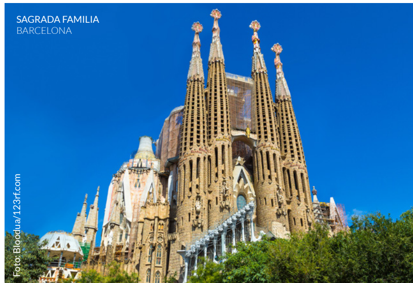
SAGRADA FAMILIA BARCELONA