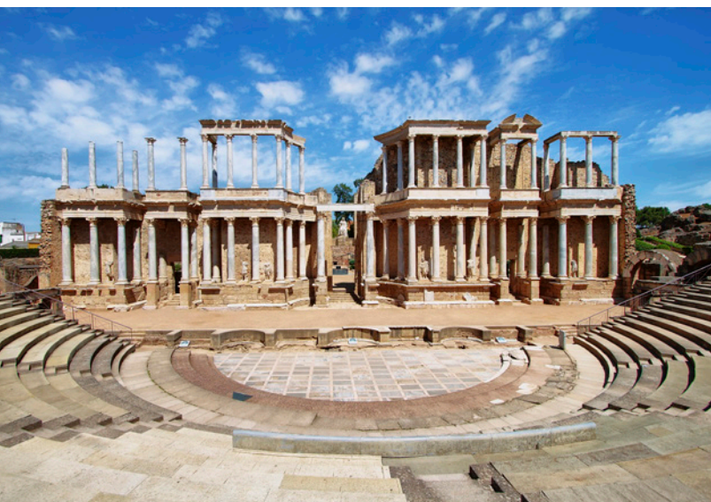
▲ TEATRO ROMANO MÉRIDA

O Museu Nacional de Arte Romana (MNAR) , obra do arquiteto espanhol Rafael Moneo, completa esta rota com uma grande coleção de estátuas, bustos e mosaicos que te irão acercar à vida quotidiana de uma colónia romana.