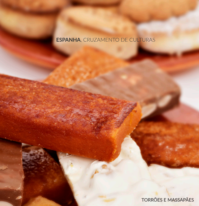
TORRÕES E MASSAPÃES