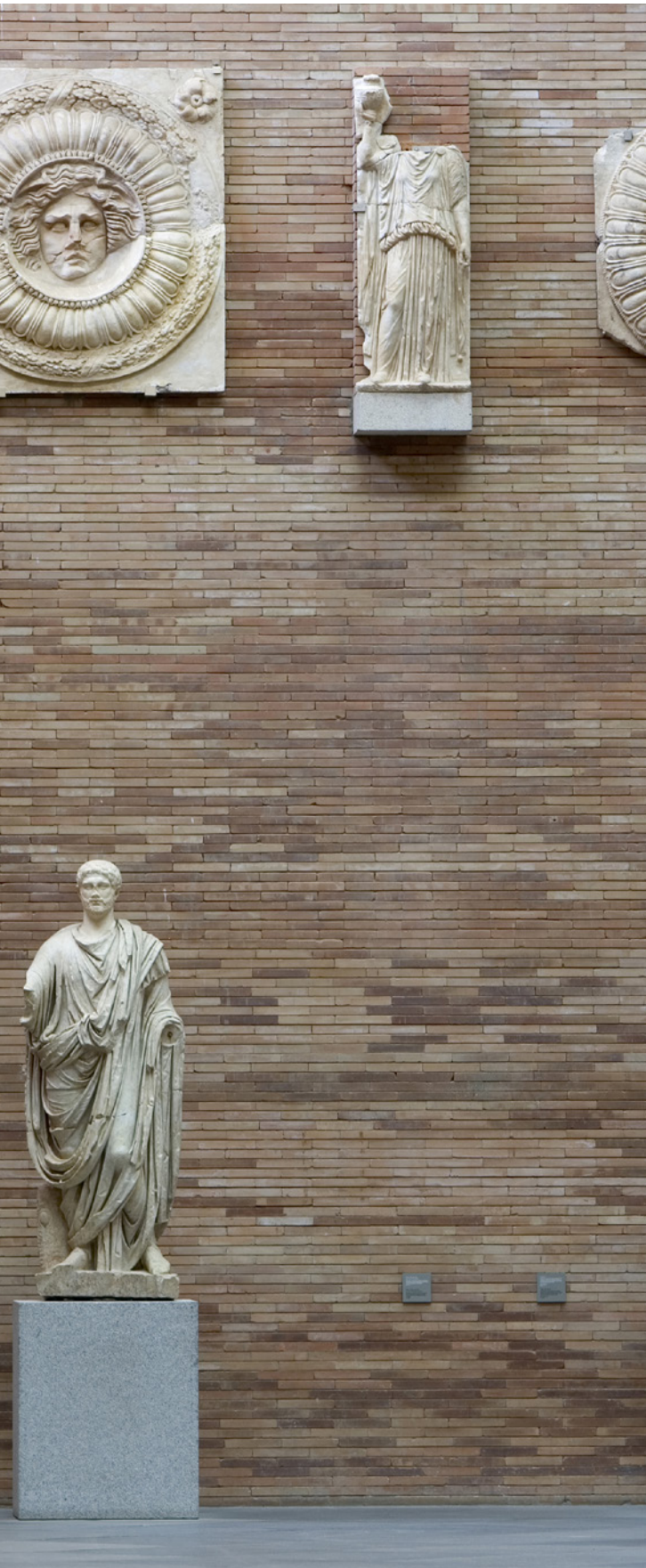
▲ MUSEU NACIONAL DE ARTE ROMANA MÉRIDA