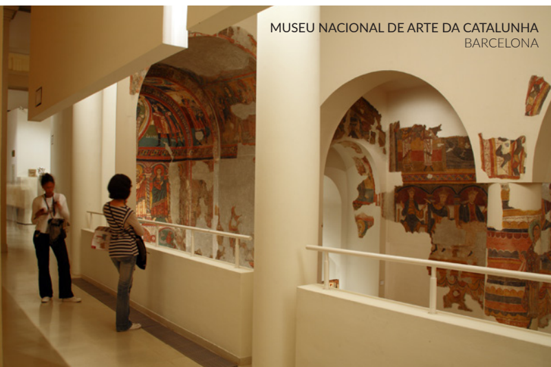
MUSEU NACIONAL DE ARTE DA CATALUNHA BARCELONA