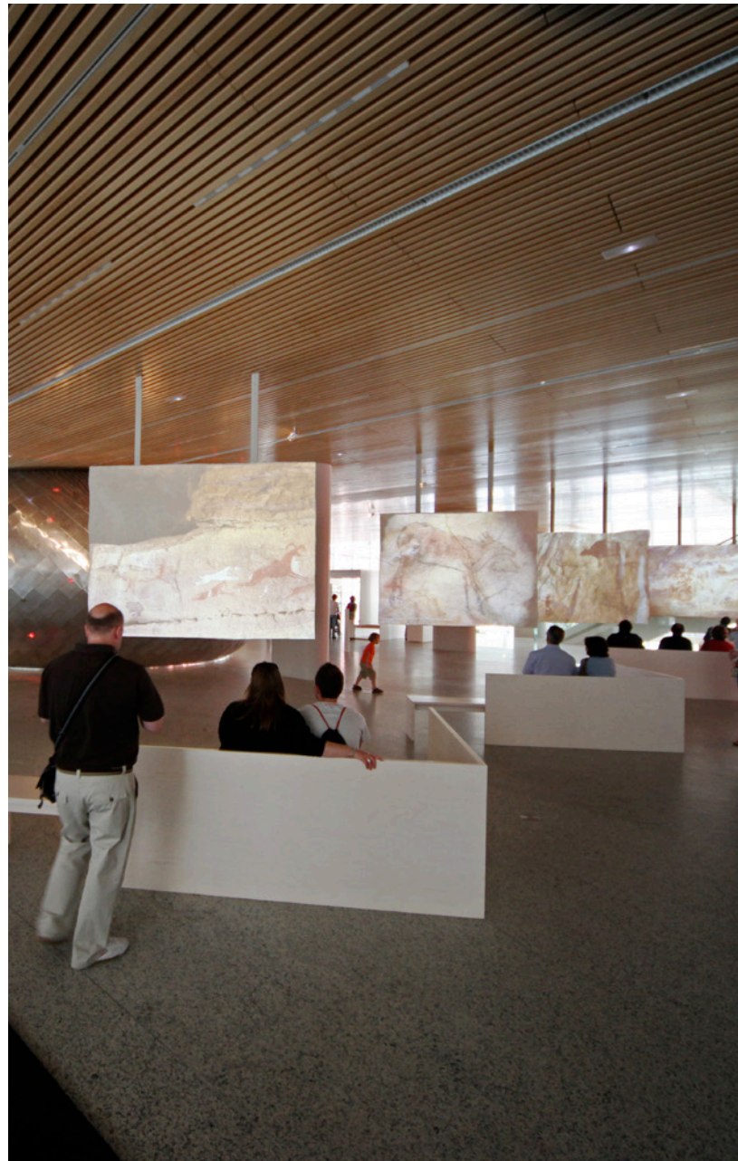
▲ MUSEU DA EVOLUÇÃO HUMANA BURGOS

Contempla os restos fósseis encontrados em Atapuerca no moderno Museu da Evolução Humana (MEH) da capital burgalesa. Este espaço de arquitetura vanguardista é o encarregado de divulgar o valor e a importância destas descobertas, assim como as técnicas e disciplinas científicas que intervêm na sua interpretação. Entre muitas outras atividades, poderás contemplar dez recreações de corpo inteiro das espécies mais representativas dos nossos antepassados na Galeria dos Hominídeos, conhecer os avanços nas teorias da evolução humana ou entrar num cérebro gigante. Para isso são utilizadas novas tecnologias como a realidade aumentada, painéis interativos e vídeos 3D para toda a família.