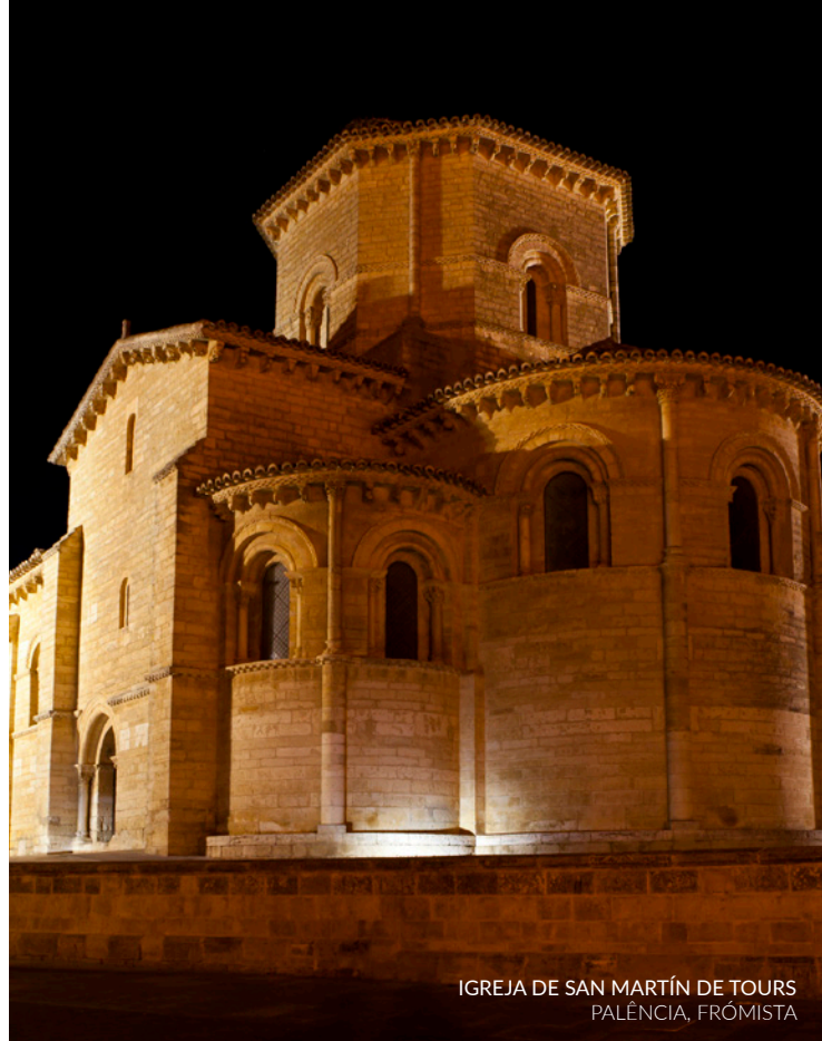
IGREJA DE SAN MARTÍN DE TOURS PALÈNCIA, FRÓMISTA