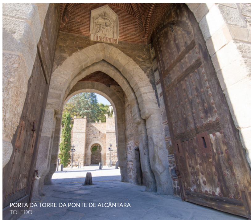
PORTA DA TORRE DA PONTE DE ALCÂNTARA TOLEDO

Os edifícios religiosos, como ermidas e basílicas, são a herança mais abundante desta cultura em todo o território espanhol. Exemplo disso são a igreja de San Juan de Baños , em Venta de Baños (Palência, Castela e Leão), a de San Pedro de la Nave em El Campillo (Zamora, Castela e Leão) e o mosteiro de San Millán de Suso em San Millán de la Cogolla (La Rioja), considerado o berço do idioma castelhano.