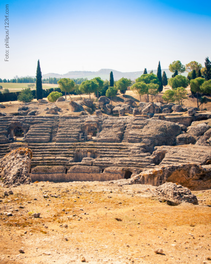
▲ CONJUNTO ARQUEOLÓGICO DE ITÁLICA SANTIPONCE, SEVILHA