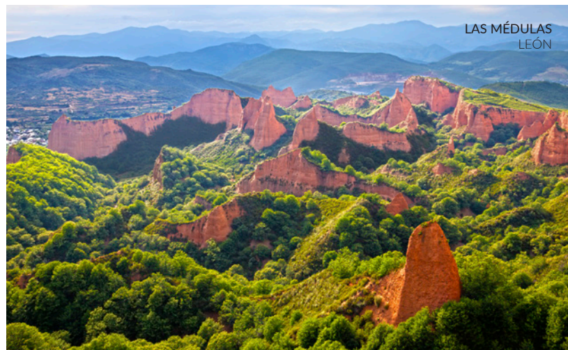
LAS MÉDULAS LEÓN

Na freguesia de El Bierzo (León, Castela e Leão) vais descobrir aquela que é considerada a maior mina de ouro a céu aberto de todo o império romano, num cenário declarado Património da Humanidade pela UNESCO. Visita a aula arqueológica para conheceres todas as chaves destas minas auríferas. Podes render-te à simples contemplação do cenário mágico, enquadrado numa paisagem avermelhada e sinuosa, ou realizar uma visita guiada e atravessar uma parte do seu labirinto subterrâneo de grutas e galerias.