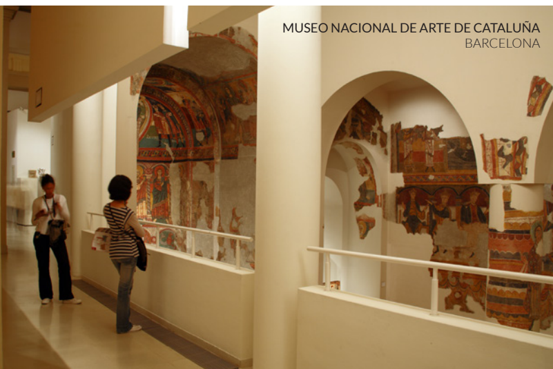
MUSEO NACIONAL DE ARTE DE CATALUÑA BARCELONA