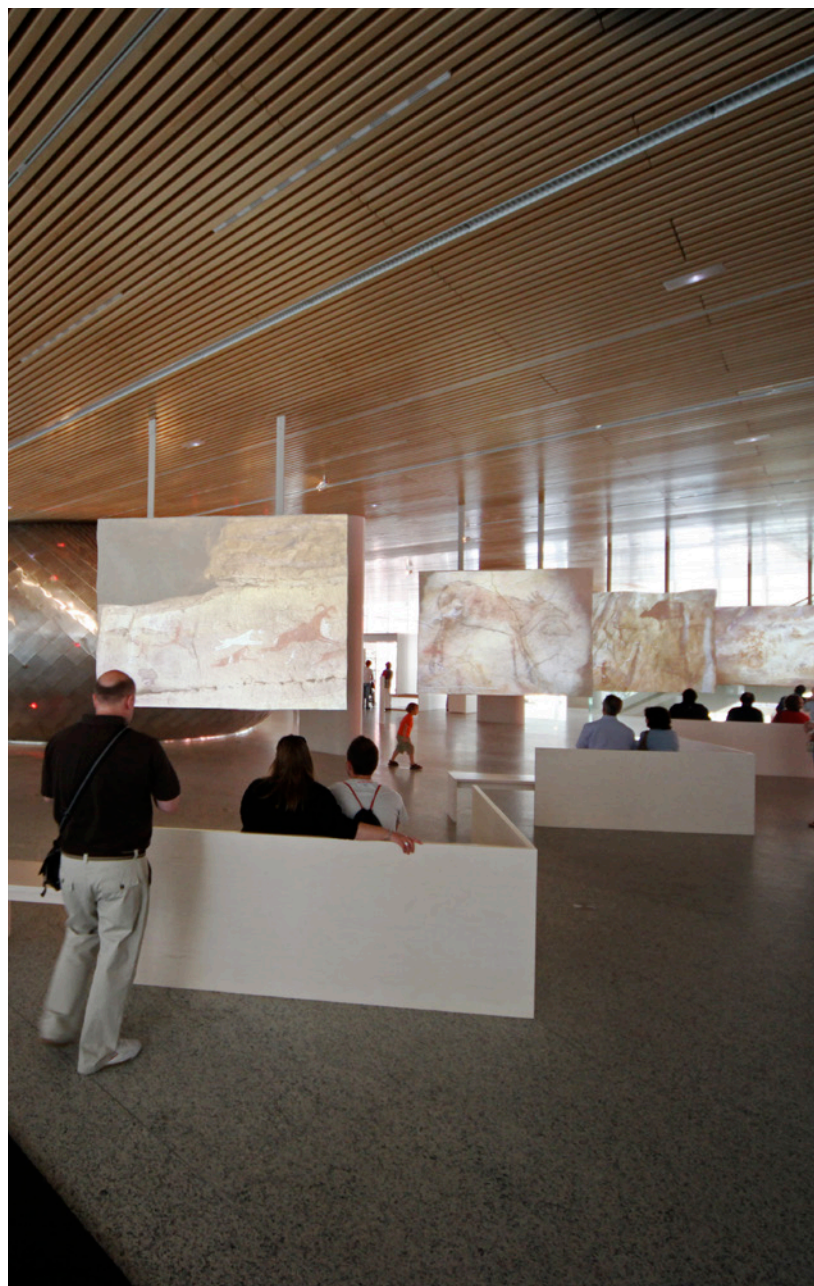
▲ MUSEO DE LA EVOLUCIÓN HUMANA BURGOS

Contempla los restos fósiles que se hallaron en Atapuerca en el moderno Museo de la Evolución Humana (MEH) de la capital burgalesa. Este espacio de arquitectura vanguardista es el encargado de divulgar el valor e importancia de estos hallazgos, así como las técnicas y disciplinas científicas que intervienen en su interpretación. Entre otras muchas actividades, podrás contemplar diez recreaciones de cuerpo entero de las especies más representativas de nuestros antepasados en la Galería de los Homínidos, conocer los avances en las teorías de la evolución humana o entrar en un cerebro gigante. Para ello se utilizan nuevas tecnologías como la realidad aumentada, paneles interactivos y vídeos 3D para toda la familia.