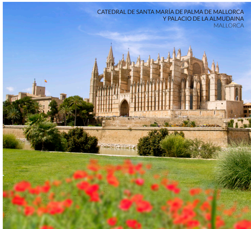
CATEDRAL DE SANTA MARÍA DE PALMA DE MALLORCA Y PALACIO DE LA ALMUDAINA MALLORCA

La ruta por el patrimonio islámico en la ciudad tiene otros puntos clave: varias puertas al recinto amurallado (Bisagra, Alcántara, Valmardón...), la iglesia de El Salvador , construida sobre una antigua mezquita, y los restos de los baños árabes de Tenerías y Caballel , y de los baños islámicos del Cenizal .