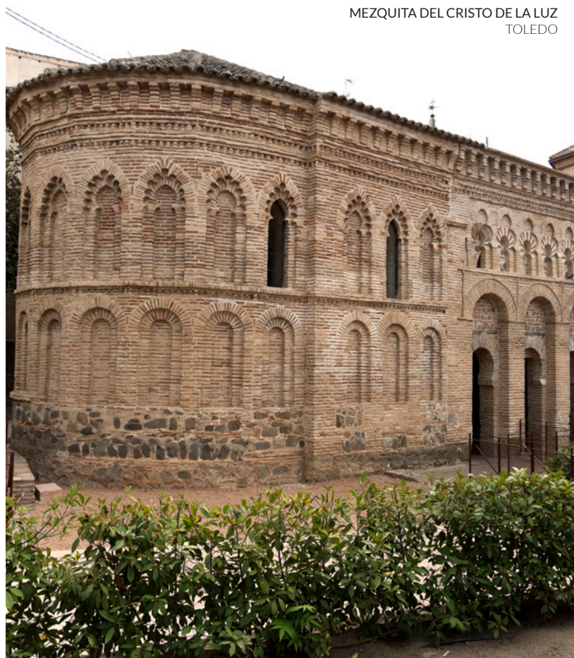
MEZQUITA DEL CRISTO DE LA LUZ TOLEDO