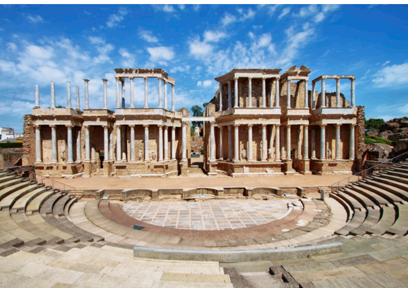
▲ TEATRO ROMANO MÉRIDA

El Museo Nacional de Arte Romano (MNAR) , obra del arquitecto español Rafael Moneo, completa esta ruta con una gran colección de estatuas, bustos y mosaicos que te acercarán a la vida cotidiana de una colonia romana.