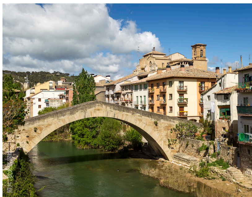
▼ 艾斯特拉-丽萨拉 纳瓦拉

于托莱多的希伯来文化遗产线路。它外部风格简约,内部光线充足,是典型的托莱多式穆德哈尔风格建筑。