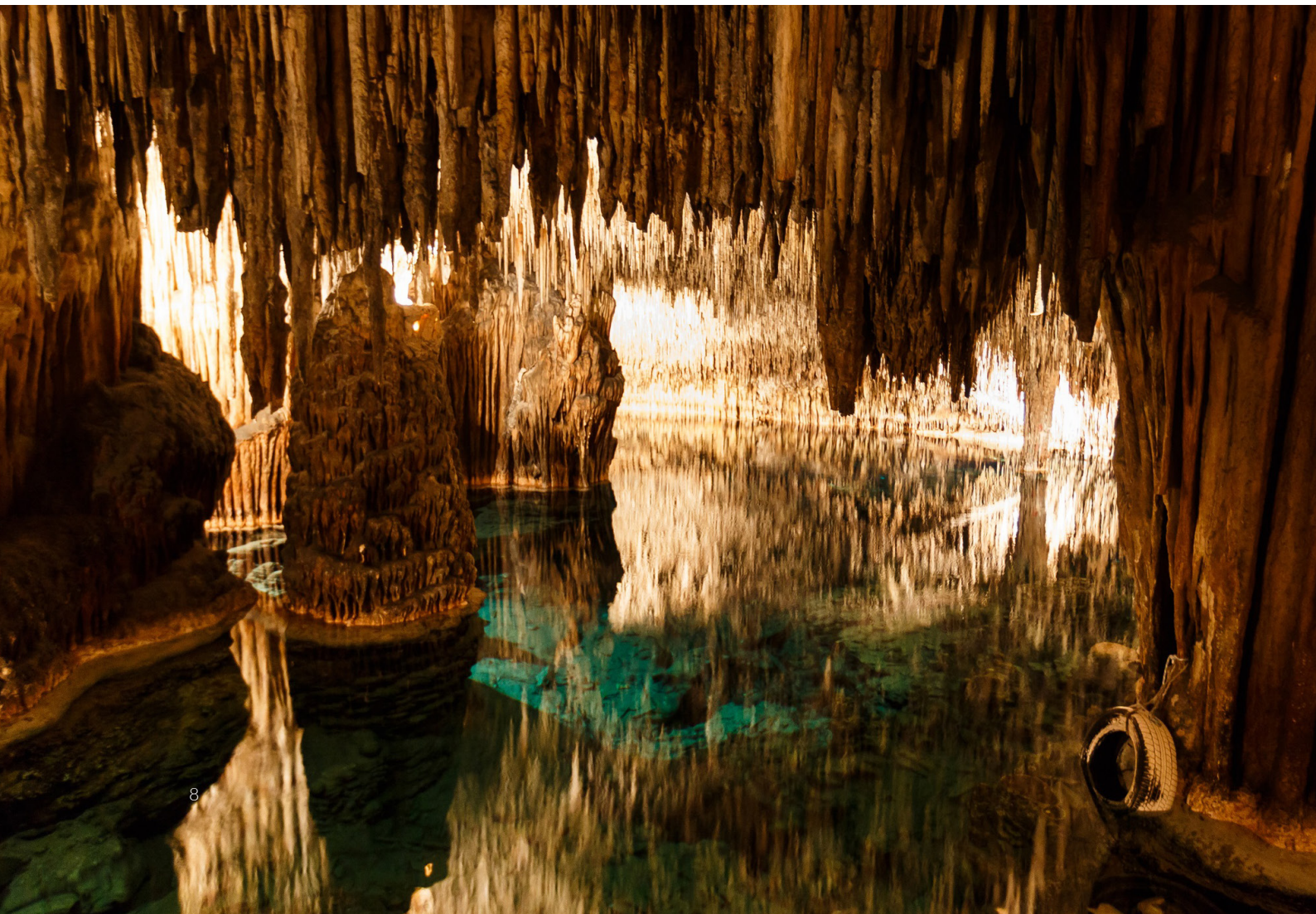
▼ 德拉奇 (DRACH) 洞穴 马略卡

你也可以利用在岛上的时间游览德拉奇 (Drach) 洞穴 (马纳科尔 (Manacor), 马略卡岛)。这里有壮观的地质构造和巨大的地下湖, 每天都会举办古典音乐会。来此游览肯定是一次难忘的体验。