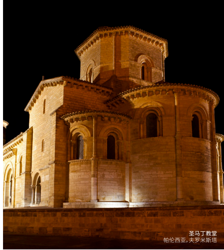
圣马丁教堂 帕伦西亚, 夫罗米斯塔