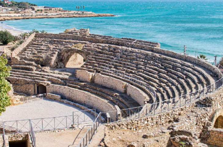
▲ 古罗马圆形竞技场 塔拉戈纳