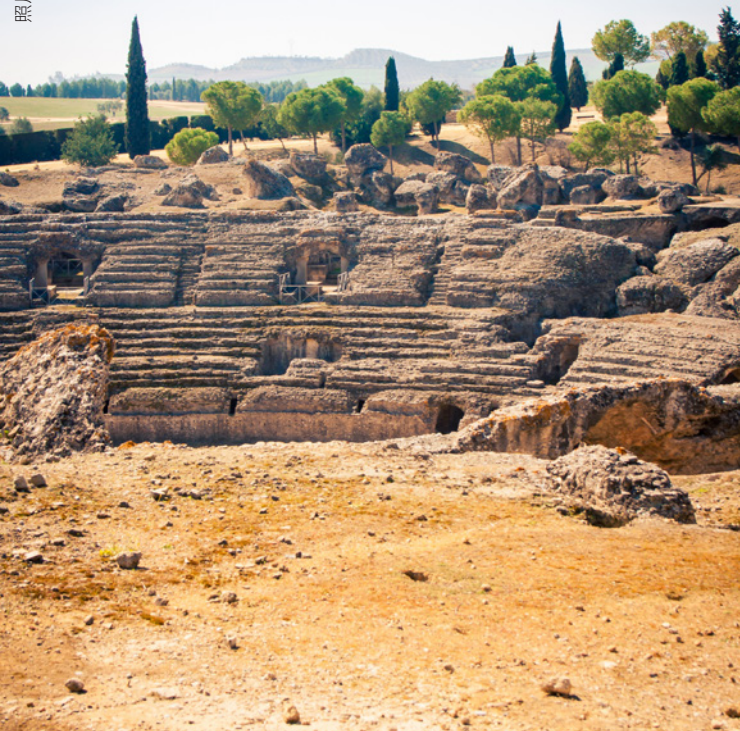
▲ 伊塔利卡考古群 桑蒂蓬塞, 塞维利亚