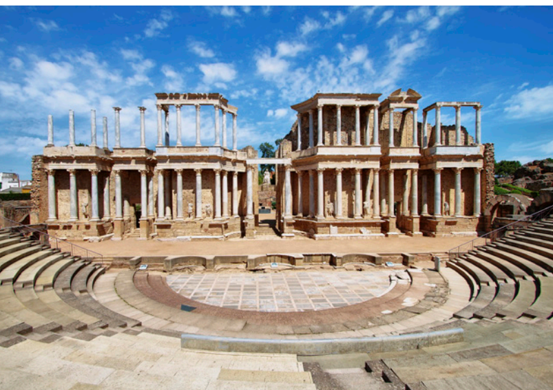
▲ 古罗马剧院 梅里达

国家古罗马艺术博物馆(MNAR)是西班牙建筑师拉斐尔·莫内奥(Rafael Moneo)的作品。这里收藏了大量的雕像、半身像和马赛克,你可以在这里更深入地了解古罗马殖民时期的日常生活。