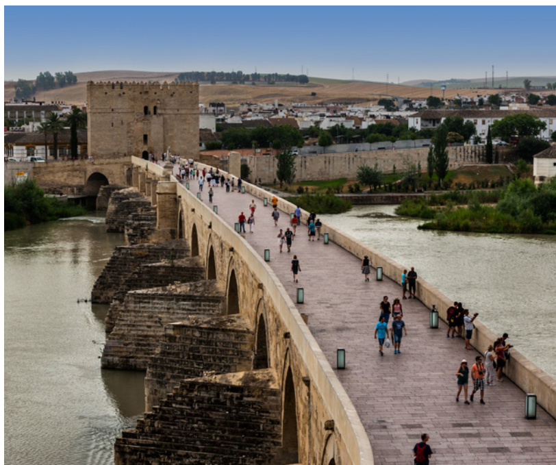
▲ 古罗马桥 科尔多瓦