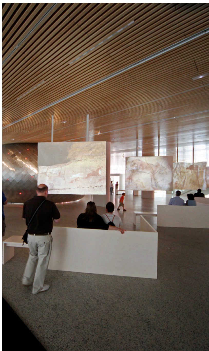
▲ 人类进化博物馆 布尔戈斯

① www.atapuerca.org www.museoevolucionhumana.com