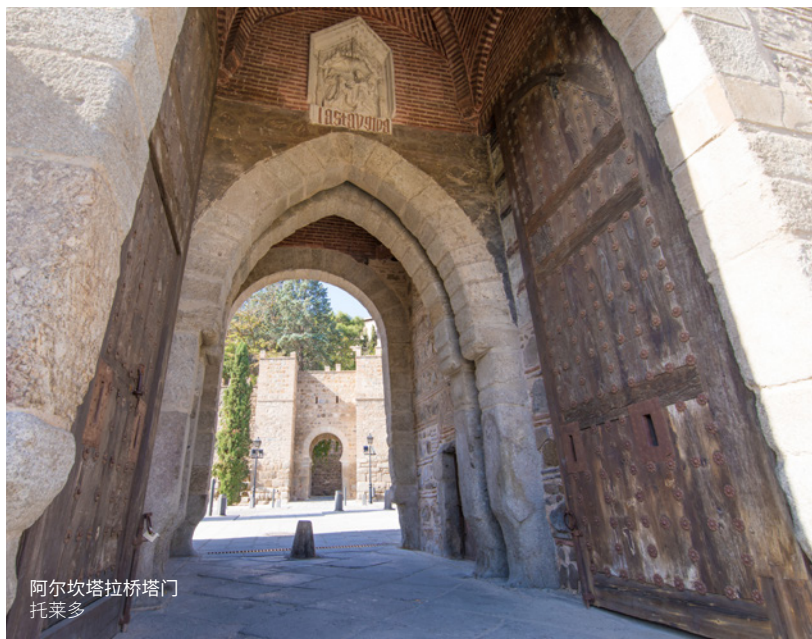
阿尔坎塔拉桥塔门 托莱多

宗教建筑，如修道院和大教堂，是整个西班牙文化中最丰富的文化遗产。比如位于本塔德瓦尼奥斯（Venta de Baños）（帕伦西亚（Palencia），卡斯蒂利亚和莱昂）的圣胡安包蒂斯塔教堂（San Juan de Baños）、位于埃尔坎皮略（El Campillo）（萨莫拉（Zamora），卡斯蒂利亚莱昂）的圣佩德罗（San Pedro de la Nave）教堂以及位于圣米良德拉科戈利亚（San Millán de la Cogolla）（拉里奥哈（La Rioja））的苏索修道院（San Millán de Suso）等，被誉为卡斯蒂利亚的文化摇篮。