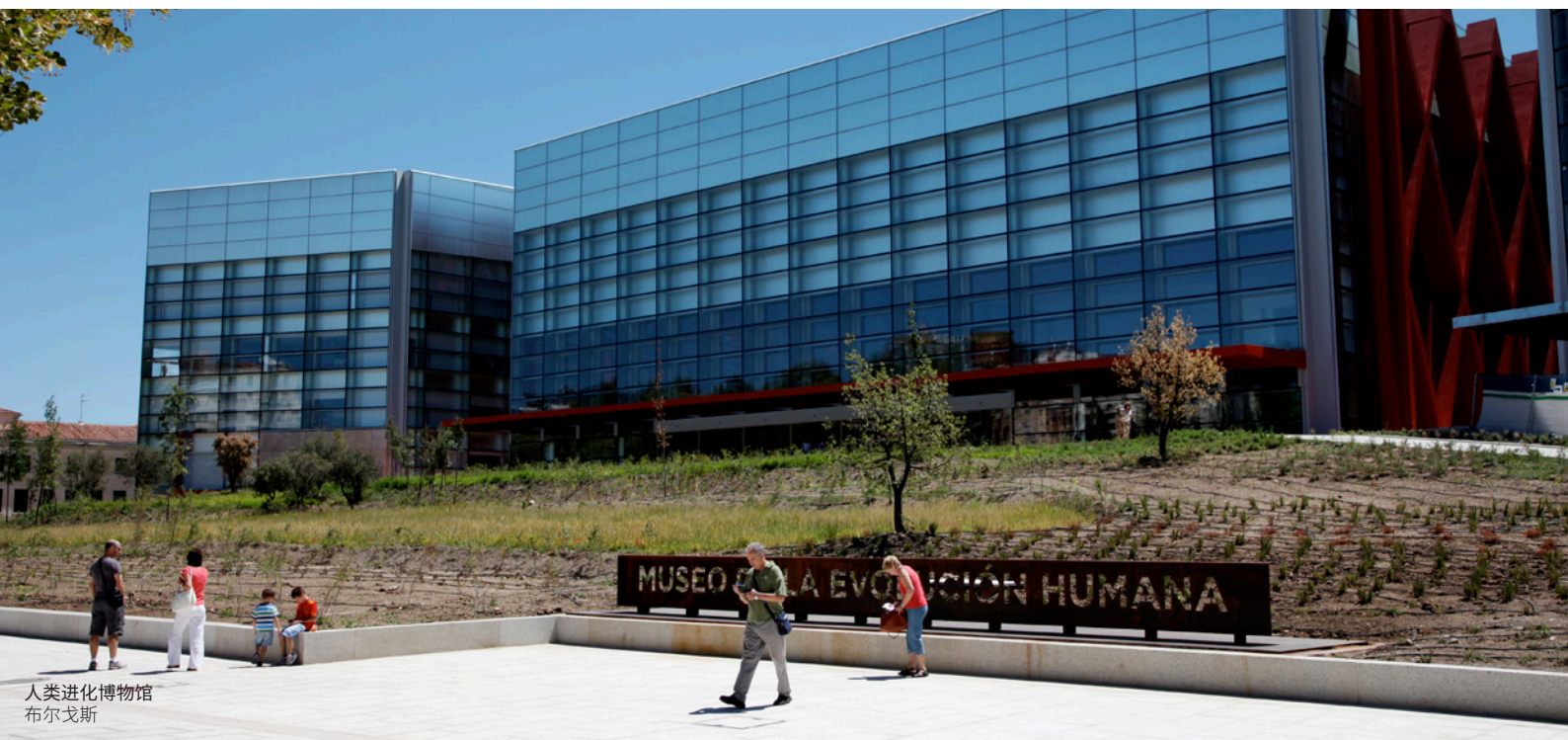
人类进化博物馆 布尔戈斯

请搭上我们的时光机, 通过曾统治这片土地的不同文明探索西班牙的文化遗产。你将有机会一睹史前的居住地、腓尼基大船、古罗马城墙和许多其他文化遗产。