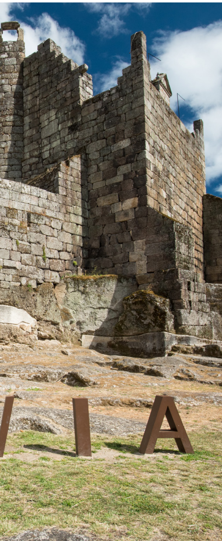
▲ RIBADAVIA城堡 欧伦塞