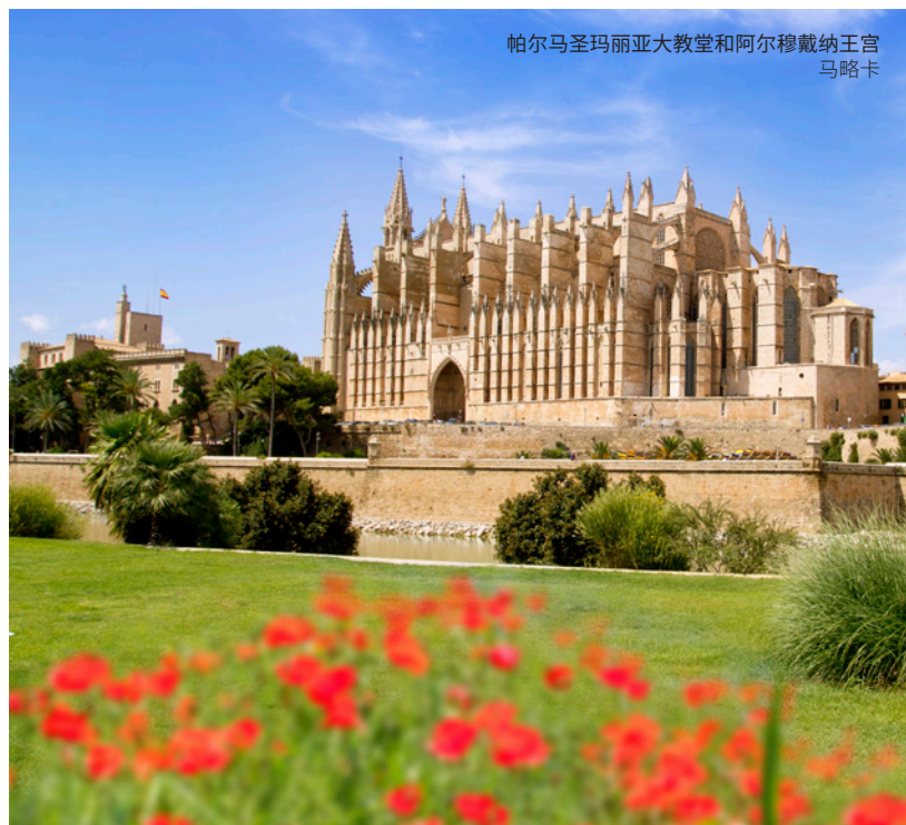
帕尔马圣玛丽亚大教堂和阿尔穆戴纳王宫 马略卡

马约卡市(Madina Mayurqa)曾是阿里莫拉维德王朝重要的城市中心。你可以参观这里的阿尔穆戴纳王宫(Palacio de la Almudaina), 宫殿是在基督教征服该岛后重建的, 来到这里感受马略卡首府民间力量的象征。此外, 在参观期间你还可以看到穆斯林时代的遗迹, 如浴室、塔楼和德拉萨纳拱门(Arco de la Drassana)建筑群。你可以通过马略卡博物馆(Museo de Mallorca)和阿拉伯浴池的考古遗迹了解这座城市的历史。热水浴室仍然保存完好, 12根柱子支撑着一个带有各种圆形开口的圆顶。