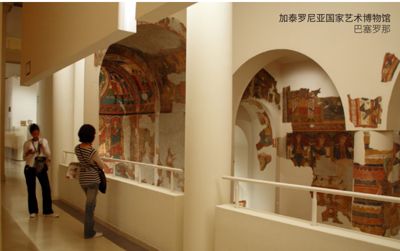
加泰罗尼亚国家艺术博物馆 巴塞罗那