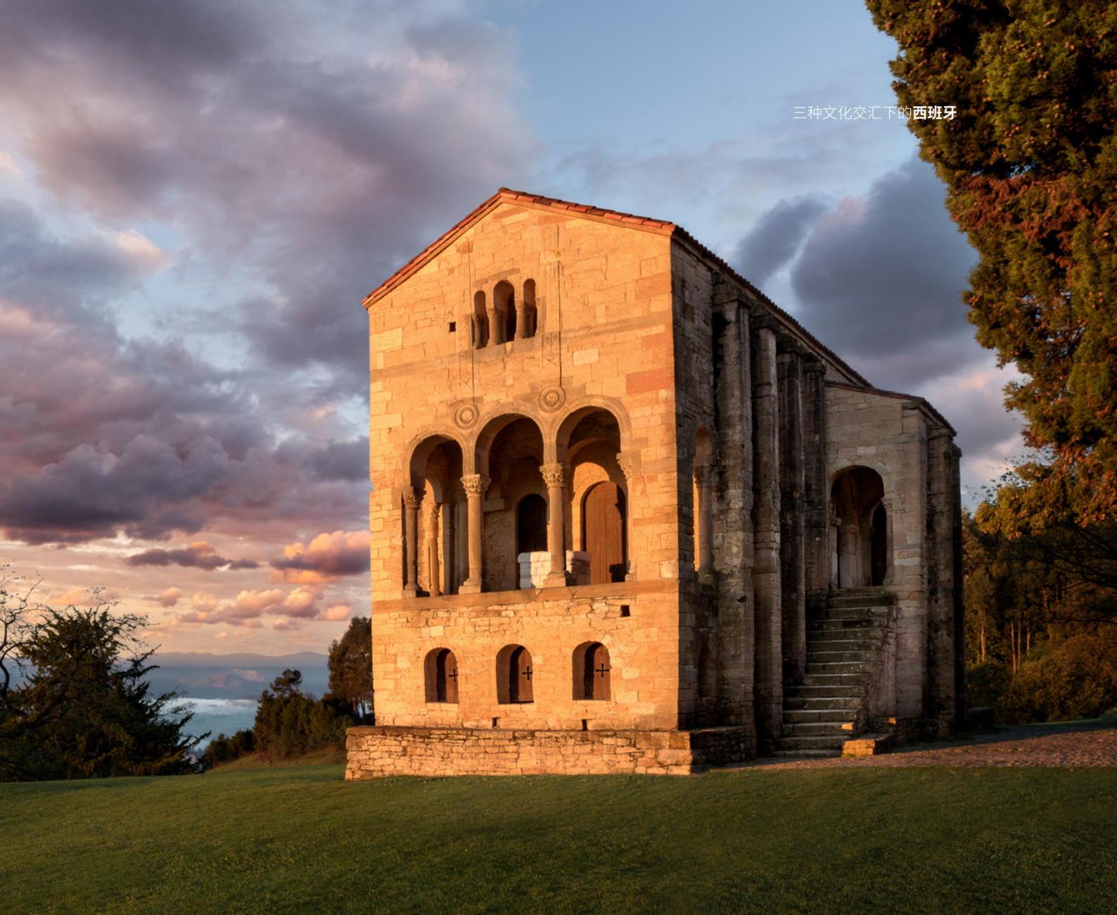
▲ 圣玛利亚德尔那朗科 奥维耶多