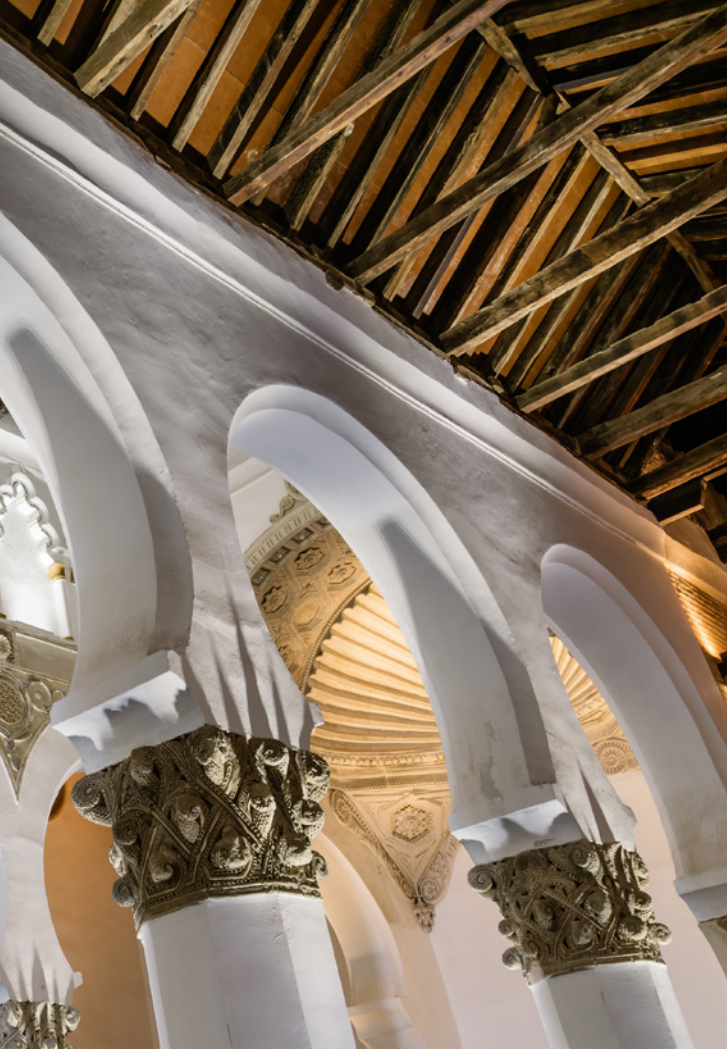
▲ 白色圣母犹太教堂 托莱多

塔中,从高处你可以俯瞰城市及古迹的全景。游览中心包括一个典型住宅、一个花园凉亭和阿蒙哈德王朝的防御工事塔。