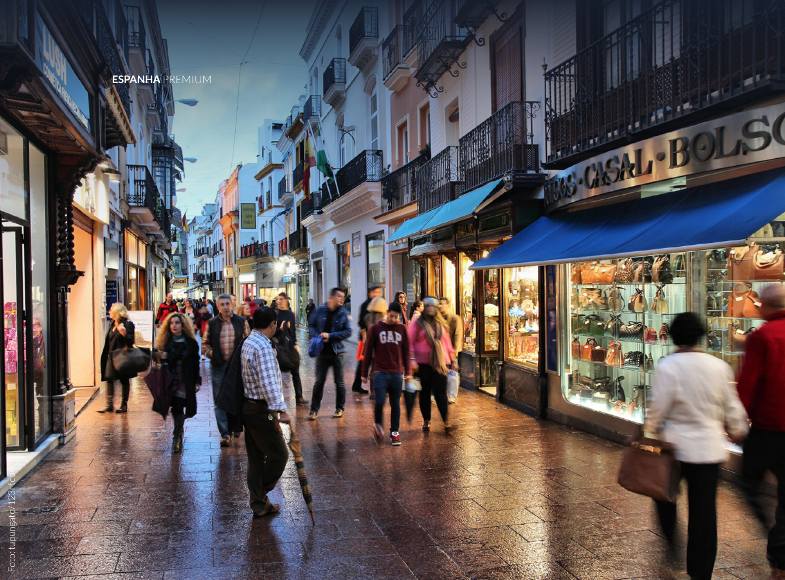
▲ RUA SIERPES SEVILHA