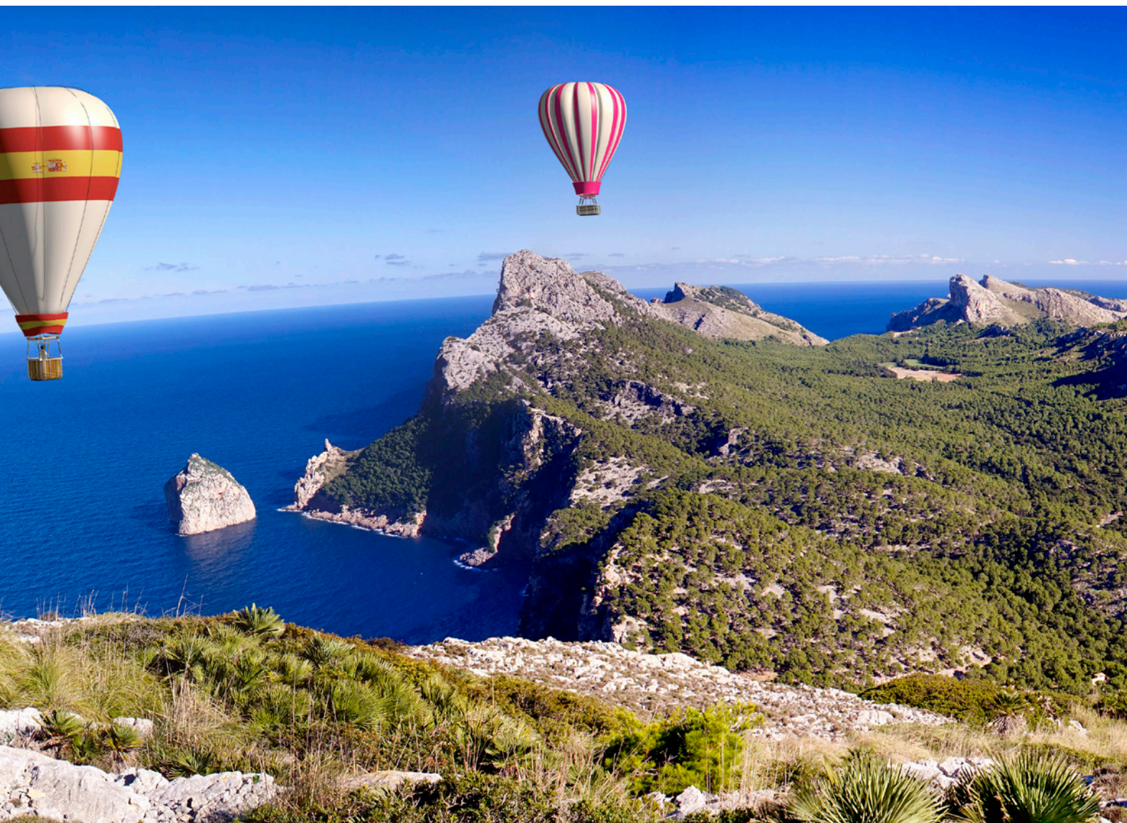
▲ MONGOLFIERE SU MAIORCA