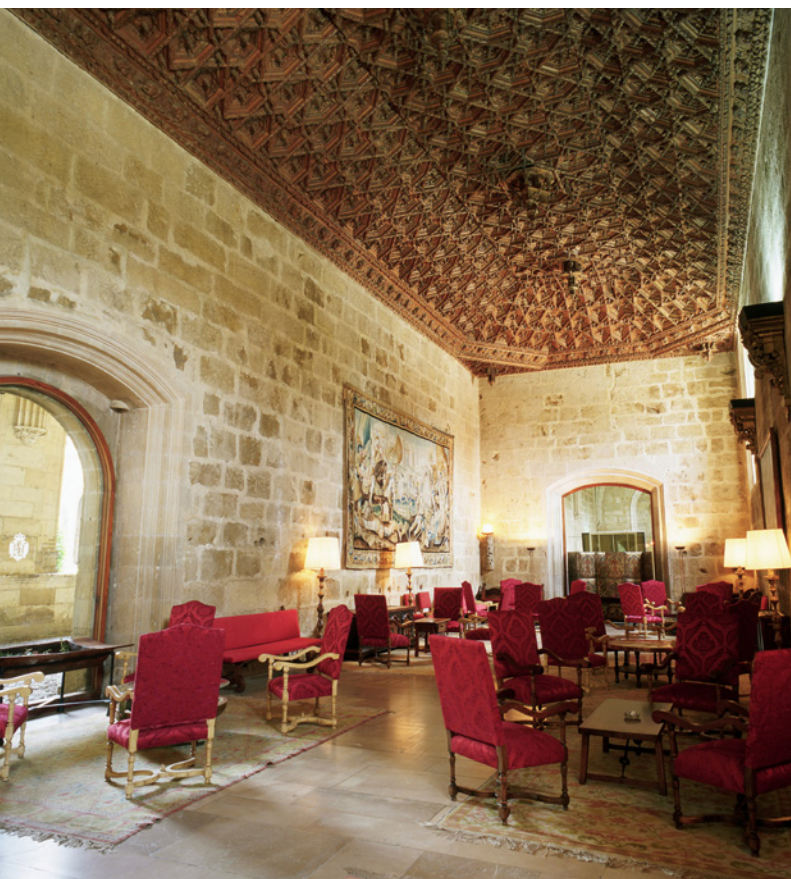
▲ 古堡酒店 莱昂

在西班牙的不同地区你都可以找到特色迷人的住宿。不管你选择去哪里，都会让你惊艳无比。其中最奢华的会为你提供如私人按摩，内设土耳其浴并且可以看见风景的套房，私人厨师，独立菜园等等。在安达卢西亚的农舍中体验正宗浓郁的西班牙风味吧。这些迷人的有着精心装点的白墙房屋，橄榄油的田野以及橙花的清香，为你的身心放松提供最舒适的环境。在阿斯图里亚斯的贵族老宅或者加利西亚乡间别墅中，观赏环绕的群山与大海吧。或者你还可以选择住在位于极富个性的古老建筑中的 Extremadura 旅舍。