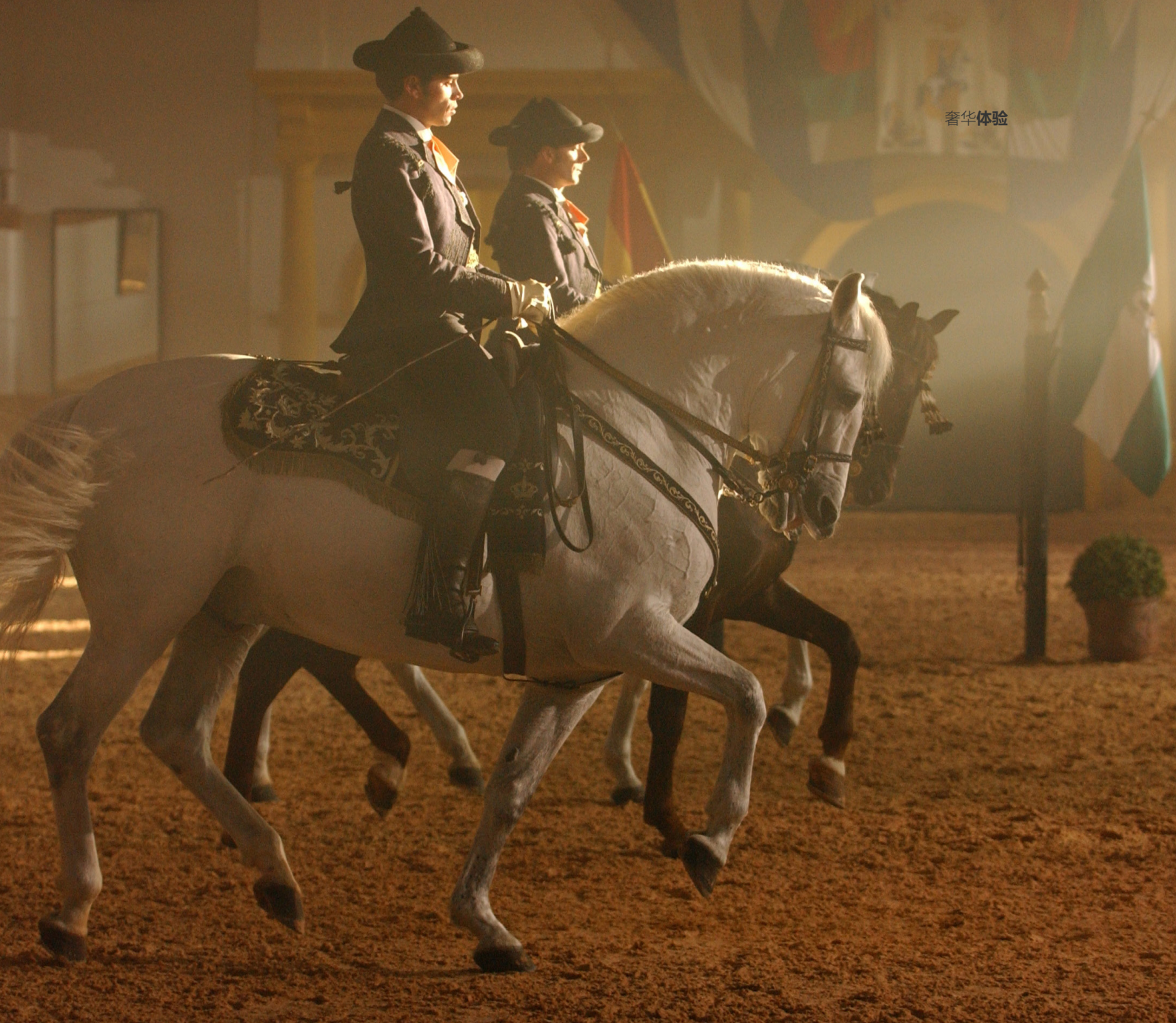
▲ 安达鲁西亚皇家马术学校 赫雷斯-德拉弗龙特拉