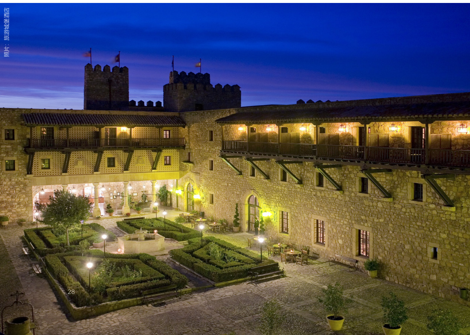
▼ 希昆萨城堡酒店 瓜达拉哈拉

你也可以租用私人别墅，这里你可以在一个只属于你和你旅伴的空间内享受高端的住宿和私密的氛围。此外你还可以享受绝佳的运动设施及各种服务，从厨师到个人休闲计划应有尽有。