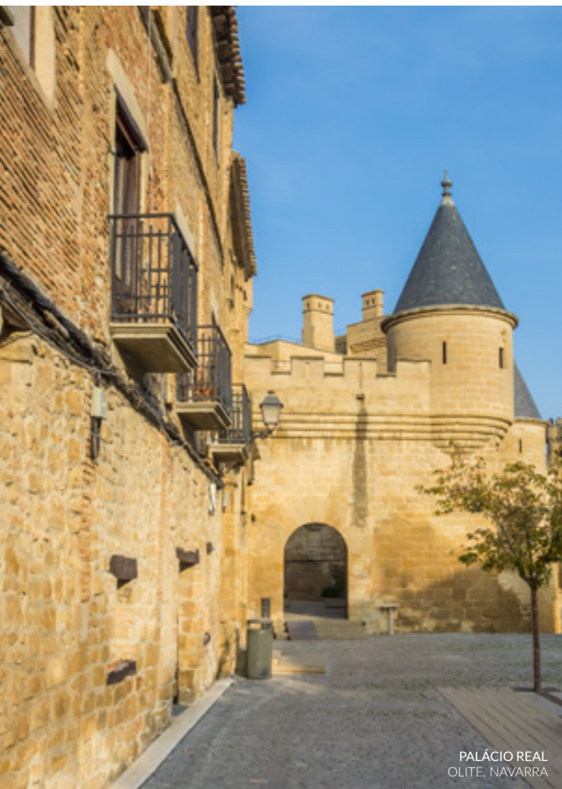
PALÁCIO REAL OLITE, NAVARRA