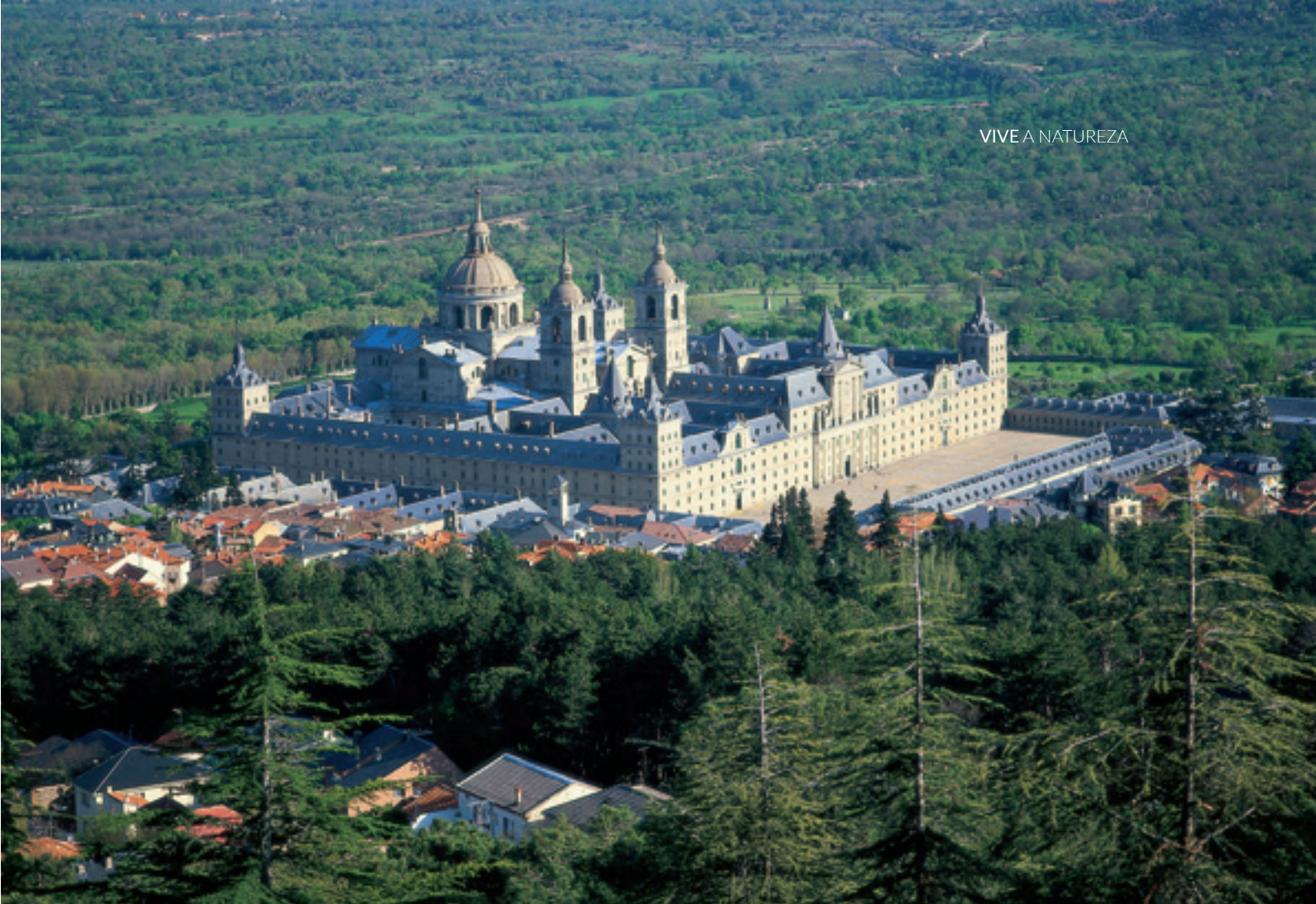
▲ EL ESCORIAL