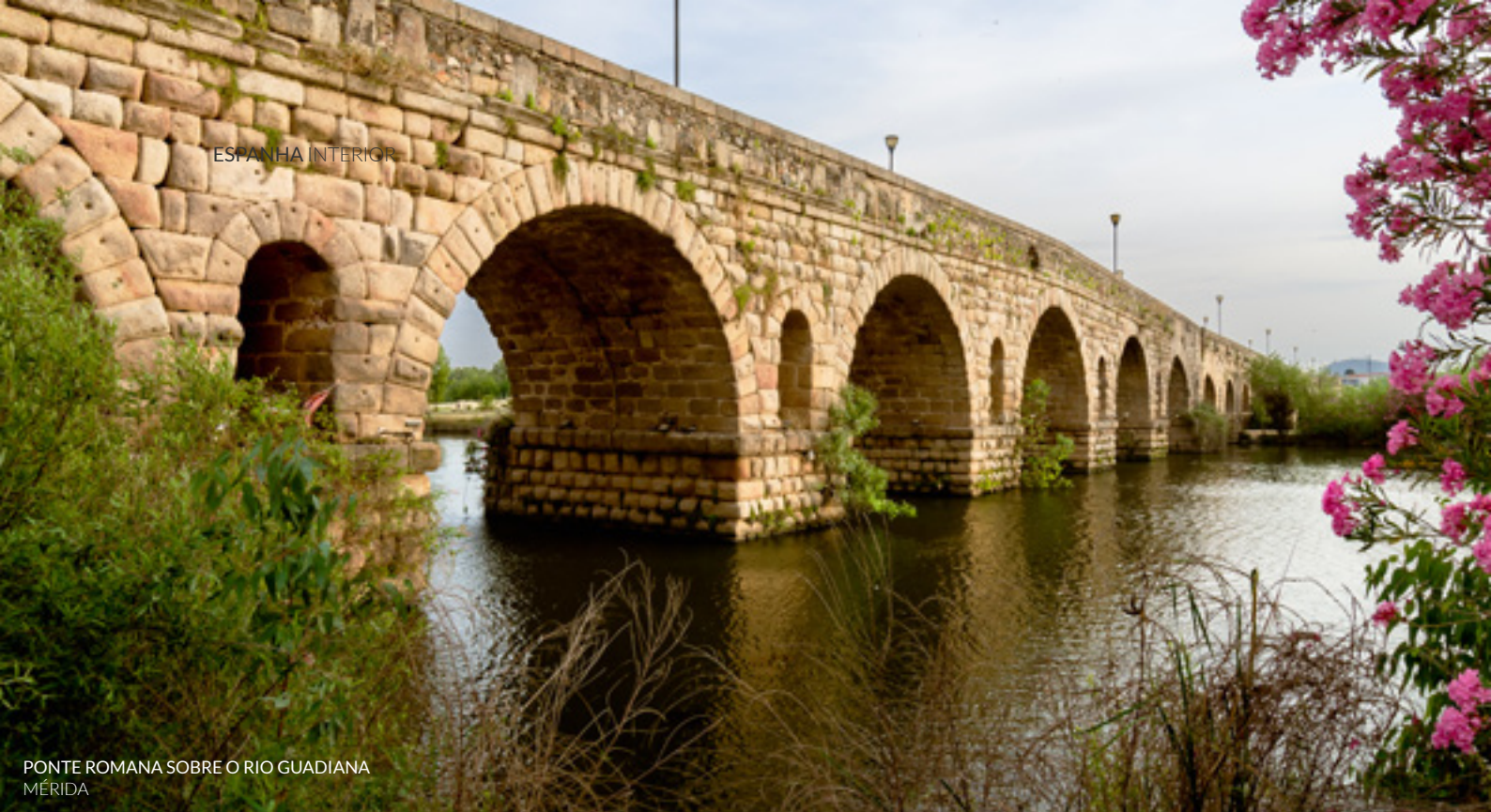
PONTE ROMANA SOBRE O RIO GUADIANA MÉRIDA

Na Extremadura visita o centro histórico de Cáceres , com as suas casas-fortaleza medievais e Mérida (Badajoz), para descobrires o seu valioso passado romano.