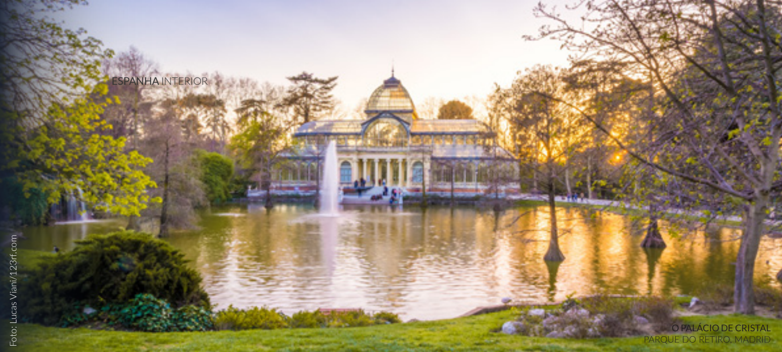
O PALÁCIO DE CRISTAL PARQUE DO RETIRO, MADRID