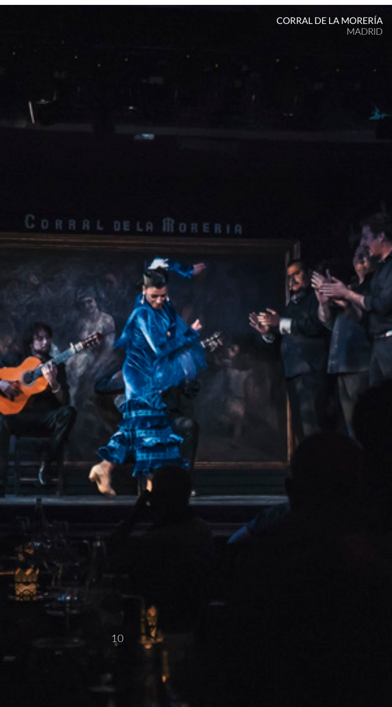
CORRAL DE LA MORERÍA MADRID