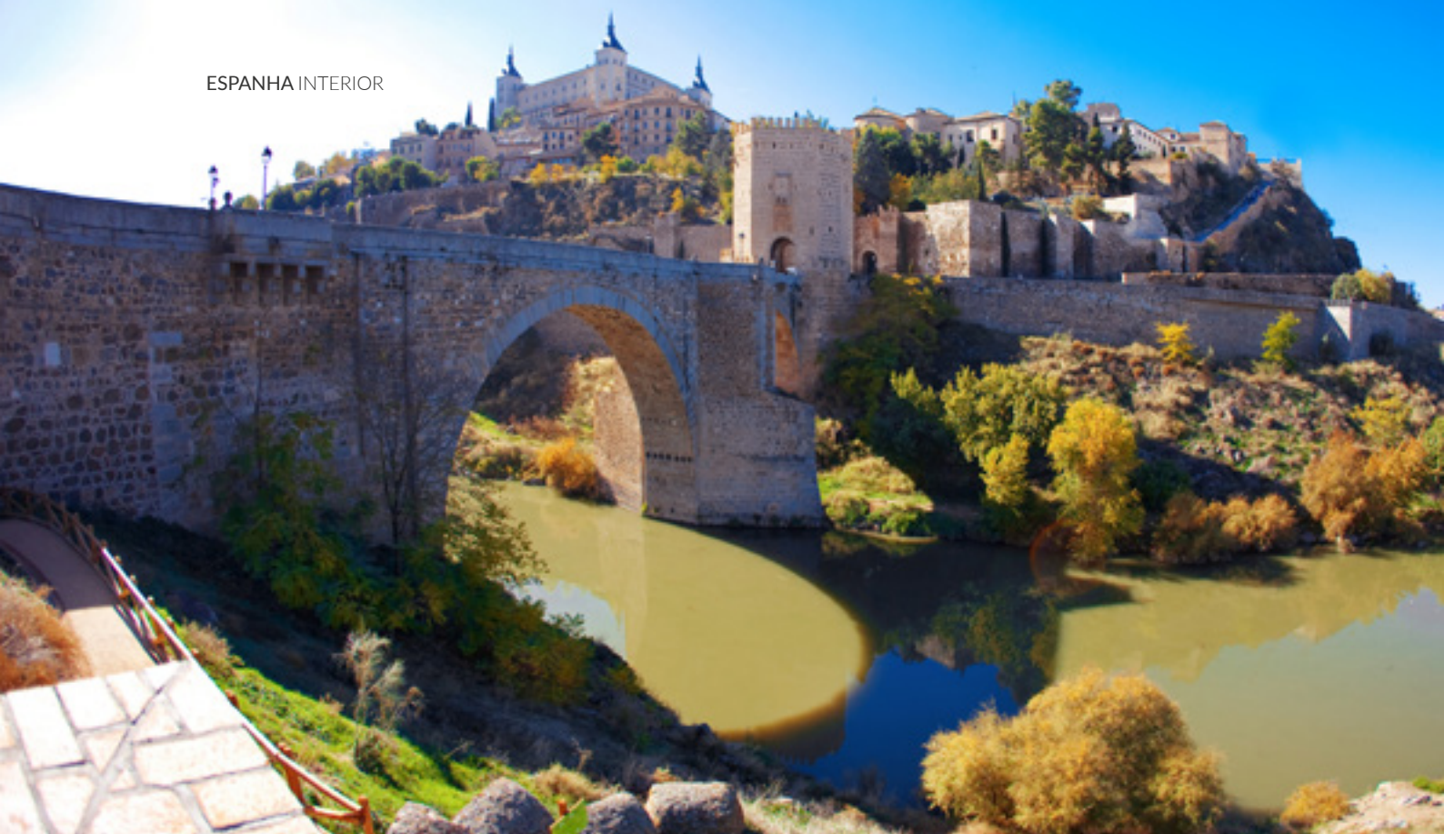
▲ PONTE DE ALCÁNTARA TOLEDO