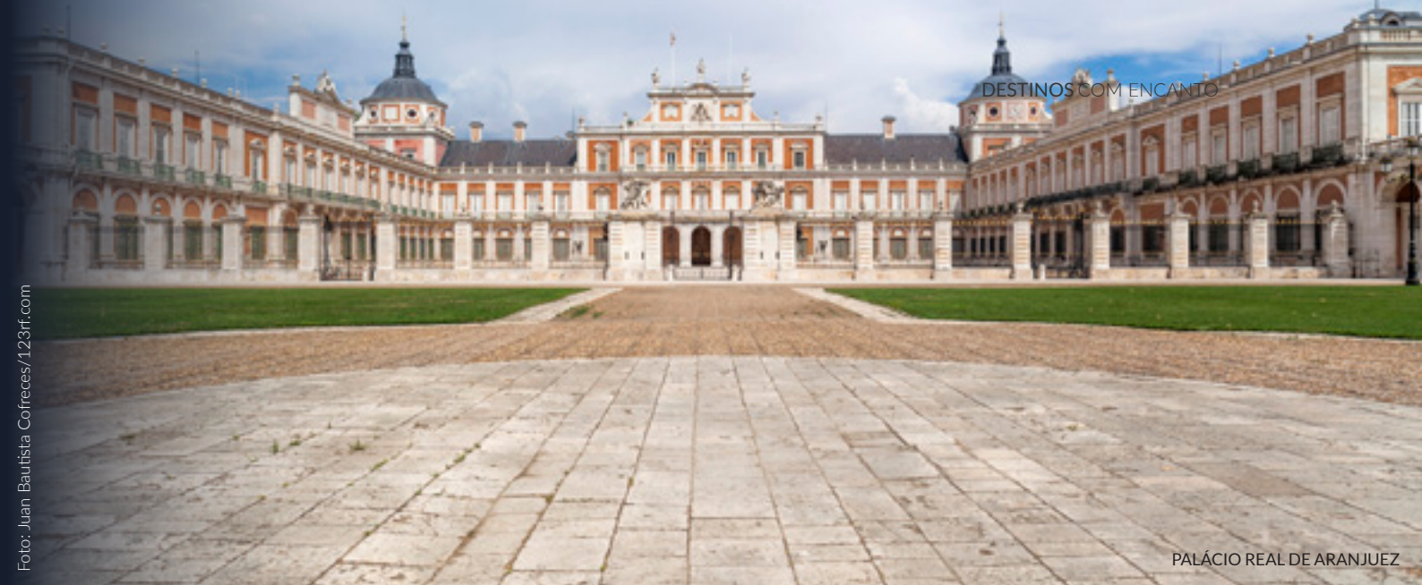
PALÁCIO REAL DE ARANJUEZ