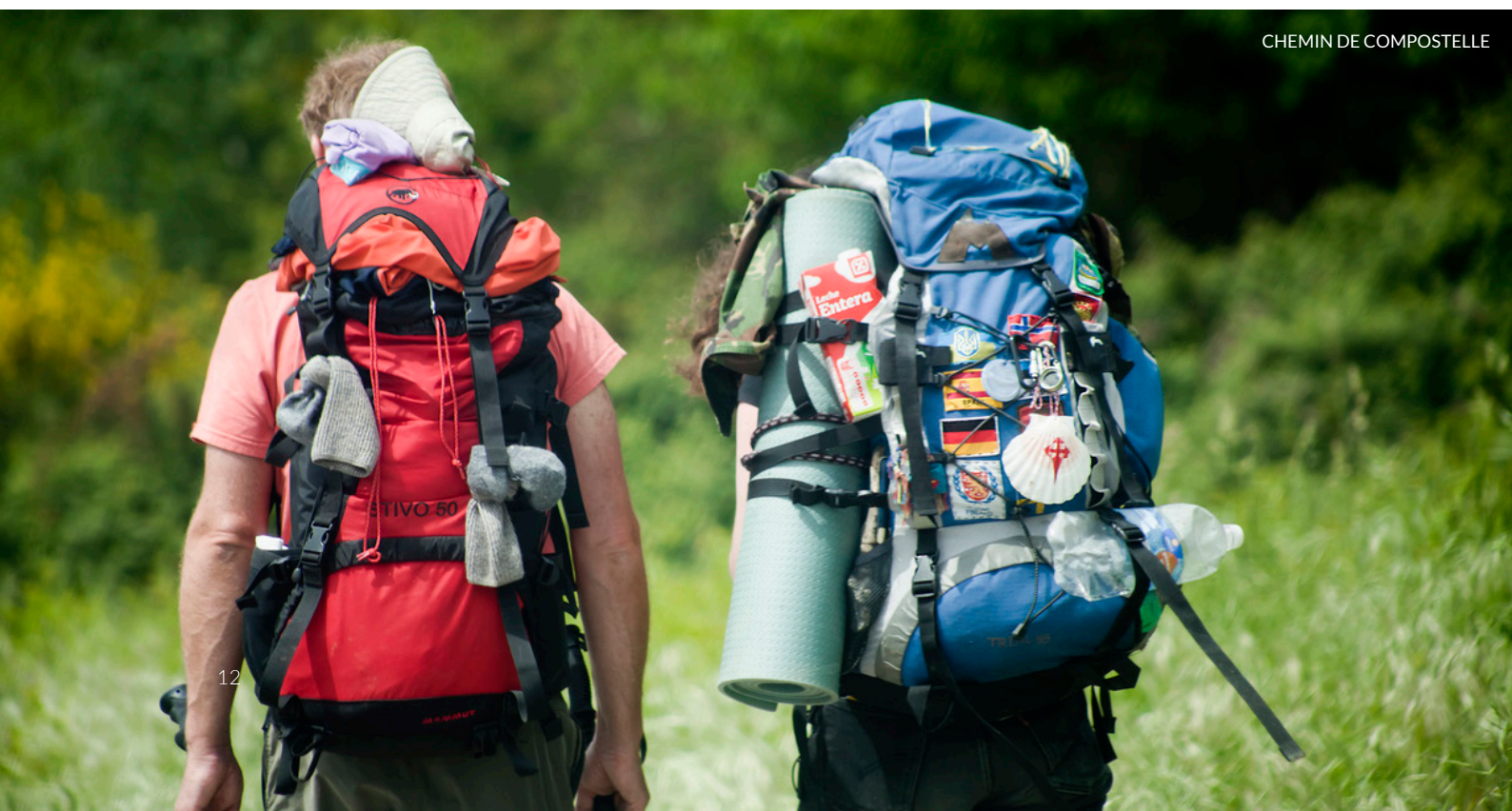
CHEMIN DE COMPOSTELLE

L'automne est la saison idéale pour découvrir le centre de cette région. À cette période, ses villages de charme, comme Olite , célèbrent la fête des vendanges avec des activités autour du vin, des lâchers de vachettes, des parades de chars et de nombreux concerts.