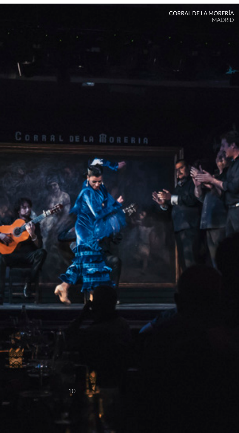
CORRAL DE LA MORERÍA MADRID