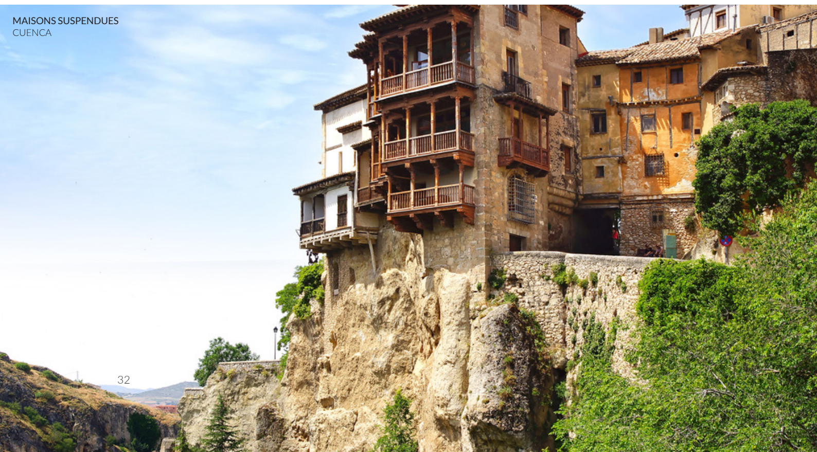
MAISONS SUSPENDUES CUENCA

XV e siècle dont les balcons en bois surplombent les gorges du Huécar. La visite de Tolède est tout aussi inoubliable. Connue comme la ville des trois cultures, son patrimoine architectural unique reflète le passage des Chrétiens, des Arabes et des Juifs.