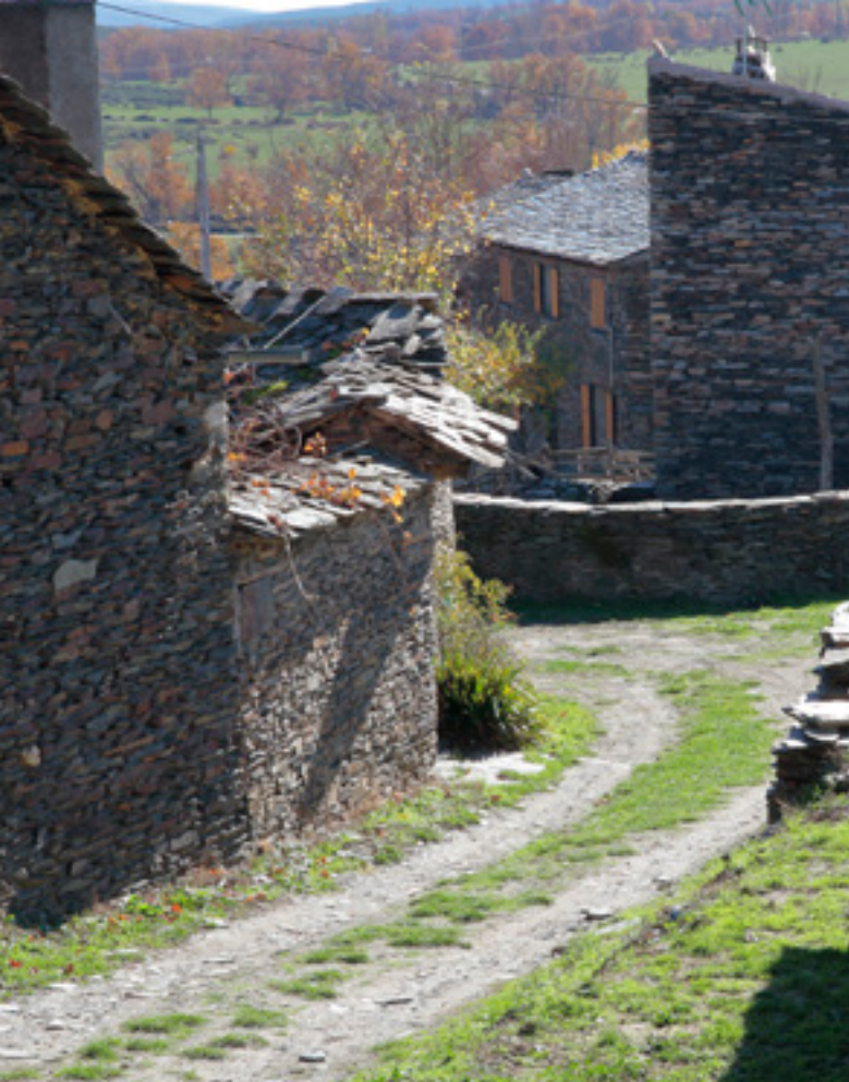
▲ CAMPILLO DE RANAS GUADALAJARA

fil des siècles par l'eau, le vent et la glace. La province de Guadalajara vous invitera également à découvrir son environnement naturel en visitant ses célèbres villages noirs (principalement construits à partir d'ardoise). Sa capitale conserve d'intéressants exemples d'architecture civile, notamment le palais de l'Infant, ou religieuse, comme l'église baroque jésuite San Nicolás el Real.