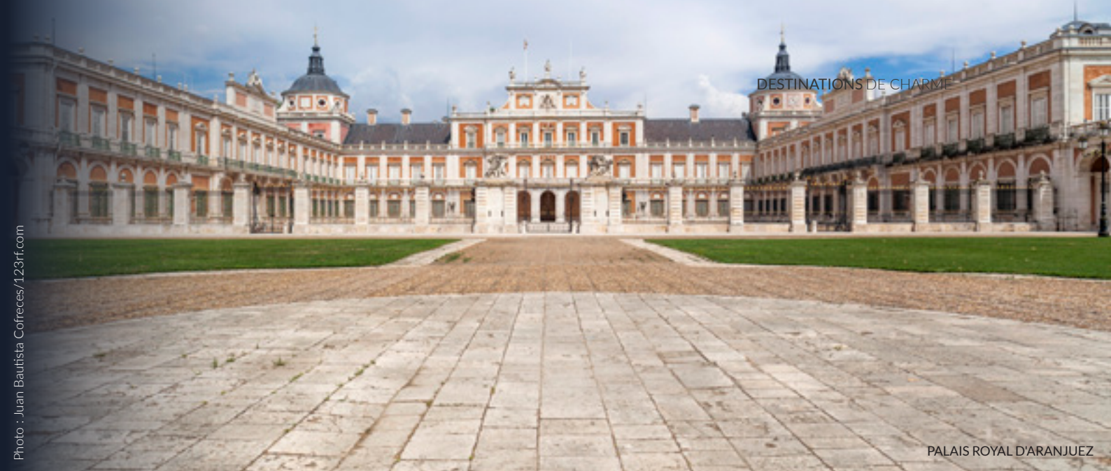
PALAIS ROYAL D'ARANJUEZ