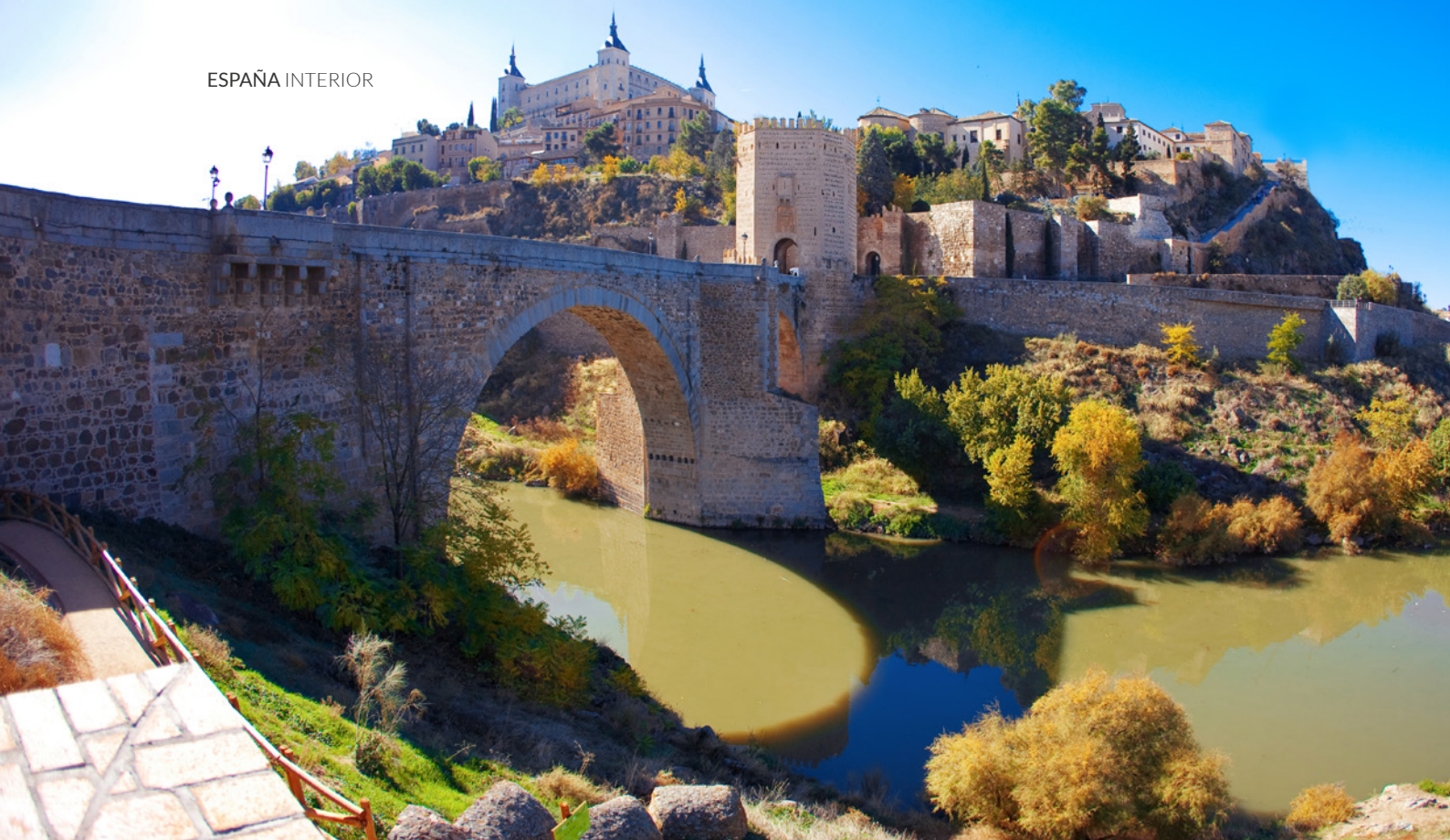
▲ PUENTE DE ALCÁNTARA TOLEDO