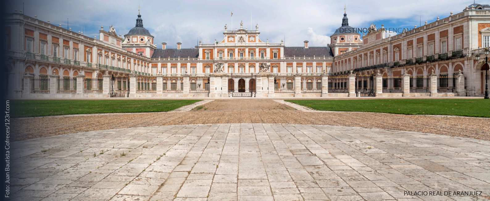
PALACIO REAL DE ARANJUEZ