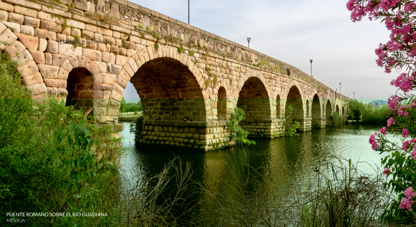
PUENTE ROMANO SOBRE EL RÍO GUADIANA MÉRIDA

En Extremadura, acércate hasta el casco antiguo de Cáceres , con sus casas-fortaleza medievales y a Mérida (Badajoz) para descubrir su valioso pasado romano.