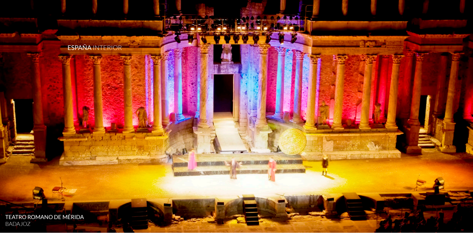
TEATRO ROMANO DE MÉRIDA BADAJOZ

Si te gusta la música indie , reserva tus entradas para el Festimad , el Festival Independiente de Madrid, que se celebra en abril. Cada año acoge a los grupos más relevantes del panorama actual y sirve de plataforma para grupos emergentes. Vayas en la época que vayas, la agenda cultural de Madrid te enamorará. Tienes una amplia oferta, desde grandes teatros donde verás los más famosos musicales a centros culturales de vanguardia, como el Matadero .