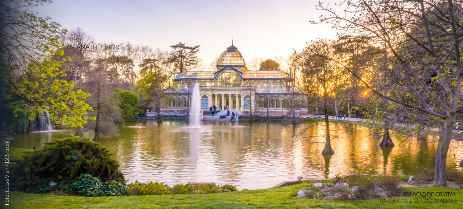
EL PALACIO DE CRISTAL PARQUE DEL RETIRO, MADRID