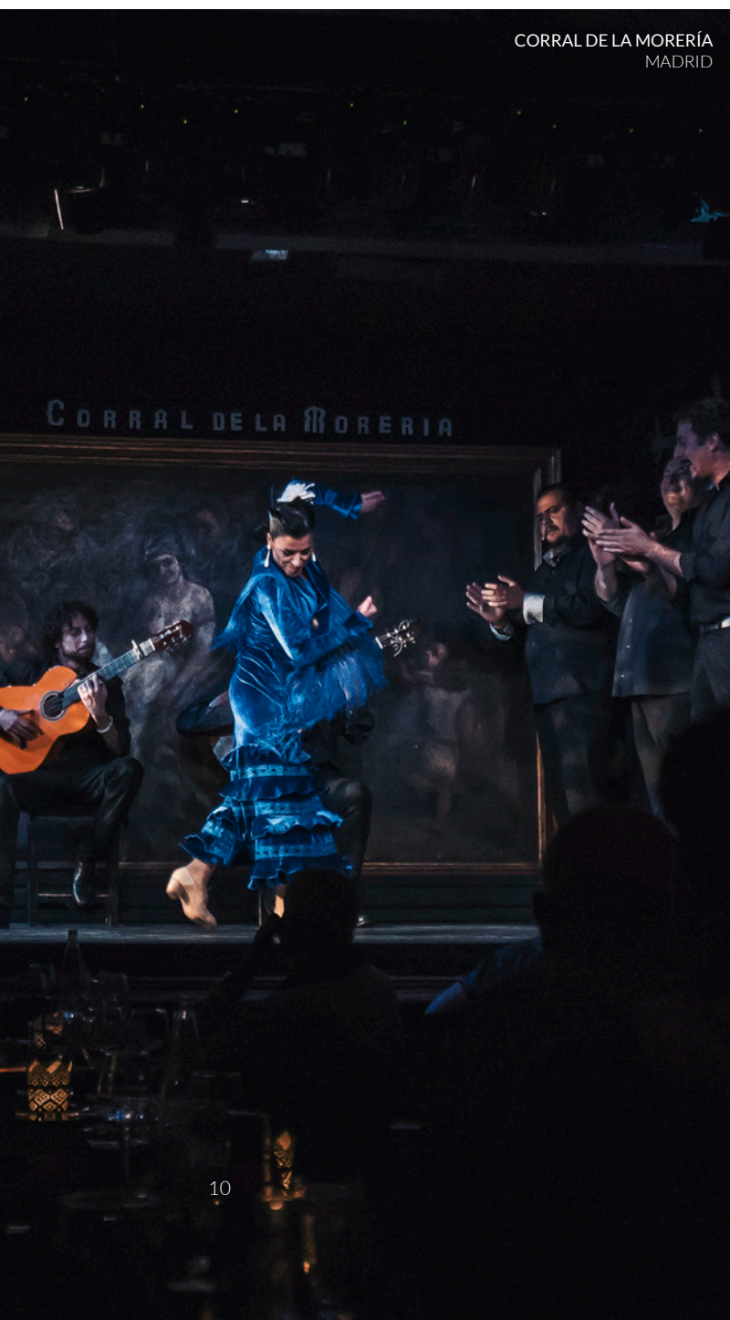
CORRAL DE LA MORERÍA MADRID