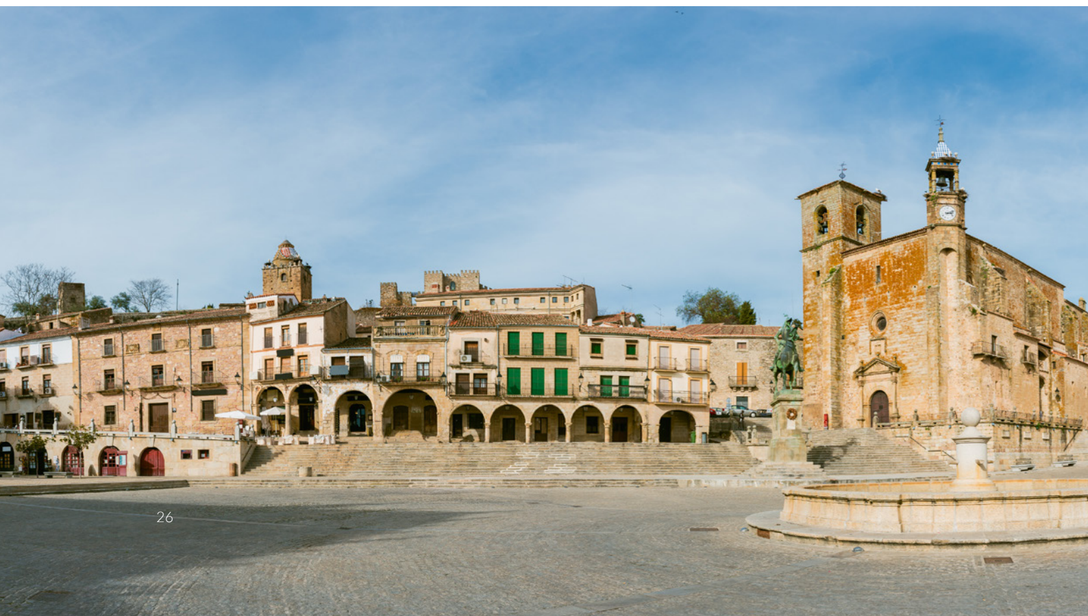
▼ PLAZA MAYOR DE TRUJILLO CÁCERES

Si vas a Huesca (Aragón) en verano tienes dos citas gastronómicas: el Día de la longaniza de Graus (julio) y la Fiesta del Cordero de Cerler (agosto).