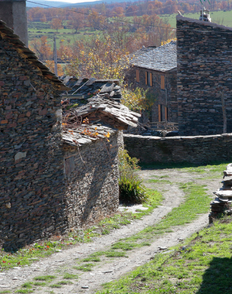
▲ 坎皮略德拉纳斯 瓜达拉哈拉

因其数个世纪以来由水、风和冰造成的形态各异的岩石而闻名。到瓜达拉哈拉,你可以探索周围的自然风光,也可以参观充斥着黑色建筑的著名村落,这里的建筑以黑板为最主要的建筑材料,以此得名。地区首府保留着很有趣的民用建筑的典范,比如因凡达多(Infantado)宫殿以及宗教建筑,比如巴洛克式的圣尼古拉斯埃尔雷阿尔(San Nicolás el Real)教堂。