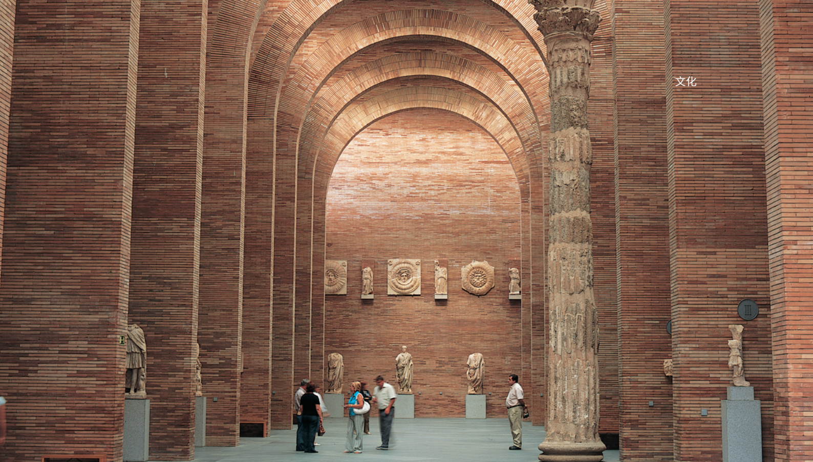
▲ 古罗马艺术国家博物馆 梅里达

在莱昂，你可以参观卡斯蒂亚和莱昂当代艺术博物馆 (MUSAC)，这座博物馆充满着生机和活力，一定能让你体会到与众不同的艺术之旅。不用离开卡斯蒂亚和莱昂大区，就可以参观布尔戈斯的人类进化博物馆，了解有关人类起源的方方面面。在这处宏伟而现代的科教中心，还展出阿塔普埃尔卡山 (Atapuerca) 遗迹中的考古发现。