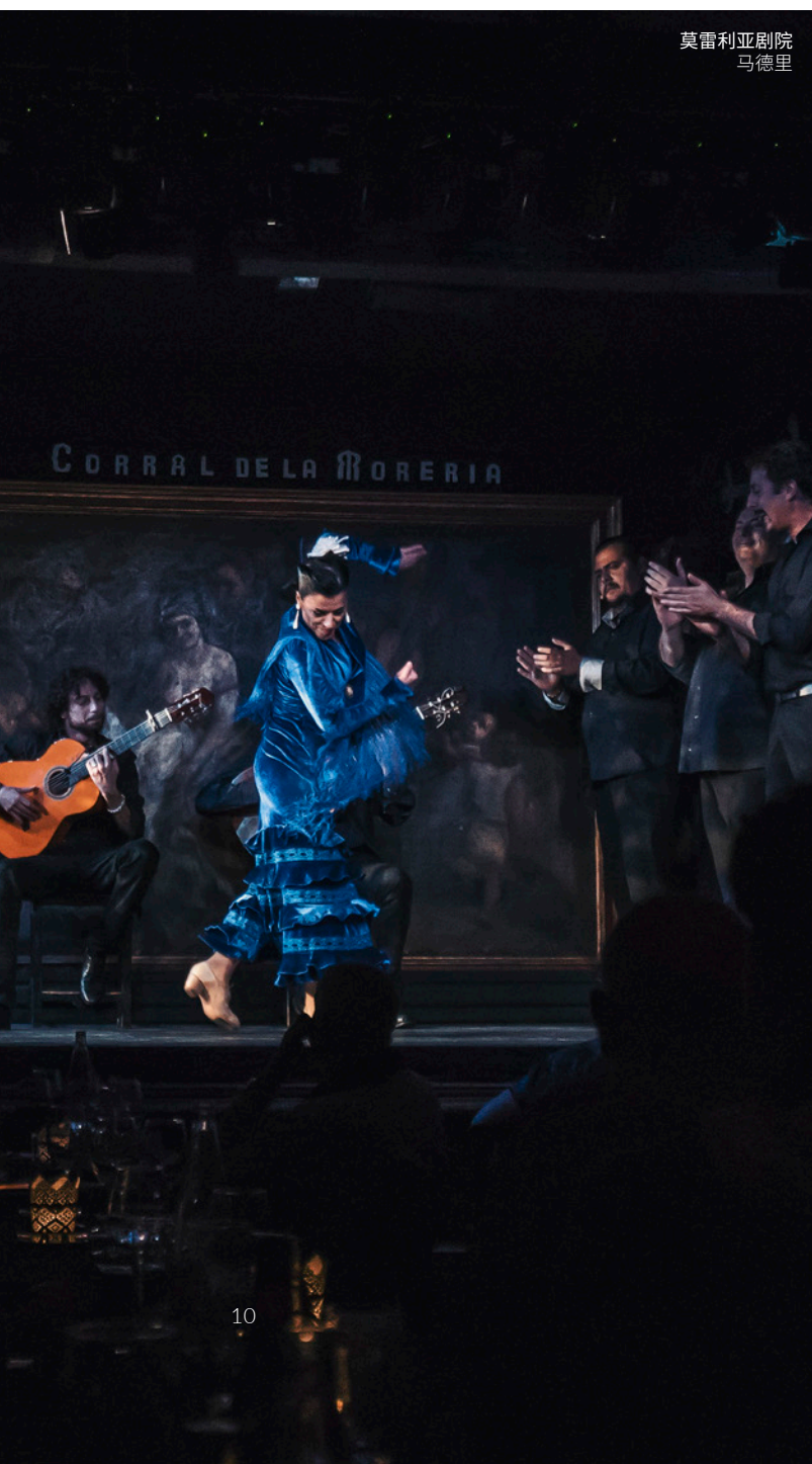
莫雷利亚剧院 马德里