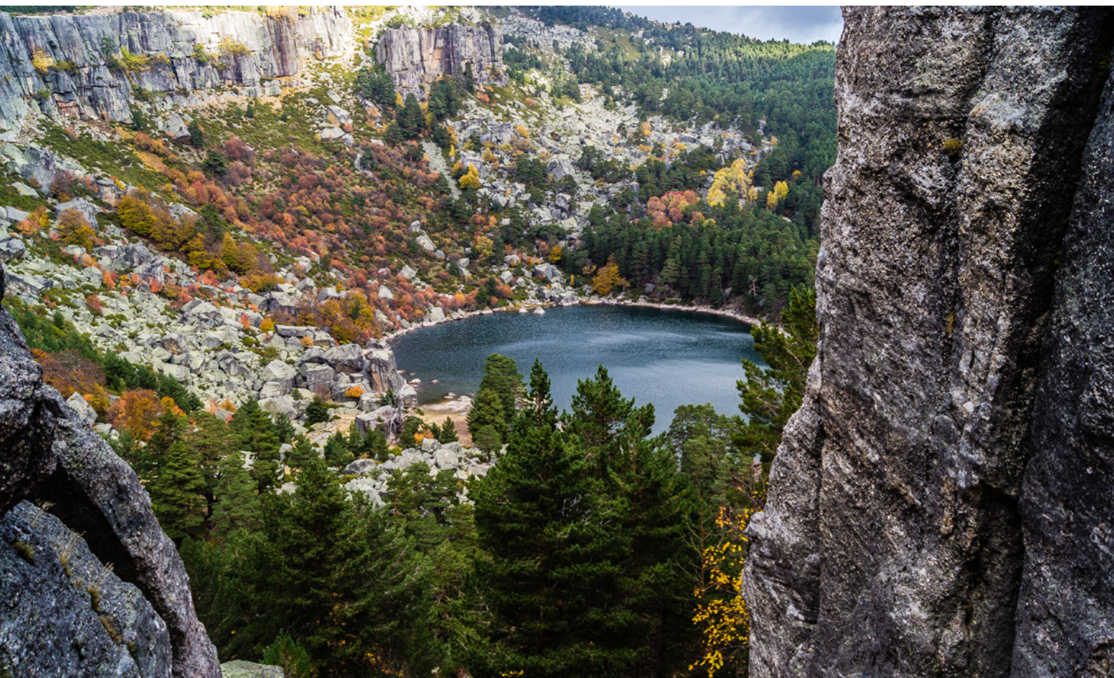
▼ 乌尔比翁山和黑湖自然公园 索里亚

萨莫拉和帕伦西亚(Palencia)省的古罗马历史文化遗产会让你叹为观止。巴亚多利德文艺复兴风格的美丽的老城区以及索里亚蜿蜒曲折的中世纪街道一定能让你着迷。