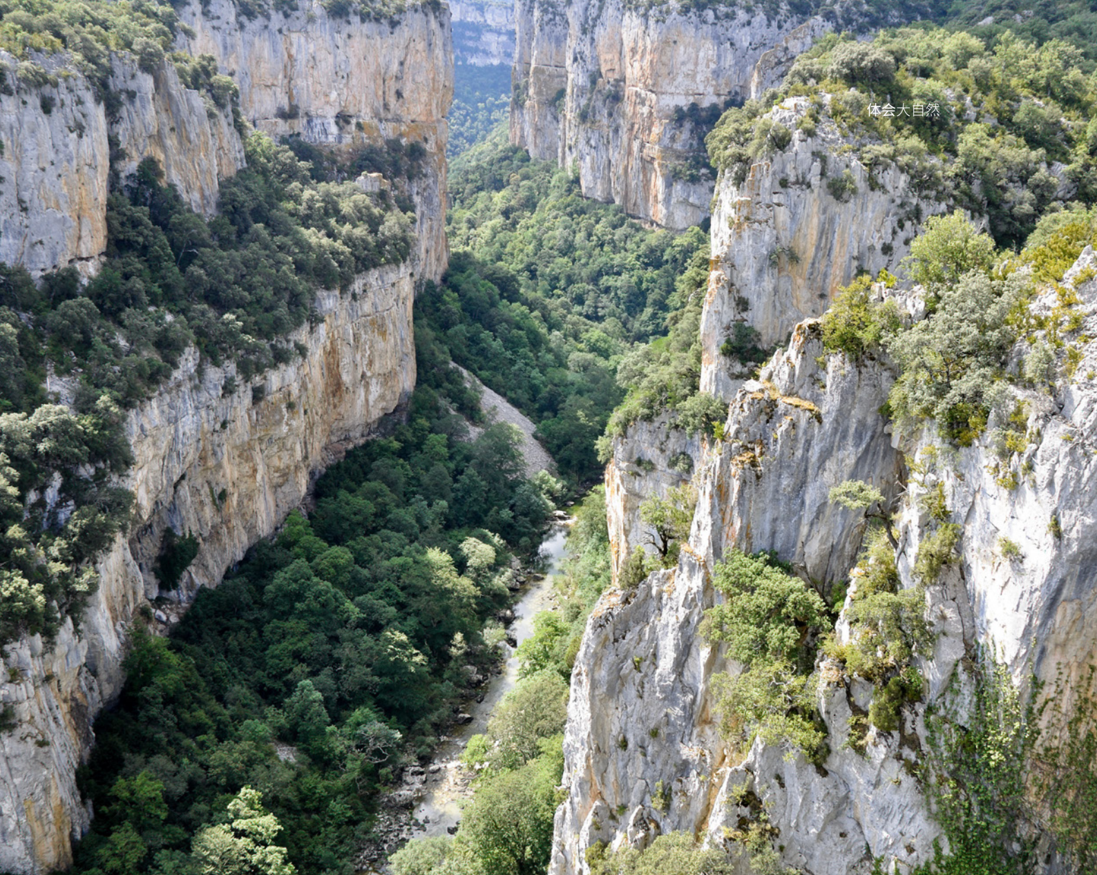
▲ 弗斯德隆比埃尔 纳瓦拉