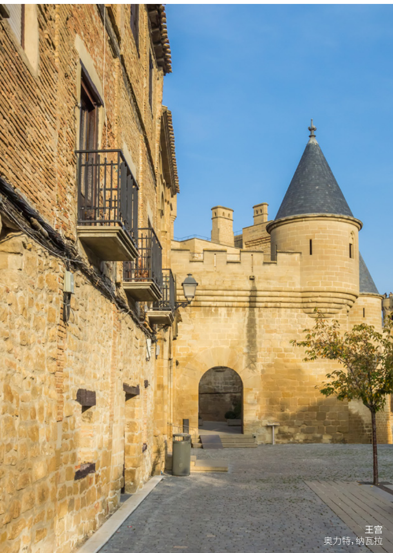
王宫 奥力特, 纳瓦拉