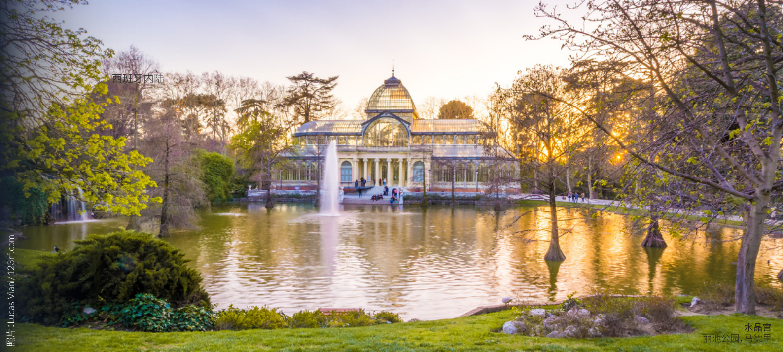
水晶宫 丽池公园, 马德里