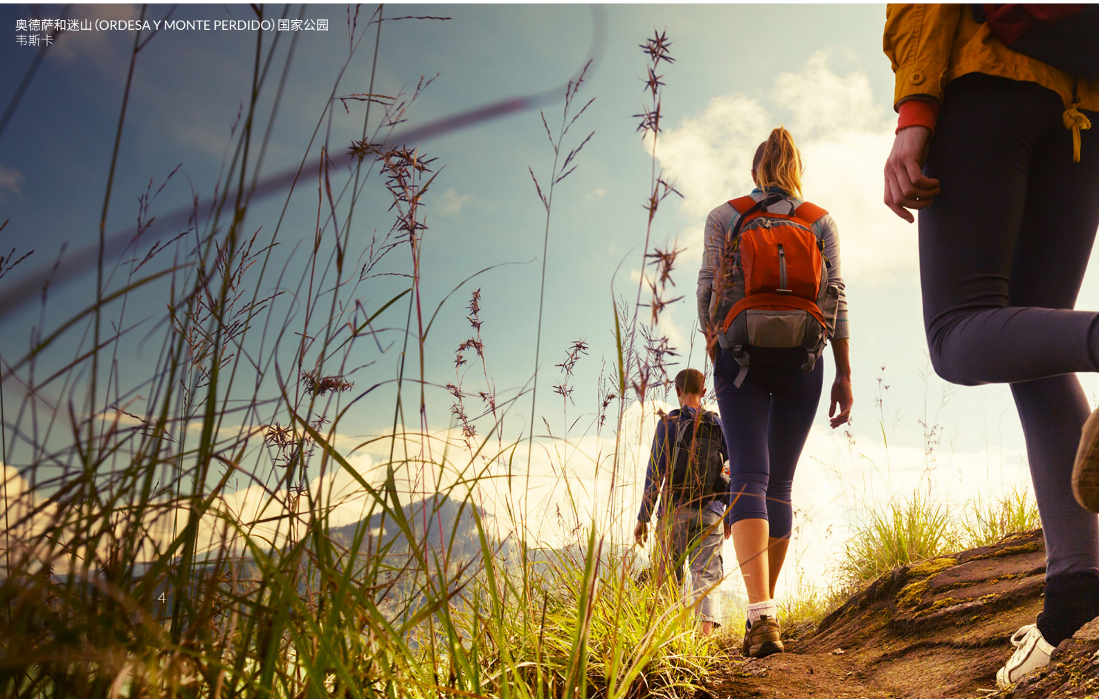
奥德萨和迷山 (ORDESA Y MONTE PERDIDO) 国家公园 韦斯卡

你也可以探访阿拉贡自治区的另一个城市特鲁埃尔，这里保留着很重要的中世纪文化遗产。品尝火腿，来一场味觉的盛宴。