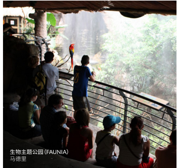
生物主题公园 (FAUNIA) 马德里

另一条激动人心的旅行线路是位于卡斯蒂亚和莱昂地区索里亚的动物化石残骸之路(Ruta de las Icnitas)。在那里你们可以参观恐龙留下的遗迹，或者参观博物馆和古生物研究和科普中心。准备好了发掘你内心深藏的探险家了吗？在里奥哈的冒险主题公园迷失山谷(El Barranco Perdido)，你们得用上绳索、