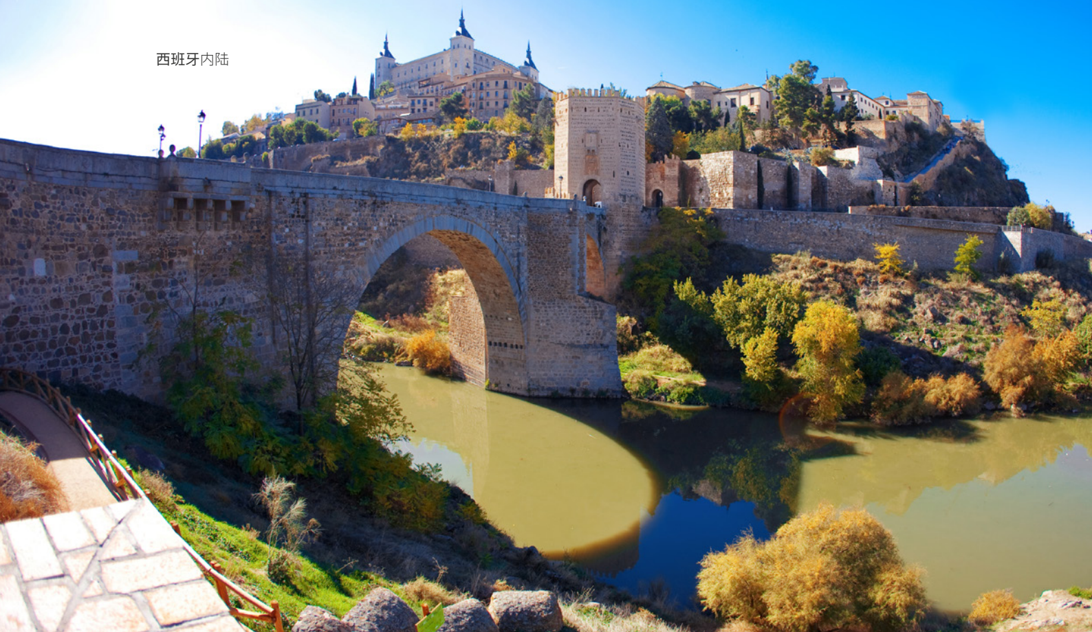
▲ 阿尔坎达拉桥 托莱多