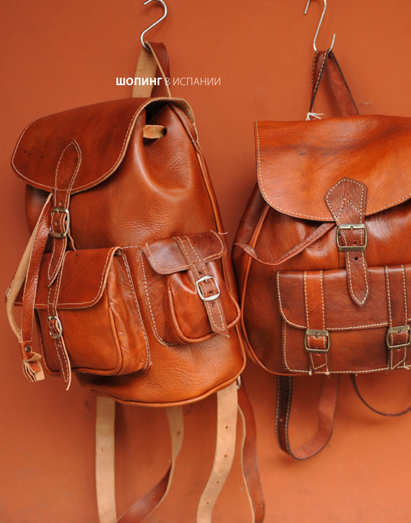
▲ УБРИКЕ КАДИС

С 1720 года мастера-ткачи продолжают кустарным способом делать гобелены, ковры и аппликации. Местные творения украшают самые знаменитые дворцы Испании. Вы сможете не только любоваться ценной коллекцией музея, но и открыть для себя секреты этого древнего искусства, побывав в бывших мастерских.