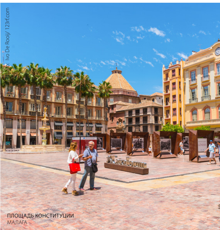
ПЛОЩАДЬ КОНСТИТУЦИИ МАЛАГА

Мода, товары для дома, оптика, книги, экологические продукты и так далее. Откройте для себя многообразие торговли в районе Индаучу , в особенности на улице Эрсилья и ее окрестностях. Вы ищете подарки или антиквариат? Исследуйте пространство, посвященное торговле, в окрестностях музея Гуггенхайма , с галереями и выставочными залами, книжными магазинами, специализирующимися на искусстве, винотеками и лавками деликатесов.