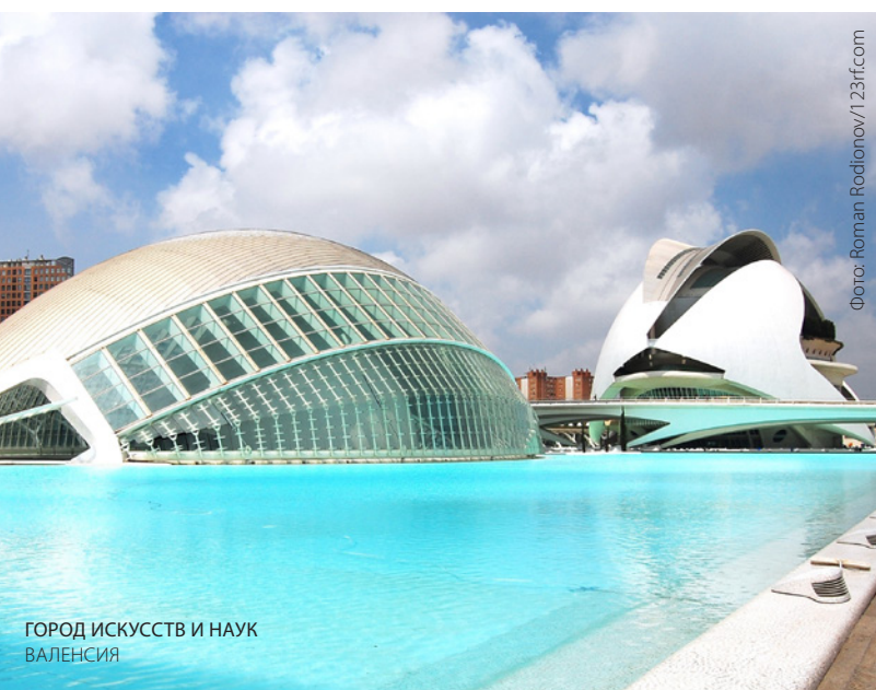
ГОРОД ИСКУССТВ И НАУК ВАЛЕНСИЯ