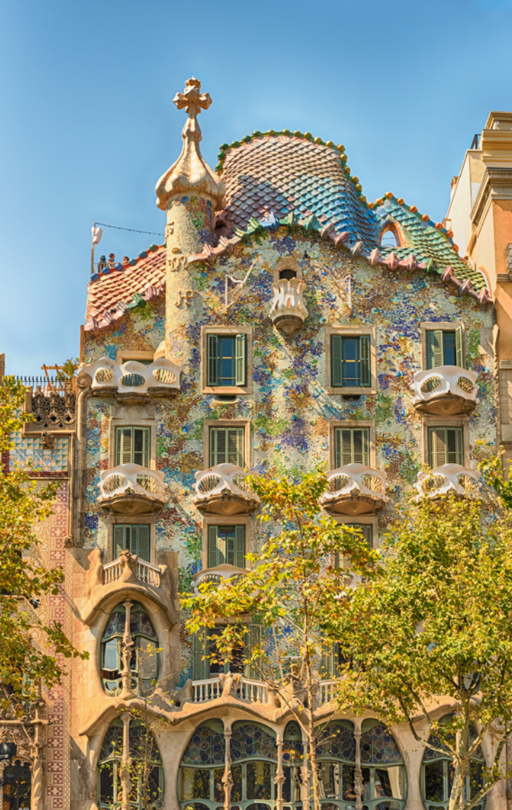
▲ ДОМ БАТЛЬО