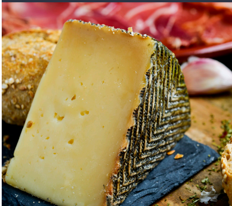
▲ СЫР МАНЧЕГО

В Хаэне (в Андалусии) вы можете отправиться по Оливковому маршруту, который проходит через огромные поля оливковых деревьев, расположенных в районе природного парка Сьерра-Махина. Провинция Кордова в Андалусии — это еще один из основных производителей оливкового масла в Испании, здесь с ним тесно связана жизнь многих городков. Во многих из них организуются завтраки и дегустации, где главное место занимает оливковое масло.