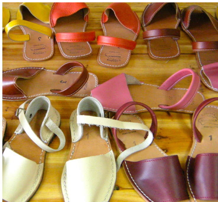
▲ МЕНОРКСКИЕ САНДАЛИИ МЕНОРКА

Городок Убрике , расположенный в районе горной гряды Кадиса, — это центр ремесленного производства товаров из кожи. Здесь имеется около 40 мастерских. Помимо этого, улицы изобилуют магазинами, в которых можно купить высококачественные обувь, сумки и кошельки. Не зря многие международные марки выпускают свои изделия именно здесь.