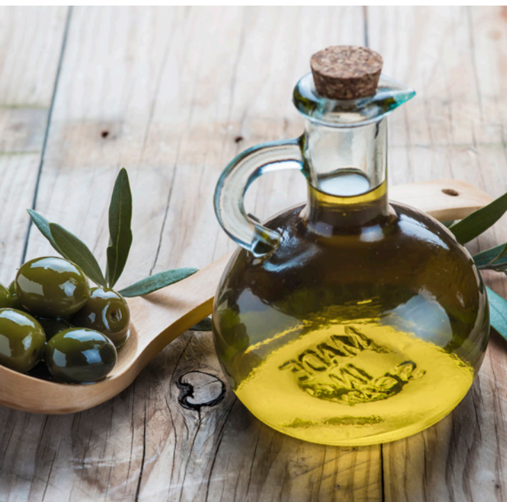
▲ ОЛИВКОВОЕ МАСЛО