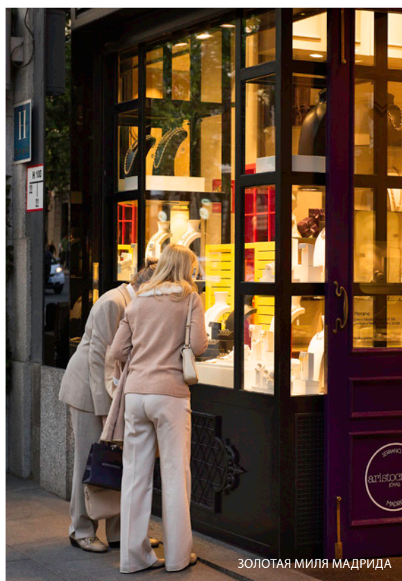
ЗОЛОТАЯ МИЛЯ МАДРИДА

Квартал Саламанка ждет вас для того, чтобы предложить самый эксклюзивный шопинг : Золотая миля , неподалеку от улицы Серрано , пестрит витринами шикарных магазинов одежды, обуви и ювелирных изделий. Здесь также находятся самые гламурные торговые центры города — Jardín de Serrano (Хардин де Серрано) и ABC Serrano (ABC Серрано).