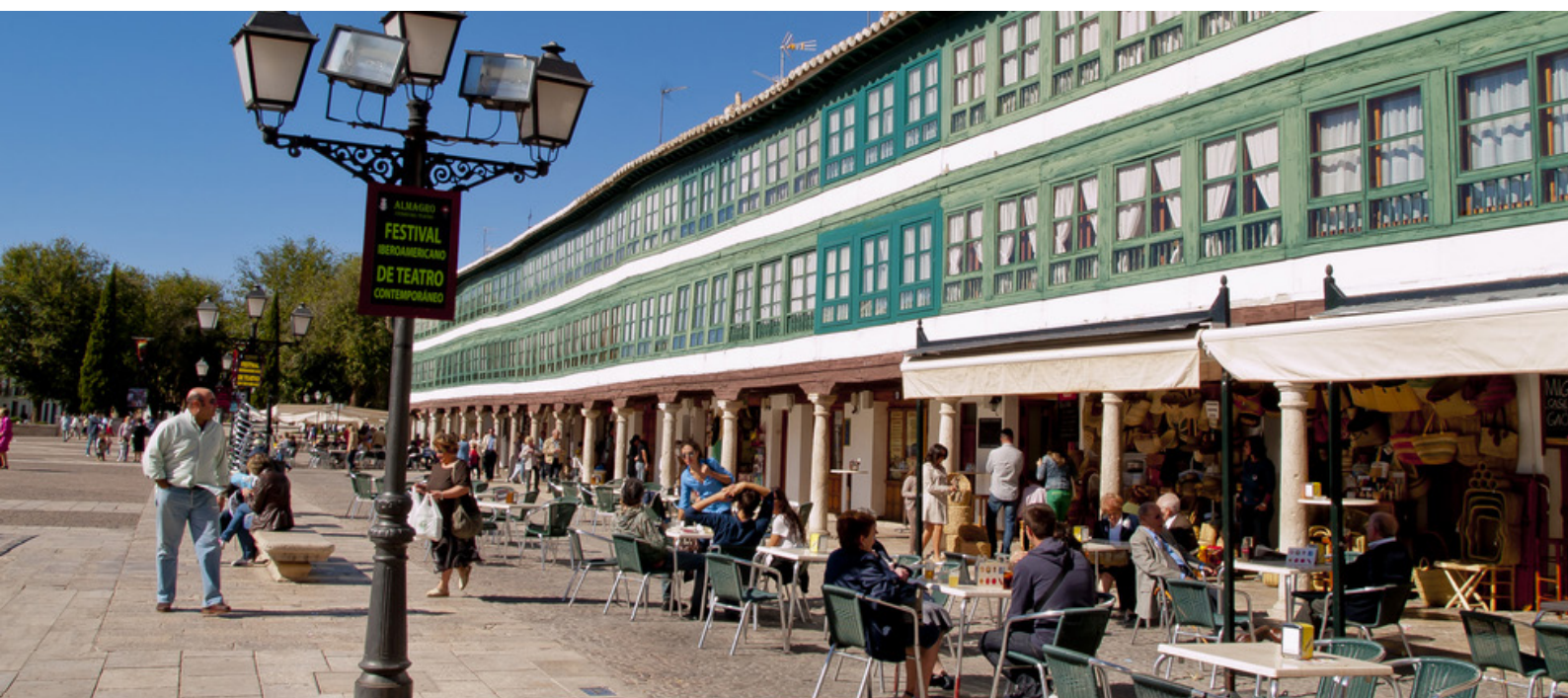
▲ 阿尔马格洛 雷亚尔城

在马略卡岛，仍有三家工厂采用玻璃吹制技术：去那里参观，看看制作彩色眼镜、灯具、盘子或烛台的炉子。除了购买独特的作品外，你还可以吹制自己的玻璃泡。