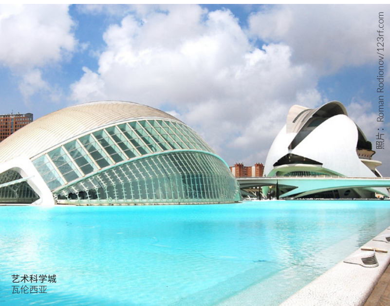
艺术科学城 瓦伦西亚