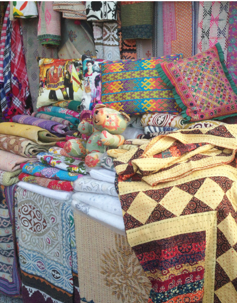
▲ LAS DALIAS 伊比萨

在马拉加（安达卢西亚）每月的第一个星期五，你可以在傍晚时分开放的 La Térmica 夜间文化步道中找到最想要的物品。服装和配饰、插图、雕刻、标志、古董、玩具、文化衍生品、音乐……这里是复古爱好者和收藏家的完美去处。此外还包括娱乐和文化：音乐会、话剧、影片放映和美食选项。这个文化空间位于Casa de la Misericordia的老建筑内。