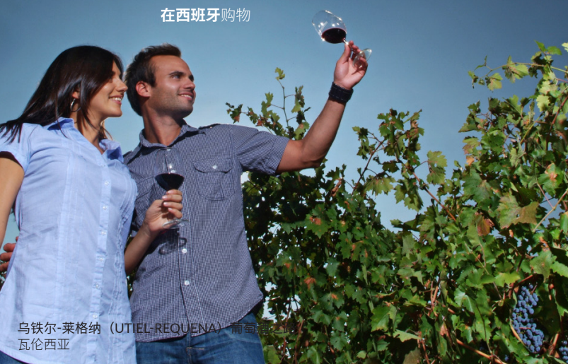
乌铁尔-莱格纳 (UTIEL-REQUENA) 葡萄酒 瓦伦西亚