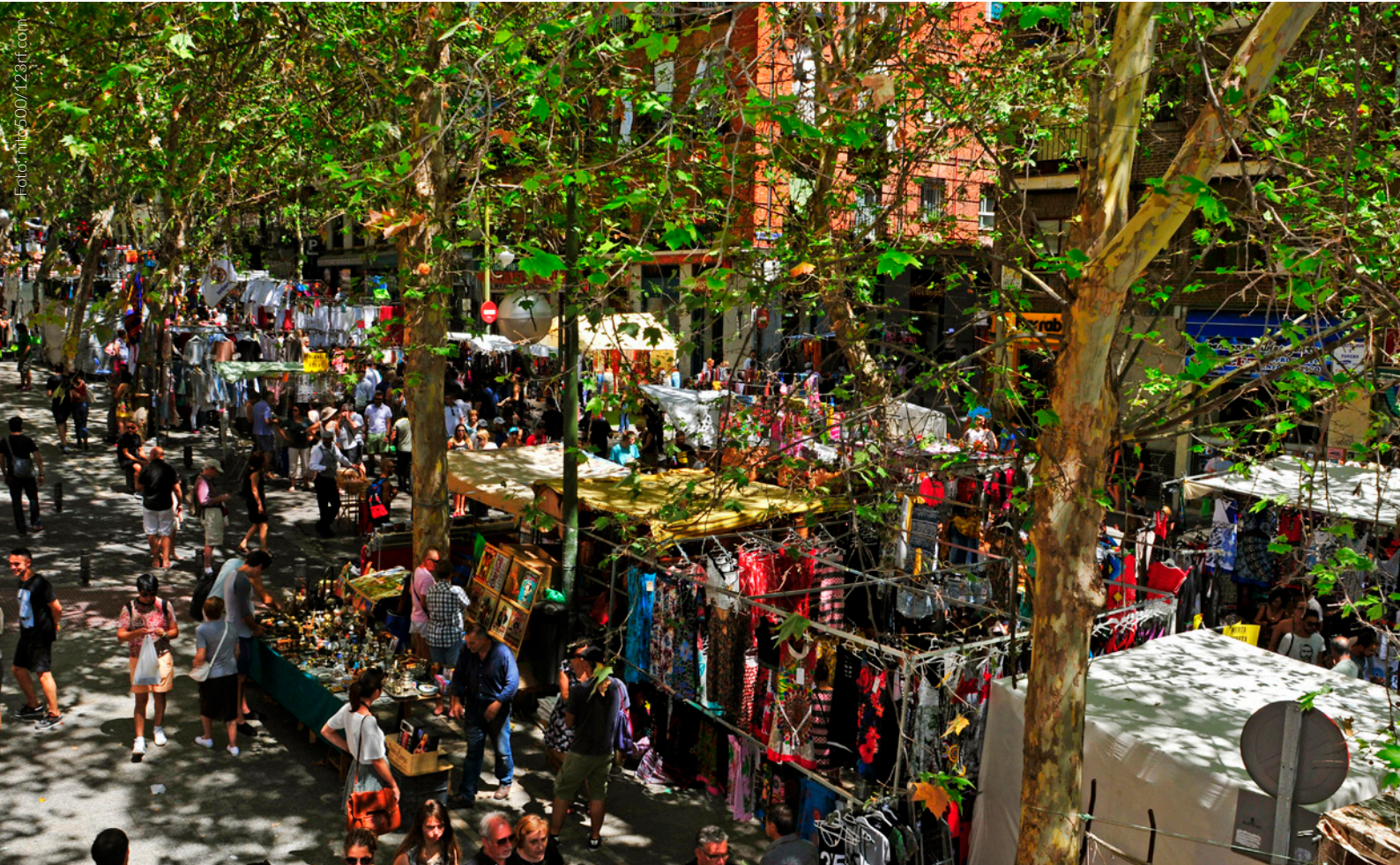
▲ DER RASTRO MADRID

Wenn Sie vom Glamour der vergangenen Jahrzehnte schwärmen und gerne in Second-hand-Läden einkaufen, haben Sie in Spanien viel zu entdecken.