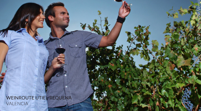
WEINROUTE UTIEL-REQUENA VALENCIA