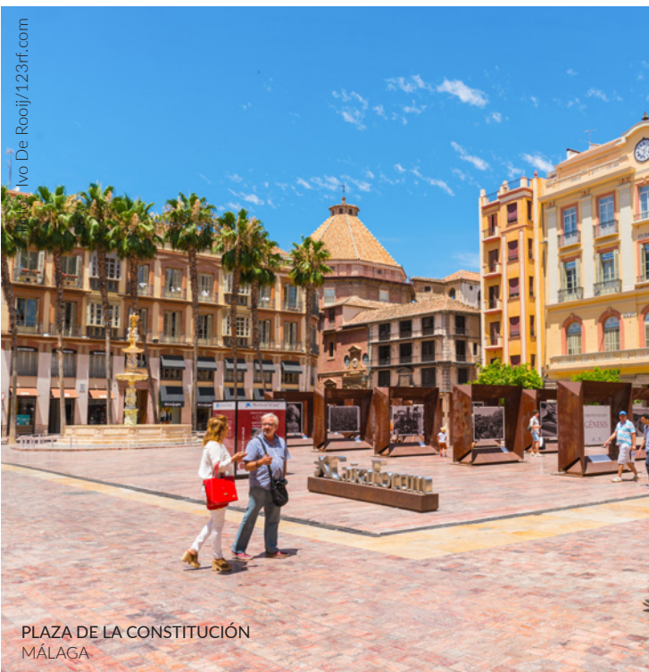
PLAZA DE LA CONSTITUCIÓN MÁLAGA

Mode, Haushaltswaren, Optik, Bücher, ökologische Produkte ... Entdecken Sie alle Arten von Geschäften in der Gegend von Indautxu , insbesondere die Calle Ercilla und ihre Umgebung. Suchen Sie Geschenke oder Antiquitäten? Erkunden Sie die Geschäfte rund um das Guggenheim Museum mit Galerien und Ausstellungsräumen, Kunstbuchhandlungen, Wein- und Gourmetläden.