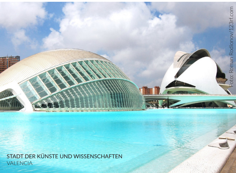
STADT DER KÜNSTE UND WISSENSCHAFTEN VALENCIA