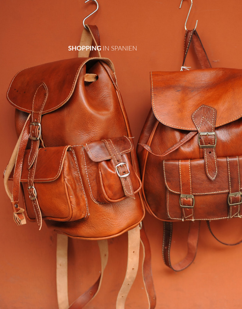
▲ UBRIQUE CÁDIZ

Seit 1720 produzieren die Klöppelmeisterinnen handgefertigte Tapisseries, Teppiche und textile Bilder. Ihre Kreationen sind in den berühmtesten Palästen Spaniens zu finden. Sie können nicht nur die wertvolle Sammlung des Museums betrachten, sondern auch die Geheimnisse dieses traditionellen Handwerks kennenlernen, indem Sie die alten Werkstätten besuchen.