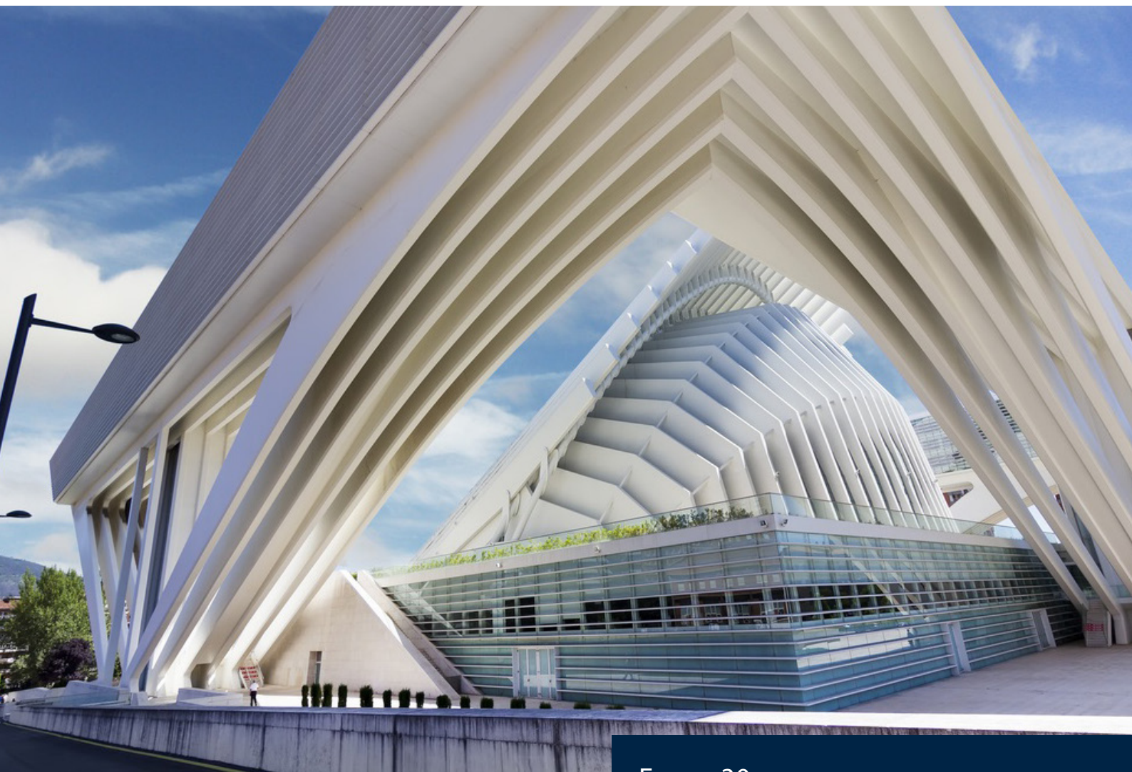
▲ ДВОРЕЦ КОНГРЕССОВ В ОВЬЕДО

Кроме того, основные международные отраслевые ассоциации, такие как ICCA , SITE и MPI , имеют подразделения, в которые интегрированы испанские профессионалы.