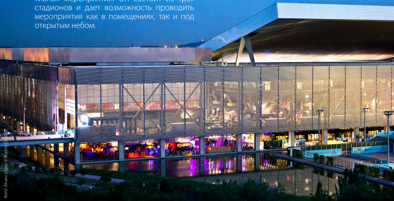
▲ СПОРТИВНЫЙ КОМПЛЕКС CAJA MÁGICA

В этом комплексе есть все для проведения как крупных, так и небольших корпоративных мероприятий. Он состоит из трех стадионов и дает возможность проводить мероприятия как в помещениях, так и под открытым небом.