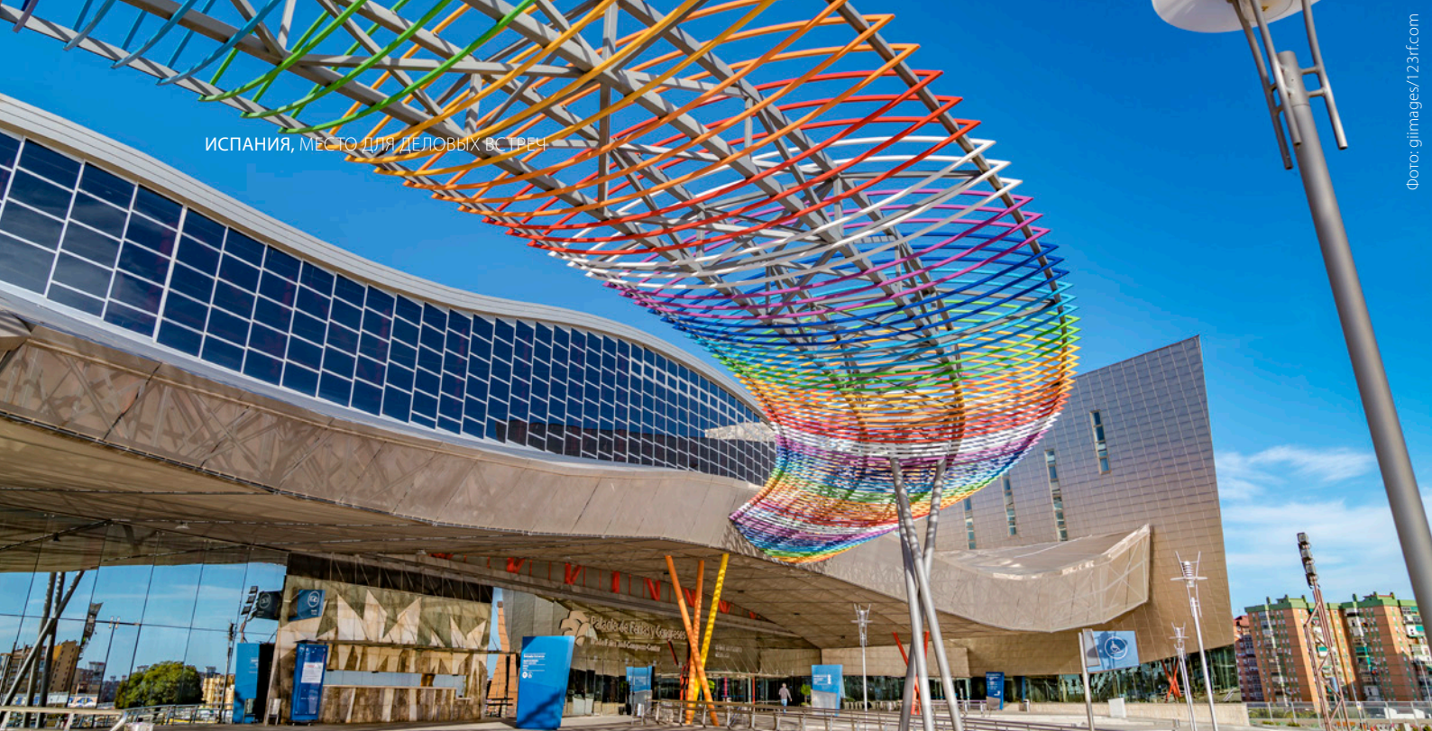
▲ ДВОРЕЦ ВЫСТАВОК И КОНГРЕССОВ