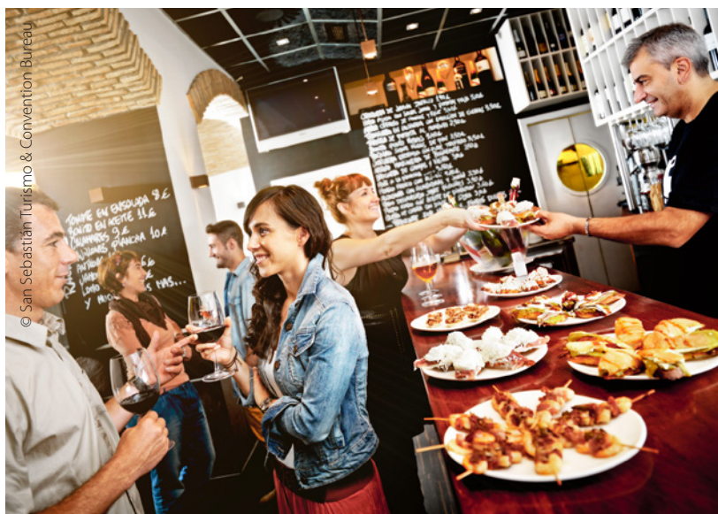
▲ ЗАКУСКИ «ПИНЧОС»

Ночная жизнь Сан-Себастьяна сосредоточена в оживленной старой части города Парте-Вьеха , на пешеходной улице Католических королей , на террасах кафе которой так приятно наслаждаться коктейлями, а также в районе Грос с многочисленными барами, где можно неспешно побеседовать за стаканчиком.