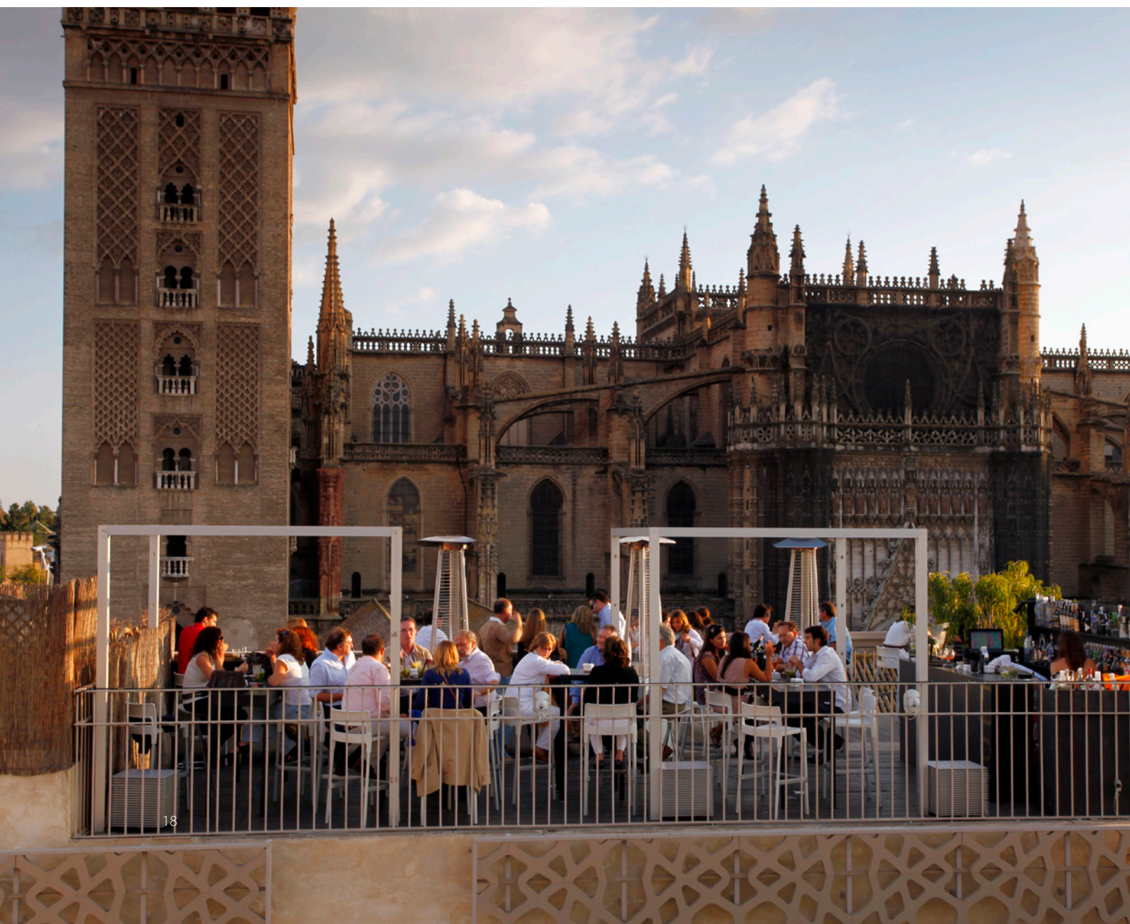
▼ ТЕРРАСА С ВИДОМ НА КАФЕДРАЛЬНЫЙ СОБОР

① Дополнительная информация: www.sevillacb.com