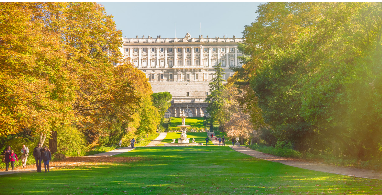
▲ PALÁCIO REAL