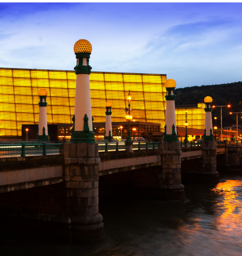
▲ PALÁCIO DE CONGRESSOS KURSAAL