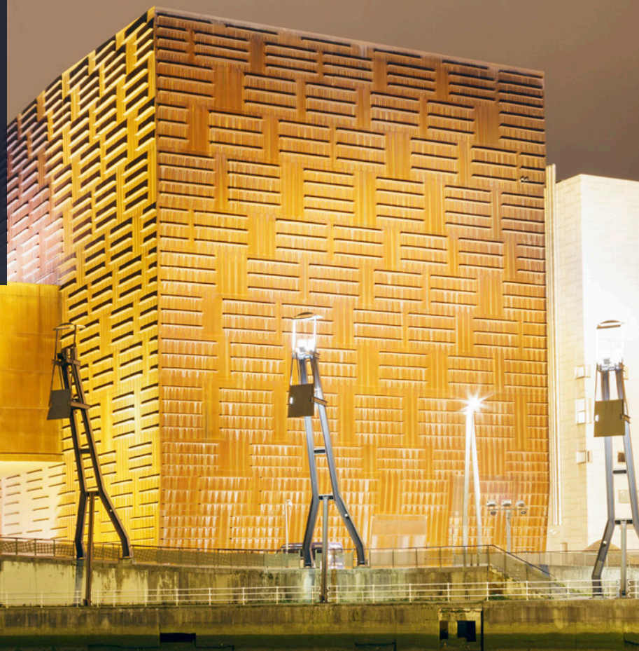
▲ PALÁCIO DE CONGRESSOS EUSKALDUNA

A magnífica localização das suas sedes e a grande oferta de serviços, fazem de Bilbao (País Basco) uma das cidades europeias com mais pontos de interesse para a celebração de congressos, feiras e viagens de incentivos. Rodeada de uma paisagem verde com esplêndidos bosques e montanhas, oferece inúmeras possibilidades de ócio ativo.