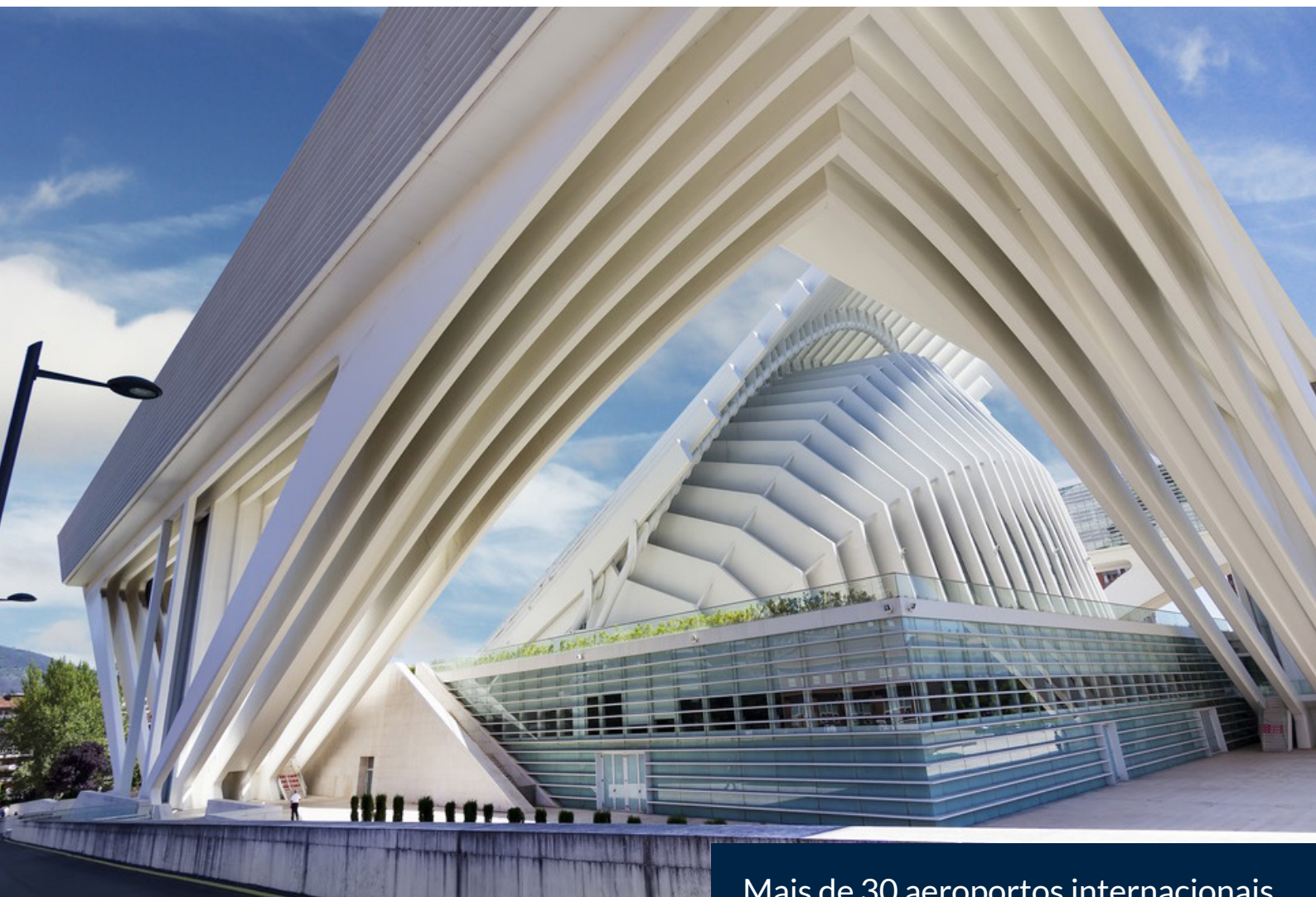
▲ PALÁCIO DE CONGRESSOS DE OVIEDO

Também, as principais associações internacionais do setor, como a ICCA , a SITE e a MPI , contam com um capítulo específico no qual se integram os profissionais espanhóis.