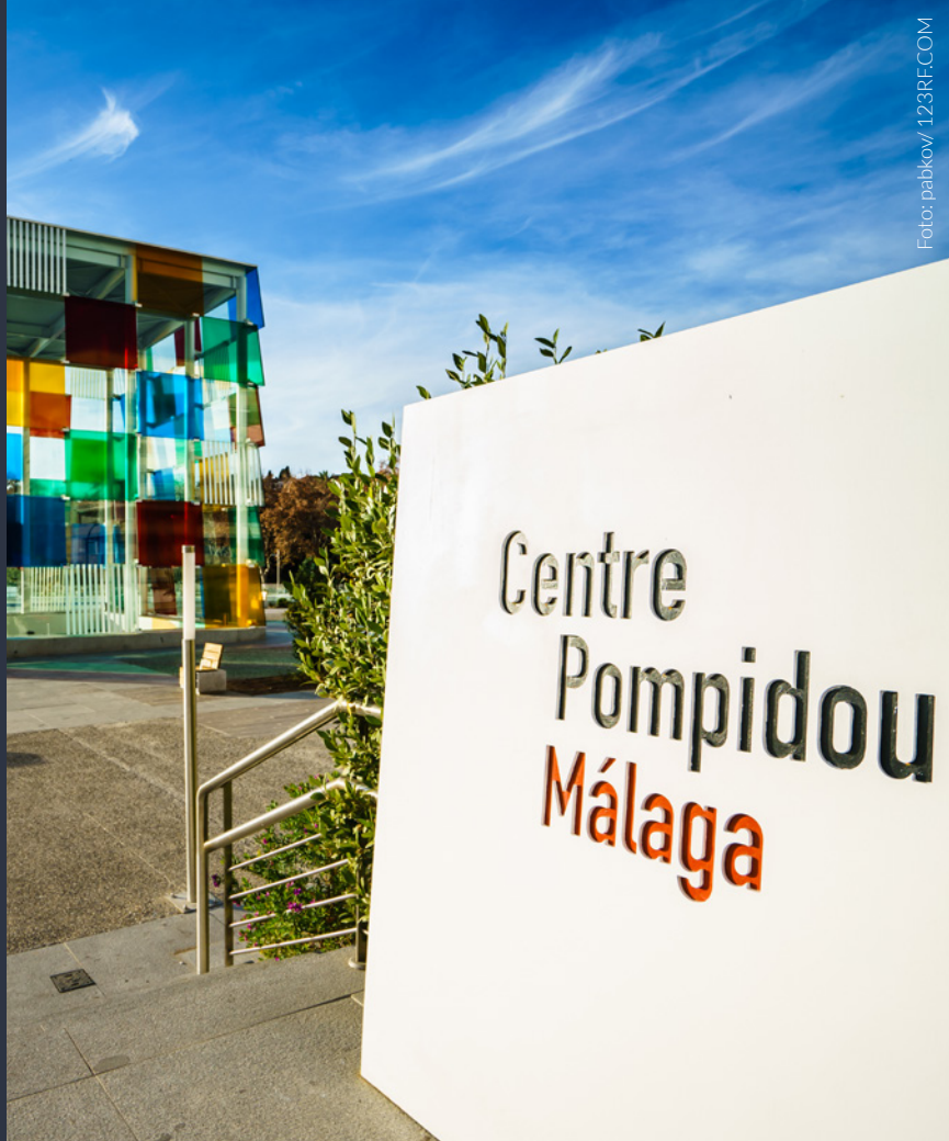
▲ CENTRO POMPIDOU MÁLAGA