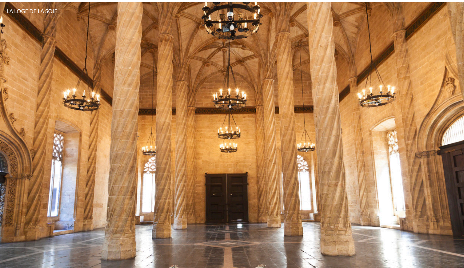
LA LOGE DE LA SOIE