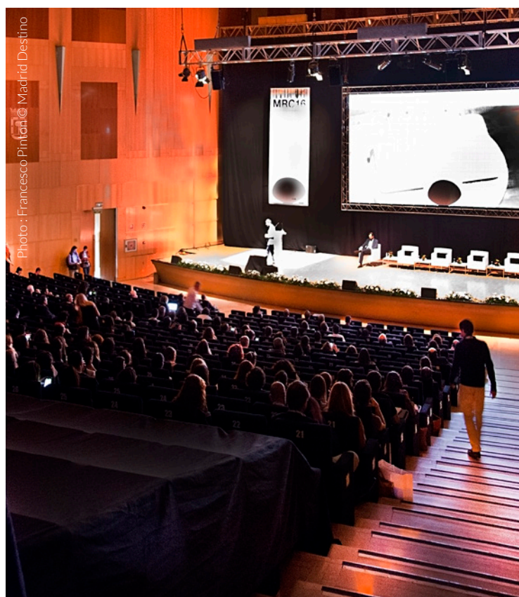
▲ PALAIS MUNICIPAL DES CONGRÈS

Un centre de grande capacité qui garantit le succès de tout événement ou convention. Il dispose de douze pavillons, deux auditoriums et 97 salles pouvant accueillir de 50 à 500 personnes.