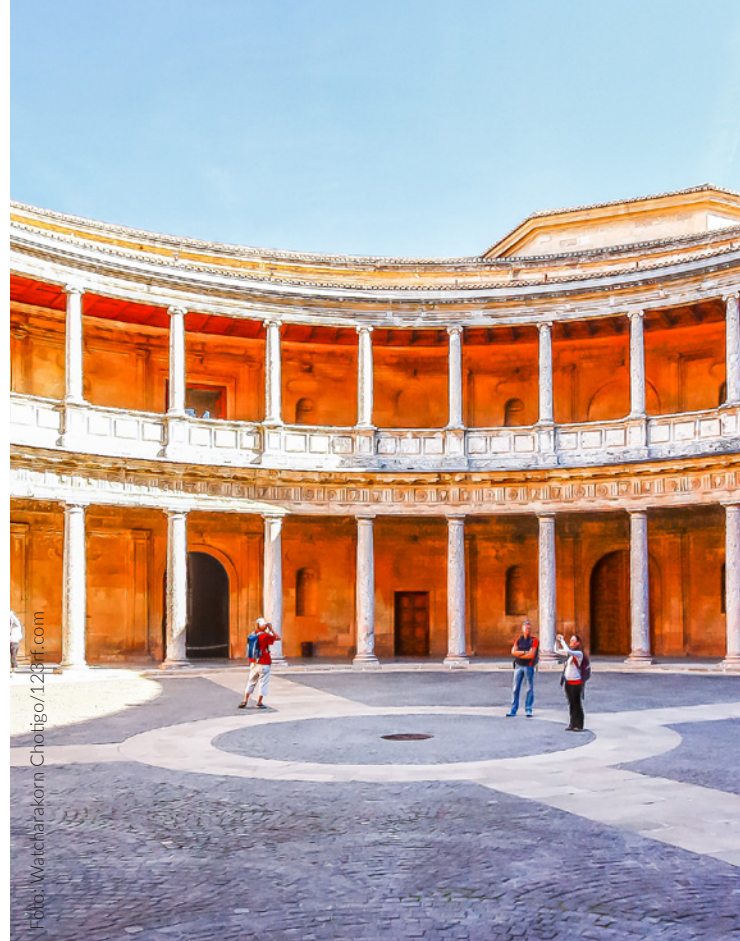
▲ PALÁCIO DE CARLOS V GRANADA

Passeia pelo ambiente ajardinado enquanto ouves o barulho da água das fontes e tanques, admira a diversa decoração do seu passado nasrida e deixa-te encantar pela sua sublime beleza.