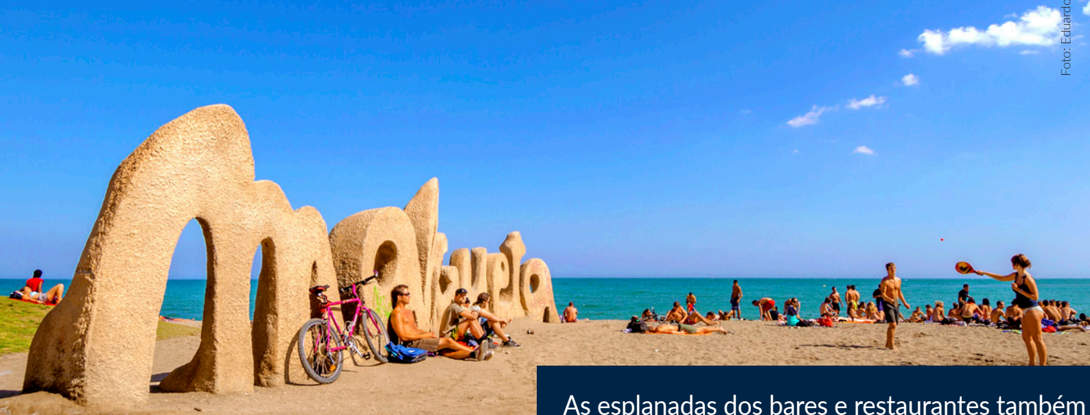
PRAIA DE LA MALAGUETA MÁLAGA

As esplanadas dos bares e restaurantes também são bastante recomendáveis, principalmente ao entardecer, quando poderás desfrutar de um pôr-do-sol inesquecível.