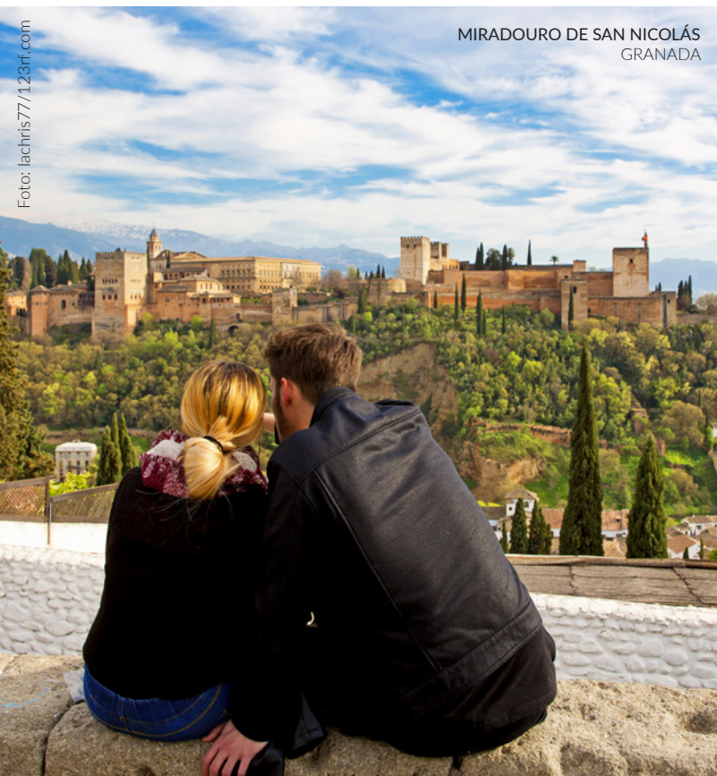
MIRADOURO DE SAN NICOLÁS GRANADA

O monumento imprescindível em qualquer viagem a Granada é La Alhambra , palácio, cidadela e fortaleza em sucessivas etapas que atualmente é um dos mais importantes patrimónios artísticos de toda a Espanha.