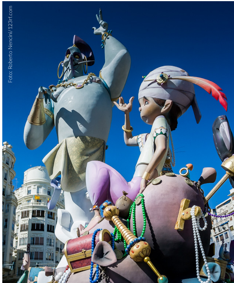
▲ AS FALLAS VALÊNCIA

A poucos passos visita o Miguelete , como é conhecido o campanário da catedral de Valência. Desde os seus 50 metros de altura poderás ver uma impressionante vista panorâmica da cidade.