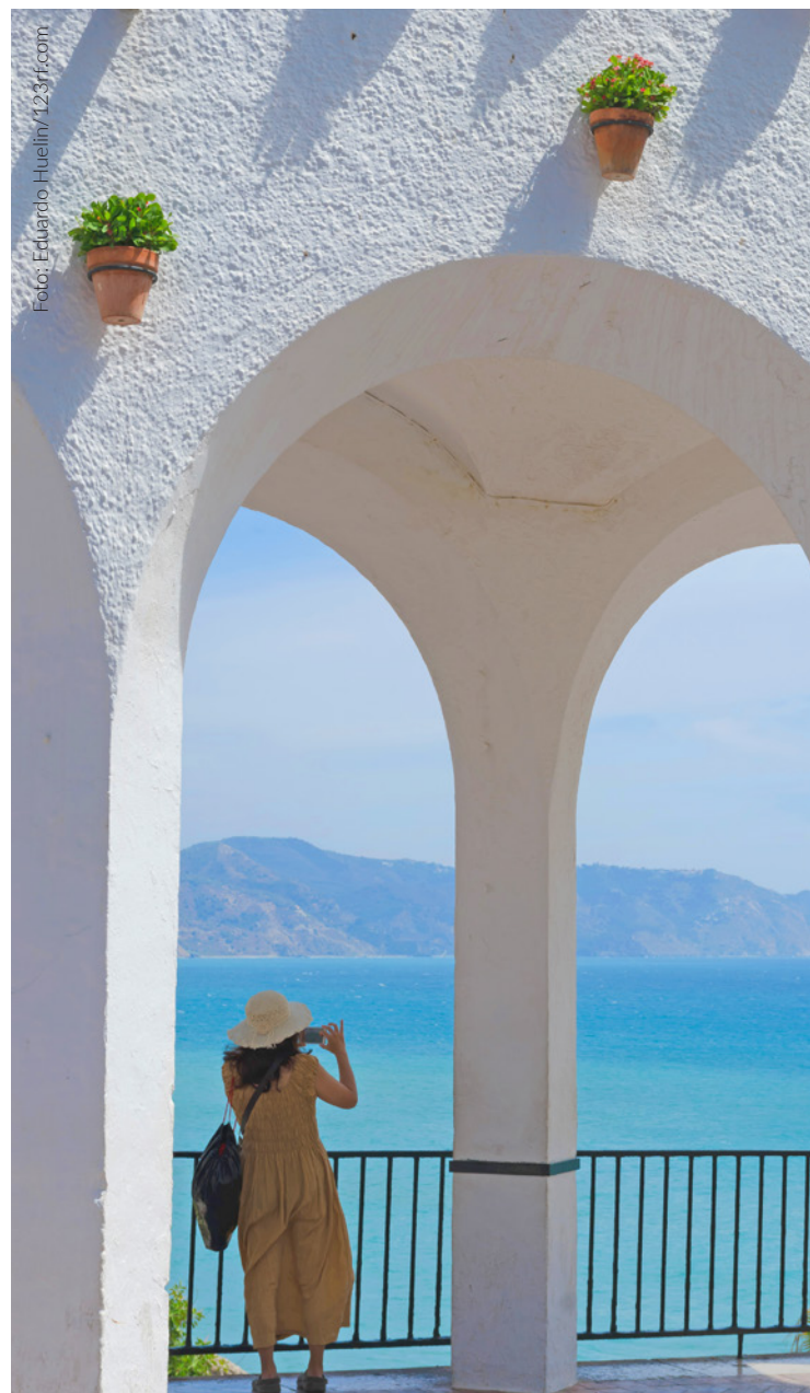
▲ Balcão da Europa Nerja, Málaga

Debaixo do Balcão da Europa , uma praça circular sobre o mar que se tornou no lugar mais emblemático de Nerja, poderás dar um mergulho na praia de