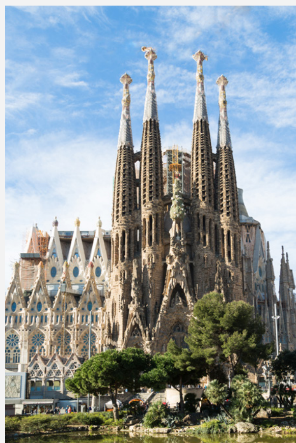
▼ A SAGRADA FAMÍLIA BARCELONA

No coração de Barcelona encontra-se a basílica da Sagrada Família , ícone da cidade e máximo expoente do modernismo. Obra do genial Antoni Gaudí , o que mais te vai chamar a atenção vão ser as torres pontiagudas. Poderás aceder à parte superior de algumas delas para contemplar uma bonita vista panorâmica de Barcelona desde as alturas.