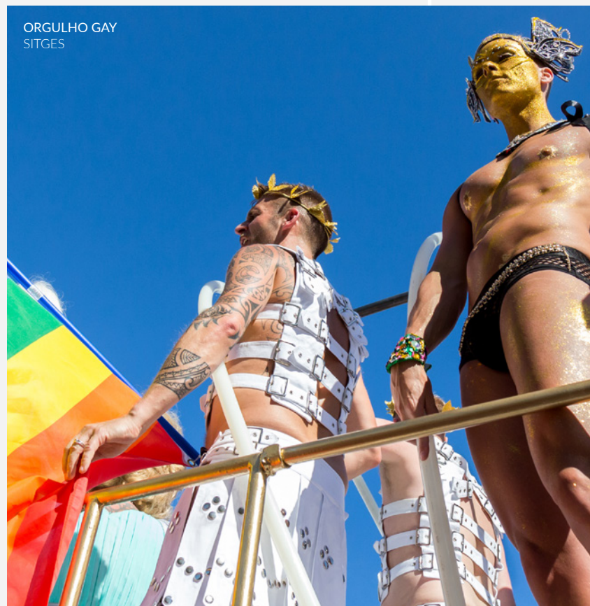
ORGULHO GAY SITGES

O Gay Pride Sitges (Barcelona) converteu-se em toda uma referência dentro das celebrações do Orgulho em Espanha. Assiste a várias atuações e festas temáticas em discotecas da cidade e ao grande cortejo reivindicativo e desfruta da cor e do ambiente festivo que se vive na cidade nesses dias de junho.