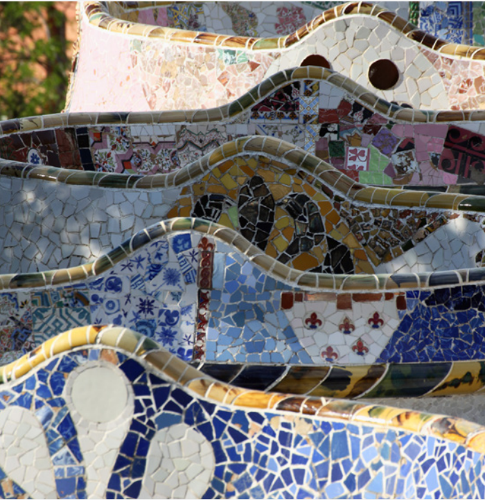
▲ PARK GÜELL BARCELONA

Percorre o passado histórico da cidade no Bairro Gótico . As suas ruas estreitas e construções medievais vão transportar-te no tempo. Admira os palácios da Câmara Municipal e da Generalitat , a catedral de Barcelona ou a basílica gótica de Santa María del Pi .