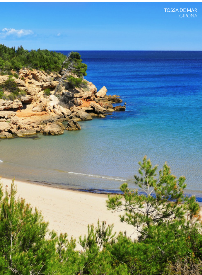
TOSSA DE MAR GIRONA