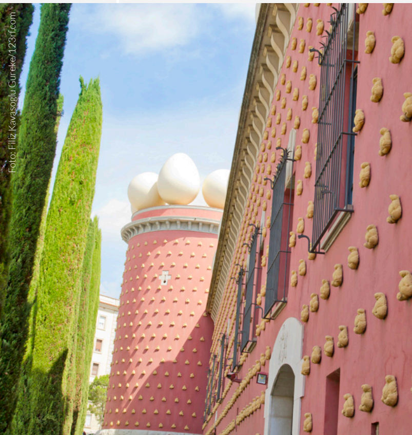
▲ TEATRO-MUSEO DALÍ FIGUERES

Nel magnifico scenario di Cadaqués si trova il piccolo villaggio marinaro di Portlligat, dove potrai visitare la Casa-Museo Dalí , un'abitazione di pescatori in cui l'artista trascorse lunghi periodi della sua vita. Potrai osservare gli strumenti di lavoro nel suo laboratorio e una zona esterna con numerosi riferimenti surrealisti.