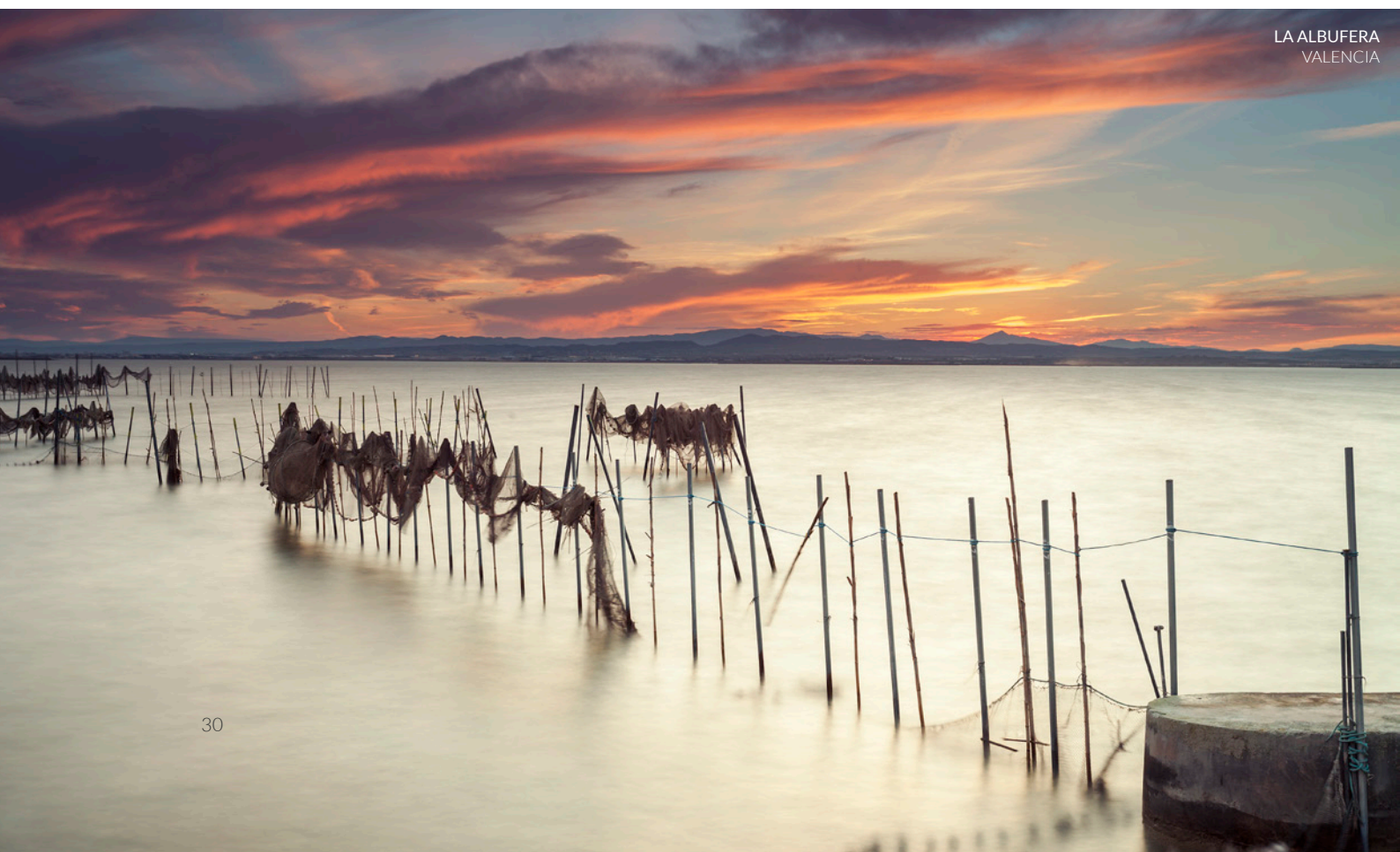
LA ALBUFERA VALENCIA

Se ami il birdwatching, la zona umida più importante della Murcia ti sta aspettando. Alla fine di luglio migliaia di fenicotteri si concentrano nella zona tingendo di rosa questo paesaggio spettacolare. Un breve percorso all'alba tra le saline, una passeggiata a piedi lungo i sentieri segnalati o un bagno di fanghi terapeutici sono esperienze di benessere in un ambiente tranquillo e privilegiato.