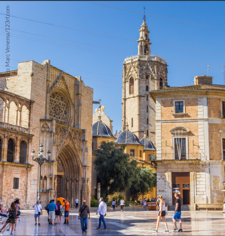
▲ CATTEDRALE DI VALENCIA VALENCIA