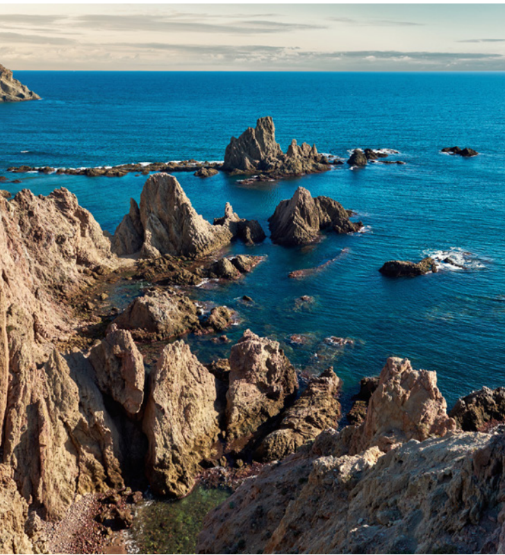
▲ PARCO NATURALE DI CABO DE GATA ALMERÍA