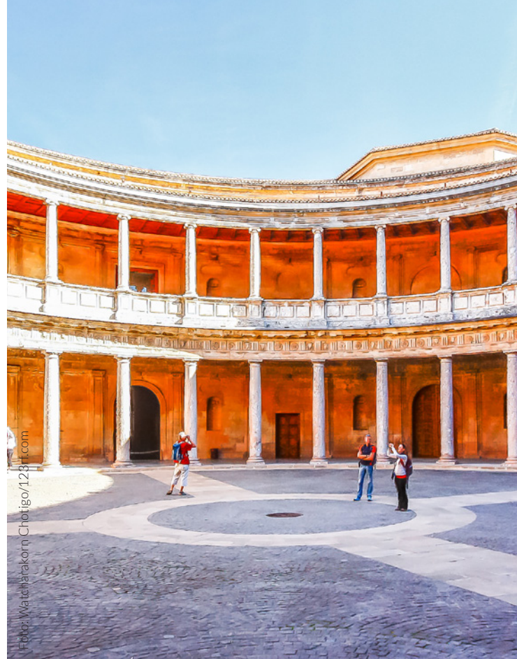
▲ PALAZZO DI CARLO V GRANADA

Passeggia tra i giardini cullato dal rumore dell'acqua di fontane e laghetti, ammira la profusa decorazione di epoca nasride e lasciati catturare dalla sua sublime bellezza.