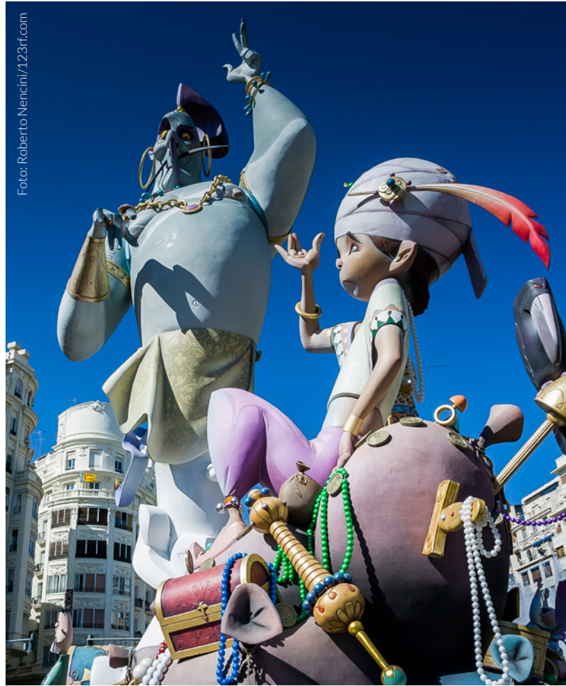
▲ LE FALLAS VALENCIA

A pochi passi di distanza si trova il campanile della cattedrale di Valencia, popolarmente noto come il Miguelete . Dai suoi 50 metri d'altezza offre un'impressionante veduta panoramica della città.