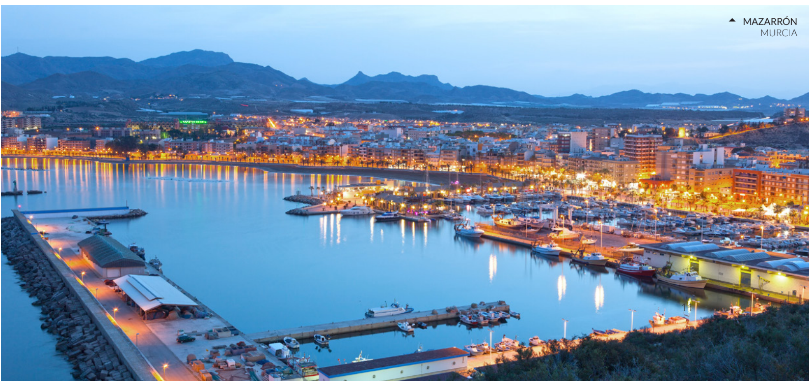
▲ MAZARRÓN MURCIA

Nelle vicinanze, dopo una bella passeggiata dal parco naturale, potrai tuffarti nelle acque di Cala de las Mulas , una spiaggia incontaminata ideale per fare immersioni.