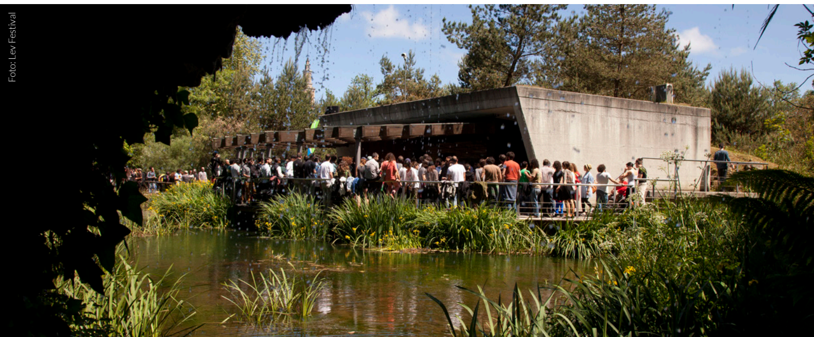
▲ L.E.V. FESTIVAL GIJÓN

Además, otros lugares de la ciudad también se convierten en escenarios inusuales, como el Jardín Botánico o varios museos, capaces de generar un circuito de experiencias únicas que acercan las propuestas más interesantes y vanguardistas del arte audiovisual internacional.