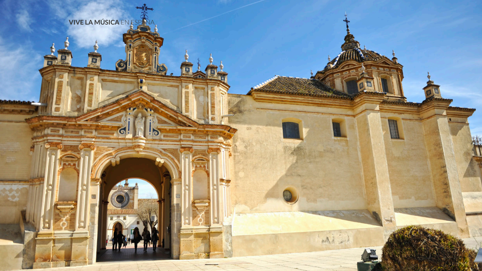
▲ CENTRO ANDALUZ DE ARTE CONTEMPORÁNEO (CAAC) SEVILLA