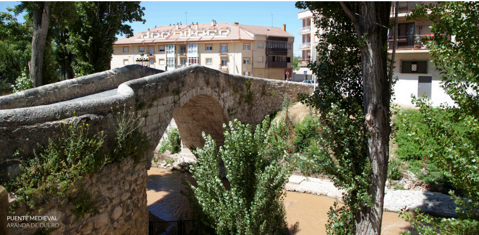
PUENTE MEDIEVAL ARANDA DE DUERO

En las últimas ediciones ha añadido nuevas propuestas dedicadas a la música iberoamericana, en el parque de la Isla , y a la temática y sonidos de los años 60, en la plaza Arco Pajarito .