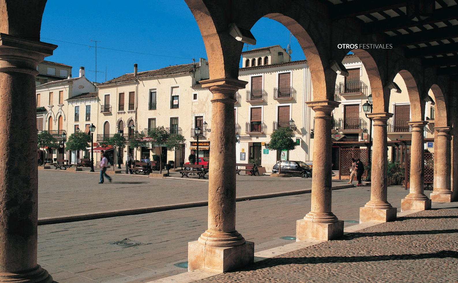
▲ PLAZA MAYOR VILLARROBLEDO, ALBACETE