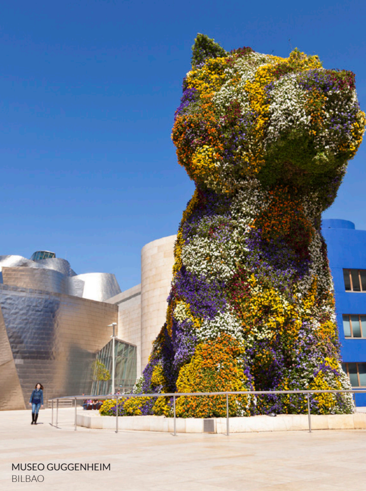
MUSEO GUGGENHEIM BILBAO

Además del impecable cartel que presenta cada año, uno de sus puntos fuertes es el recinto de Kobetamendi . Está situado en un idílico paraje, en uno de los montes que rodean la ciudad y en un pequeño bosque que desde hace unos años acoge Basoa (bosque en euskera), la zona de DJs del certamen. A ella se unen tres grandes escenarios y una carpa, lugares en los que disfrutar del mejor pop, rock y música electrónica del planeta.