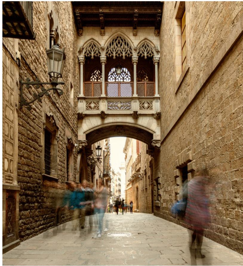
▲ BARRIO GÓTICO BARCELONA

Si quieres aprovechar todo lo que puede ofrecerte una ciudad como Barcelona, lo tienes fácil. La ubicación de Sónar de Día cerca del centro urbano te permitirá conocer todos sus encantos. La capital de Cataluña es la ciudad modernista por excelencia. Allí podrás contemplar las principales joyas arquitectónicas de Antoni Gaudí, como la Sagrada Familia o el parque Güell . También conserva restos romanos y barrios medievales (como el