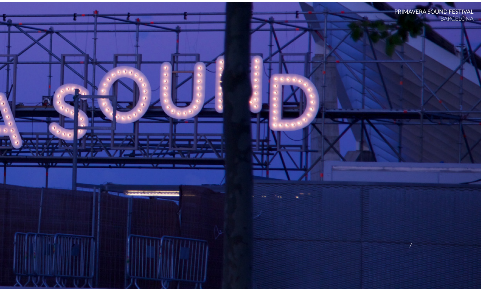
PRIMAVERA SOUND FESTIVAL BARCELONA

Más información y venta de entradas: www.primaverasound.es