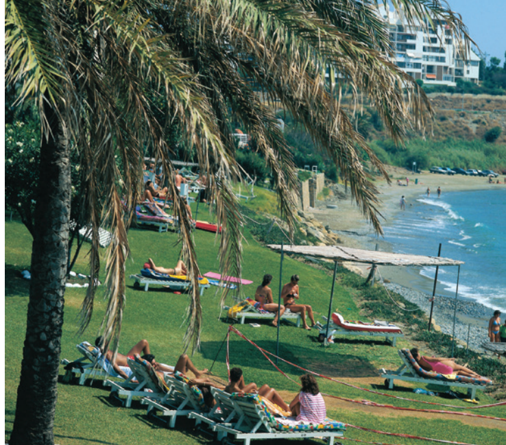
▲ PLAYA DE ESTEPONA MÁLAGA

El recinto cuenta con foodtrucks , zona de barras y áreas de descanso. El agua pulverizada y la instalación de fuentes