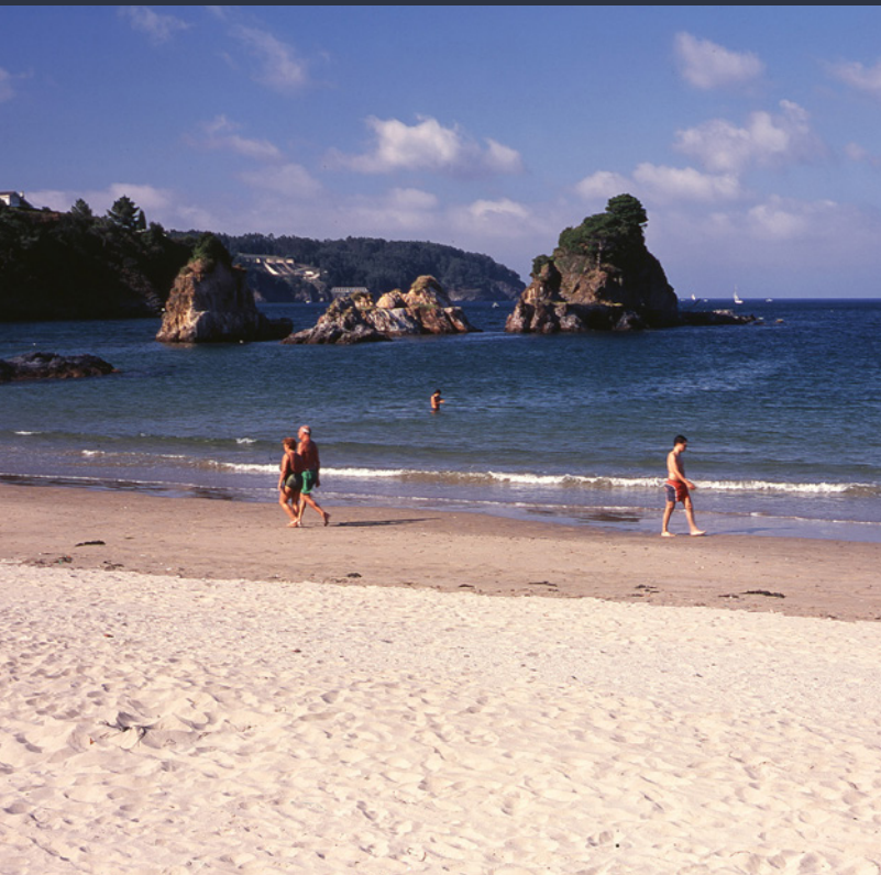
▲ PLAYA DE COVAS - OS CASTELOS VIVEIRO, LUGO

Cuatro días, cuatro escenarios y 100 bandas que se mueven entre el rock duro, el hardcore , el punk, el heavy metal y todas sus variantes. Así se resume la contundente propuesta del Resurrection Fest, que se celebra a mediados de julio con el maravilloso entorno natural del pueblo pesquero de Viveiro (Lugo).