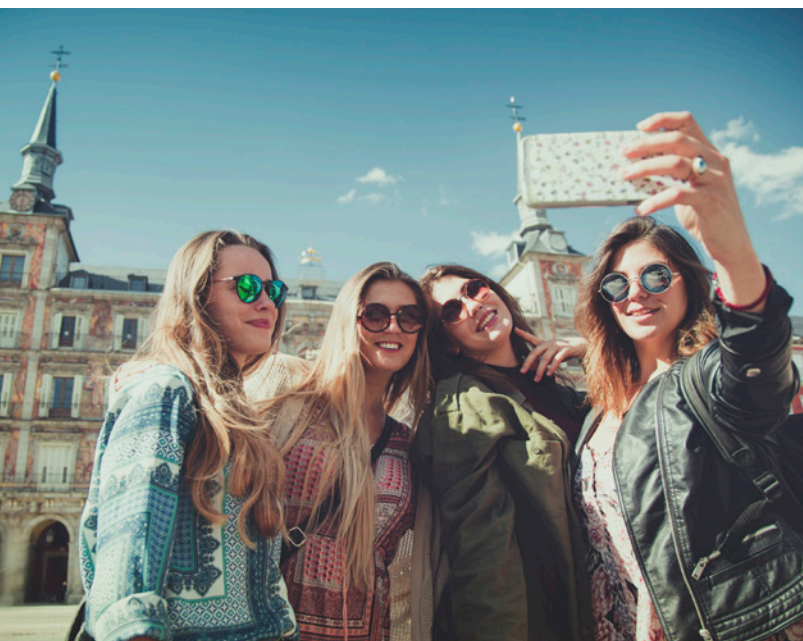
▲ PLAZA MAYOR MADRID