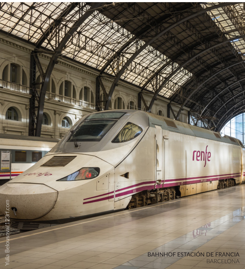
BAHNHOF ESTACIÓN DE FRANCIA BARCELONA