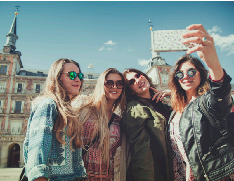
▲ PLAZA MAYOR MADRID