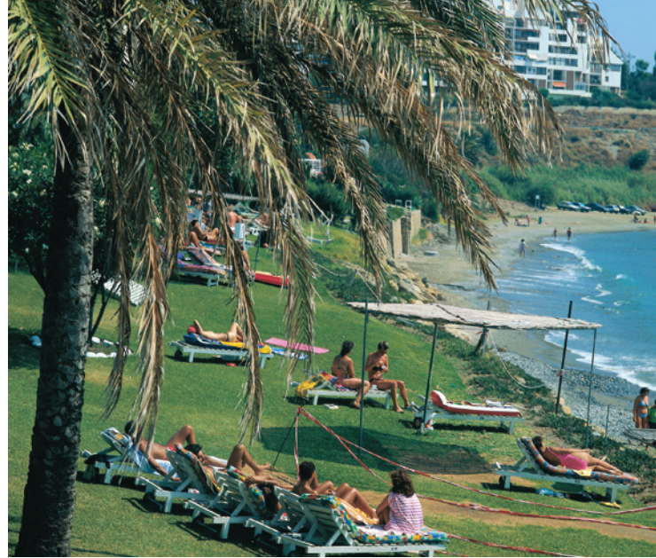
▲ STRAND VON ESTEPONA MÁLAGA

Das Gelände verfügt über Food Trucks , einen Barbereich und Ruhezonen. Die Kühlung durch Wassernebel und kostenlose