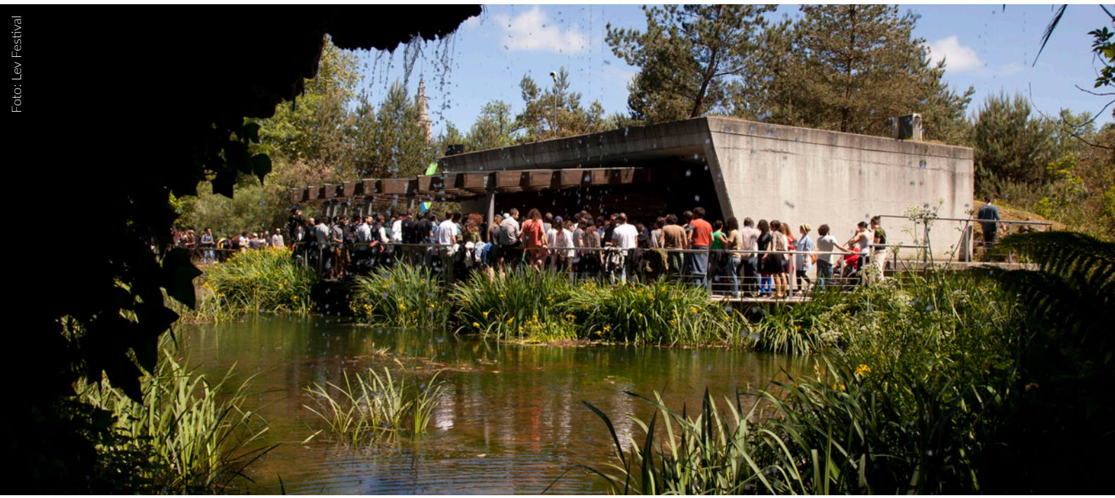
▲ L.E.V. FESTIVAL GIJÓN

Darüber hinaus fungieren auch andere Orte der Stadt wie der Botanische Garten und diverse Museen als ungewöhnliche Kulissen und schaffen so einen Reigen einzigartiger Erfahrungen mit den interessantesten und avantgardistischsten Vorschlägen der internationalen audiovisuellen Kunst.