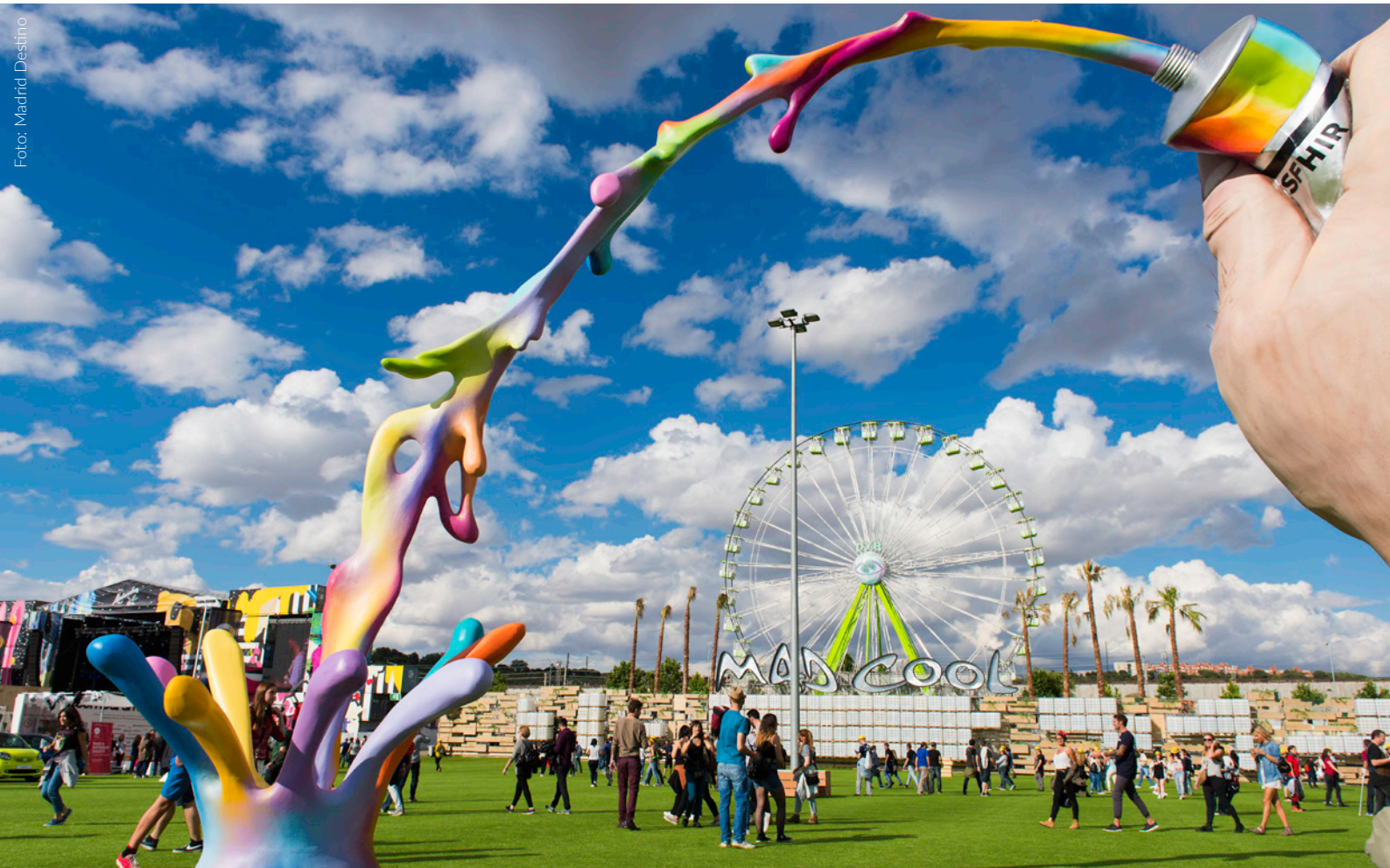
▲ MAD COOL FESTIVAL MADRID