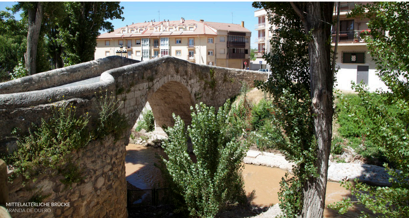
MITTELALTERLICHE BRÜCKE ARANDA DE DUERO

Das musikalische Angebot wird durch die tolle Atmosphäre, die auf dem Campingplatz herrscht, und durch viele parallele Aktivitäten ergänzt: ein Wettbewerb für Kurzfilme und Demos, Vorträge, ein Wettbewerb für junge Talente und Sonorama Baby mit einem speziell für Kinder entwickelten Programm.