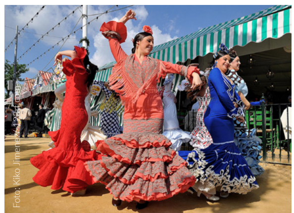
▲ FRÜHLINGSFEST FERIA DE ABRIL SEVILLA

Sevilla während des Frühlingsfestes ist gleichbedeutend mit Spaß zu jeder Tageszeit. Das Jahrmarktgelände und die Stände sind erfüllt von Musik, Gelächter, Speisen und Gläsern mit Fino-Sherry oder „rebuji-to“ (Manzanilla-Wein mit klarer Limonade). Fahren Sie nicht ab, ohne den „pescaíto frito“ (frittierten Fisch) probiert zu haben, und genießen Sie die eindrucksvolle Parade der Reiter und Pferdekutschen.