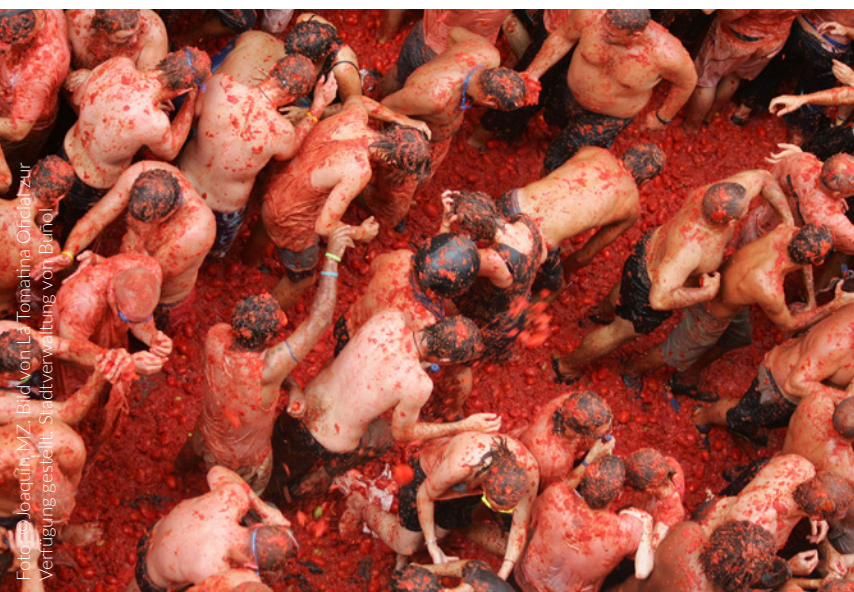
▼ TOMATENSCHLACHT LA TOMATINA BUÑOL

Dieses lustige Fest, bei dem jeder jeden mit Tomaten bewirft, findet in Buñol (Valencia) statt. Auf geht's, werfen Sie sich in das Schlachtgetümmel.