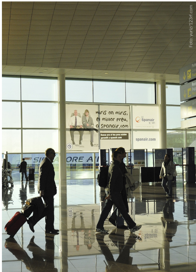
▼ FLUGHAFEN BARCELONA-EL PRAT