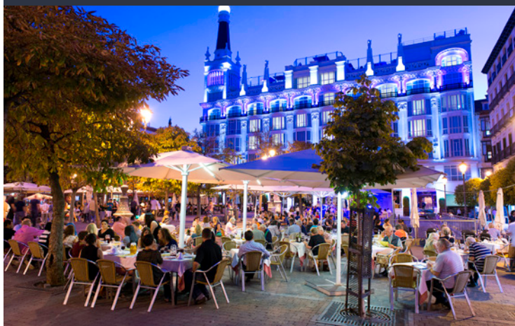
▲ PLAZA DE SANTA ANA MADRID