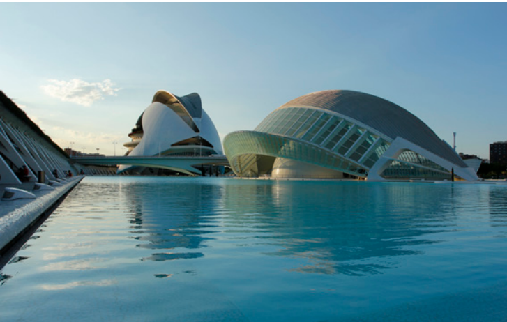
▲ STADT DER KÜNSTE UND WISSENSCHAFTEN VALENCIA

Valencia , eine Stadt voller Kontraste, ist die Essenz des Mittelmeeres. Erkunden Sie ihre Altstadt und lassen Sie sich von ihren avantgardistischen Gebäuden begeistern. Besuchen Sie die Stadt der Künste und Wissenschaften , eines der größten Wissenschafts- und Kulturzentren Europas, das bisher jeden in Staunen versetzt hat.