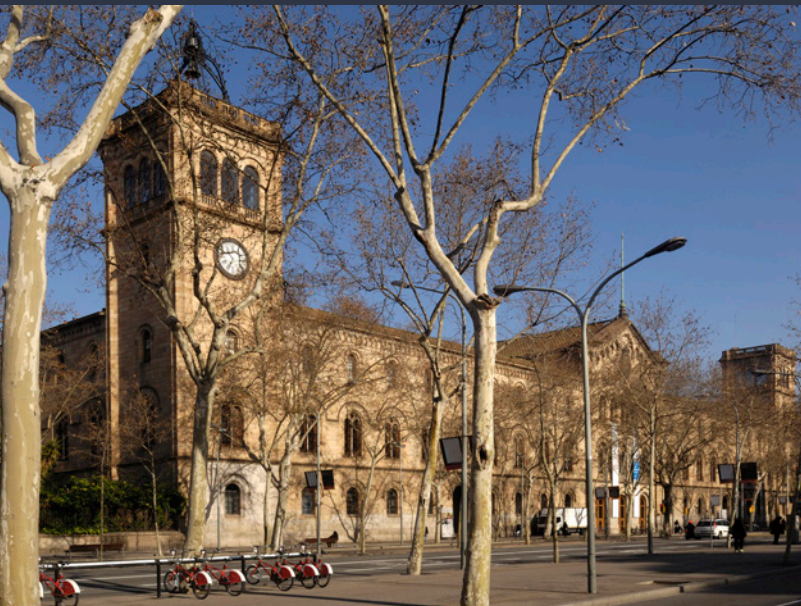
▲ UNIVERSITÄT BARCELONA

Ihre geographische Lage und ihr Kultur- und Freizeitangebot machen diese kosmopolitische und offene Stadt zu einem idealen Ziel für alle, die einen unvergesslichen Aufenthalt erleben möchten. In Barcelona befinden sich einige der wichtigsten Universitäten Spaniens wie Pompeu Fabra, die Universität Barcelona und die Universität Autònoma von Barcelona.