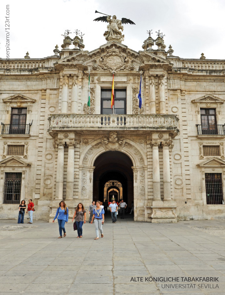
ALTE KÖNIGLICHE TABAKFABRIK UNIVERSITÄT SEVILLA