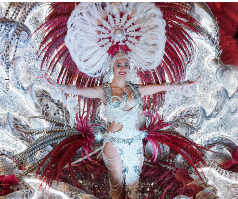
▲ KARNEVAL AUF TENERIFFA

In Spanien finden das ganze Jahr über Volksfeste statt. Erleben, spüren und genießen Sie Spanien auf seinen Volksfesten.