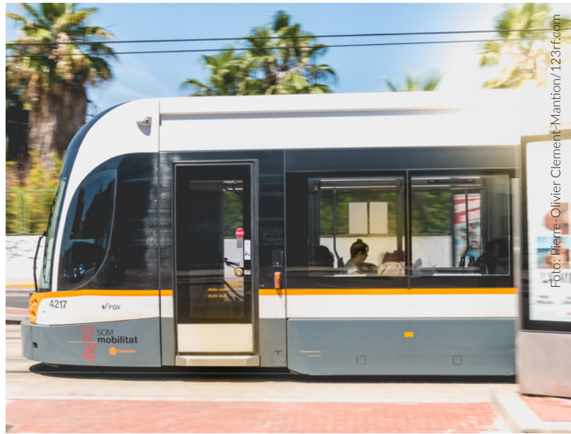
▲ STRASSENBAHN VALENCIA

i Weitere Informationen finden Sie auf www.studyinspain.info und www.uniquespain.travel