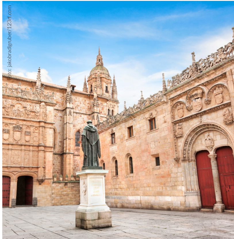
▲ UNIVERSITÄT SALAMANCA

Die Universität Salamanca , die älteste in Spanien, hat die längste Tradition und genießt das größte Ansehen im Unterrichten von Spanisch.