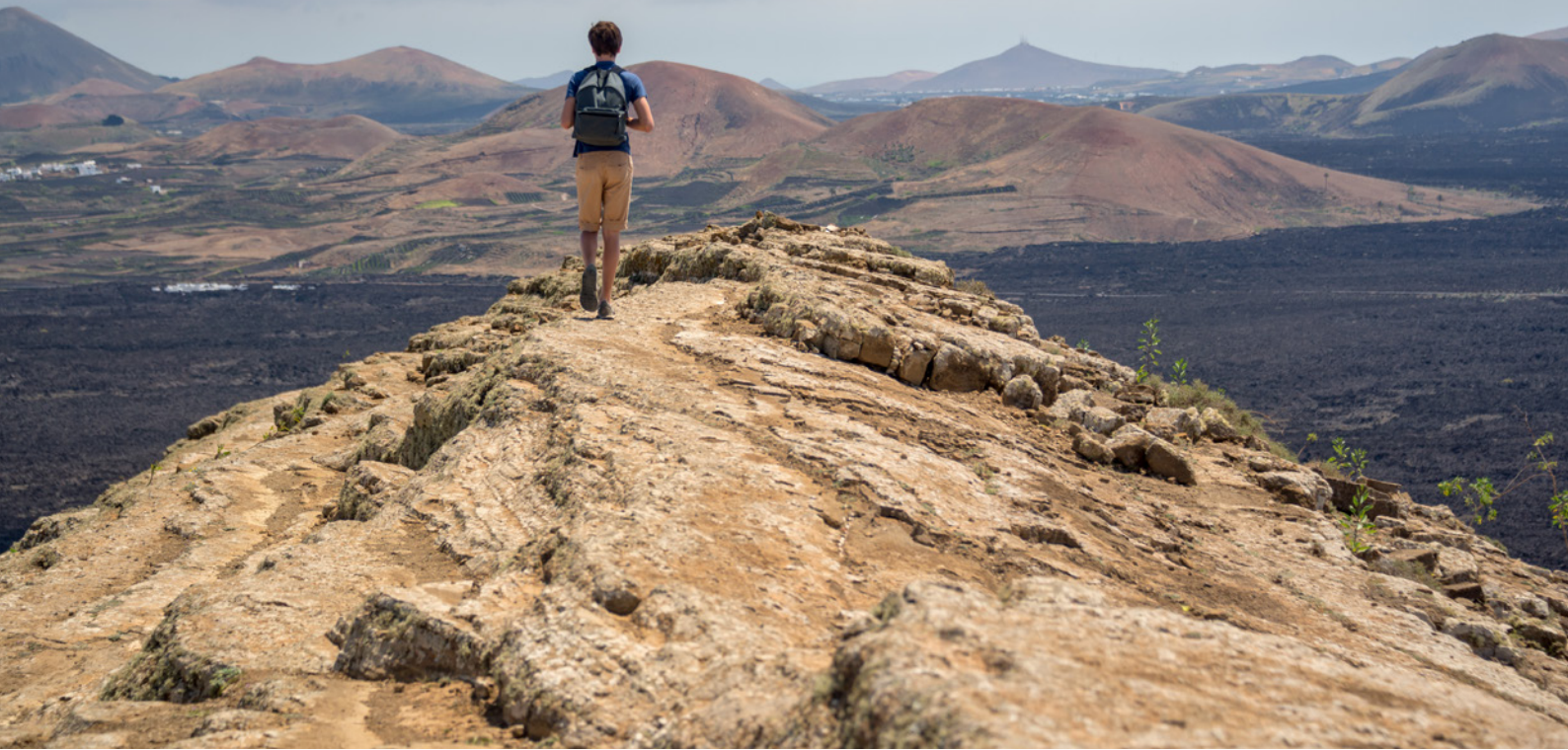
▲ NATIONALPARK TIMANFAYA LANZAROTE