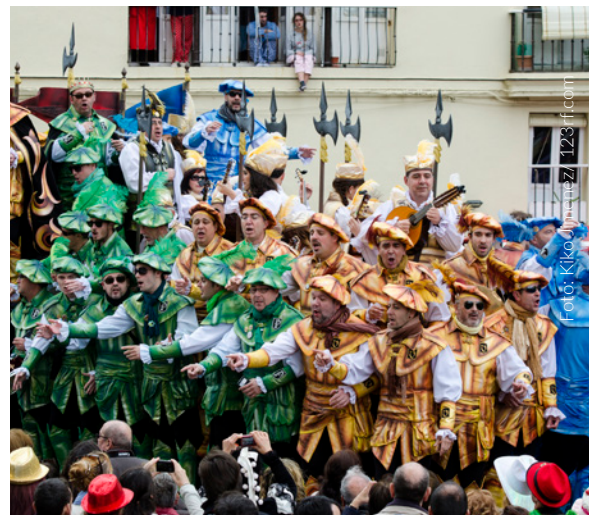
▲ KARNEVAL IN CÁDIZ

Während der Fallas widmet sich ganz Valencia dem Feiern und der Musik. Eine Woche lang füllt sich die Stadt mit den sogenannten „Ninots“ (riesige Figuren, mit denen auf humorvolle Weise Sozialkritik geübt wird), die zum Schluss in spektakulären Feuern verbrannt werden.