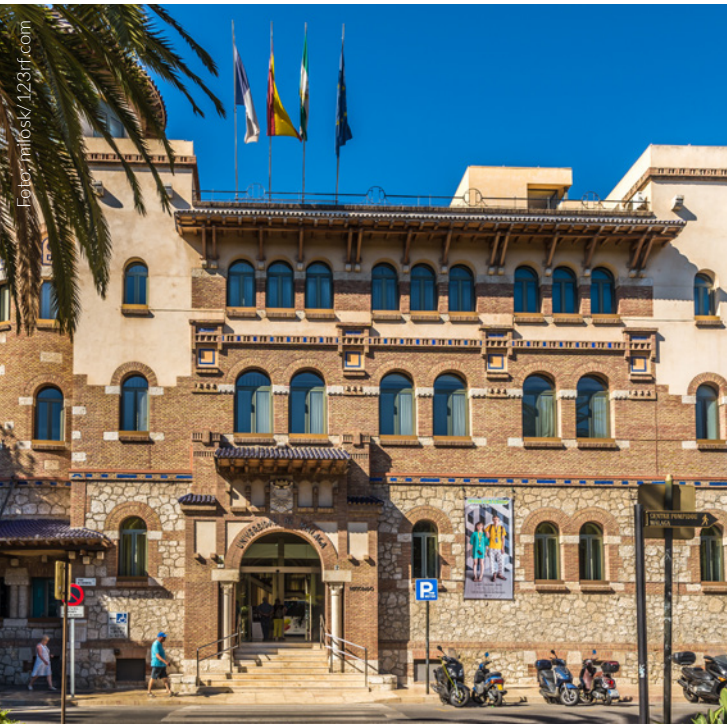
▲ UNIVERSITÄT MÁLAGA