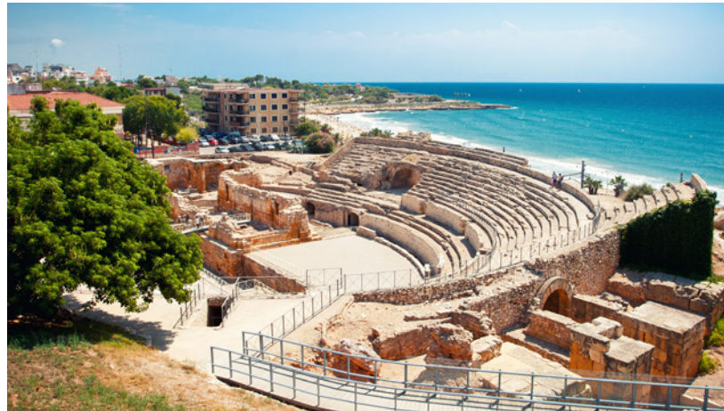
▲ RÖMISCHES AMPHITHEATER TARRAGONA

Die Römische Route Hispania Baetica führt durch 14 andalusische Orte der Pro-