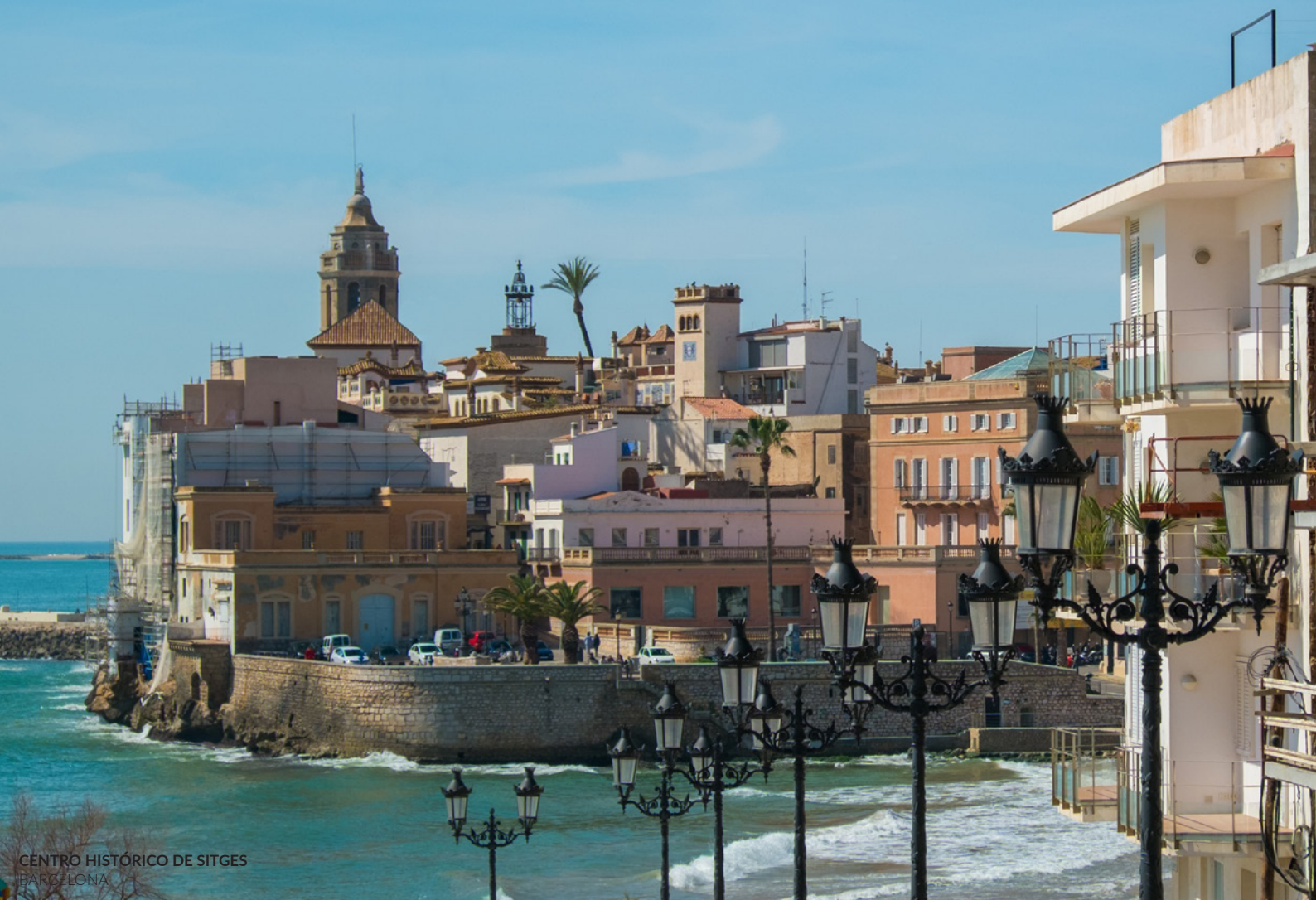
CENTRO HISTÓRICO DE SITGES BARCELONA