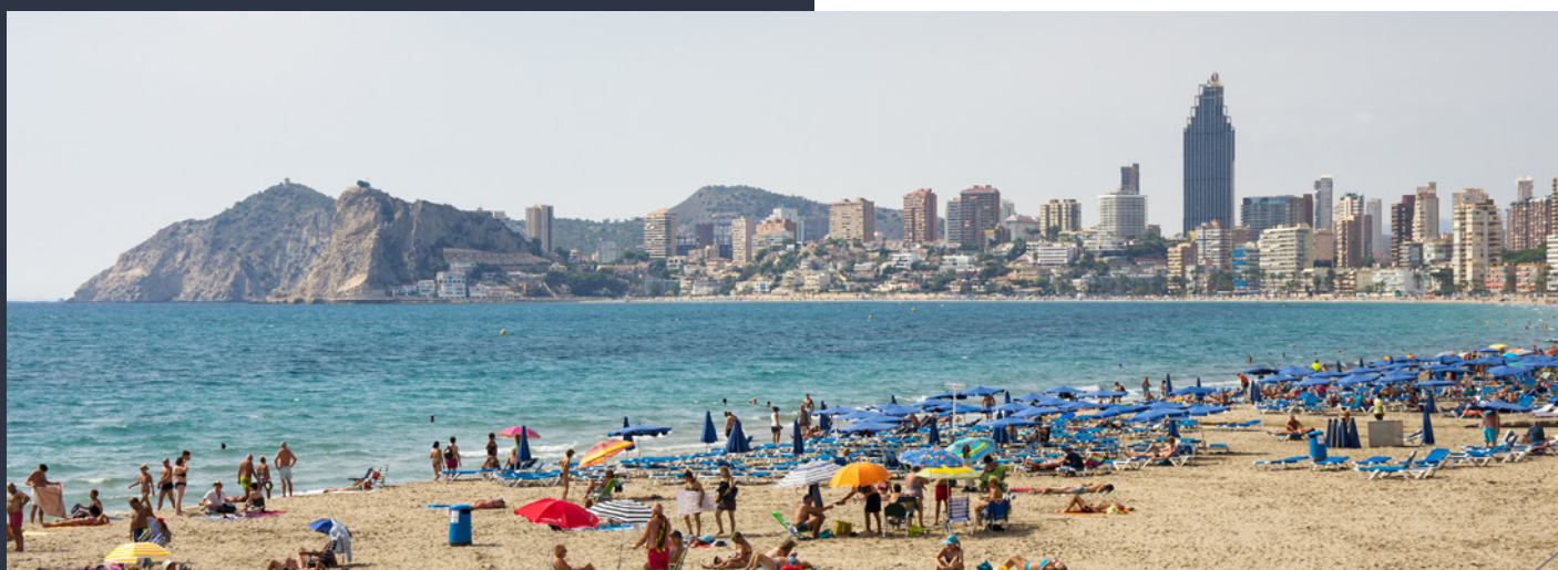
▲ PRAIA DO LEVANTE ALICANTE

Quando cair a noite , serás deslumbrado pelos néon. Em Benidorm vais encontrar pubs e bares LGBTI+ para todos os gostos. Desfruta de espetáculos e performances com as drag queens do momento, ou dança até ao amanhecer numa das festas na primeira linha da praia.