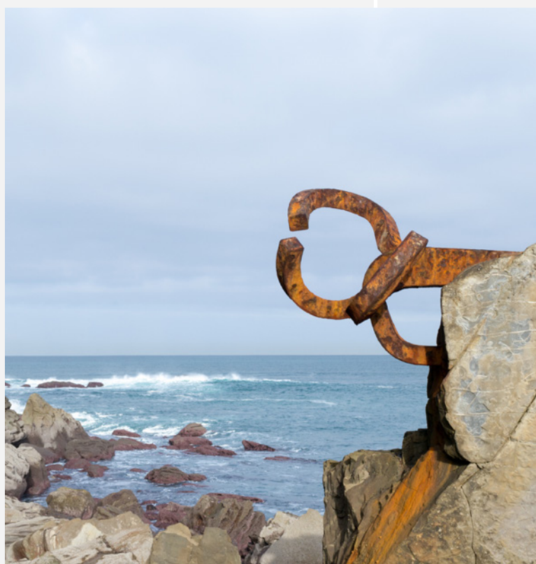
▲ EL PEINE DEL VIENTO (O PENTE DO VENTO) SAN SEBASTIÁN, GUIPÚSCOA