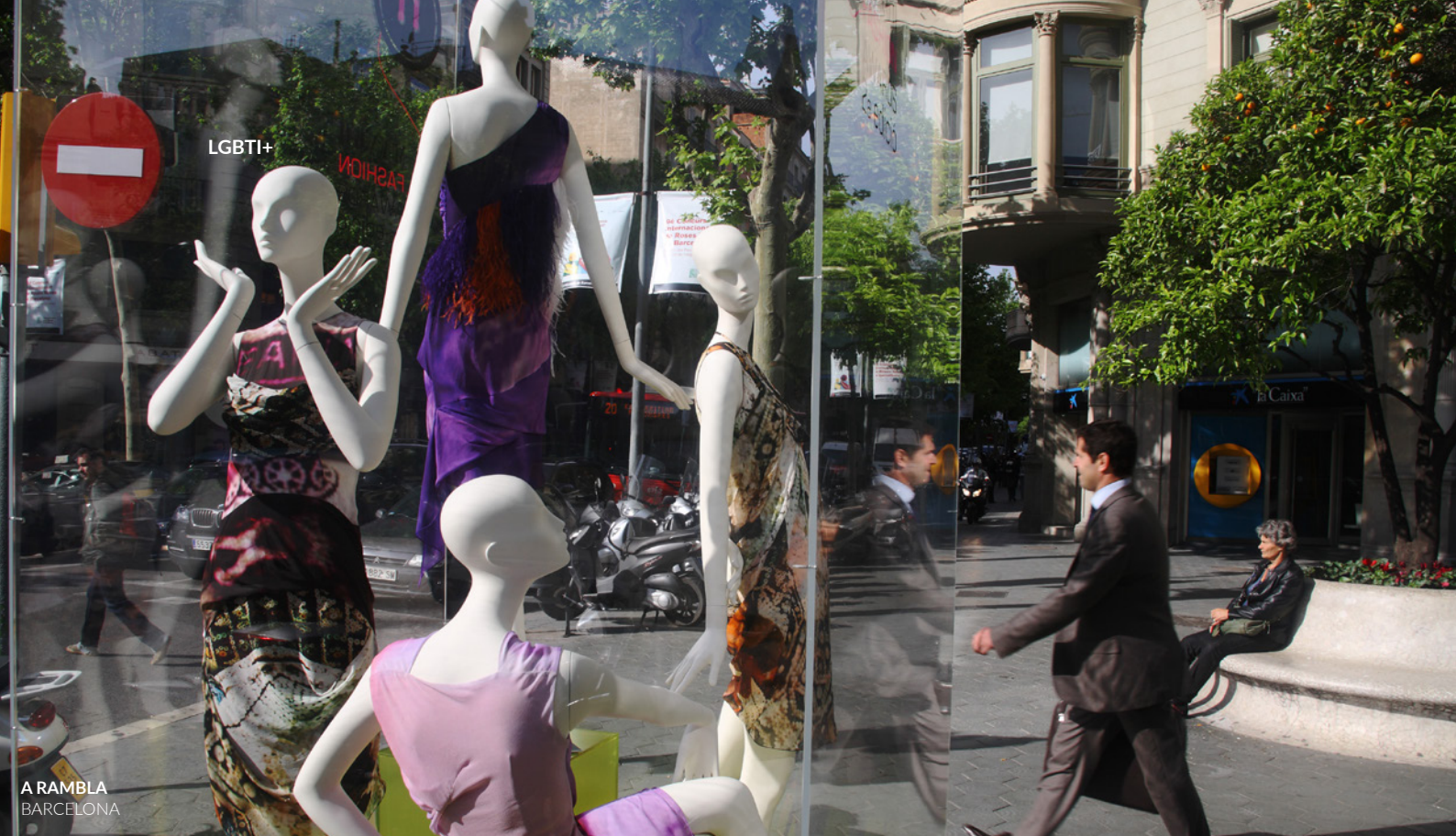
A RAMBLA BARCELONA

E, claro, aqui também poderás ir às compras . Nas suas ruas vais encontrar lojas de roupa de desenho, galerias de arte, adegas e lojas de todos os tipos. Se procuras nomes da alta costura e marcas espanholas de luxo, dá um passeio pela arborizada