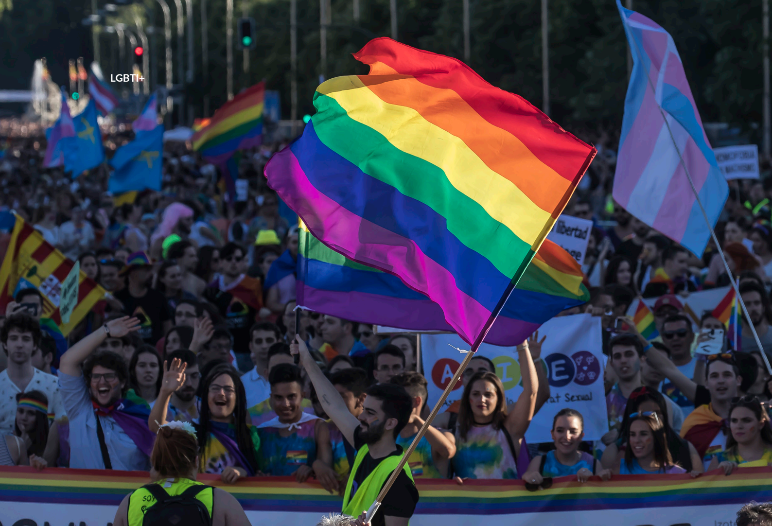
▲ MARCHA DO ORGULHO GAY NA PORTA DE ALCALÁ MADRID