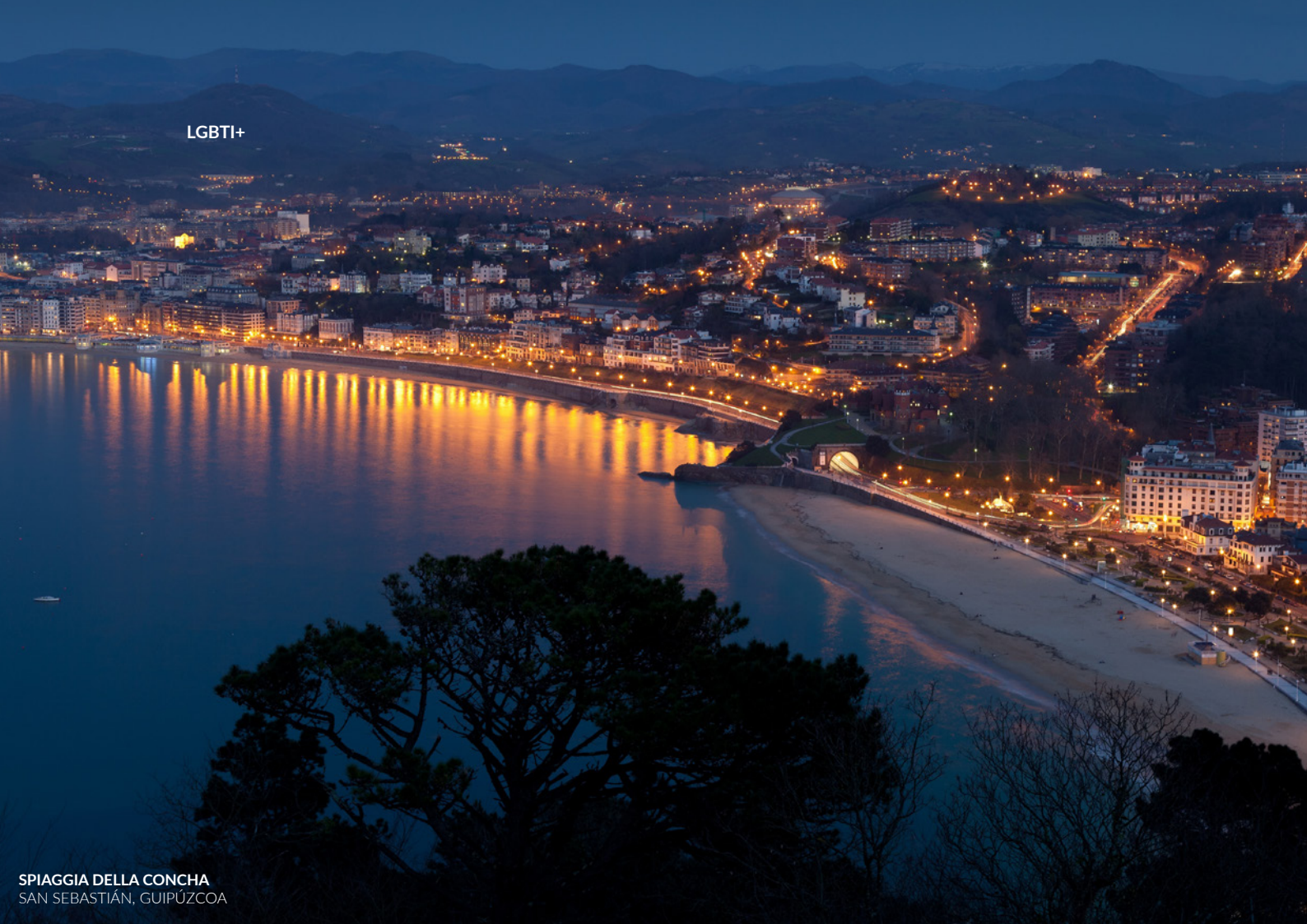
SPIAGGIA DELLA CONCHA SAN SEBASTIÁN, GUIPÚZCOA