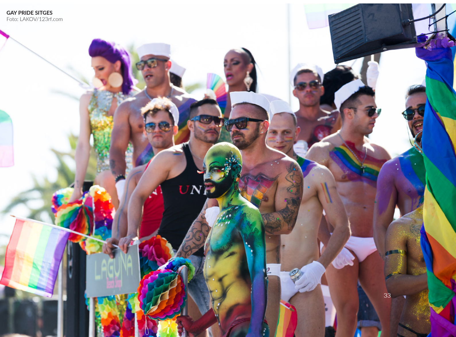
GAY PRIDE SITGES

Due settimane di festa ininterrotta... accetti la sfida? Visita Barcellona nel mese di agosto e scopri questo festival popolarissimo. Partecipa alle sue famose feste in piscina , balla al ritmo della musica selezionata dai Dj del momento e divertiti con la grande festa del parco acquatico Illa Fantasia . Il festival offre anche un programma di attività culturali e sportive , come pure incontri su temi LGBTI+.