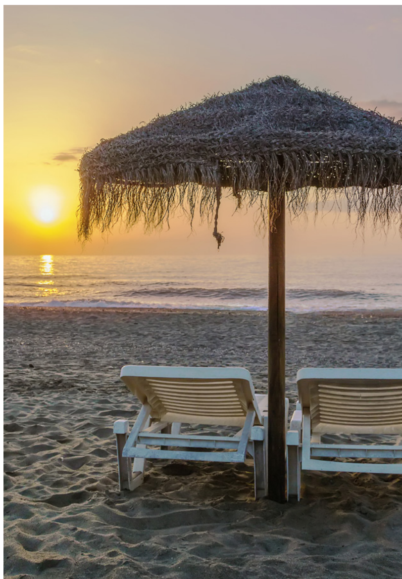
▲ SPIAGGIA DI TORREMOLINOS MALAGA

Quando ti sarai stancato del tumulto del lungomare, potrai lasciarti alle spalle il fermento della zona più turistica visitando il Barrio del Calvario . È uno dei quartieri più tradizionali di Torremolinos. Potrai prendere qualcosa in una delle sue tipiche taverne confondendoti con la gente del posto. Piazza Blas Infante e la fontana dei Manantiales non ti lasceranno indifferente.