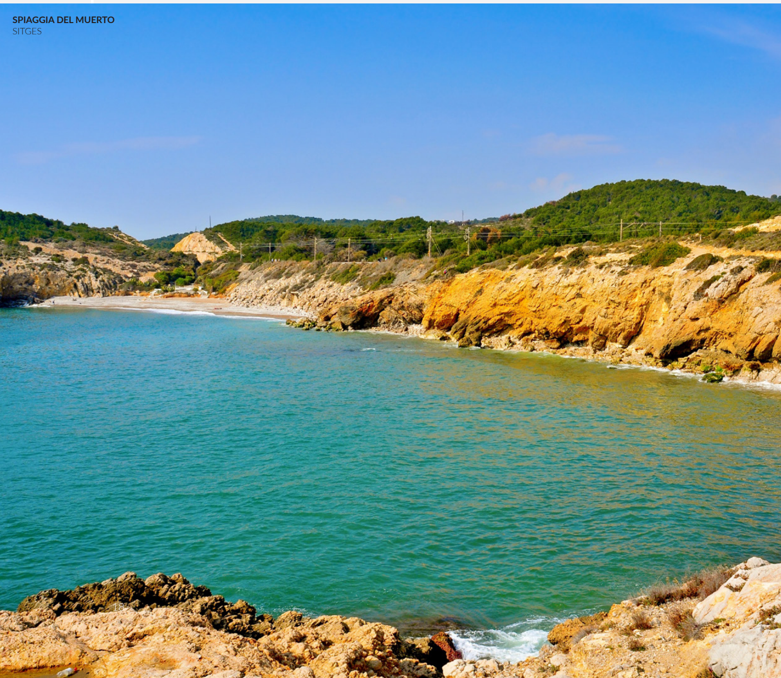
SPIAGGIA DEL MUERTO SITGES

Se vai a Barcellona, riserva qualche giornata per goderti Sitges. Le strade pittoresche, le spiagge e un'ampia offerta per il pubblico LGBTI+ ne fanno il luogo ideale da abbinare a una visita al capoluogo catalano. In questo paesino del litorale ti aspettano musei, ristoranti, discoteche, negozi e lunghe passeggiate. Vieni a scoprirlo!