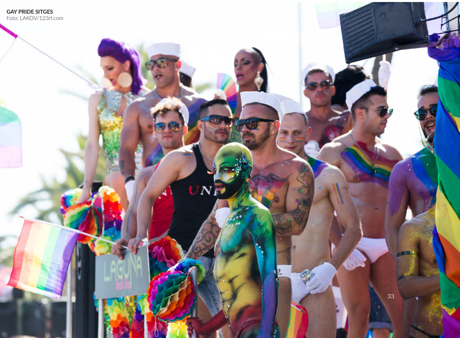
GAY PRIDE SITGES

Trauen Sie sich zu, zwei Wochen zu feiern? Kommen Sie im August nach Barcelona und nehmen Sie an diesem riesigen Festival teil. Machen Sie mit bei den berühmten Pool-Partys , tanzen Sie im Rhythmus der Musik, die von angesagten DJs aufgelegt wird, und amüsieren Sie sich auf der großen Party des Wasserparks Illa Fantasia . Das Festival bietet auch kulturelle und sportliche Aktivitäten so wie LGBTI+-Themenvorträge.