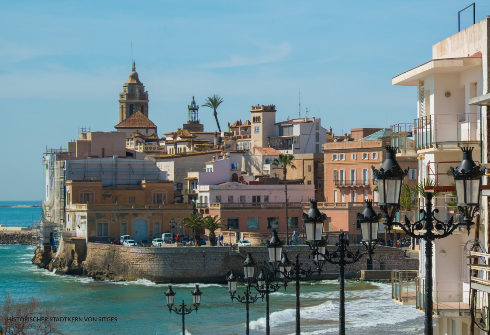
HISTORISCHER STADTKERN VON SITGES BARCELONA