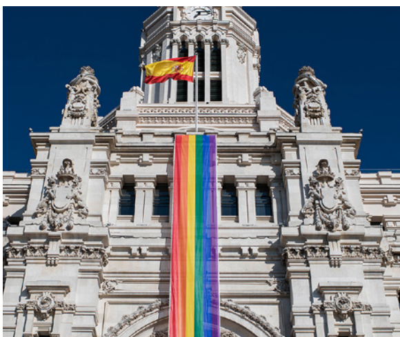
▲ RATHAUS VON MADRID

Lernen Sie die Hauptstadt Spaniens kennen und stellen Sie fest, dass die Vielfalt in der ganzen Stadt spürbar ist. Möchten Sie in einem speziell für Sie entworfenen Viertel bummeln? Kommen Sie nach Chueca und erleben Sie es!