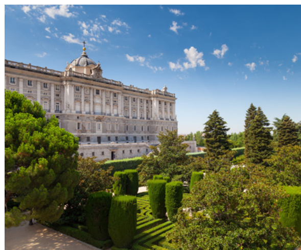
▲ KÖNIGSPALAST MADRID