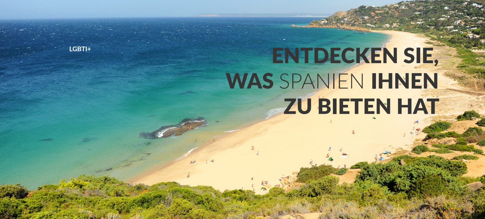
▲ STRAND PLAYA DE LOS ALEMANES ZAHARA DE LOS ATUNES, CÁDIZ

Genießen Sie das Meer, den Sand und die Sonne. Probieren Sie die Spezialitäten unserer köstlichen Gastronomie und besichtigen Sie unser kunsthistorisches Erbe. Entspannen Sie sich in den unterschiedlichsten Naturräumen und genießen Sie ein ausgezeichnetes Klima. All das und noch viel mehr ist möglich in Spanien.