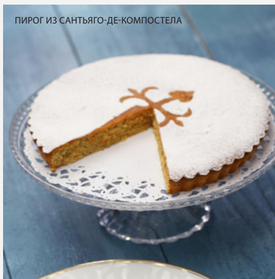
ПИРОГ ИЗ САНТЬЯГО-ДЕ-КОМПОСТЕЛА

Почувствуйте себя настоящим жителем Сантьяго, отправившись за покупками на продовольственный рынок Меркадо-де-Абастос . Здесь вы найдете различные рыночные заведения, в которых сможете попробовать галисийские свежие овощи, сыры и морепродукты.