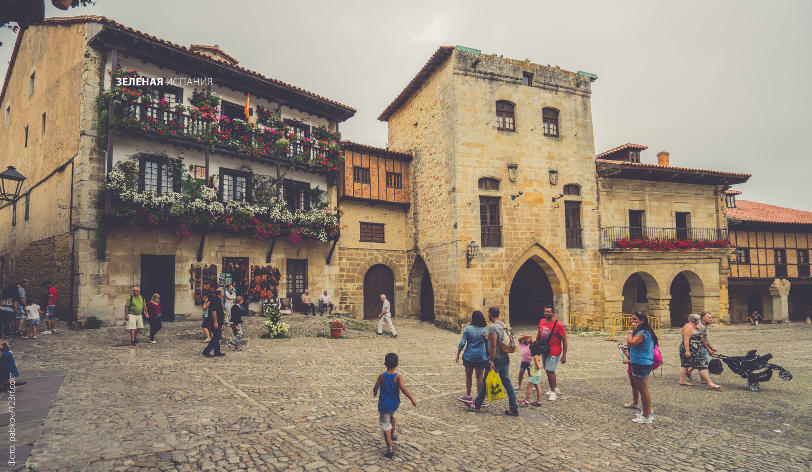
▲ САНТИЛЬЯНА-ДЕЛЬ-МАР КАНТАБРИЯ