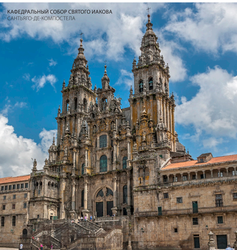
КАФЕДРАЛЬНЫЙ СОБОР СВЯТОГО ИАКОВА САНТЬЯГО-ДЕ-КОМПОСТЕЛА

Послушайте легенды китобоев в старинных портах, таких как Луарка , а затем отправьтесь в галисийские земли через реку Эо из Кастрополя в Рибадео .