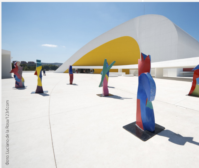
▲ КУЛЬТУРНЫЙ ЦЕНТР ИМЕНИ НИМЕЙЕРА АВИЛЕС

Если вы хотите отдохнуть, идеальным вариантом станет путешествие по Пути термальных источников реки Миньо . Закройте глаза и погрузитесь в теплую воду под звездным небом. Побывайте в местных термальных центрах, таких как термальные бассейны Чаваскейра, Бургас-де-Канедо, а также Муино-да-Вейга и Утарис.