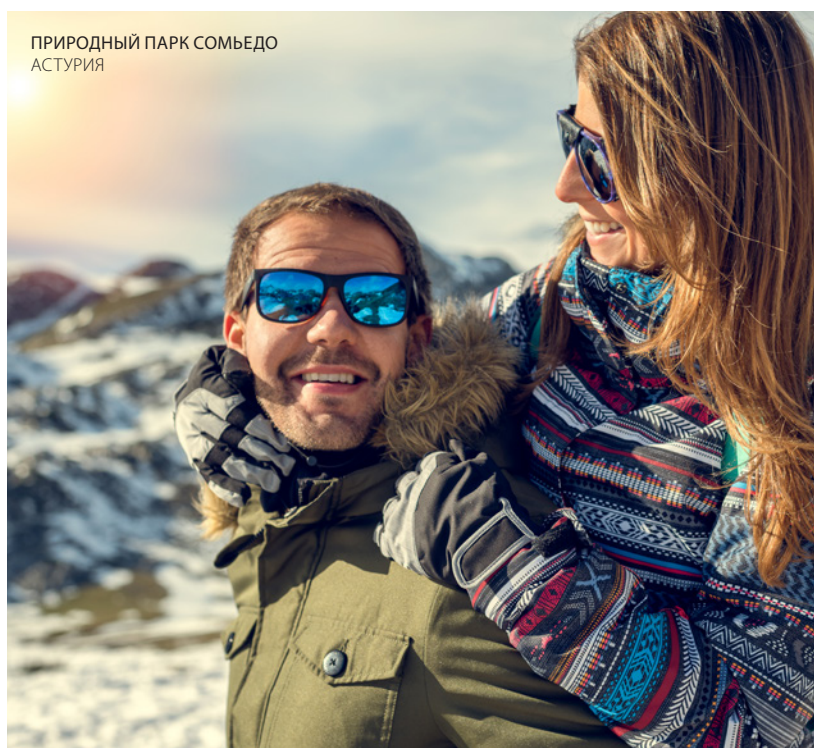
ПРИРОДНЫЙ ПАРК СОМЬЕДО АСТУРИЯ