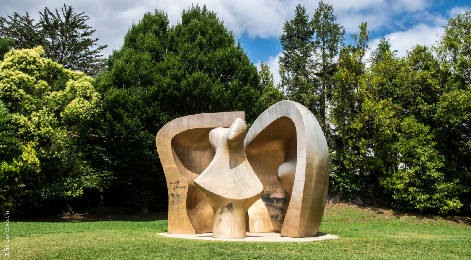
▲ ПАРК НАРОДОВ ЕВРОПЫ ГЕРНИКА, БИСКАЙЯ

Сараутц , на длинном пляже которого вы с удивлением обнаружите серфингистов со всей планеты. Также вы попадете в родной город дизайнера Баленсьяги Гетарию , где сможете посетить его музей, а также в Гернику , настоящий символ Страны Басков. Во время Гражданской войны по приказу Гитлера город подвергся бомбардировке немецкой авиации. Это событие так потрясло Пабло Пикассо , что он запечатлел его в своей картине — шедевре, который носит название города. Также ваш путь пройдет через менее известные районы и тихие долины, усеянные деревенскими домиками, где вы сможете воочию убедиться в гостеприимстве местных жителей.