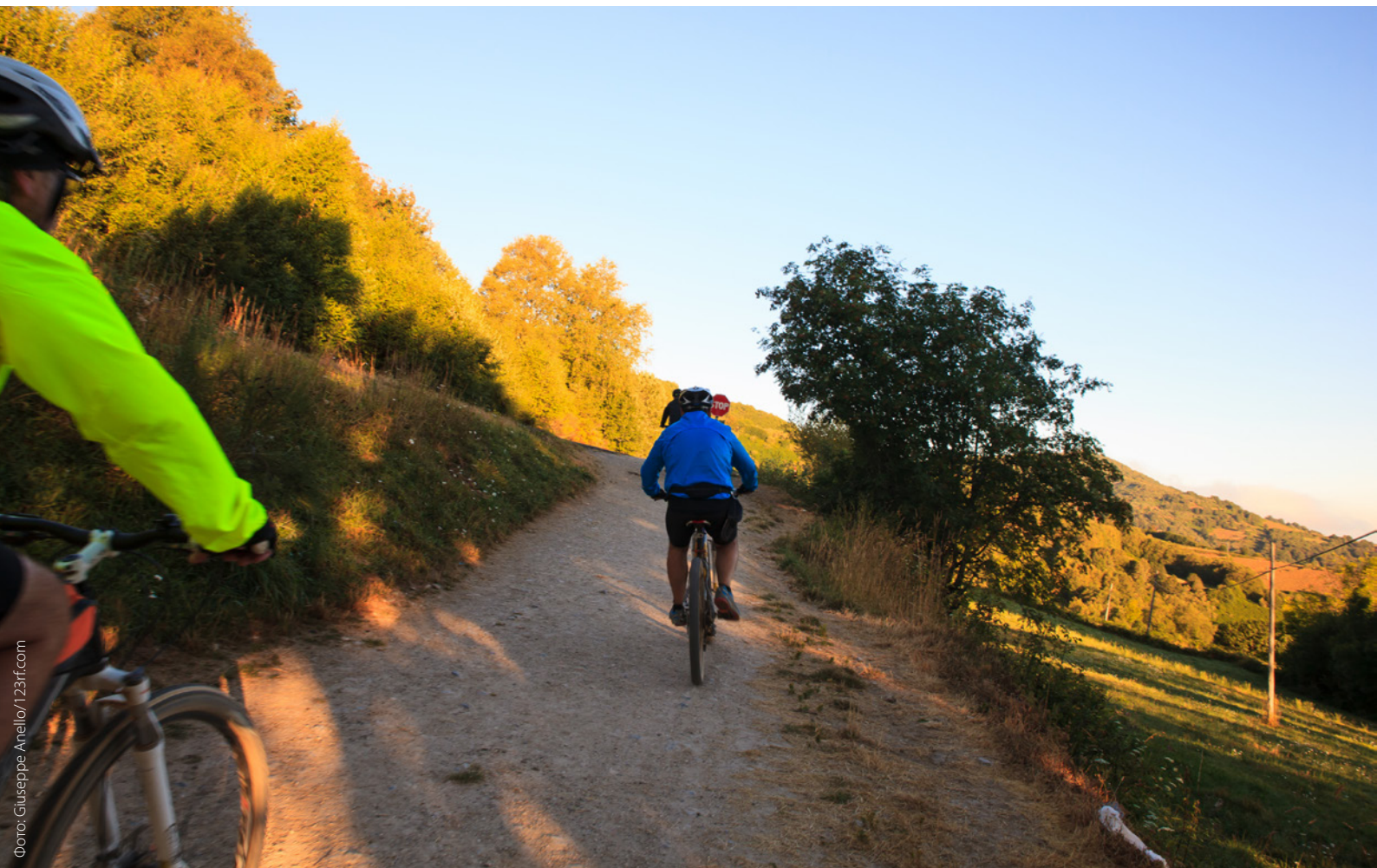
▲ ПУТЬ СВЯТОГО ИАКОВА НА ВЕЛОСИПЕДЕ

Оставьте позади повседневные заботы и отправьтесь пешком или на поезде по историческим маршрутам из одной точки севера Испании в другую. Это путешествие изменило множество жизней. В нем вы получите массу самых разных впечатлений, которые навсегда останутся в вашей памяти.