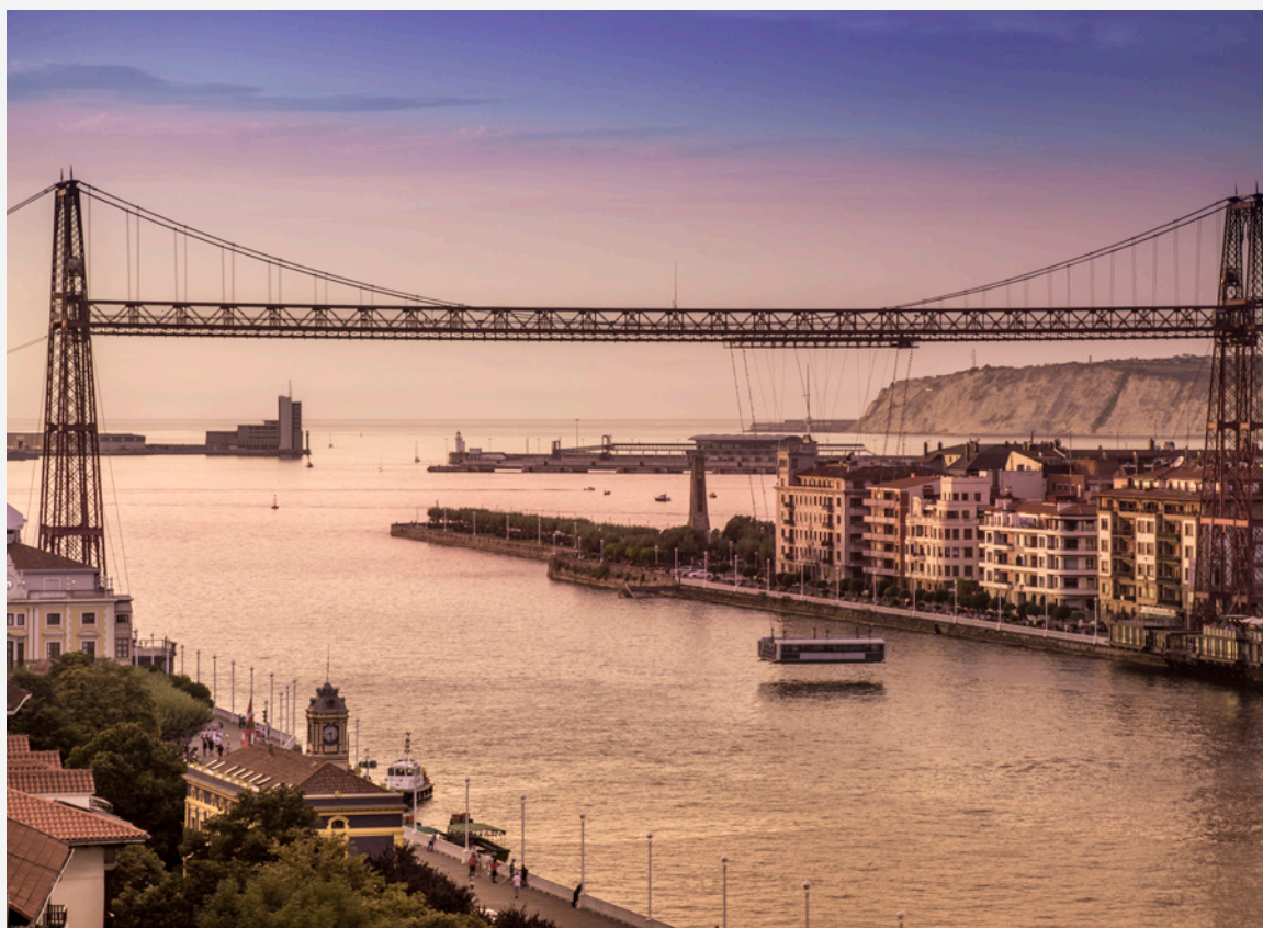
▲ PONTE BIZKAIA GETXO, BISCAIA

Depois, passeia de bicicleta ao lado da ria até ao centro histórico, onde podes repor forças num dos restaurantes e bares das suas animadas Siete Calles . Prossegue o teu caminho e irás cruzar o rio Nervión pela Ponte Bizkaia , uma espetacular estrutura de ferro de estilo modernista.