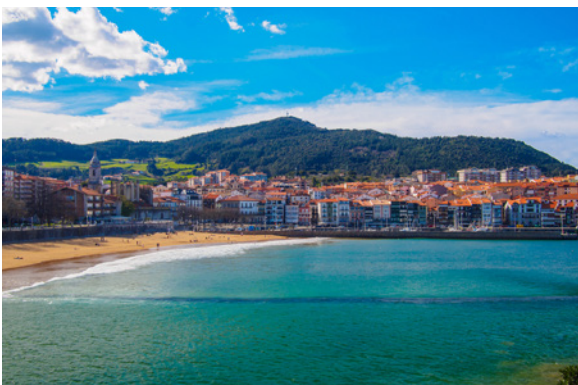
▲ LEKEITIO BISCAIA