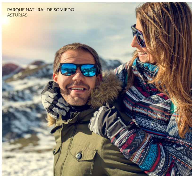
PARQUE NATURAL DE SOMIEDO ASTÚRIAS