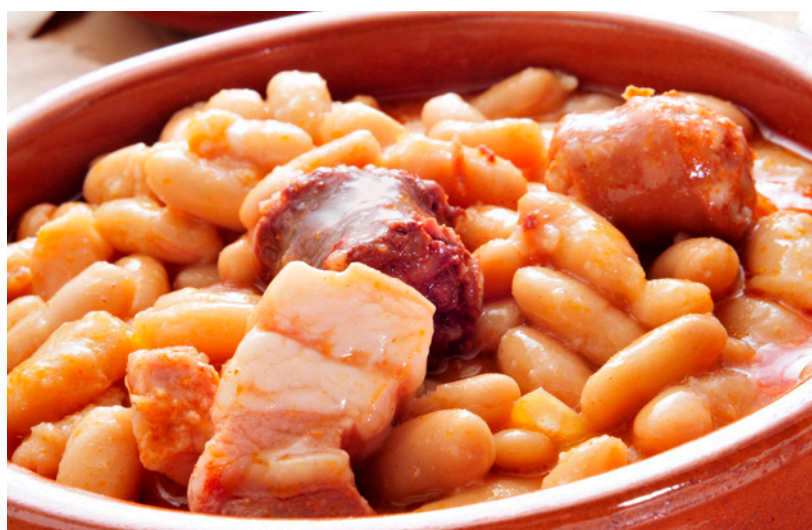
▲ FABADA ASTURIANA

Lascia un po' di spazio per il dessert, perché il meglio arriva alla fine del pasto: prova la quesada pasiega , una morbida crema cotta al forno tipica della Cantabria, o la torta di Santiago , dolce della Galizia a base di mandorle, zucchero e uova.