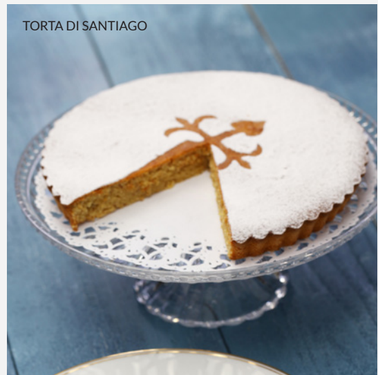
TORTA DI SANTIAGO

Vivi Santiago come uno dei suoi abitanti e fai la spesa ai mercati generali . Troverai vari locali con cucina di mercato, per gustare le migliori verdure fresche, i formaggi e i frutti di mare della Galizia.