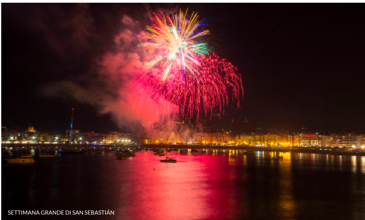
SETTIMANA GRANDE DI SAN SEBASTIÁN

Regalati un viaggio ricco di sensazioni in qualsiasi periodo dell'anno. Ecco alcune proposte.