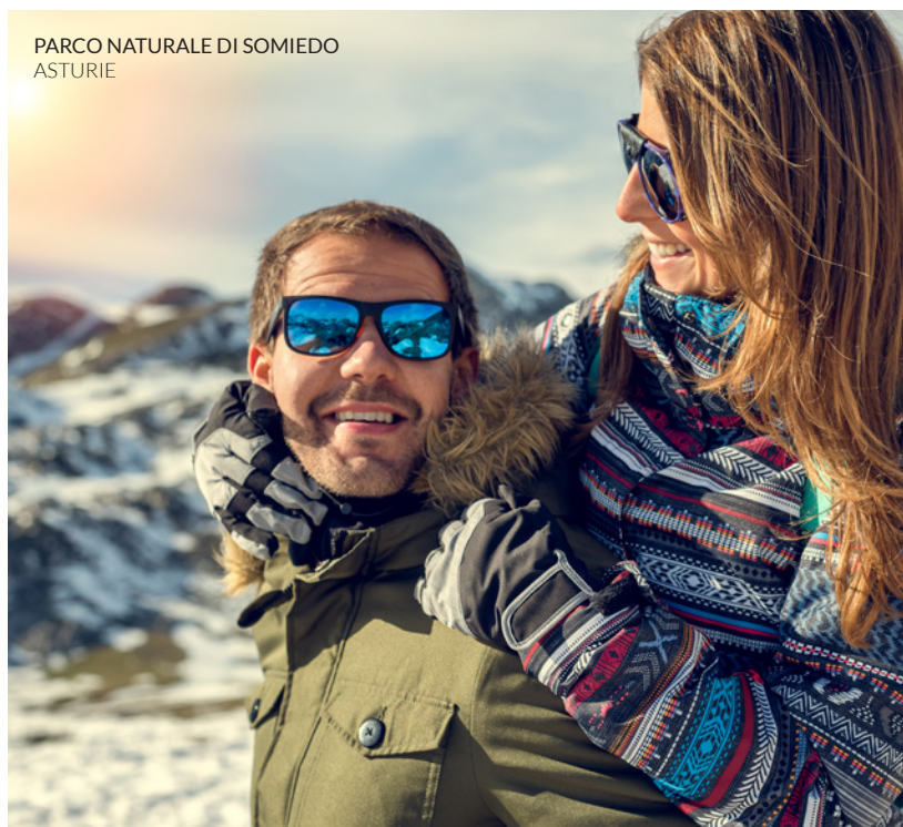
PARCO NATURALE DI SOMIEDO ASTURIE