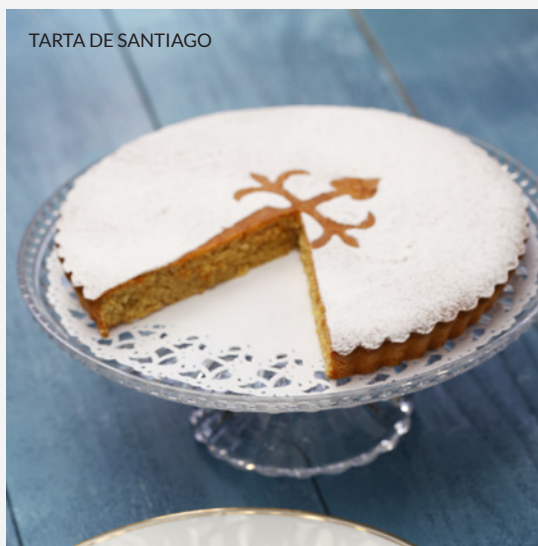
TARTA DE SANTIAGO

Vivez Saint-Jacques à la manière de ses habitants, en faisant vos courses au marché central . Vous y trouverez plusieurs étals de cuisine de marché où goûter les meilleurs légumes frais, des fromages et des fruits de mer galiciens.