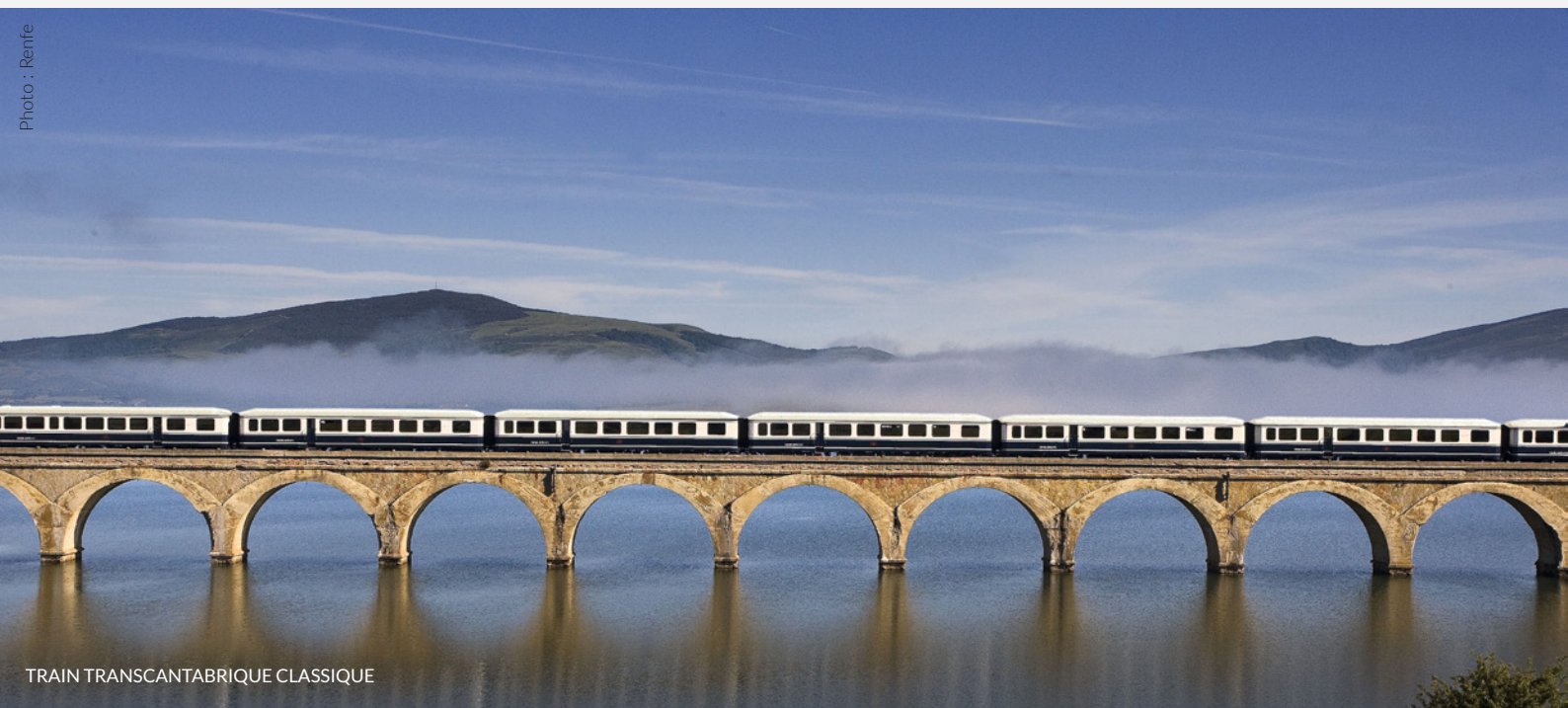
TRAIN TRASCANTABRIQUE CLASSIQUE