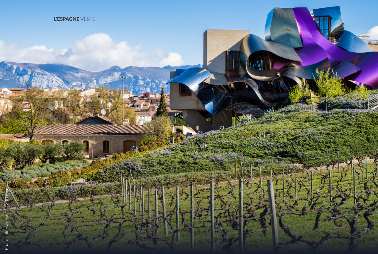
▲ CAVE MARQUÉS DE RISCAL ELCIEGO, ÁLAVA