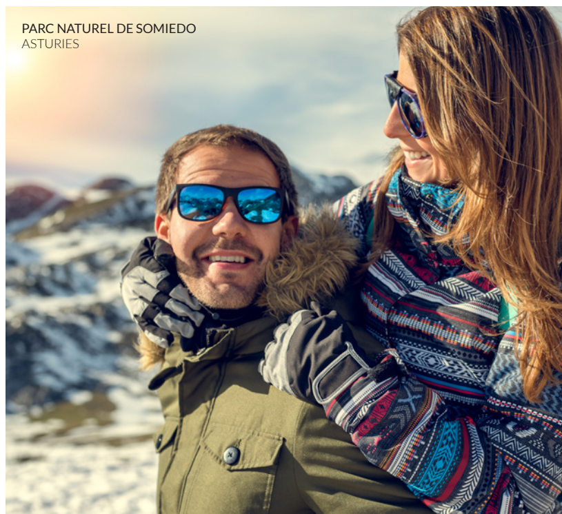
PARC NATUREL DE SOMIEDO ASTURIES