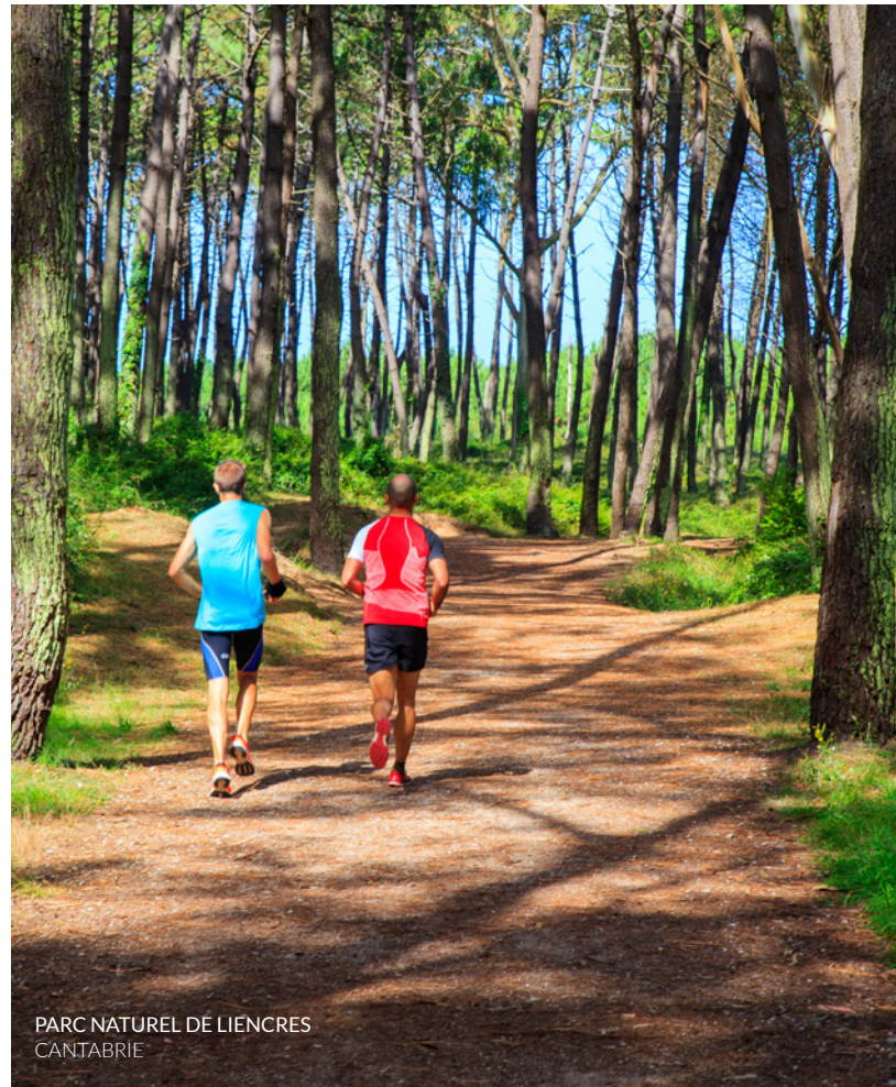
PARC NATUREL DE LIENCRES CANTABRIE

Mais il y a bien plus encore à faire : en Galice, rendez-vous au sommet des plus hautes falaises d'Europe à A Capelada . Effectuez le circuit du Flysh , avec ses falaises imposantes, sur la côte basque. C'est là que se trouve l'ermitage San Juan de Gaztelugatxe , qui a servi de décor pour la célèbre série télévisée Le Trône de fer .