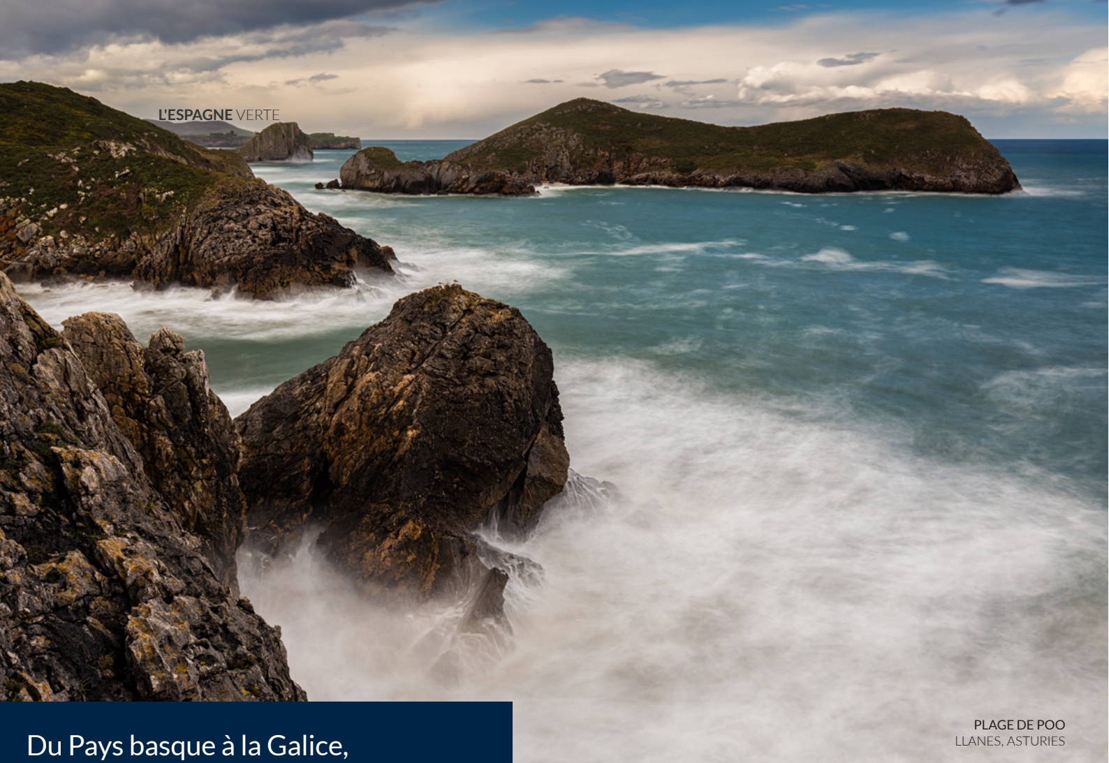
PLAGE DE POO LLANES, ASTURIES

Du Pays basque à la Galice, l'Espagne verte est bordée de plages spectaculaires.