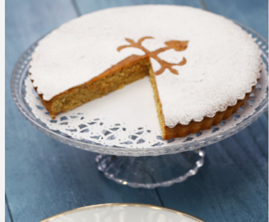
TARTA DE SANTIAGO DE COMPOSTELA

Vive Santiago como lo hacen sus vecinos, comprando en el Mercado de Abastos . Encontrarás varios locales de cocina de mercado para probar las mejores verduras frescas, quesos y mariscos gallegos.