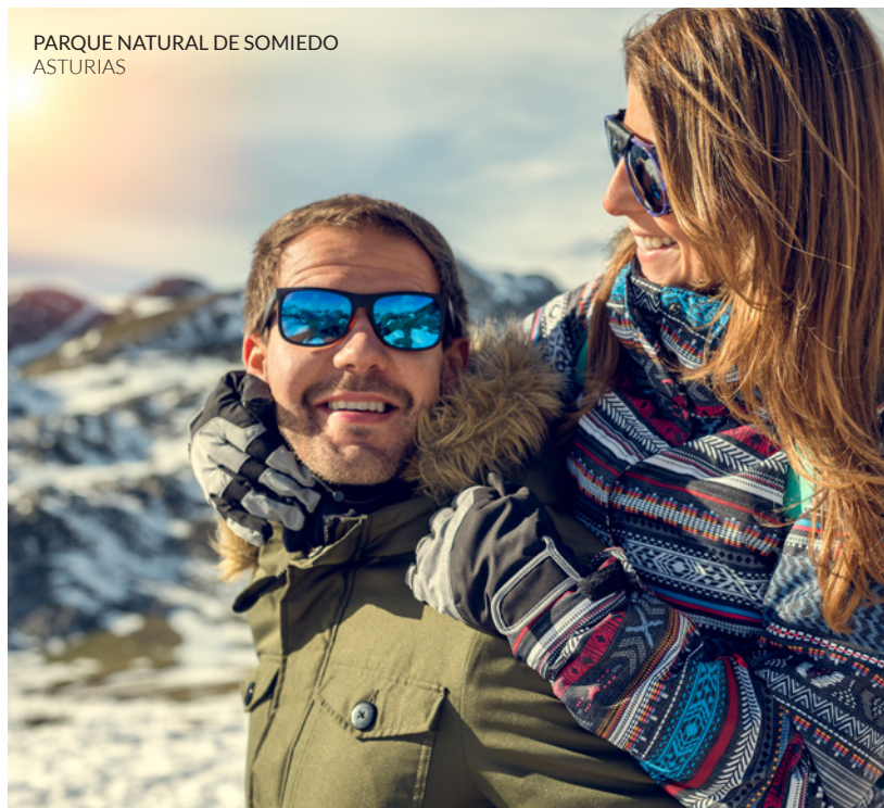
PARQUE NATURAL DE SOMIEDO ASTURIAS