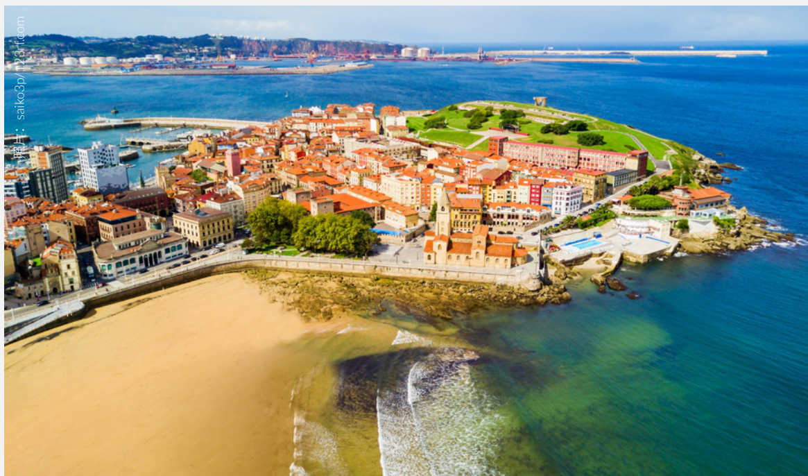
▲ 圣洛伦佐海滩 希洪

如果你喜欢历史和建筑，奥维耶多的宫殿会让你眼花缭乱。从博物馆所在的贝拉尔德 (Velarde) 宫到一座宏伟的十八世纪豪宅——坎波萨格拉多 (Camposagrado) 宫或者巴洛克风格的瑰宝——孔德德多雷诺 (Conde de Toreno) 宫。