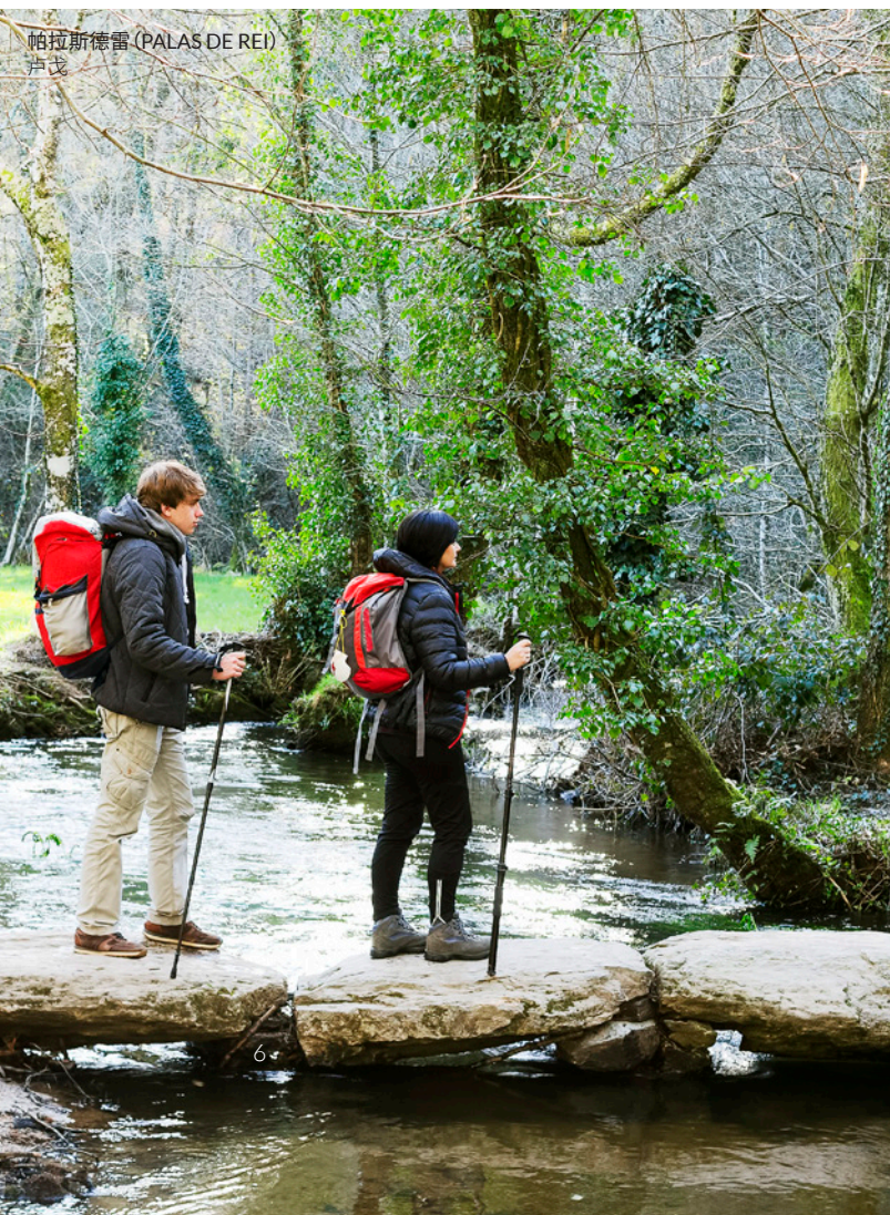
帕拉斯德雷 (PALAS DE REI) 卢戈

这是所有圣地亚哥朝圣之路中最古老的一条。沿着9世纪起朝圣者们从阿斯图里亚斯内部西侧开辟的路径继续行走。从阿斯图里亚斯自治区首府——奥维耶多出发。一个充满生机且历史文化遗迹众多的城市。穿过阿斯图里亚斯中心，在水流丰富的河道、陡峭的峡谷、瀑布以及千年橡树林之间，你仿佛已与自然融为一体。在途中你可以看到如同萨拉斯（Salas）这样被称为历史遗迹群的小镇。随后你将经过阿亚德（Allande）和格兰达斯德萨利梅（Grandas de Salime）市镇，这里的卡隆蒂奥山脉和巴耶多尔山脉保护区的风景会让你赞叹不已。现在你已经离加利西亚很近了，在萨利梅水库你可以看到美妙的景致。在与法国之路交汇之前，在帕拉斯德雷（Palas de Rei）（卢戈）你会登上高出海平面1003米的美丽的阿尔多德尔阿塞波（Alto del Acebo）顶峰。