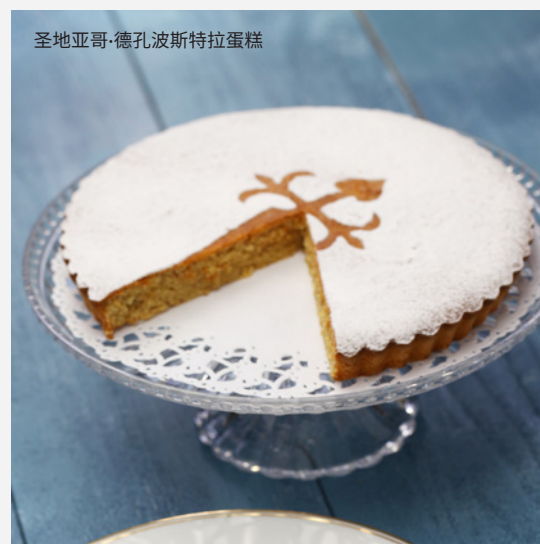
圣地亚哥·德孔波斯特拉蛋糕

像当地人一样在圣地亚哥生活，去阿瓦斯多斯市场（Mercado de Abastos）采购。你可以找几个当地的美食市场，品尝最好的新鲜蔬菜、奶酪和加利西亚海鲜。