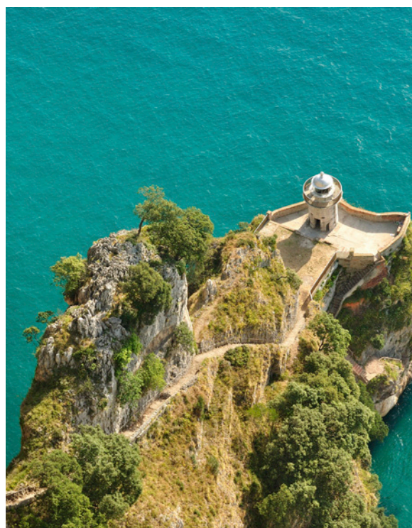
▲ 卡瓦斯灯塔 坎塔布里亚的桑多尼亚

在这几个月里，大自然在漫长的冬季过后复苏。准备在阿斯图里亚斯的自然公园来一次真正的冒险，寻找棕熊和其他野生动物的踪迹。在索米耶多（Somiedo）或者福恩德斯德纳尔赛阿（Fuentes de Narcea）公园壮观的景色中找到它，体验一次难忘的经历。