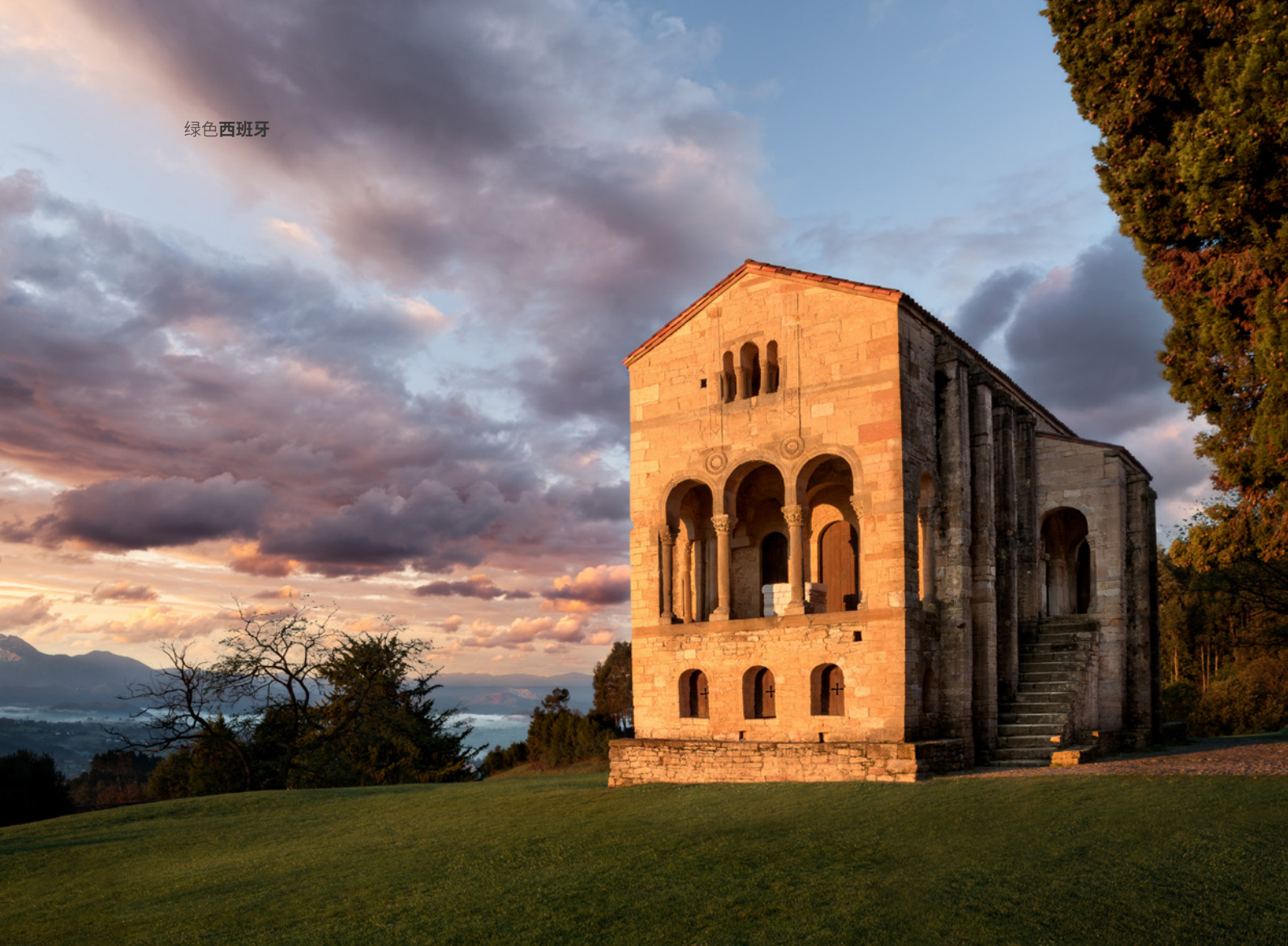
▲ 圣玛利亚德尔那朗科 奥维耶多