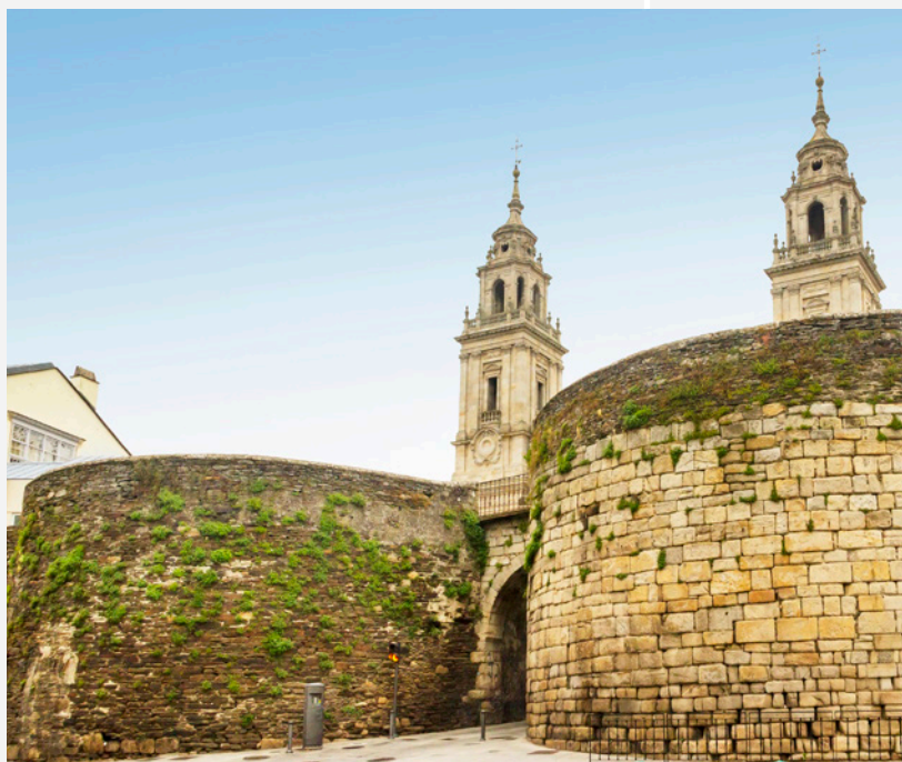
▲ 古罗马教堂和城墙 卢戈