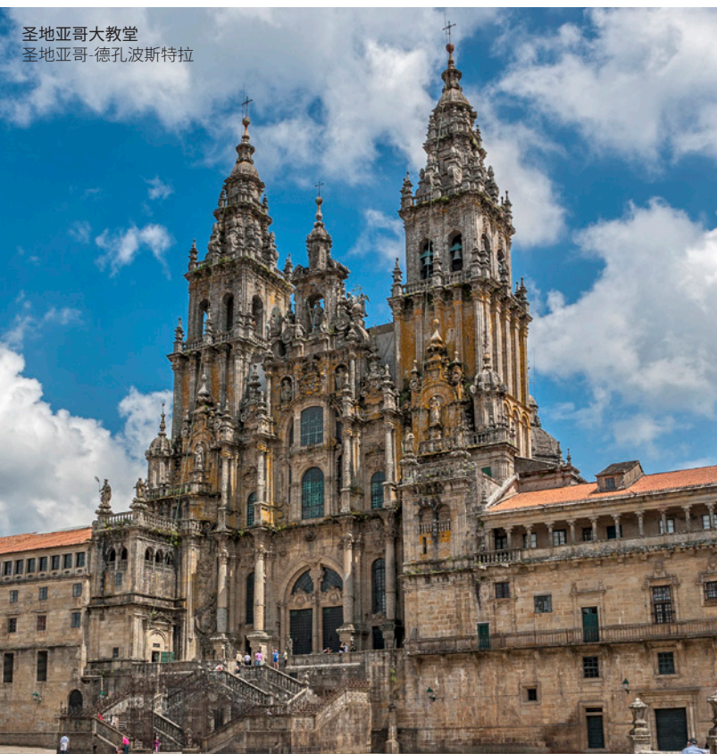
圣地亚哥大教堂 圣地亚哥-德孔波斯特拉

你将听到旧捕鲸港口的传说，例如卢阿尔卡（Luarca），然后你穿过埃奥河口（la ría del Eo）从卡斯特罗波尔到里瓦德奥进入加利西亚地区。