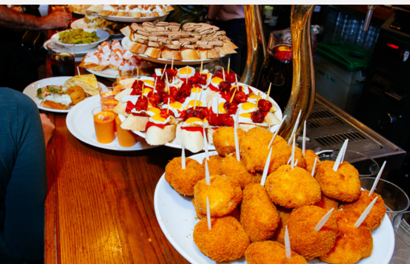
▲ 小吃 (PINTXO) 圣塞巴斯蒂安

请漫步于绿色西班牙的城市：都是被大自然包围的地方，充满了壮观的遗迹和丰富的文化生活。