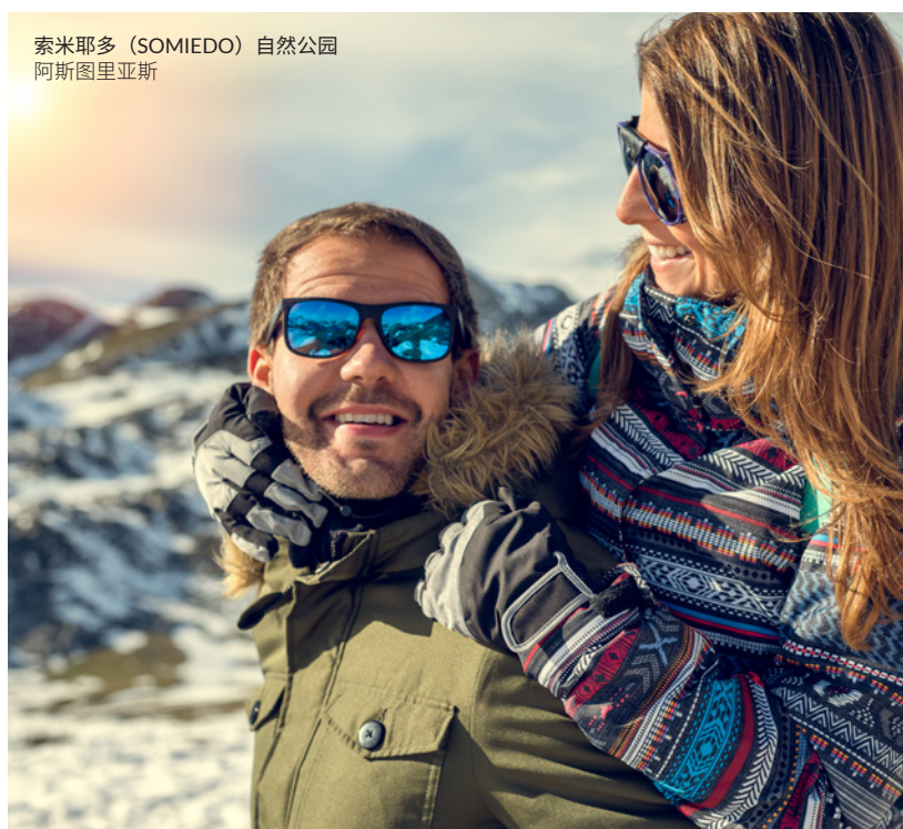
索米耶多（SOMIEDO）自然公园 阿斯图里亚斯