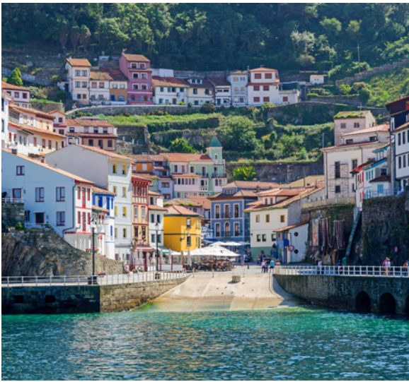
▲ 古迪耶罗 阿斯图里亚斯