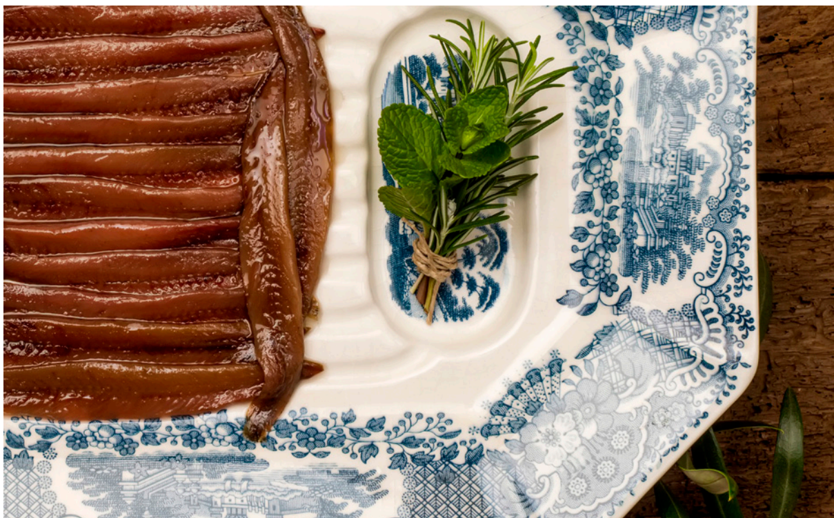
▲ 桑多尼亚的欧洲鳀罐头 坎塔布里亚