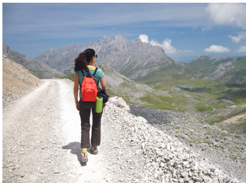
▲ 欧洲之峰国家公园 坎塔布里亚

当你游览坎塔布里亚时，你还会发现一个壮观的地下世界，那有成千上万个洞穴，在那可以进行洞穴学研究。其中，埃尔索普拉奥（El Soplao）洞穴最突出，以其石头和水晶的形状而闻名世界。