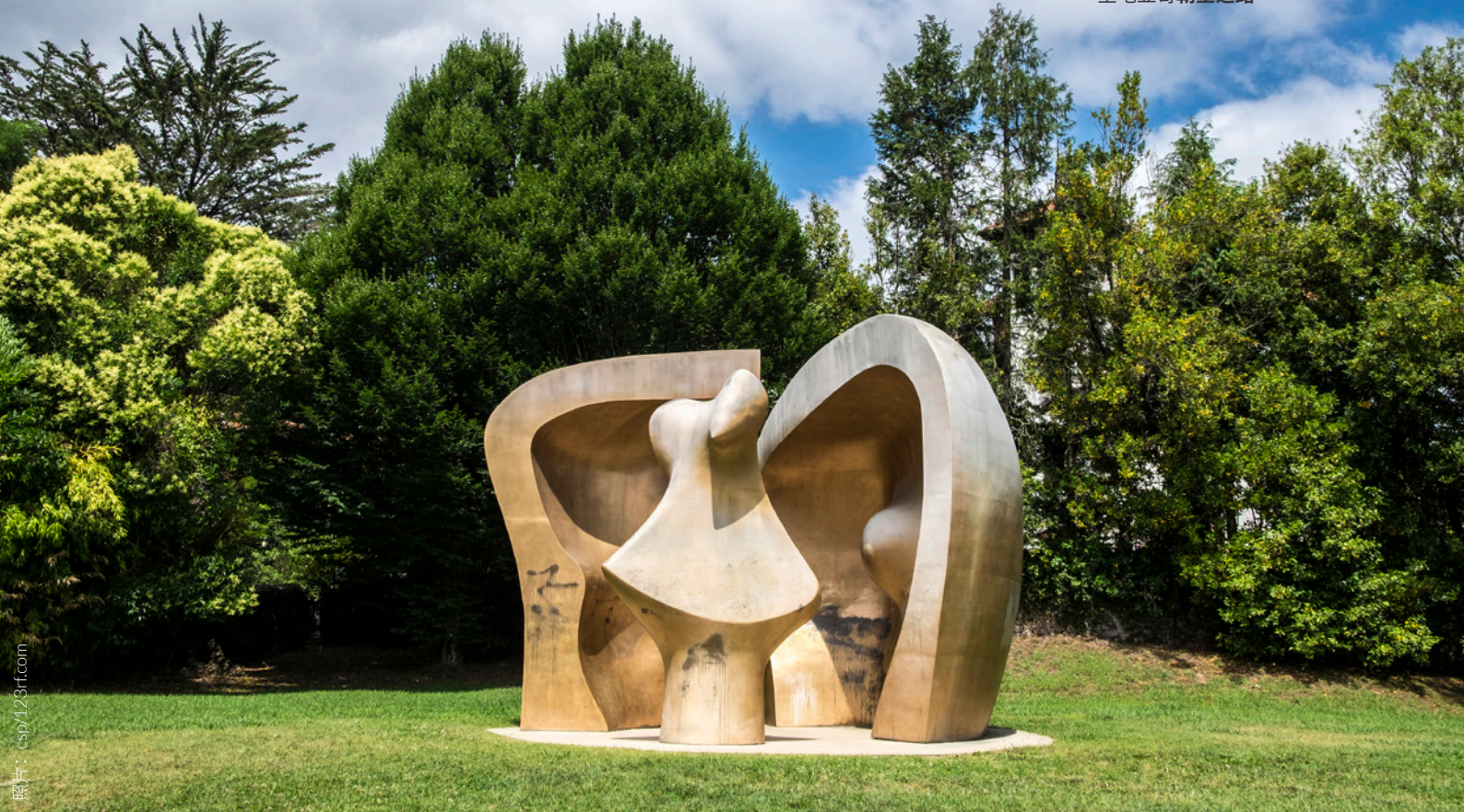
▲ 欧洲人民公园 比斯开格尔尼卡

会在它那长长的海滩看到来自世界各地的冲浪者。它还经过赫塔里亚，在那里你可以参观巴黎世家博物馆，那个著名的时装设计师就出生于此；还有格尔尼卡，它是巴斯克人的象征。该城在内战时期被希特勒派来的德国空军轰炸，这也启发了巴布罗·毕加索画下与该城同名的代表作。这条路线还包括鲜为人知的地区和人迹罕至的山谷，点缀着村落，在那你将亲自感受人们的和蔼可亲。