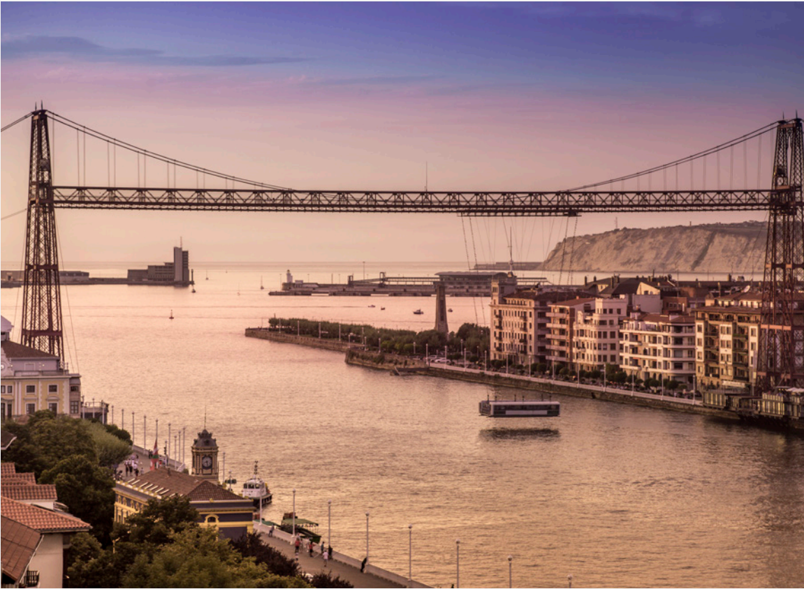
▲ BISKAYA-BRÜCKE GETXO, VIZCAYA

Fahren Sie anschließend mit dem Fahrrad entlang der Mündung in die Altstadt, wo Sie in einem der Restaurants und Bars der lebhaften Siete Calles neue Kraft tanken können. Danach überqueren Sie den Fluss Nervión über die Biskaya-Brücke , eine spektakuläre Eisenkonstruktion aus der Zeit des Jugendstils.