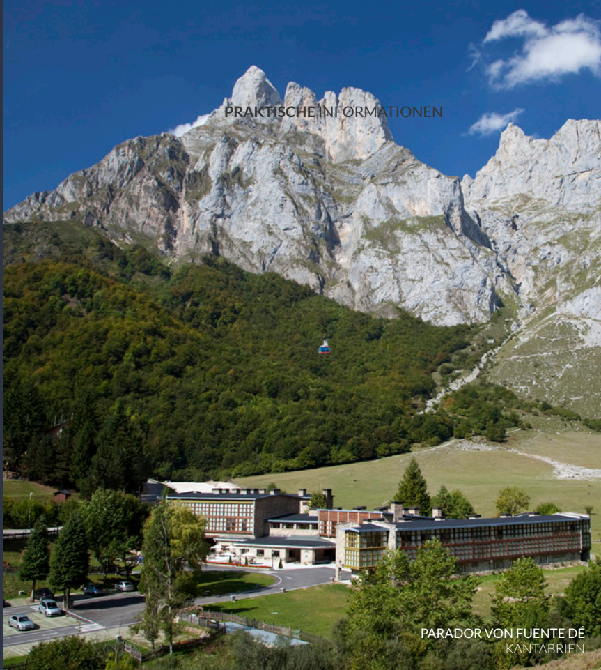
PARADOR VON FUENTE DE KANTABRIEN

Schlafen Sie in Kantabrien im Parador-Hotel von Limpias wie ein König. Der Palast ist von schönen Gärten umgeben, die zum Entspannen einladen. Und erkunden Sie auch die reizenden Nachbarorte. Oder logieren Sie im Parador-Hotel von Santillana del Mar , einem charmanten kantabrischen Herrenhaus, und genießen Sie die Atmosphäre dieses schönen mittelalterlichen Ortes ganz in der Nähe der Höhle von Altamira. Im Parador-Hotel von Fuente Dé können Sie auch umgeben von hohen Bergen schlafen.