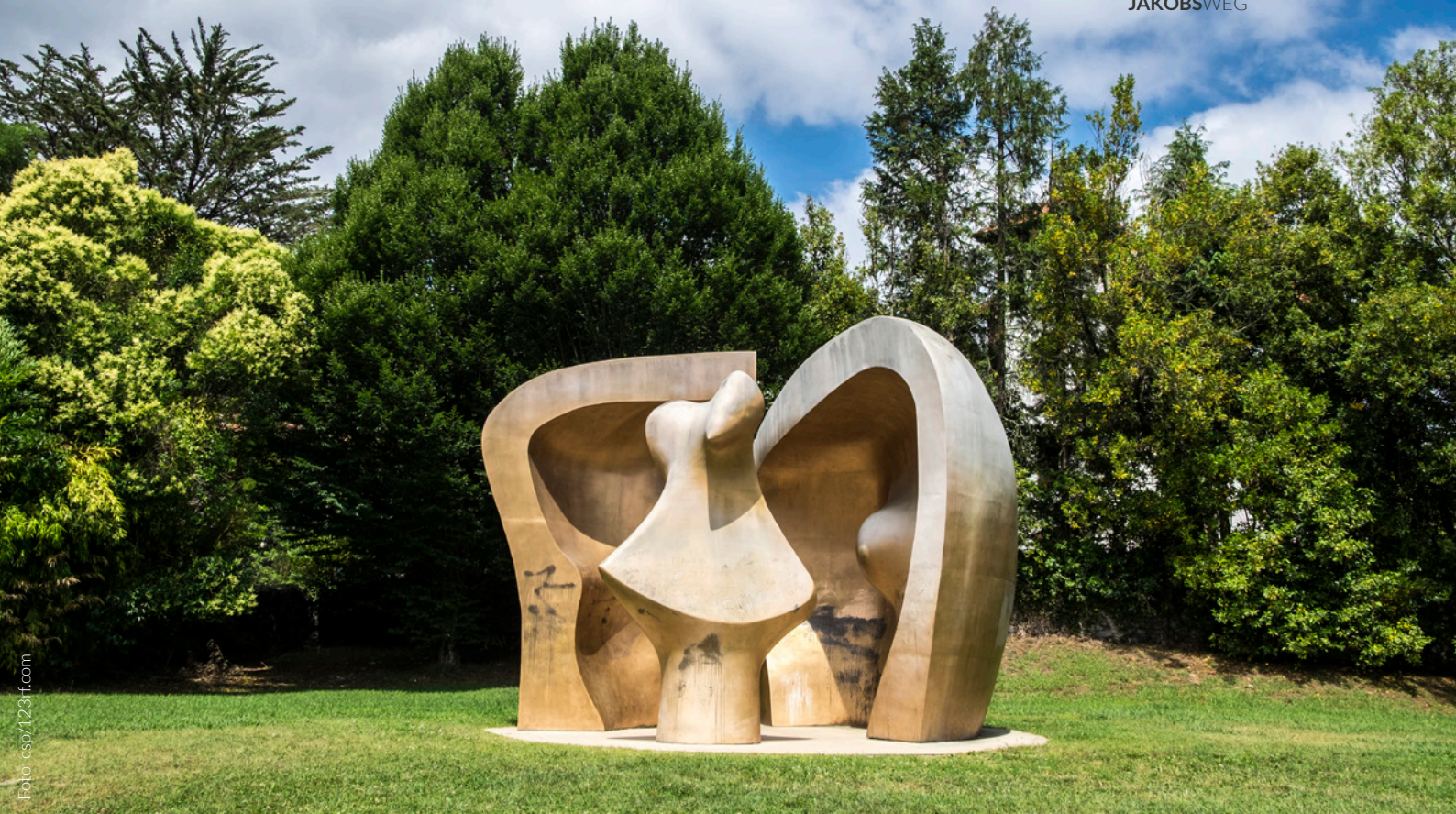
▲ PARK DER VÖLKER EUROPAS GERNIKA, BIZKAIA

bao und umfasst wunderschöne Orte wie Orio , wo wir Ihnen den gegrillten Fisch empfehlen, oder Zarautz mit seinem langen Strand, wo Sie über die Surfer aus aller Welt staunen werden. Er führt auch durch Getaria mit dem Balenciaga-Museum, das dem berühmten Modeschöpfer in seinem Geburtsort gewidmet wurde, und durch Gernika , ein symbolträchtiger Ort für die Basken. Während des Bürgerkriegs wurde er 1937 von deutschen Luftstreitkräften vollständig zerstört, was Pablo Picasso zu dem berühmten Gemälde inspirierte, das den Namen des Dorfes trägt. Die Route geht weiter durch weniger bekannte Gegenden und abgelegene Täler, wo Sie sich in situ von der Freundlichkeit der Menschen überzeugen können.