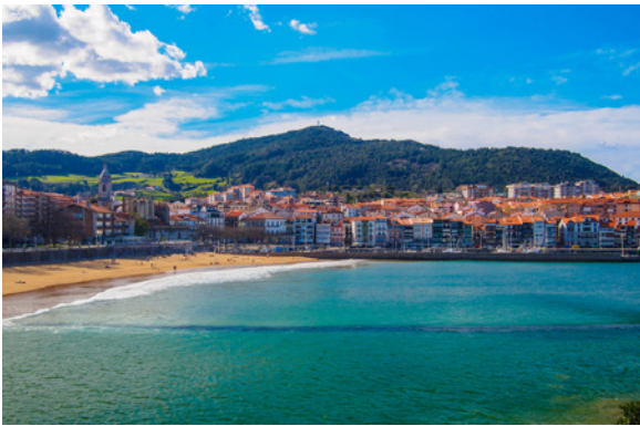
▲ LEKEITIO BIZKAIA