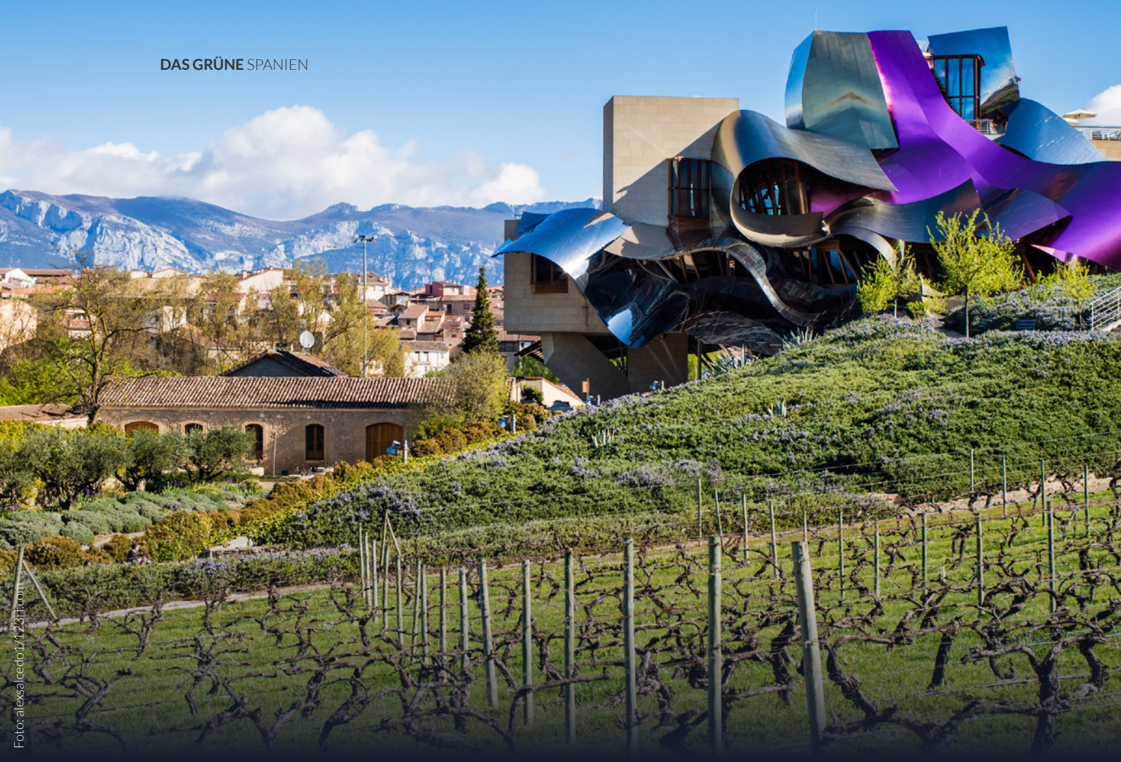
▲ BODEGAS MARQUÉS DE RISCAL ELCIEGO, ÁLAVA