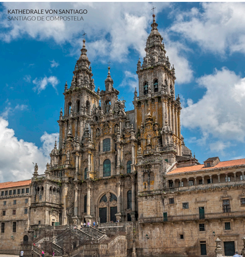
KATHEDRALE VON SANTIAGO SANTIAGO DE COMPOSTELA

In ehemaligen Walfanghäfen wie Luarca wird altes Seemannsgarn gesponnen, bevor Sie über die Mündung des Eo von Castropol nach Ribadeo Galiciens erreichen.