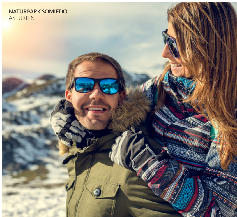
NATURPARK SOMIEDO ASTURIEN