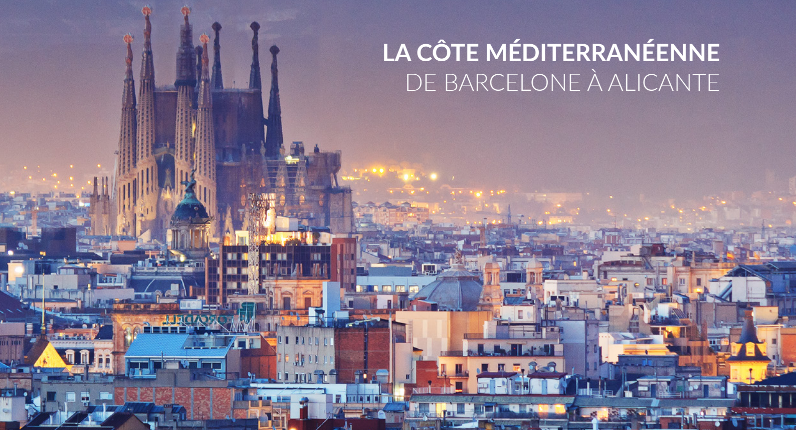
▲ VUE DE BARCELONE

Découvrez la côte méditerranéenne et ses jolis villages de pêcheurs, des criques à l'eau turquoise, de beaux sites historiques et une gastronomie savoureuse. Une grande partie de ce circuit se déroule sur l'A-7, la voie express de la Méditerranée, et sur d'autres routes qui courent parallèles à la côte. Si vous êtes en voiture, roulez toutes vitres ouvertes, dans la brise marine.