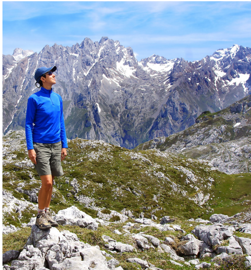
▲ PICS D'EUROPE CANTABRIE

Continuez en direction de la Galice et rattrapez la route des phares et des plages sauvages reliant Ribadeo (pro-