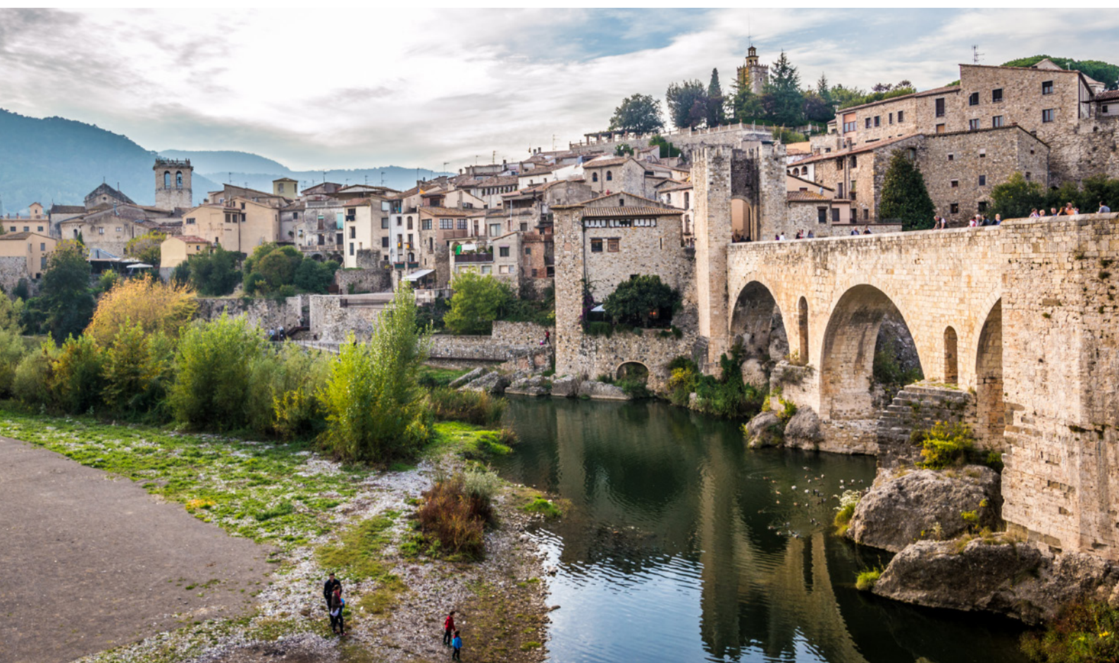
▲ BESALÚ PROVINCE DE GÉRONNE