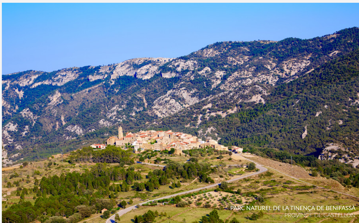
PARC NATUREL DE LA TINENÇA DE BENIFASSÀ PROVINCE DE CASTELLÓN