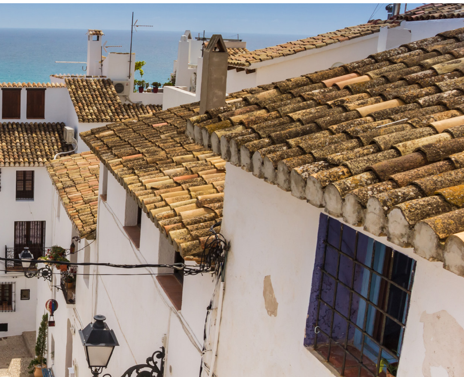
▲ ALTEA PROVINCE D'ALICANTE

Valence. Faites une pause dans de petites criques à Denia , Jávea ou Calpe , ou bien dans le charmant village d' Altea . Un bel endroit que vous reconnaîtrez aux deux coupoles bleues brillantes de l'église paroissiale.