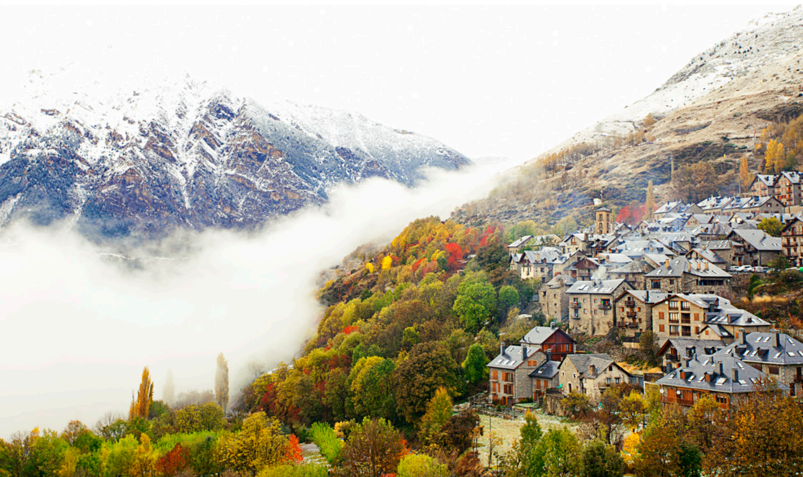
▲ VAL D'ARAN PROVINCE DE LLEIDA

Découvrez sur deux ou quatre roues les Pyrénées , la frontière naturelle entre l'Espagne et la France. Cette chaîne montagneuse de 430 kilomètres s'étend de la mer Cantabrique à la Méditerranée et cache de beaux paysages où vous pourrez sillonner les routes les plus pittoresques, entre cascades, vallées et bois.