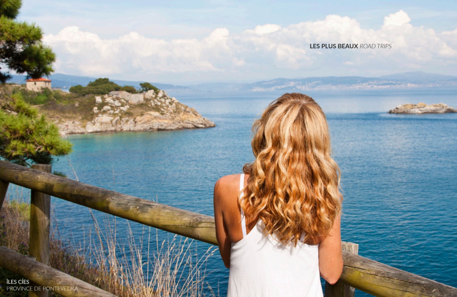
ÎLES CÍES PROVINCE DE PONTEVEDRA

vince de Lugo) à A Guarda (province de Pontevedra), un joli parcours le long de la côte galicienne avec ses falaises, ses plages et ses cités maritimes, et bien sûr, ses phares situés dans les décors les plus spectaculaires.