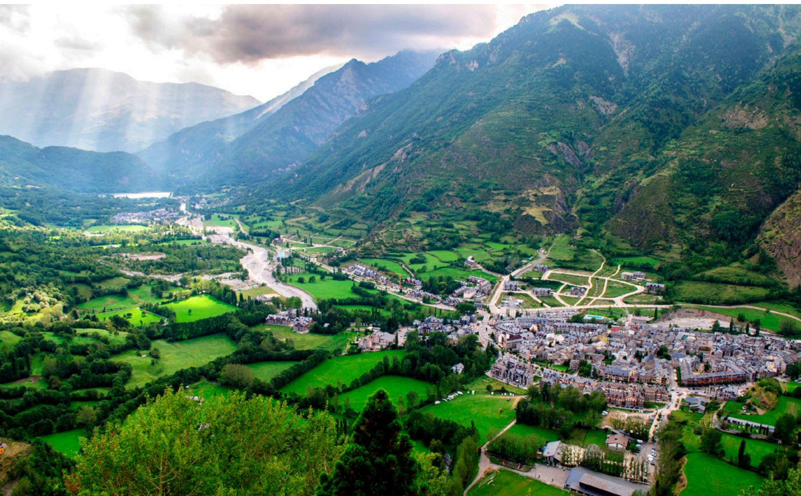
▲ BENASQUE PROVINCE DE HUESCA