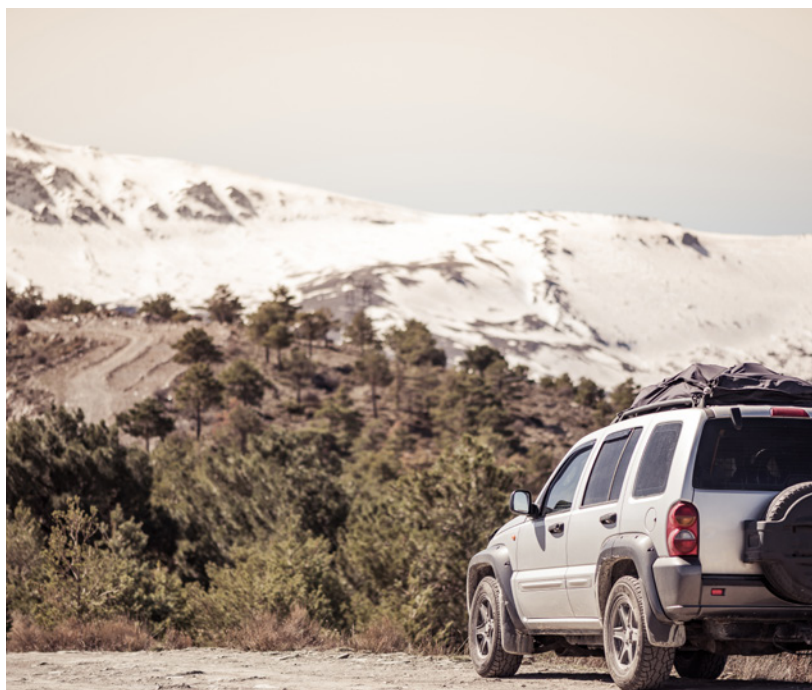
▲ VAL D'ARAN PROVINCE DE LLEIDA

d'un vert intense. Vous pouvez emprunter la N-260 vers l'ouest pour traverser La Garrotxa , célèbre pour ses volcans, et visiter son parc naturel. Faites des pauses ou de petits détours pour visiter des villages pleins de charme comme Besalú , une jolie cité médiévale, ou Castelfollit de la Roca , un des plus petits villages d'Espagne, qui s'étend sur une surface de moins d'1 km 2 . Soyez attentifs aux panneaux indiquant les nombreux belvédères qui jalonnent la route. Vous pourrez dévier vers la N-230 et conduire entre les vallées et les montagnes du val d'Aran (province de Lleida).