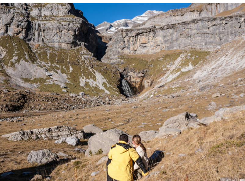
▼ PARC NATIONAL D'ORDESA Y MONTE PERDIDO PROVINCE DE HUESCA

Tout près, dans les Pyrenées arago-naises , dans la province de Huesca, se dresse le pic d'Aneto , le point culminant de la chaîne montagneuse. Revenez sur la N-260 et traversez des villages de montagne qui semblent tout droit tirés d'un conte, comme Benasque , Aínsa , Sallent de Gallego ou Ansó . La nature vous accompagnera sur tout votre parcours et vous parviendrez au parc national d'Ordesa y Monte Perdido , une zone protégée. Garez votre véhicule et parcourez le parc à pied ou à bord d'un bus spécial qui effectue des arrêts à trois belvédères spectaculaires.