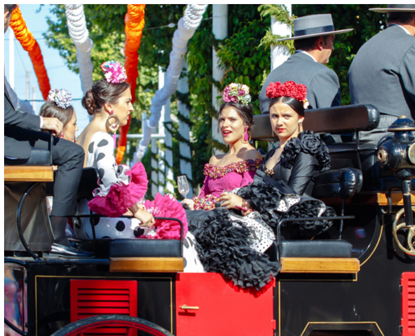
▲ FEIRA DE ABRIL SEVILHA

📍 Onde: Sevilha (Andaluzia) Quando: abril www.visitasevilla.es