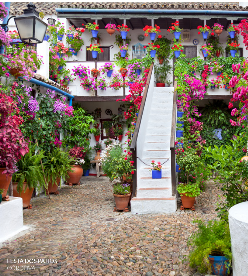
FESTA DOS PÁTIOS CÓRDOVA