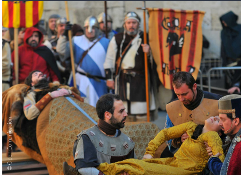
▲ FESTAS DAS BODAS DE ISABEL DE SEGURA TERUEL

📍 Onde: Alcoy (Alicante, Comunidade Valenciana) e Santillana del Mar (Cantábria) Quando: 5 de janeiro www.alcoyturismo.com www.turismodecantabria.com