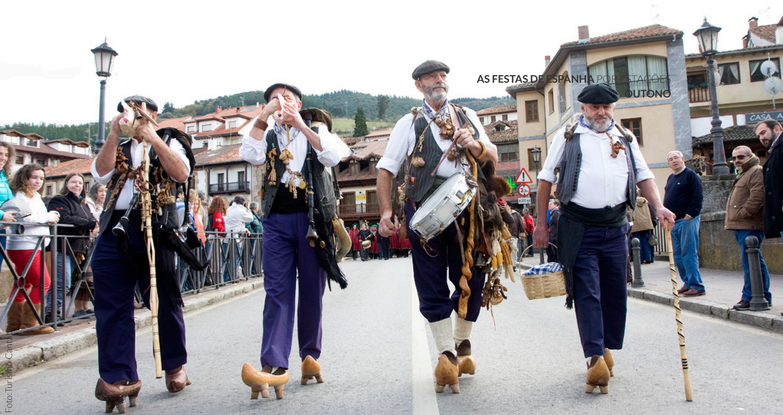
▲ FESTA DO «ORUJO» (BAGAÇO)