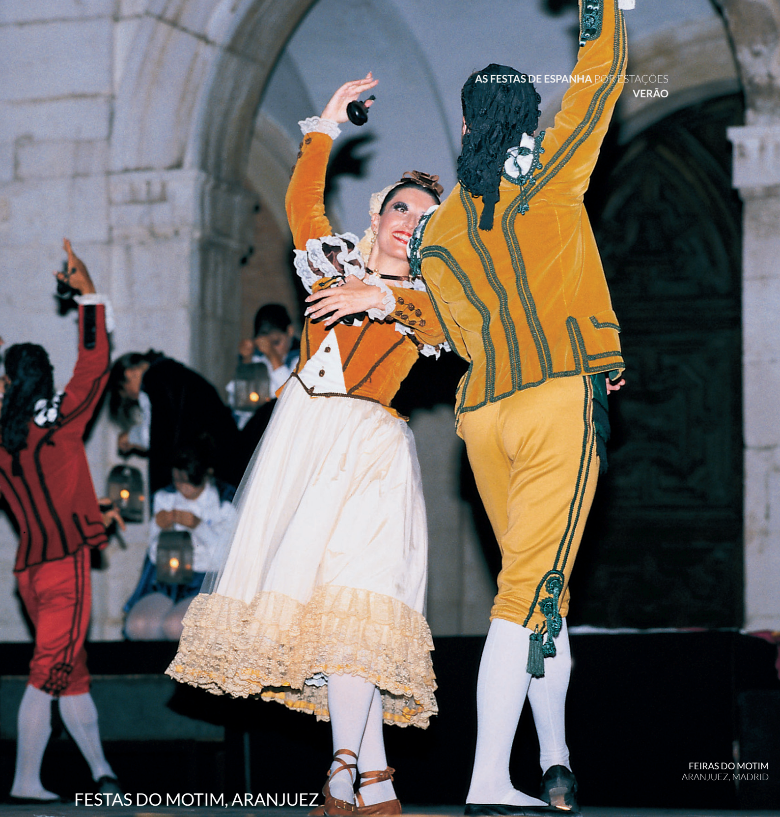
FEIRAS DO MOTIM ARANJUEZ, MADRID