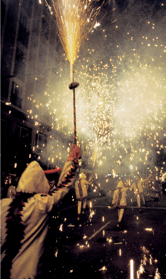
▲ ENTERRO DA SARDINHA MÚRCIA