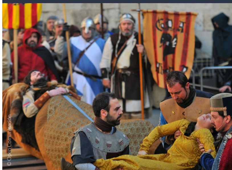
▲ FESTA DELLE NOZZE DI ISABEL DE SEGURA TERUEL

📍 Dove: Alcoy (Alicante, Comunità Valenciana) e Santillana del Mar (Cantabria) Quando: 5 gennaio www.alcoyturismo.com www.turismodecantabria.com