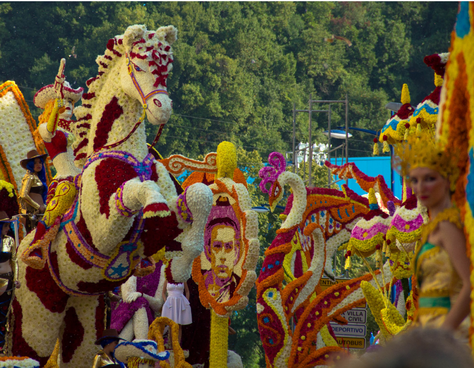
▲ BATTAGLIA DEI FIORI LAREDO