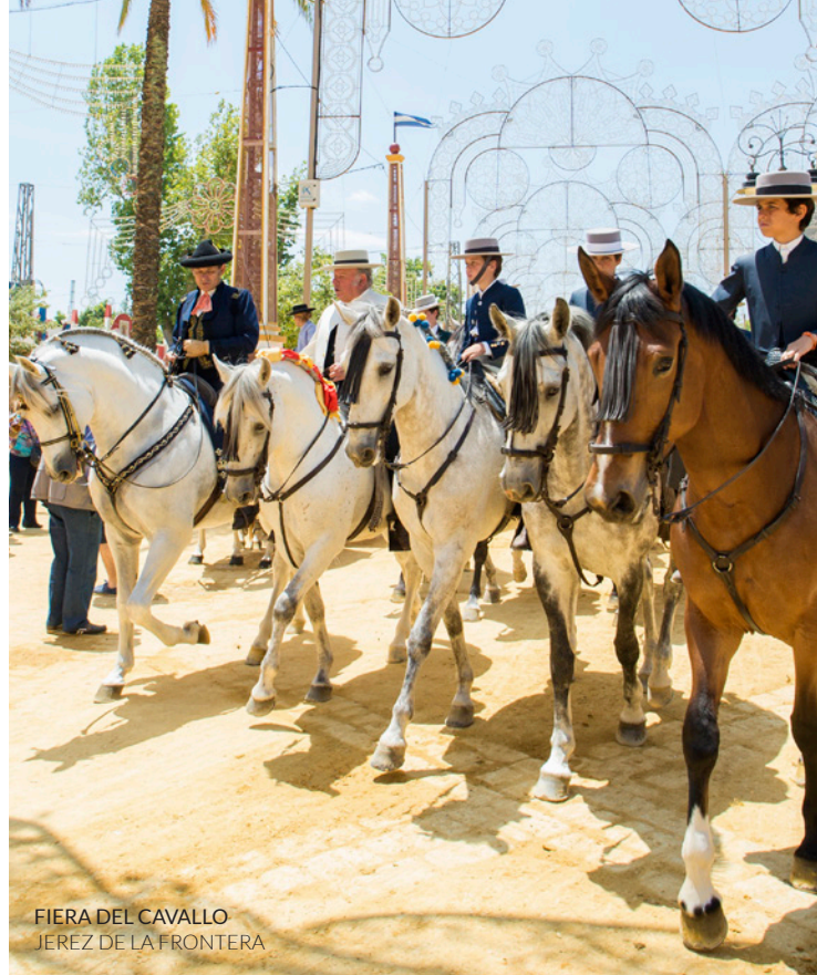
FIERA DEL CAVALLO JEREZ DE LA FRONTERA