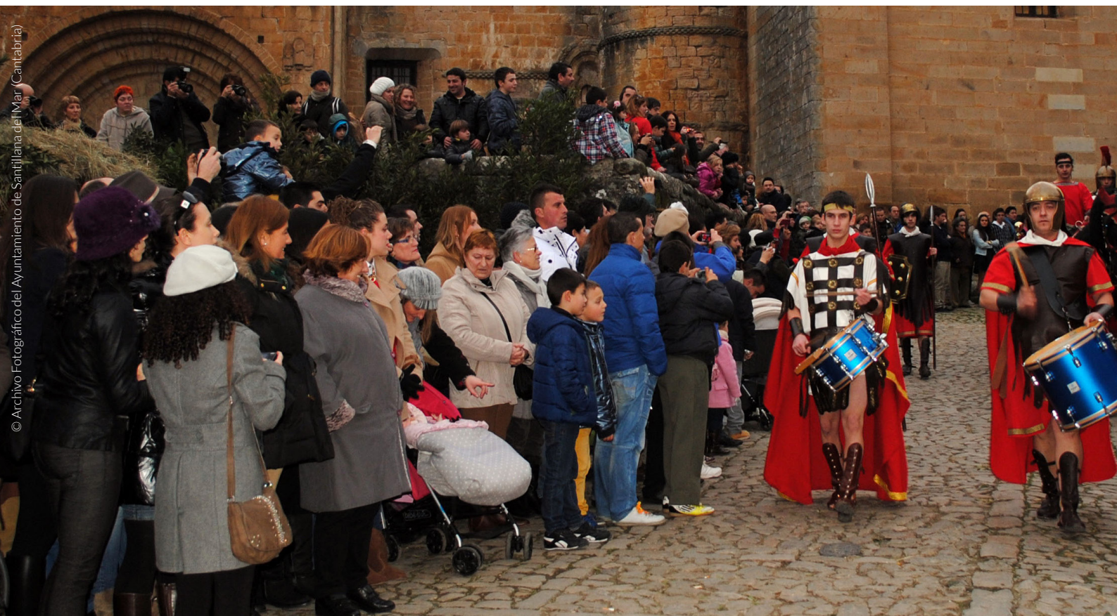
▲ RAPPRESENTAZIONE SACRA E SFILATA DEI RE MAGI SANTILLANA DEL MAR