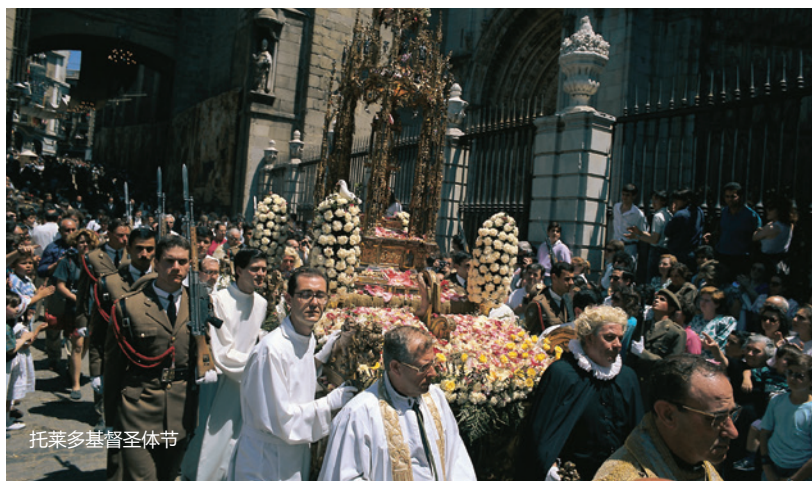
托莱多基督圣体节