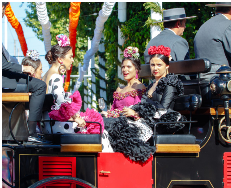
▲ 塞维利亚四月节 塞维利亚

① 地点：塞维利亚（安达卢西亚） 时间：4月 www.visitasevilla.es