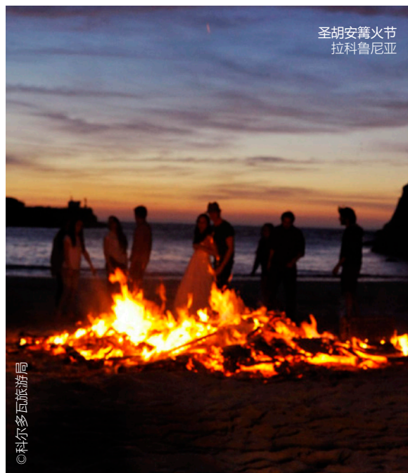
圣胡安篝火节 拉科鲁尼亚

拜访阿利坎特，体验其最盛大的节庆。篝火节之夜，人们在火光，沿海的沙滩以及无尽的地中海波光中迎接夏季的到来。节日大型雕塑尼诺特会让你惊叹不已。这些雕塑绝对是具有讽刺意味的真正转瞬即逝的艺术作品，因为在篝火节奇幻的仪式中尼诺特将被点火烧毁。整周，这座城市都洋溢着音乐之声，并举行丰富多彩的儿童及成人活动。23到24日，烟火成为城市的主角，可以观赏马斯克雷达斯（烟火表演）及克雷马斯（焚烧尼诺特的仪式）。