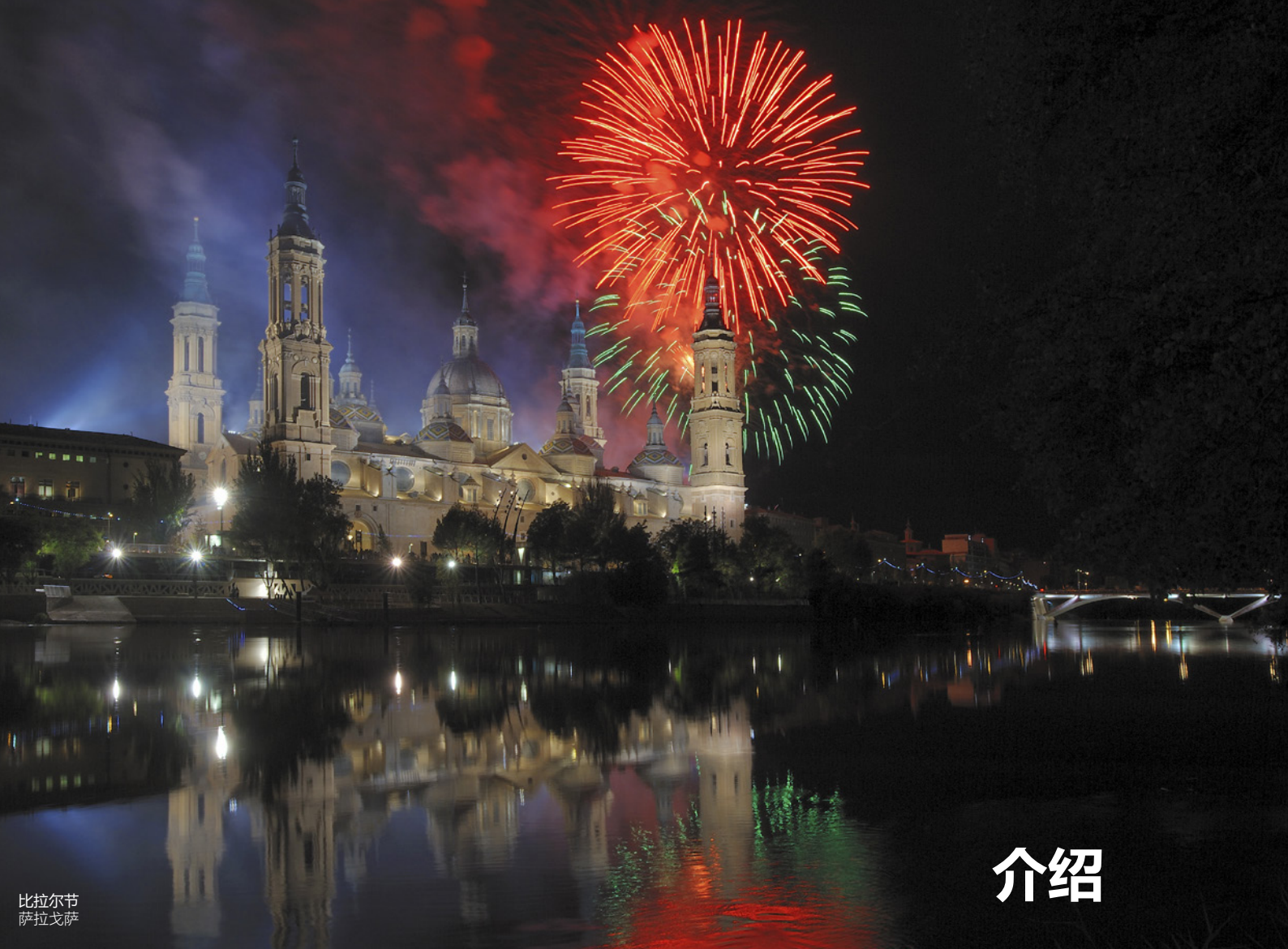
比拉尔节 萨拉戈萨