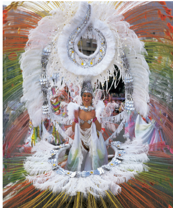
▲ 狂欢节 圣克鲁斯-德-特内里费

如果说特内里费岛圣克鲁斯的狂欢节有什么特色的话，那就要数其别开生面的氛围。当地人在一年之中潜心准备这个该城最盛大的节日之一，他们设计着彩车以及奇幻的服饰。而狂欢节皇后的选举更是吸引了全球的目光。届时选手会身穿绚丽的服装走秀，有的服装可能重达200千克。