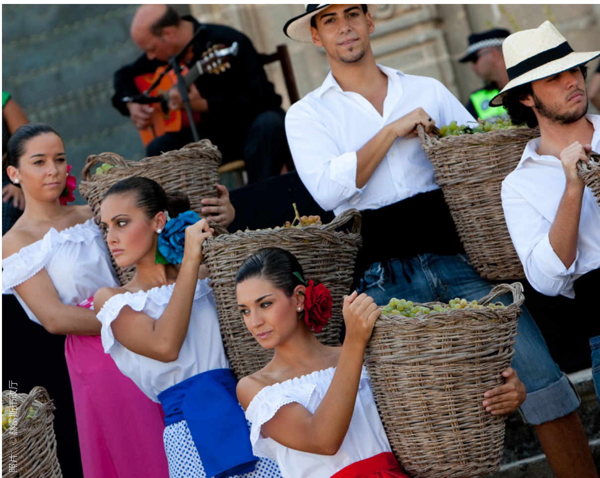
▼ 葡萄采摘节 赫雷斯德拉弗龙特拉

① 地点：赫雷斯德拉弗龙特拉（加的斯，安达卢西亚）和洛格罗尼奥（拉里奥哈）， 时间：9月