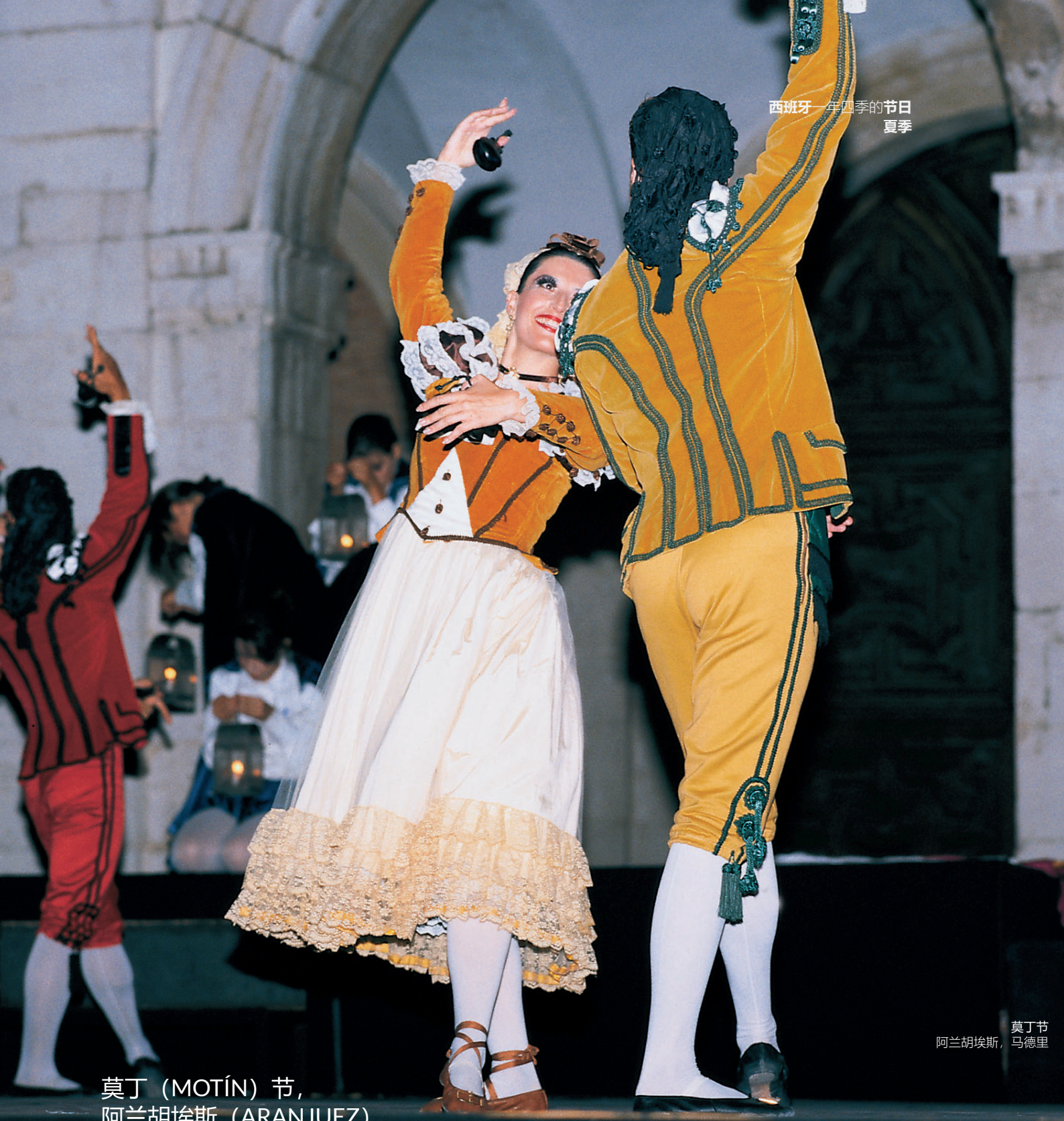
莫丁节 阿兰胡埃斯, 马德里