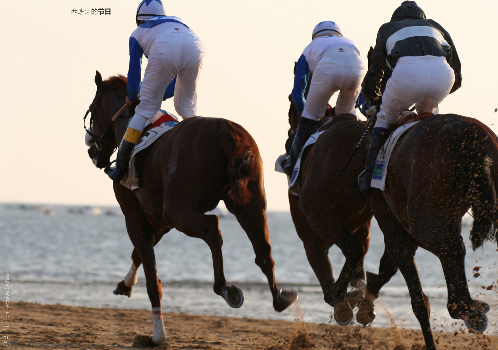
▲ 赛马 圣鲁卡-德巴拉梅达