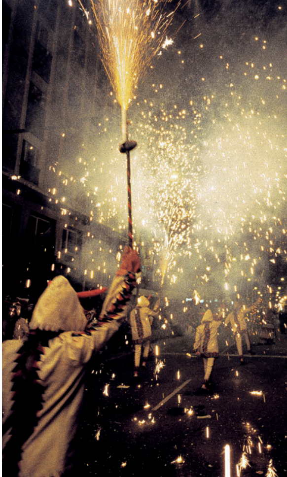
▲ 埋葬沙丁鱼游行 穆尔西亚