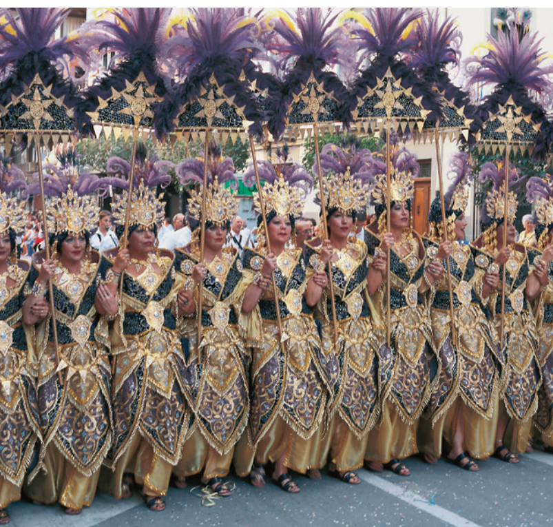
▲ 摩尔人和基督教徒节 比列纳, 阿利坎特