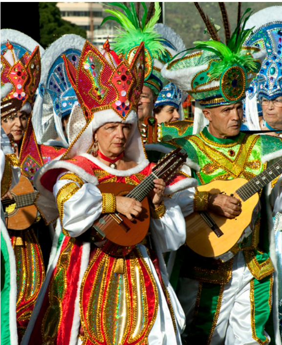
▲ 狂欢节 特内里费岛圣克鲁斯