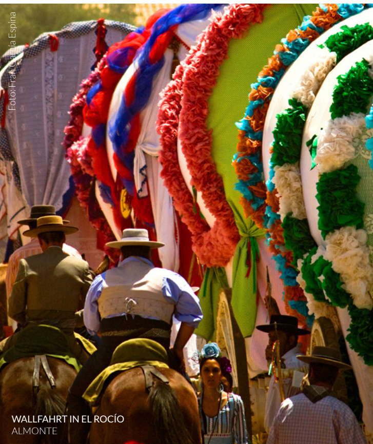
WALLFAHRT IN EL ROCÍO ALMONTE

📍 Wo: Almonte (Huelva, Andalusien) Wann: Im Mai www.andalucia.org