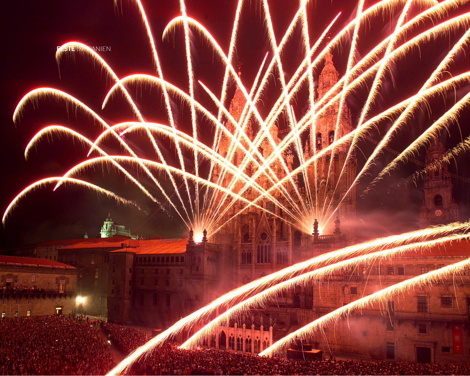
▲ FEST ZU EHREN DES SCHUTZHEILIGEN SANTIAGO APÓSTOL SANTIAGO DE COMPOSTELA