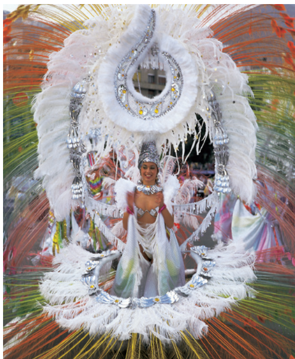
▲ KARNEVAL SANTA CRUZ DE TENERIFE

Das Auffälligste am Karneval von Santa Cruz de Tenerife ist seine spektakulärer Charakter. Die Bewohner von Teneriffa arbeiten das ganze Jahr über an den Vorbereitungen für ihr wichtigstes Fest, für das sie Festwagen und Fantasiekostüme entwerfen. Die Wahl der Karnevalskönigin findet internationale Aufmerksamkeit. Dabei defilieren die Kandidatinnen mit grandiosen Gewändern, die bis zu 200 Kilogramm schwer sein können.