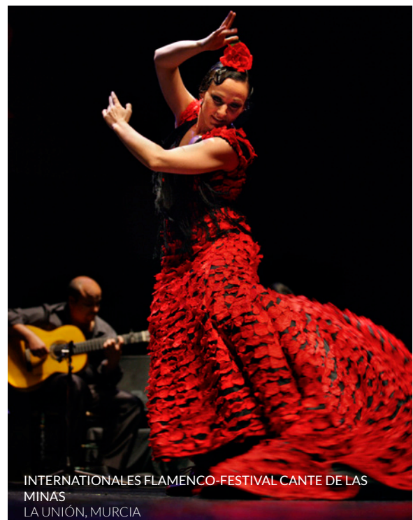
INTERNACIONALES FLAMENCO-FESTIVAL CANTE DE LAS MINAS LA UNIÓN, MURCIA