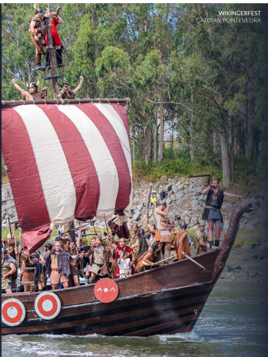
WIKINGERFEST CATOIRA, PONTEVEDRA

📍 Wo: Catoira (Pontevedra, Galicien) Wann: erster Sonntag im August www.catoira.es