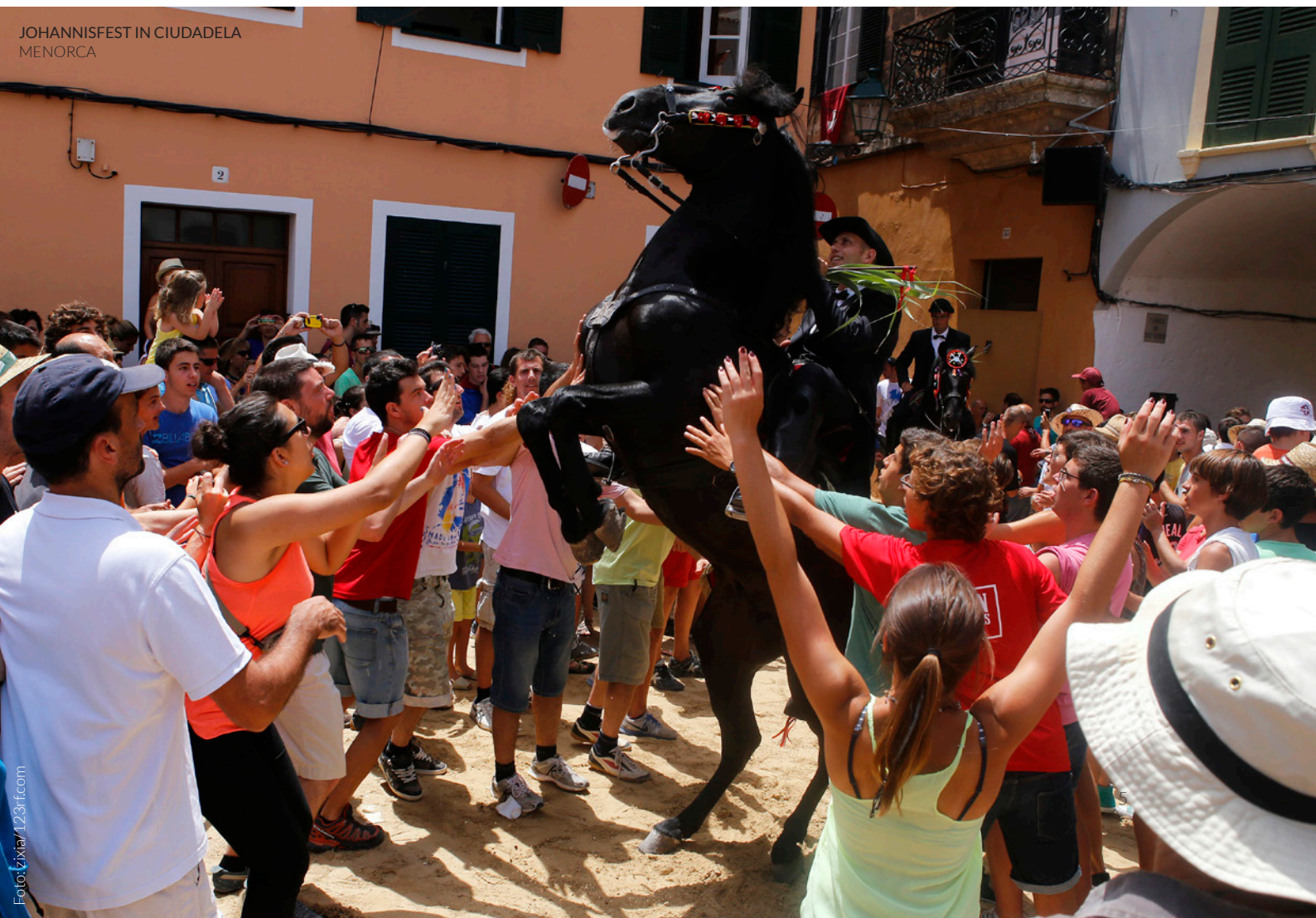
JOHANNISFEST IN CIUDADELA MENORCA

① Wo: Ciudadela (Menorca, Balearen) Wann: Woche vom 23. Juni www.ajciudadella.org