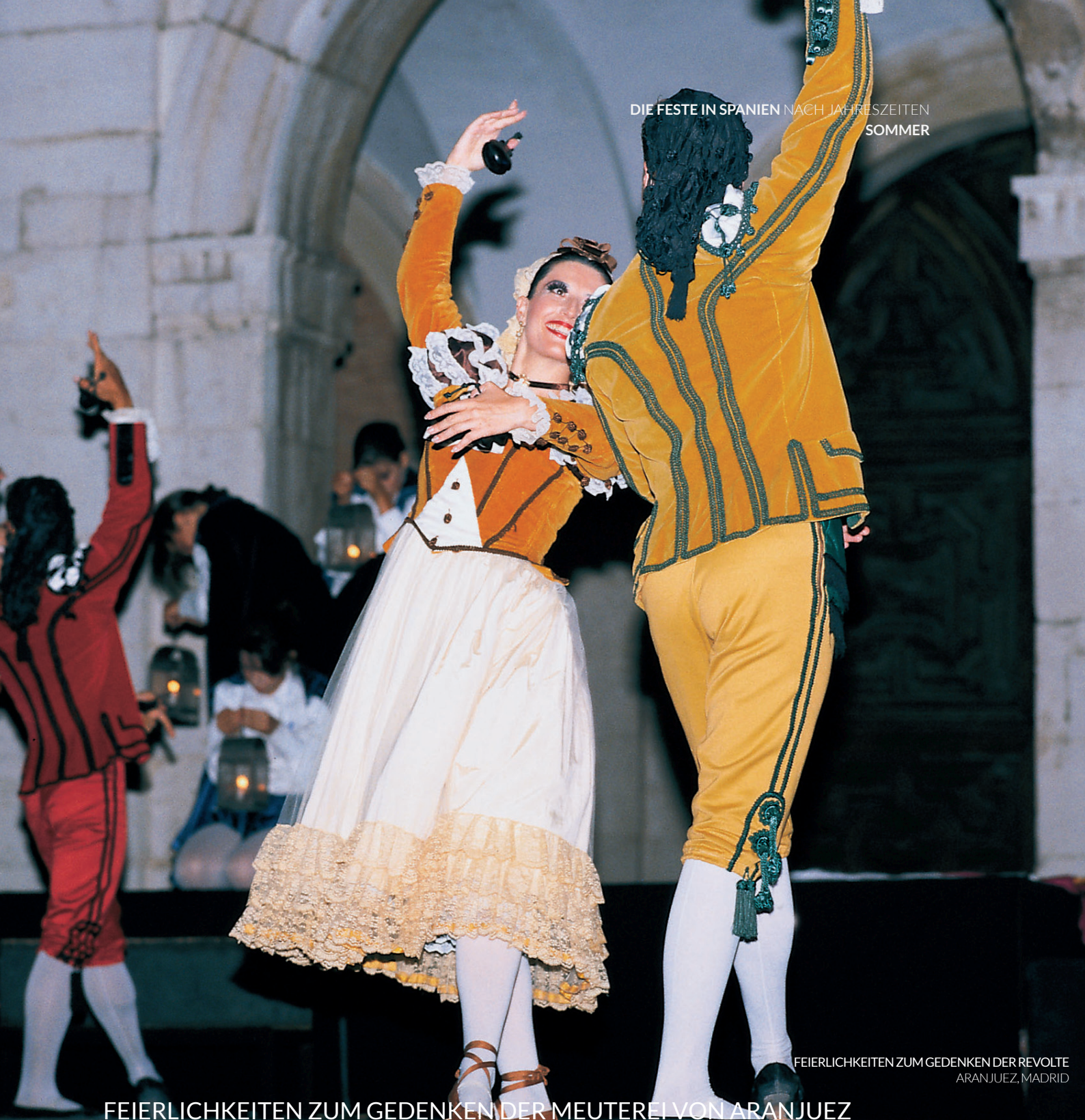
FEIERLICHKEITEN ZUM GEDENKEN DER REVOLTE ARANJUEZ, MADRID