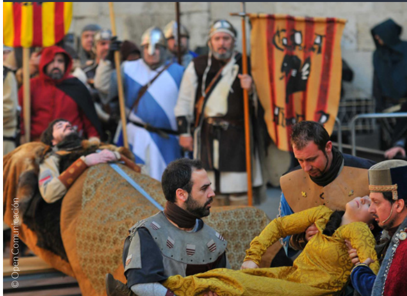
▲ HOCHZEITSFEST VON ISABEL DE SEGURA TERUEL

📍 Wo: Alcoy (Alicante, Region Valenciana) und Santillana del Mar (Kantabrien) Wann: 5. Januar www.alcoyturismo.com www.turismodecantabria.com