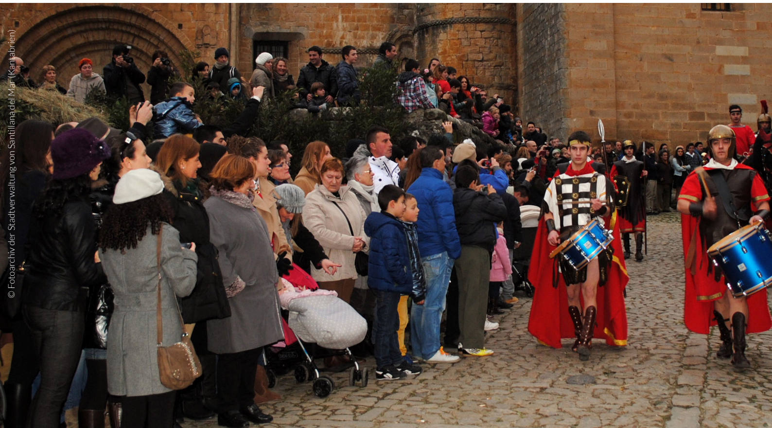
▲ EUCHARISTISCHES FESTSPIEL UND UMZUG DER HEILIGEN DREI KÖNIGE SANTILLANA DEL MAR