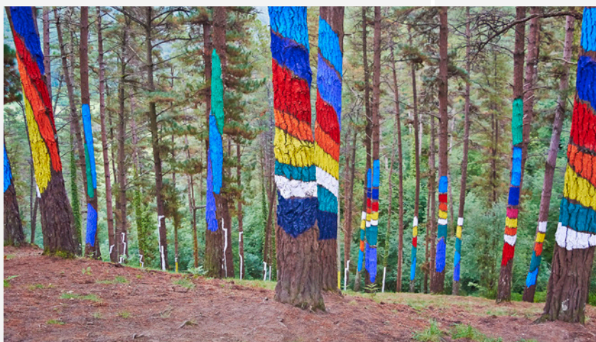
▲ РАСКРАШЕННЫЙ ЛЕС ОМА БИСКАЙЯ

Познакомьтесь с севером Испании, углубляясь в места с природой исключительной красоты на Пути святого Иакова. Заключительная и самая популярная часть Французского пути — это та, которая берёт начало в Сарриа, уже на территории Галисии . Разделённый на шесть или семь отрезков, этот маршрут является самым подходящим для семей с детьми от 10 лет. Для того, чтобы