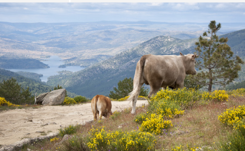
▲ ПРИРОДНЫЙ ЗАПОВЕДНИК ВАЛЬЕ-ДЕ-ИРУЭЛАС АВИЛА