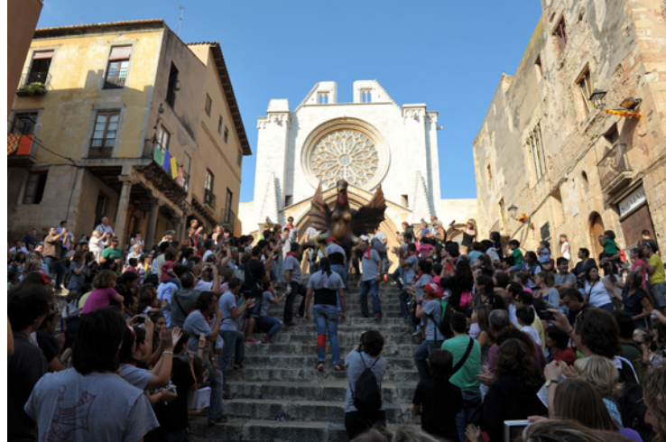
▲ КАФЕДРАЛЬНЫЙ СОБОР СВЯТОЙ ФЁКЛЫ ТАРРАГОНА