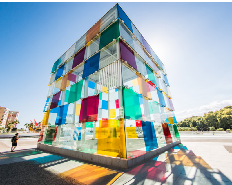
▲ ЦЕНТР ПОМПИДУ В МАЛАГЕ

«Биопарк» — зоопарк нового поколения — и Город искусств и наук являются обязательными для посещения местами. Для самых любознательных есть такие варианты, как музей Л'Ибер и его впечатляющая коллекция оловянных солдатиков, а также Музей естественных наук .