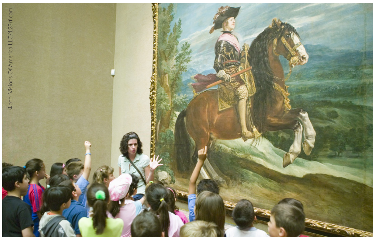
▲ МУЗЕЙ ПРАДО МАДРИД

Побывайте в каком-нибудь музее, пройдите вдоль крепостных стен замка и поучаствуйте в театрализованном маршруте в одном из городов-памятников Всемирного наследия человечества. Вы получите незабываемые впечатления. Настоящий мир ощущений ждёт в Испании как маленьких, так и взрослых путешественников, которые смогут в одинаковой степени развлечься и познать новое.