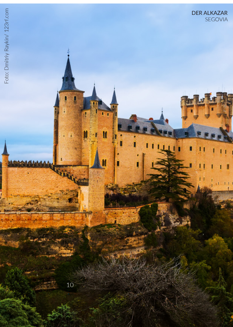
DER ALKAZAR SEGOVIA