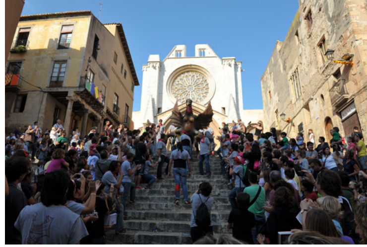
▲ KATHEDRALE SANTA TECLA TARRAGONA