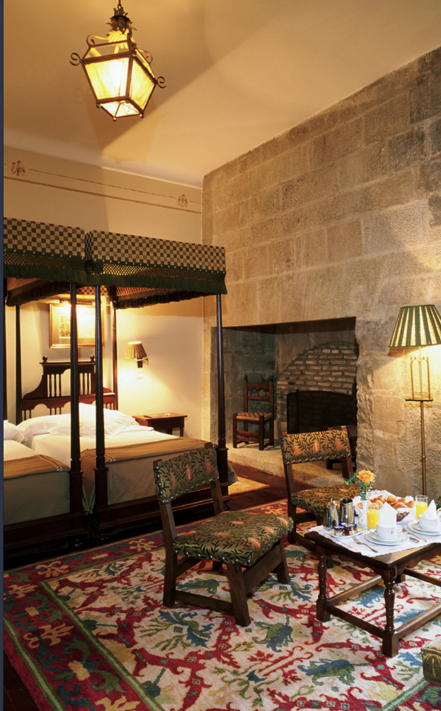
▲ PARADOR-HOTEL OLITE NAVARRA

Die ländlichen Unterkünfte sind eine gute Möglichkeit, die Natur mit der Familie zu genießen. Dabei handelt es sich um alte Gebäude (z. B. Bauernhäuser, Scheunen, Weiler oder Mühlen), die als Touristenunterkünfte mit allem Komfort hergerichtet wurden. Dort schlafen Sie umgeben von traumhaften Landschaften und genießen eine erstklassige Gastronomie. Viele von ihnen sind mit Spielplätzen ausgestattet und bieten eine große Auswahl an Outdoor-Aktivitäten für jedes Alter wie Wandern, Radfahren und Reiten. Sie sind in der Regel in kleinen Orten oder außerhalb des Stadtzentrums in größeren Städten zu finden.