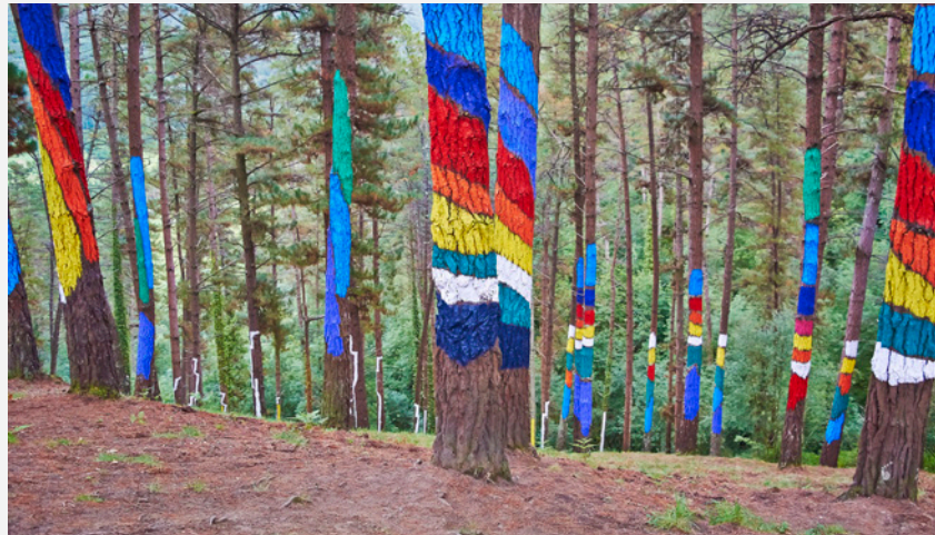
▲ ZAUBERWALD VON OMA VIZCAYA

Lernen Sie den Norden Spaniens kennen und entdecken Sie entlang des Jakobswegs Naturlandschaften von außergewöhnlicher Schönheit. Die Schlussetappe des Französischen Weges, der beliebtesten Route, beginnt in Sarria in Galicien . Die sechs bis sieben Tagestouren umfassende Strecke ist bestens geeignet für Familien mit Kindern ab 10 Jahren. Es empfiehlt sich, die