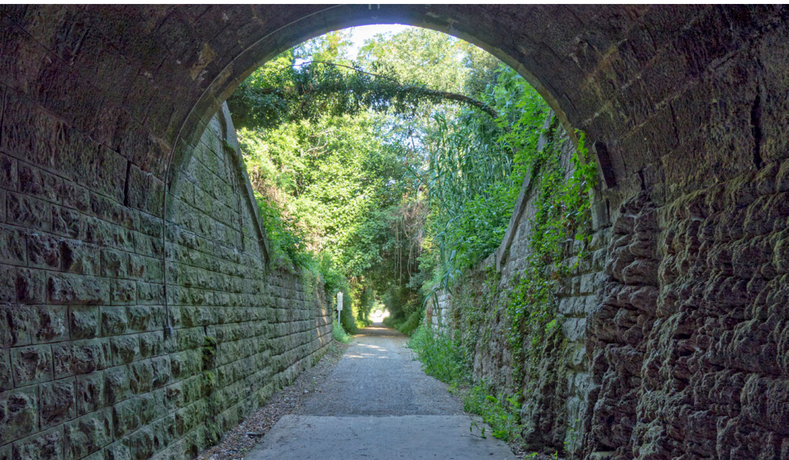
▲ VOIE VERTE DE OJOS NEGROS CASTELLÓN