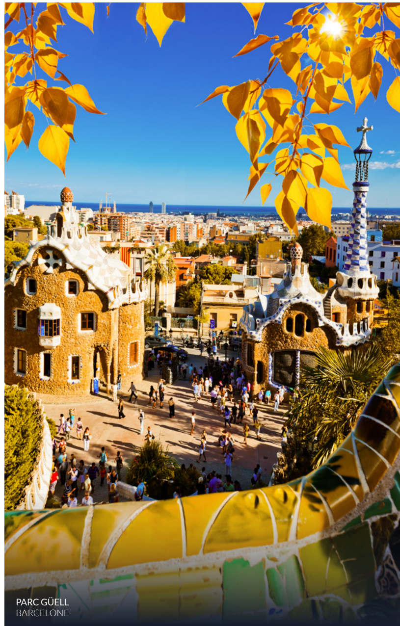
PARC GÜELL BARCELONE

Si vous souhaitez pédaler dans des espaces verts, parcourez le jardin du Turia , un grand parc naturel urbain qui