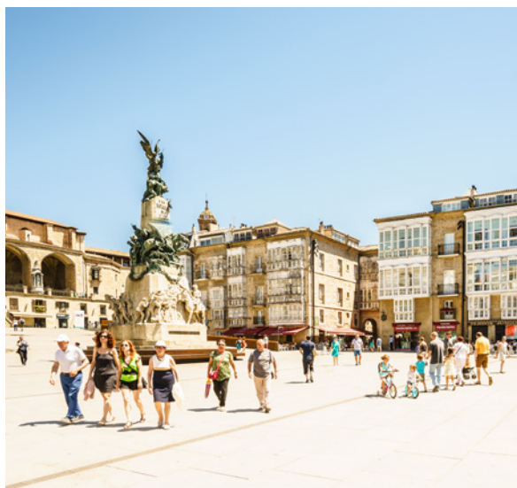
▲ PLACE DE LA VIRGEN BLANCA VITORIA