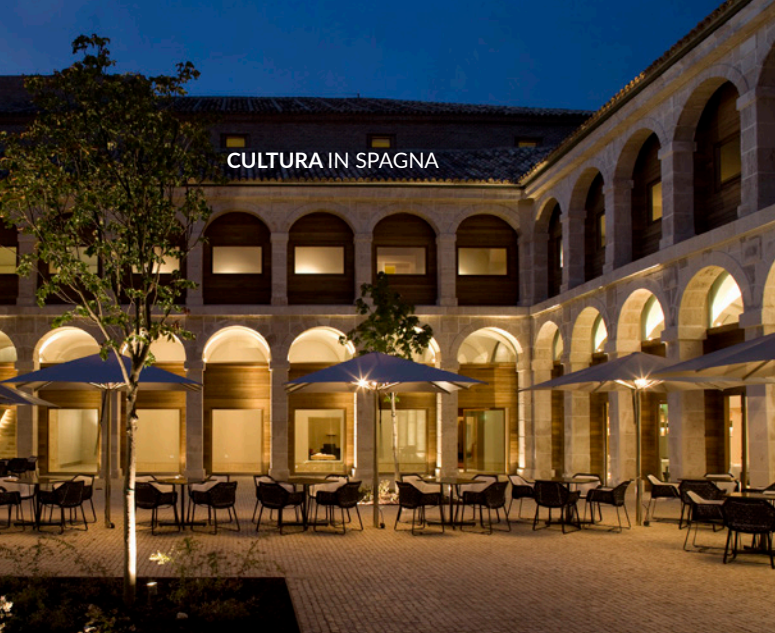
▲ PARADOR DI ALCALÁ DE HENARES MADRID