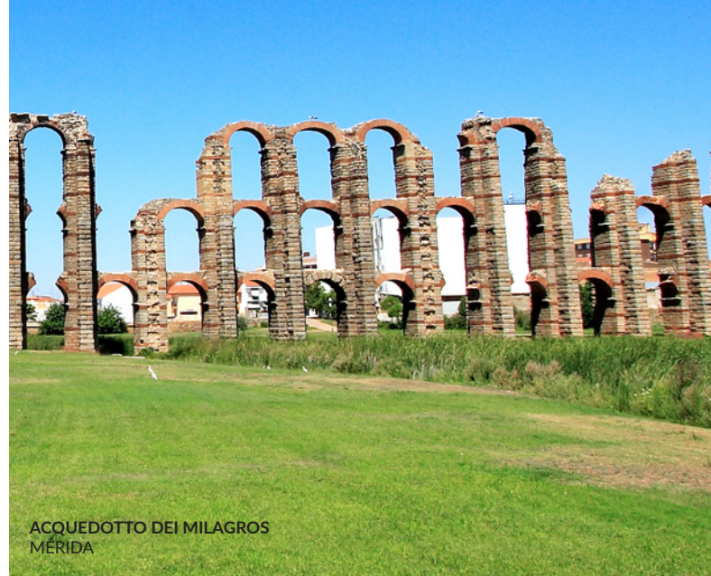
ACQUEDOTTO DEI MILAGROS MÉRIDA