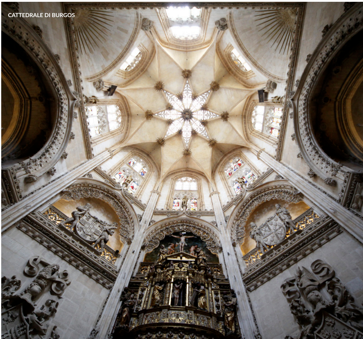
CATTEDRALE DI BURGOS

Visita il palazzo dell'Alfajería , gioiello di epoca araba nel pieno centro di Saragozza, o la cattedrale , l' Alcázar e l' Archivio delle Indie di Siviglia; scopri l' architettura mudéjar in Aragona o le mura romane di Lugo. Le possibilità sono infinite.