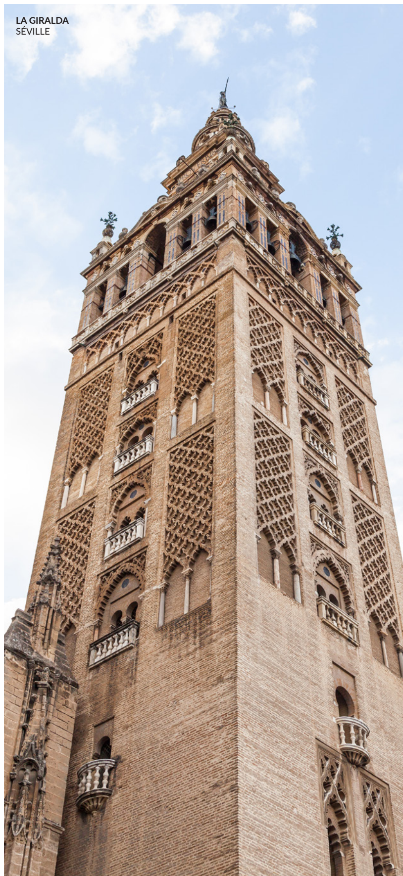
LA GIRALDA SÉVILLE

À proximité de Séville, nous vous recommandons également de visiter Carmona , Osuna et Écija . Mais Cordoue reste absolument incontournable : découvrez son centre historique pittoresque et son grand trésor, sa mosquée, qui compte parmi les plus beaux exemples d'art musulman. Cadix vous invite aussi à vivre son carnaval et à explorer sa merveilleuse vieille ville, un labyrinthe de ruelles et de petites places au sein de quartiers millénaires.