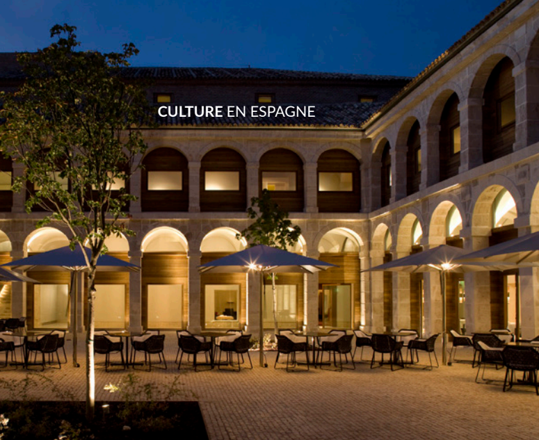
▲ PARADOR D'ALCALÁ DE HENARES MADRID