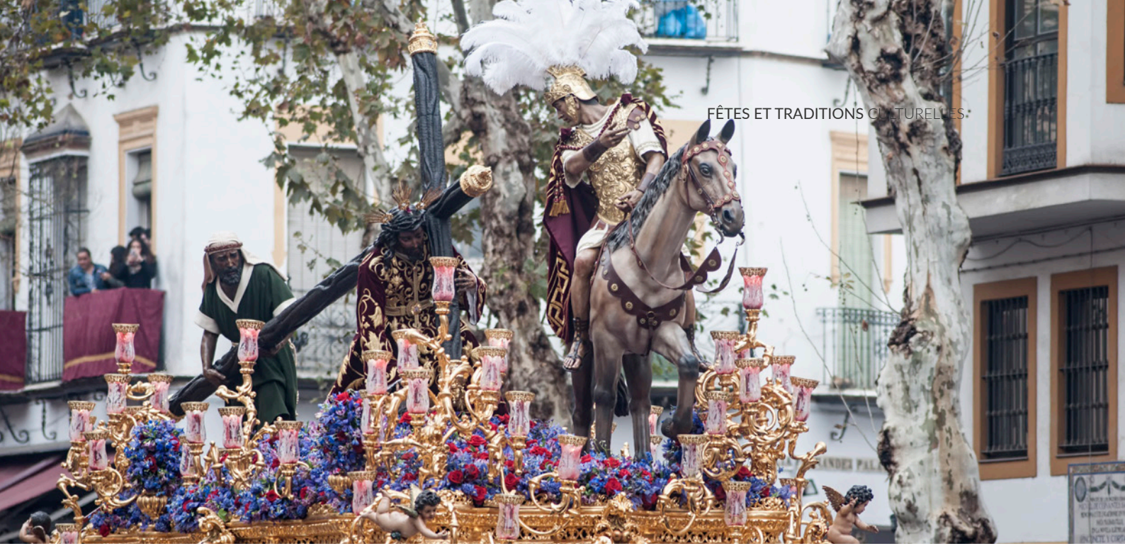
▲ SEMAINE SAINTE DE SÉVILLE