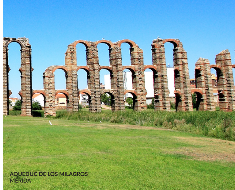
AQUÉDUC DE LOS MILAGROS MÉRIDA