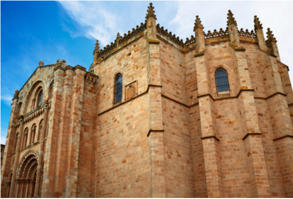
▲ CATHÉDRALE DE ZAMORA