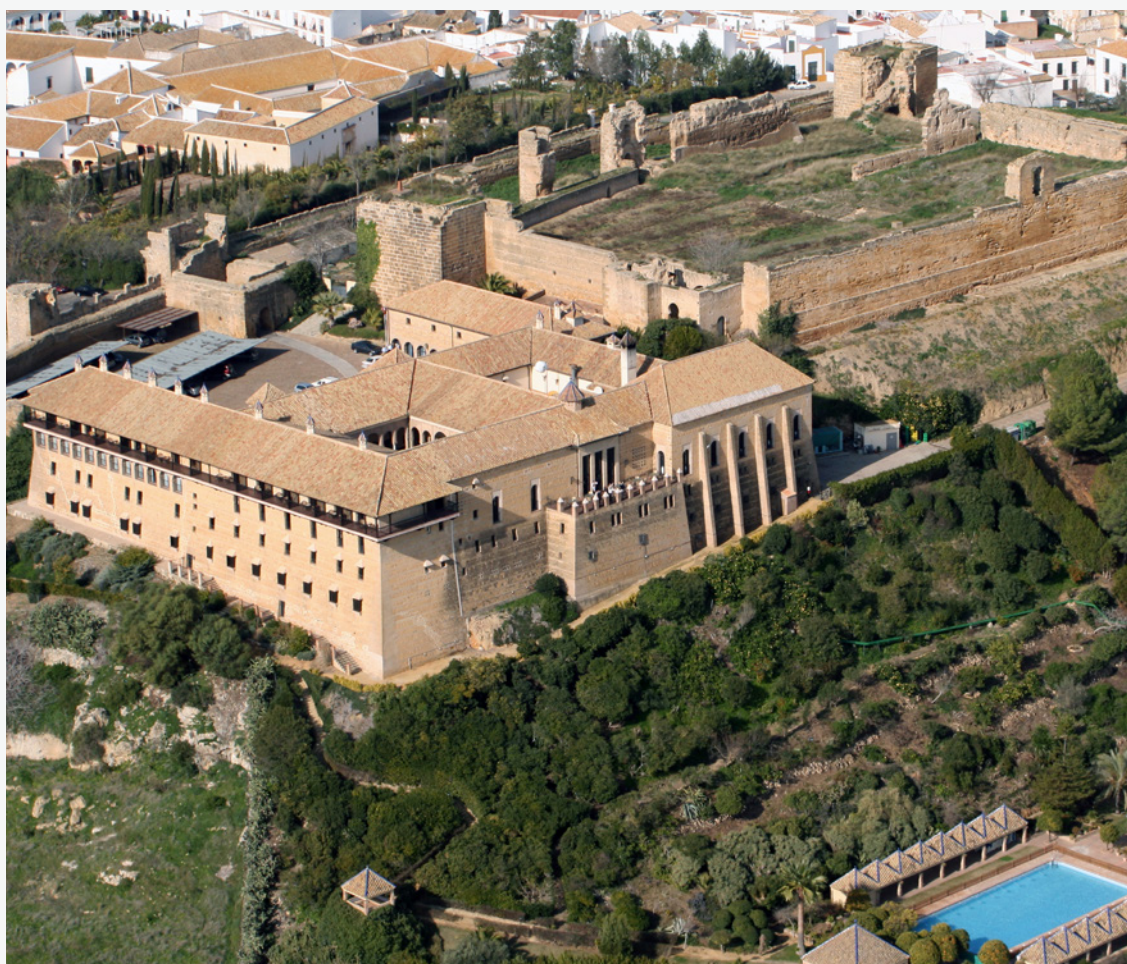
▲ PARADOR DE CARMONA SÉVILLE

À l'heure actuelle, il existe plus de 90 Paradores de Turismo en Espagne . Si vous aimez plonger dans l'histoire, alors n'hésitez pas. Choisissez le vôtre sur www.parador.es .