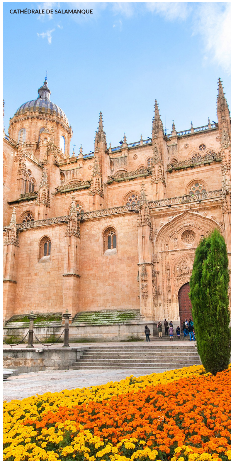
CATHÉDRALE DE SALAMANQUE

Remontez le temps à travers les rues de cette ville pittoresque des Canaries, sur l'île de Tenerife. Son tracé colonial caractéristique abrite une imposante cathédrale et de nombreuses demeures seigneuriales des XVII e et XVIII e siècles.