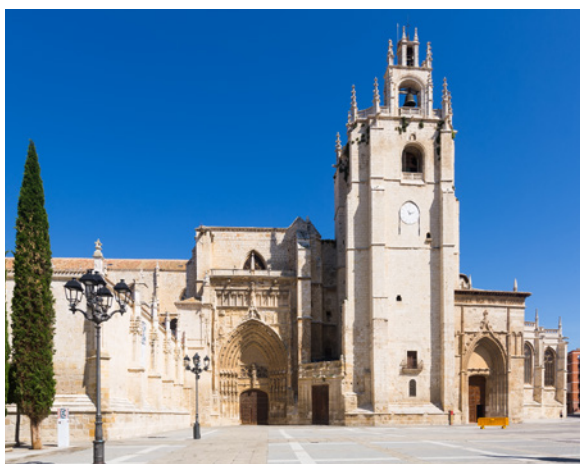
▲ CATHÉDRALE DE PALENCIA

L'Espagne recèle d'innombrables trésors et secrets. Voici 10 bijoux culturels qui n'attendent que vous.