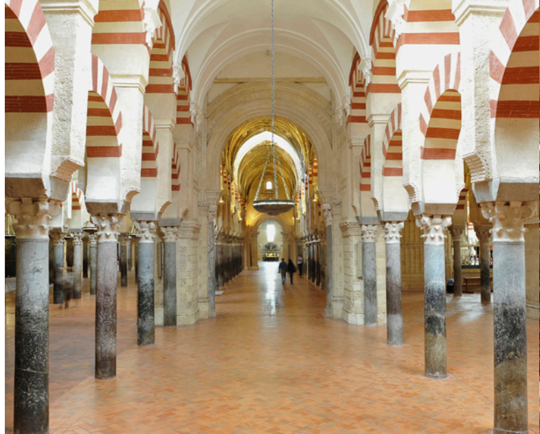
▲ INTÉRIEUR DE LA MOSQUÉE DE CORDOUE