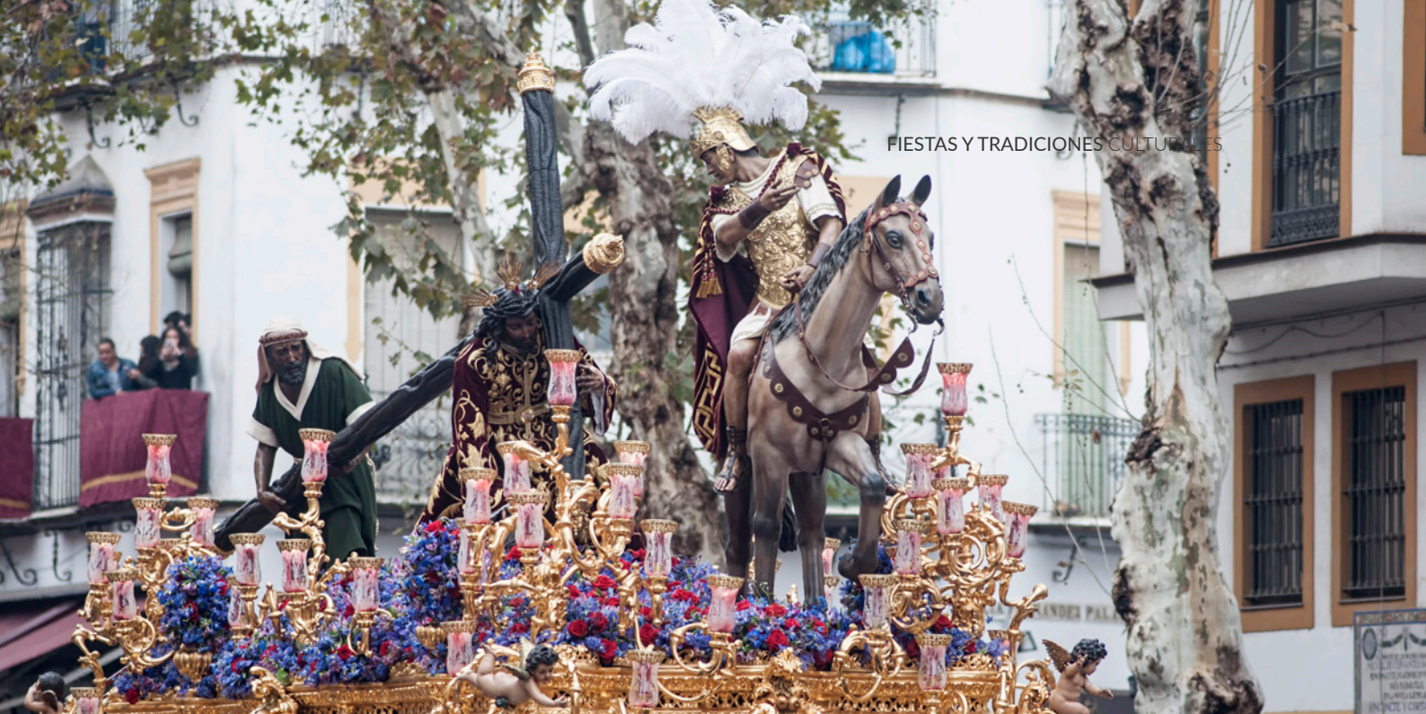
▲ SEMANA SANTA DE SEVILLA