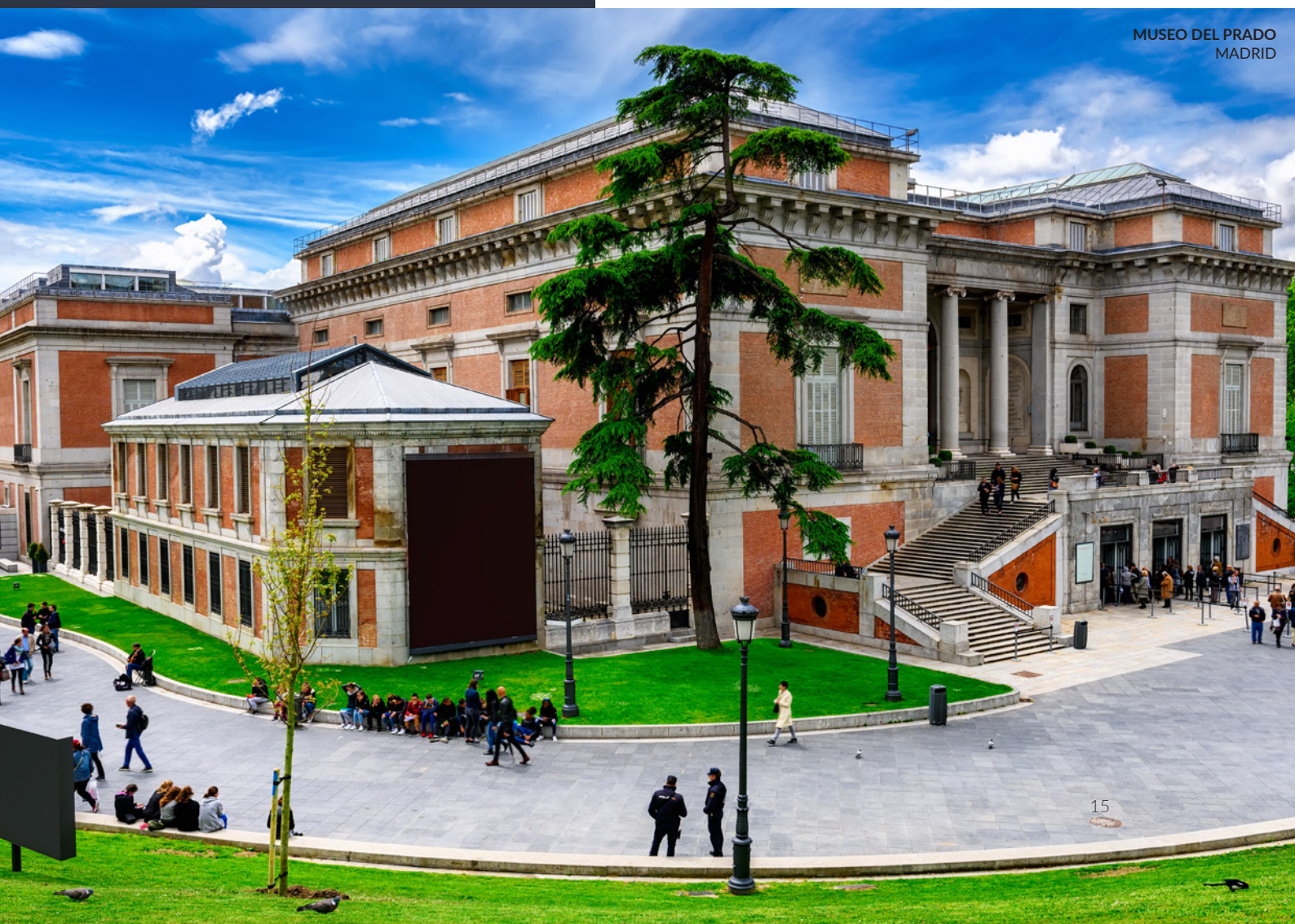
MUSEO DEL PRADO MADRID

Aquí podrás admirar tesoros como Las Meninas , de Diego Velázquez; El caballero de la mano en el pecho , de El Greco; o El Jardín de las Delicias de El Bosco.