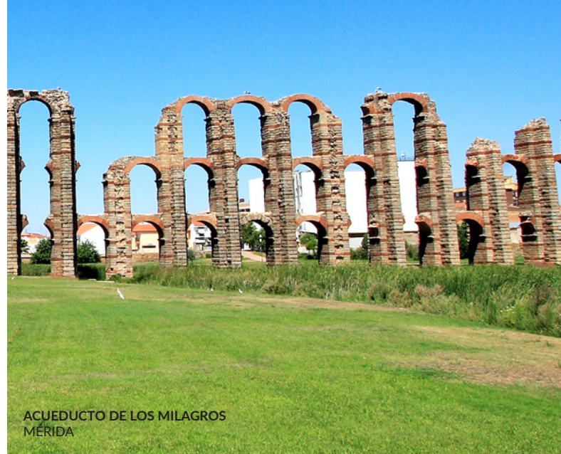
ACUEDUCTO DE LOS MILAGROS MÉRIDA