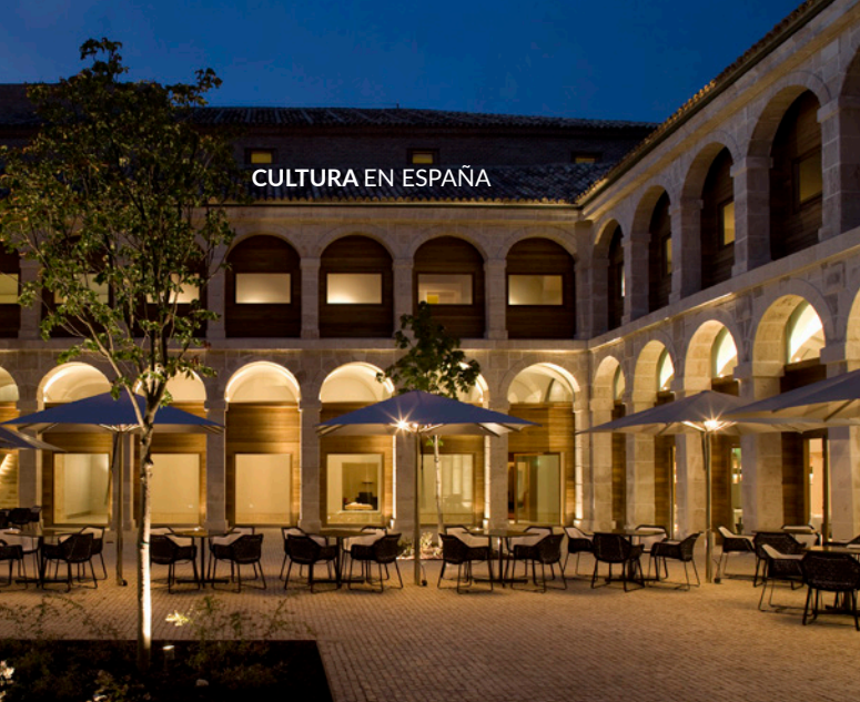
▲ PARADOR DE ALCALÁ DE HENARES MADRID